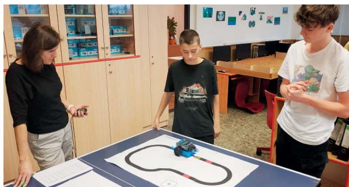
A roboti měli za úkol i projet co nejpřesněji vytyčenou trasu.