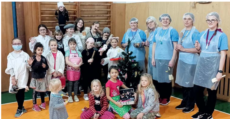
Profese na mnoho způsobů – téma letošního novoročního nocování v sokolovně.