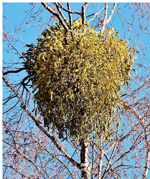
S ošetřením stromu poradí odborníci.

Nevíte-li si s tím rady, navštivte starostu. (sb)