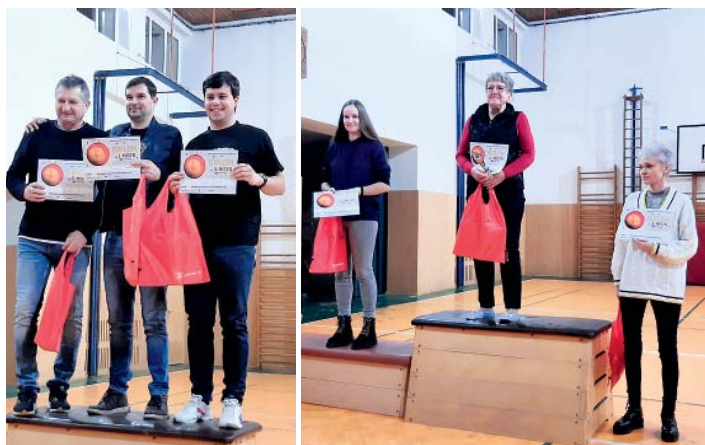
Vánoční salvy a jejich vítězky a vítězové.