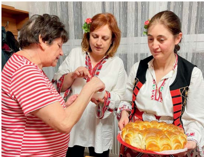
Došlo i na ochutnávku bulharských dobrot.