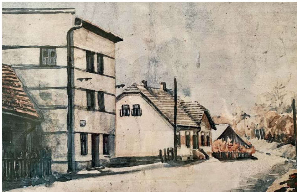
Malovaný výjev z roku 1946, autor: V. Polášek.

Manželé spolu začali žít právě v chalupě číslo 137 – v místech dnešního zchátralého mlýna. „Na tuto chalupu se zřejmě