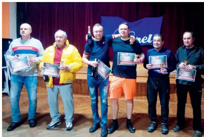
Tříkrálový turnaj: úspěšní jednotlivci i dvojice.