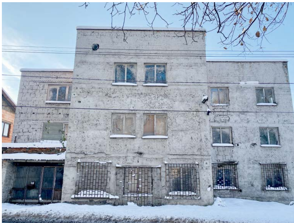
Dům dlouhodobě chátrá, majitel ho prodává i s pozemkem a projektem na přestavbu.

Majitelem nemovitosti je od roku 2010 brněnská akciová společnost Nové bydlení plus. „Je stoprocentní dceřinou společností fondu kvalifikovaných investorů