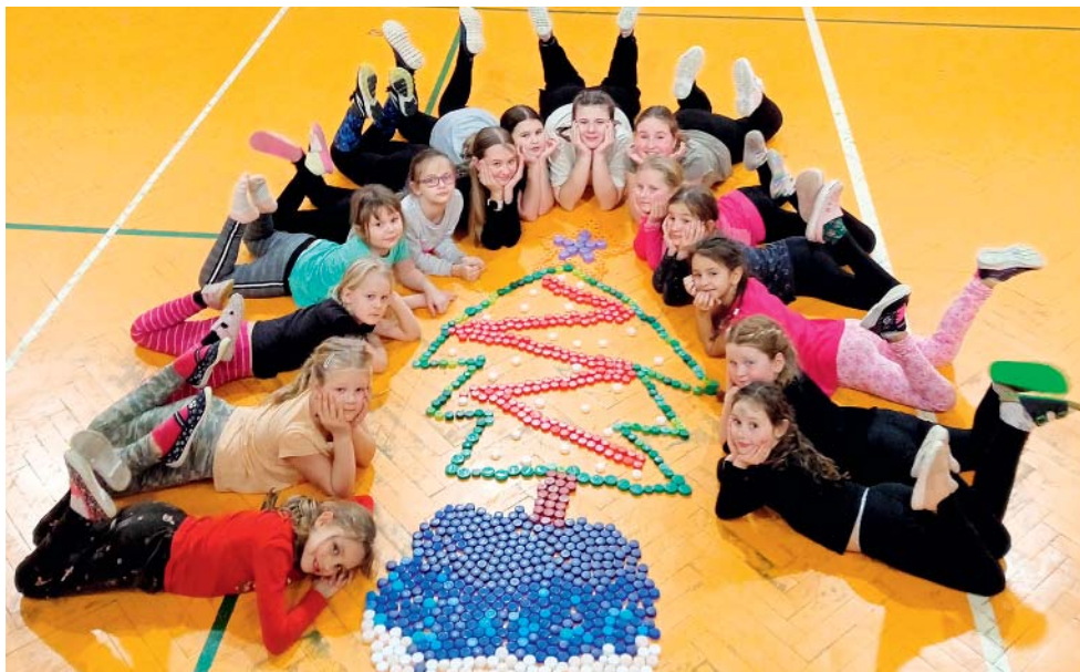
Z víček od plastových lahví seskládat obraz, to byl jeden z večerních úkolů.