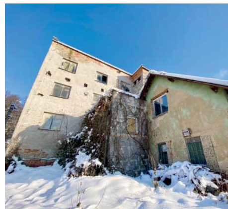
Pohled ze zahrady, svah postupně klesá až ke Starobělskému potoku.