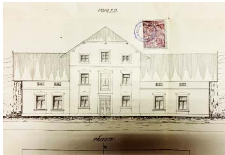
Projekty na přestavbu domu.