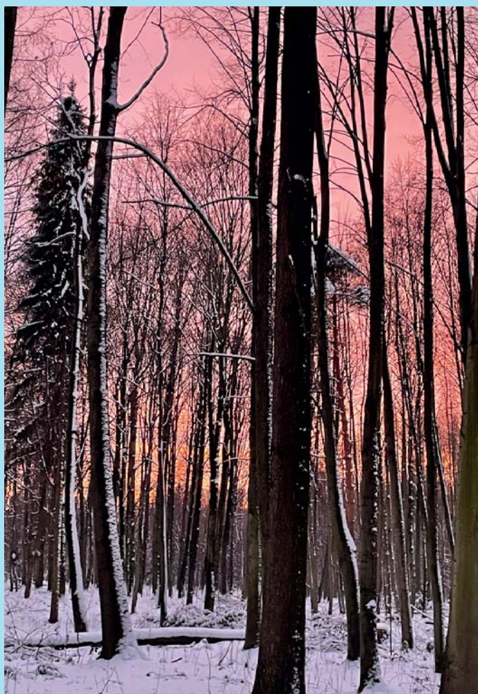
Západ slunce v Bělském lese.