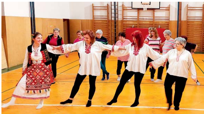
Lidové tance z Bulharska - v podání bulharských žen žijících v Česku. Část tanečních kroků naučily i starobělské sokolky.