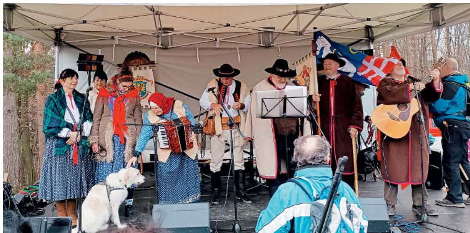
Zpívaly se lašské popěvky.