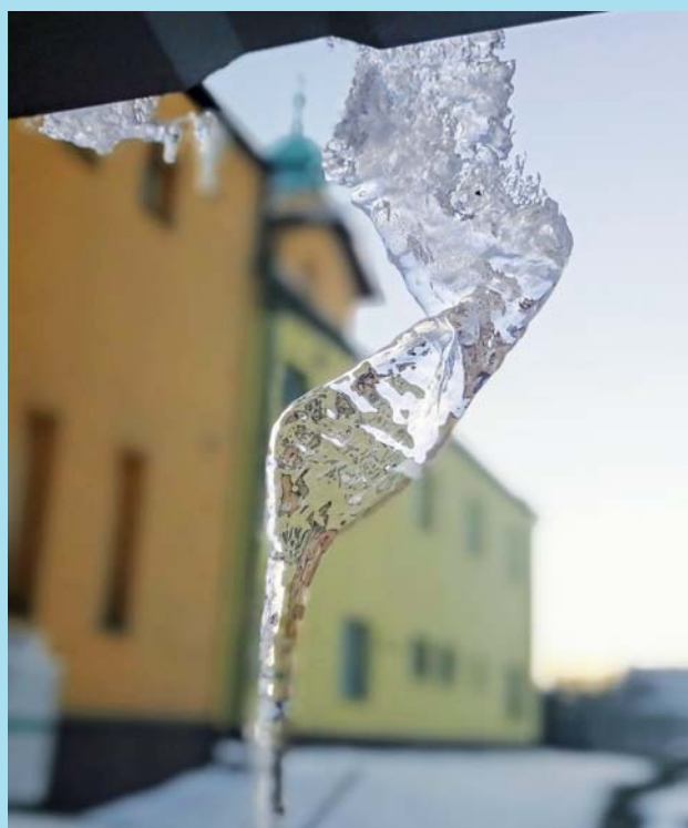
Mrznoucí краса.