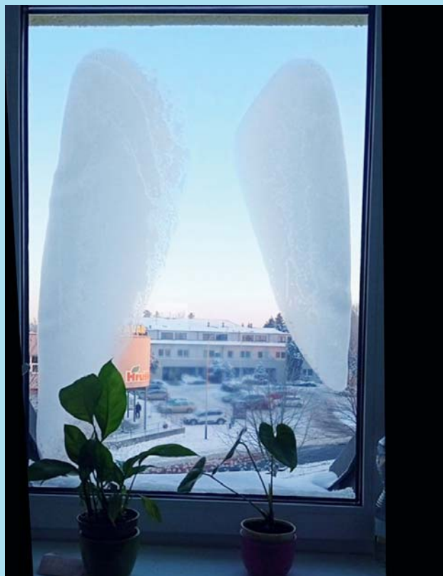
Andělská křídla.