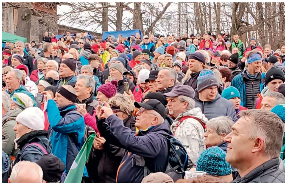
Silvestrovské setkání Lachů na Čupku v beskydských Metylovicích.