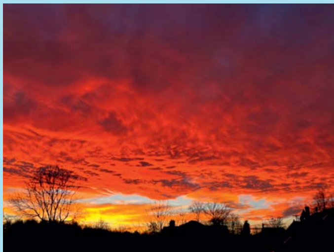
Slunce jde spát.