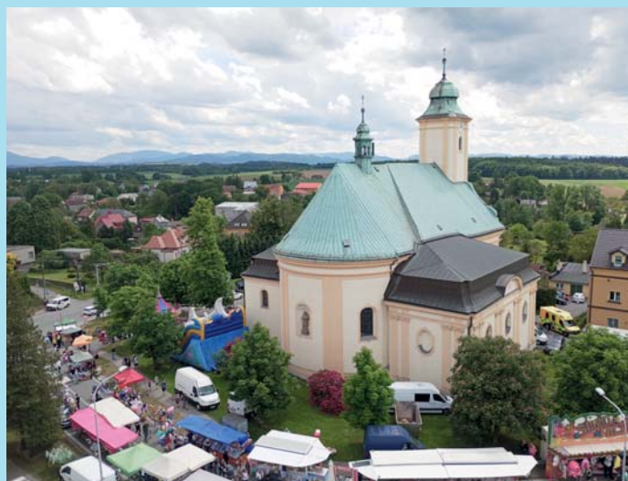
Z pouti.