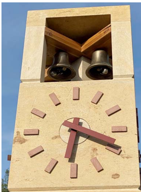
Malé zvony a hodiny doplnil taky znak Staré Bělé a letopočet.