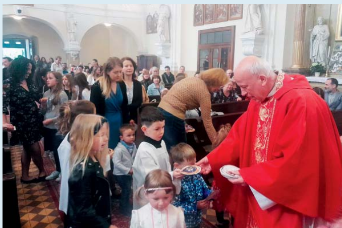
Za splněné úkoly – pouťový koláč jako odměna.