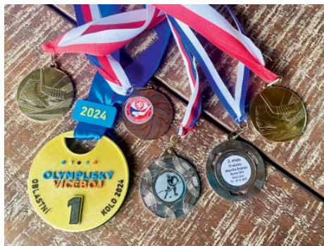
Aktuální sbírka sportovních úspěchů.

hokej. Tašku napadlo, že se tam zkusíme podívat. Bylo mi pět a půl,“ vzpomíná na své začátky.