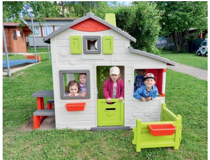
Z nového domku měly děti radost.