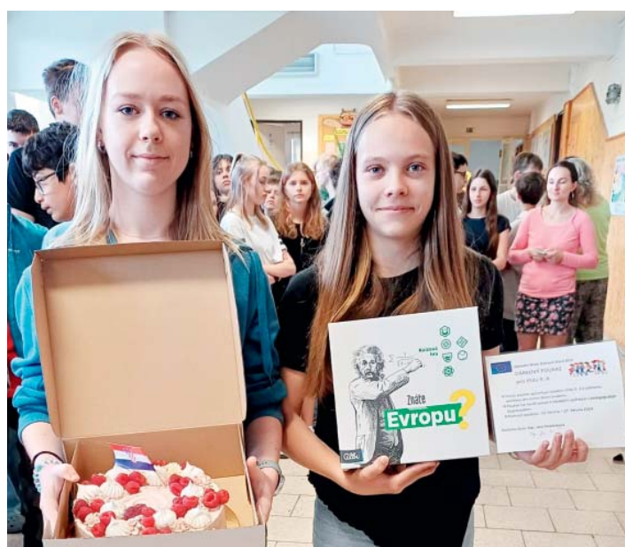
Žáci z 9.A se v projektu zaměřili na Chorvatsko a v soutěži se umístili druzí.