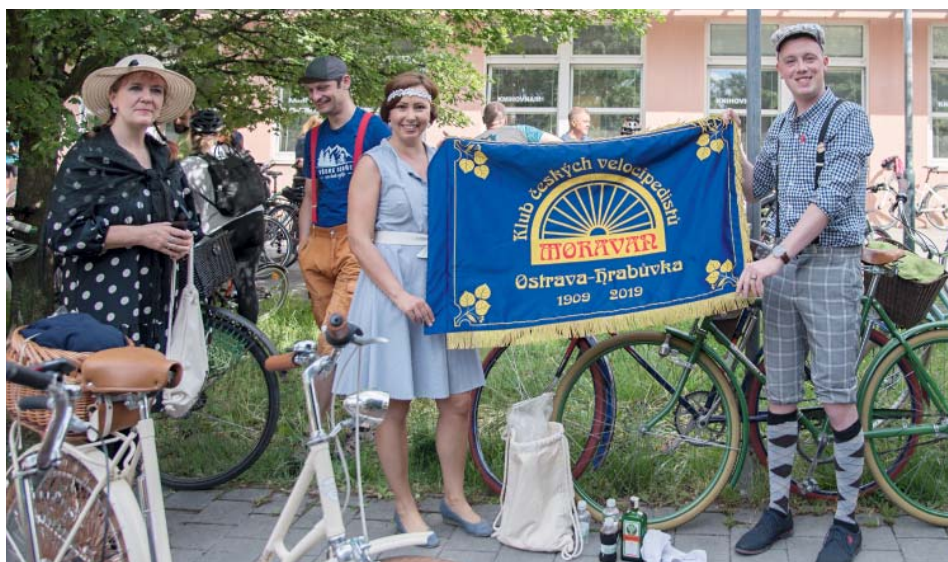
Klub českých velopedistů z Hrabůvky vyrazil na cestu stylově. Platilo to o bicyklech i oblečení.