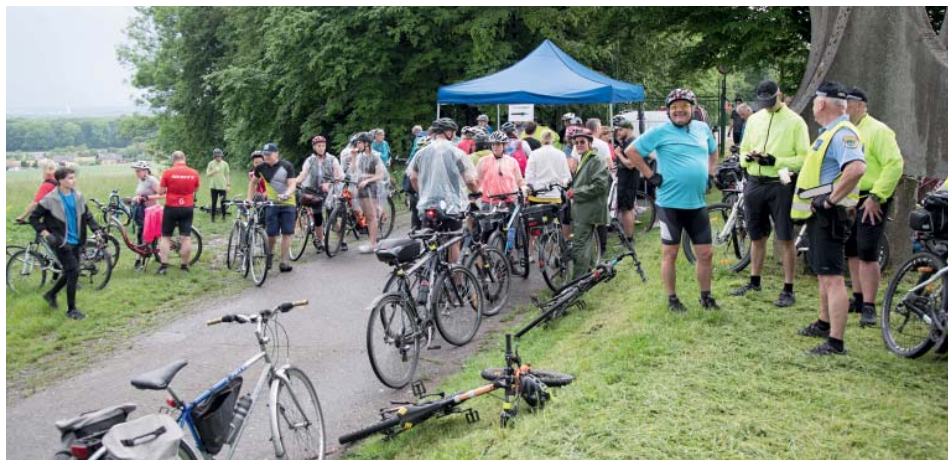
Krmelínský kopec. Jedna ze zastávek letošní trasy.