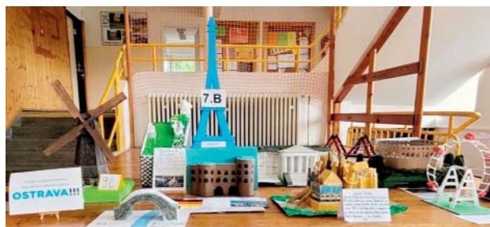
Stavby, které k unijním zemím patří. I to byla součást školního projektu.