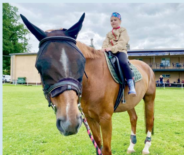
Deset stanovišť s koňskými disciplínami. A po nich za odměnu – svezení.