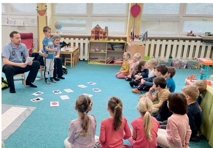
Děti z pobočky na dolním konci besedovaly se strážníky městské policie.

V březnu proběhla ve třídě Koťátka beseda Bezpečně pro předškoláky – s oddělením prevence Městské policie Ostrava. Vyslechli jsme edukační přednášku pro děti v oblasti dentální hygieny. Dětem se akce velice líbila. V Domě zahrádkářů jsme navštívili velikonoční výstavku. Odpoledne jsme v rámci velikonočních dílen v mateřské škole společně s rodiči vytvořili krásné dekorace a kraslice. S budoucími školáky jsme navštívili 1. třídu základní školy, kde si děti mohly vyzkoušet sezení v lavicích a plnit jednoduché úkoly společně s prvňáčky.