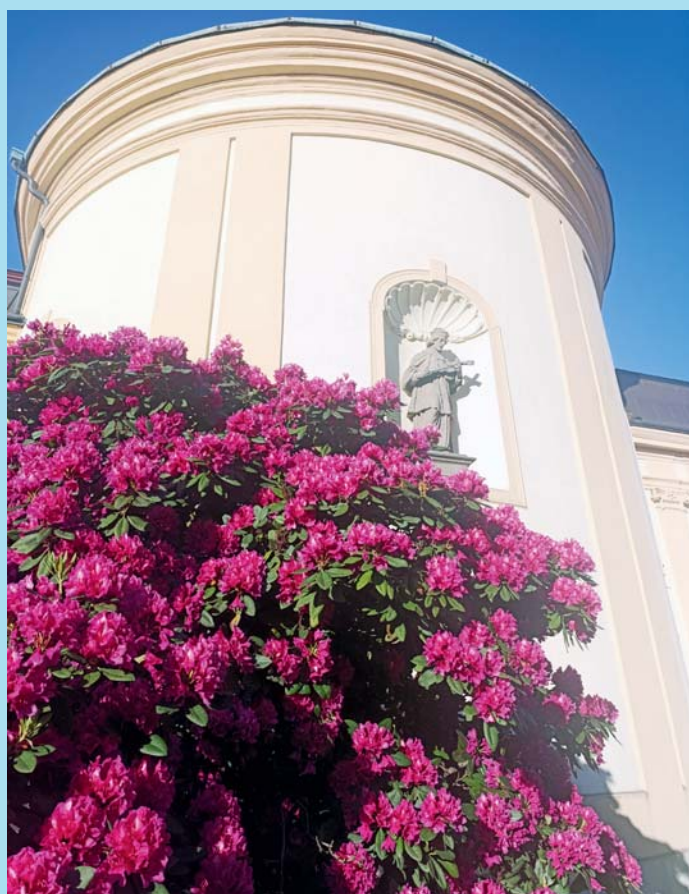
Rozkvetlá krása.