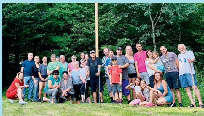
Kácení máje.