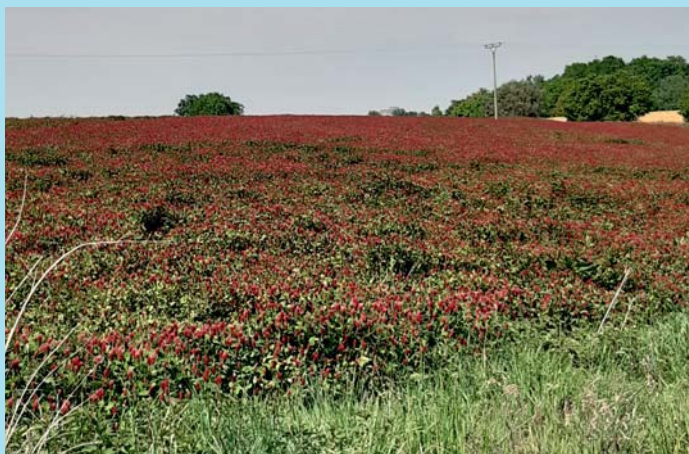
Jetelové pole.