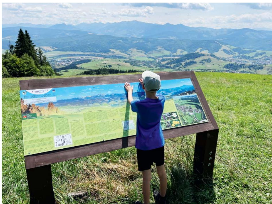
Výhled ze slovenského Javorového vrchu. S tátou před rokem o prázdninách prošli 32 vrcholů Beskyd.