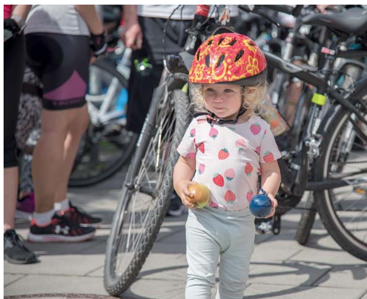
Pořadatelé rozdali na startu pláštěnky. A přišly vhod velkým i malým cyklistům.