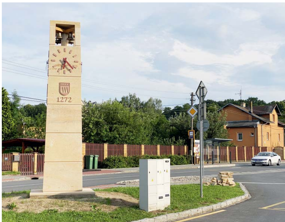
Váha osm tun, výška čtyři metry. To jsou parametry nové zvoničky na dolním konci.