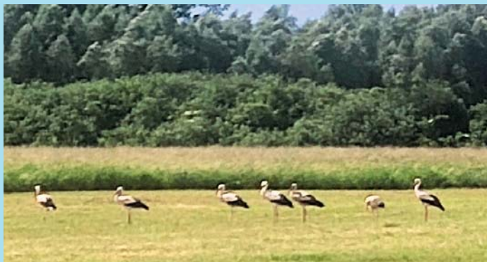
Čapí sněm na lukách.