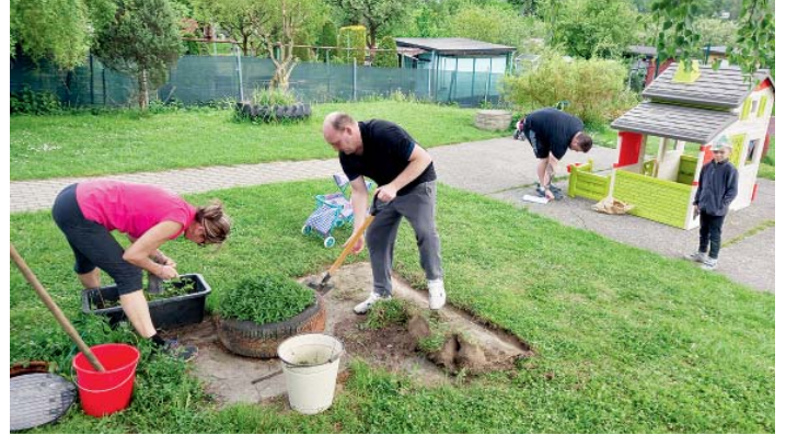
Brigáda rodičů na zahradě za pobočkou Blanická.