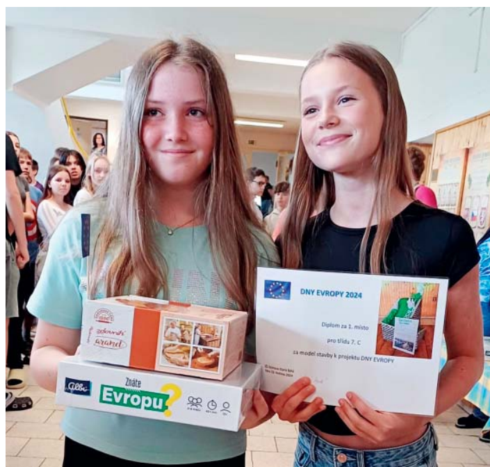
7.C informovala o Německu a zvítězila s modelem stavby, který k projektu připravila.