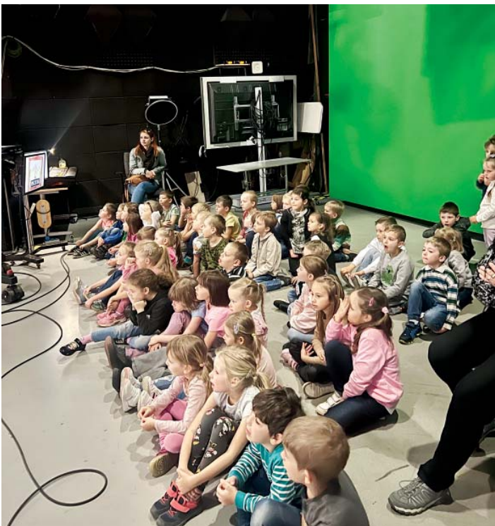
Předškoláci navštívili ostravské studio České televize.

V dubnu předškolní děti navštívily ostravské studio České televize, kde se seznámily s profesemi, díky kterým se mohou dívat v televizi na zajímavé pořady. V březnu předškoláci tradičně zašli do 1. třídy, kde se setkali s bývalými spolužáky a seznámili se s prostředím školy, do které nastoupí po prázdninách. Před Velikonocemi si přišli do školky rodiče s dětmi v rámci jarní dílny vytvořit velikonoční dekorace. Všechny děti zaujal program kurz první pomoci Sanitka. Vyzkoušely si, jak ošetřit drobná zranění, zavolat záchranu, a mohly prozkoumat sanitku i s jejím vybavením. Za to děkujeme manželům Adamcovým, kteří akci zafinancovali.