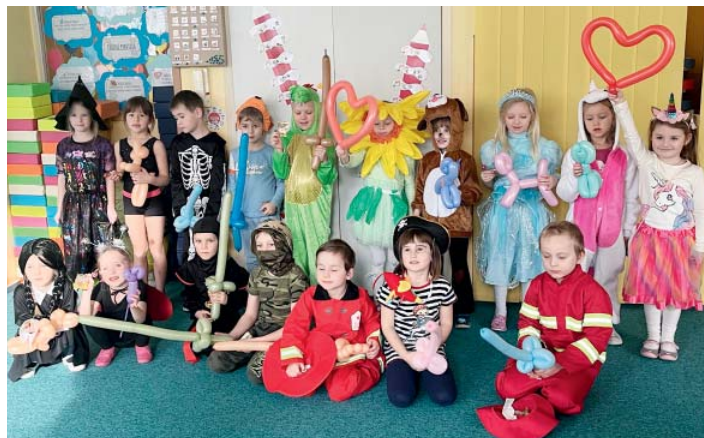
Přivítat nový rok? Nejlépe karnevalem.

V květnu nás opět navštívilo divadélko Duo Šamšula s velmi pěknou pohádkou O Koblížkovi. Pokračovali jsme s kurzem plavání. Ve třídě Broučci a Koťátka se konaly besídky ke Dni matek – děti s paní učitelkou si připravily velmi pěkné pásmo písniček,