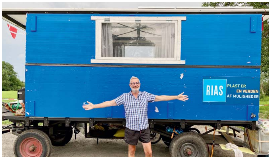
Maringotku postavil z velké části z plastu, aby ji klisny pohodlně zvládly utáhnout.

Pak se vydal jižně. Stihl projet kus Německa a část Polska, tam v listopadu cestu na čas přerušil. „Začala být zima a došly mi peníze. Nechal jsem koně ustájené v Polsku, stopem se dostal domů a pět měsíců jsem pracoval jako číšník v hotelu. 6. dubna jsem se vrátil za koňmi, vyčistil vagón a vydal se na jih. Teď jsem třetím dnem v Česku,“ hlásí s koncem června na starobělské odpočívce.