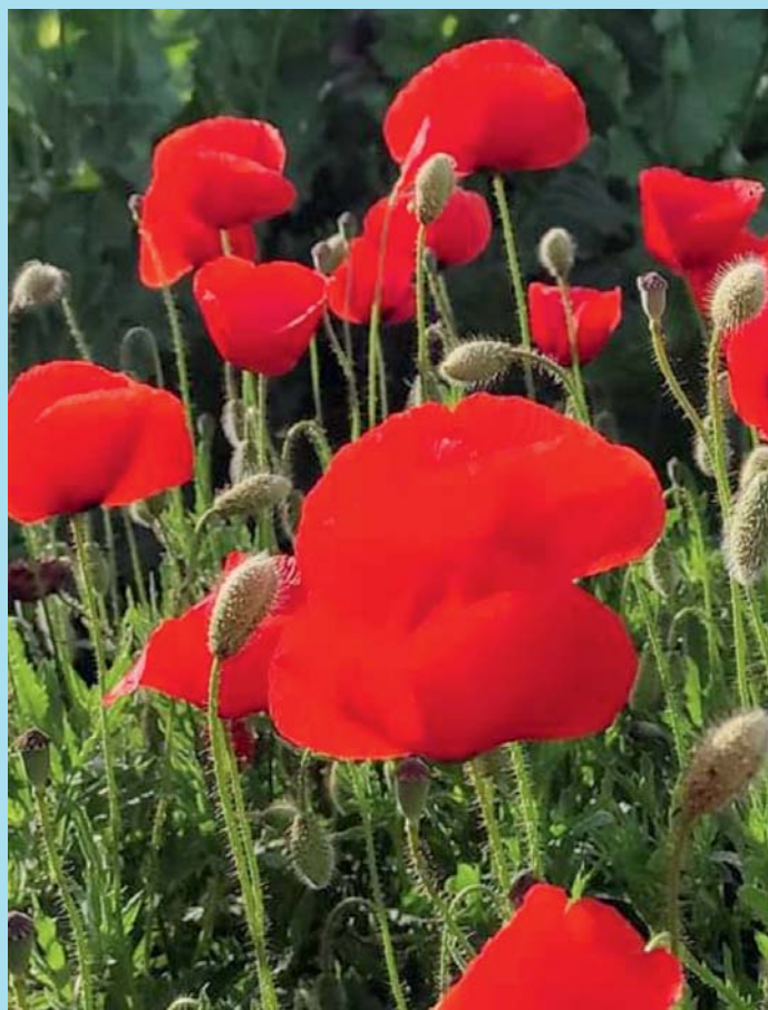
Červená se.