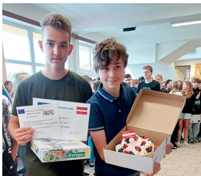
Třída 9.B se věnovala Lotyšsku. A zvítězila – získala nejvíce bodů ze všech tříd.