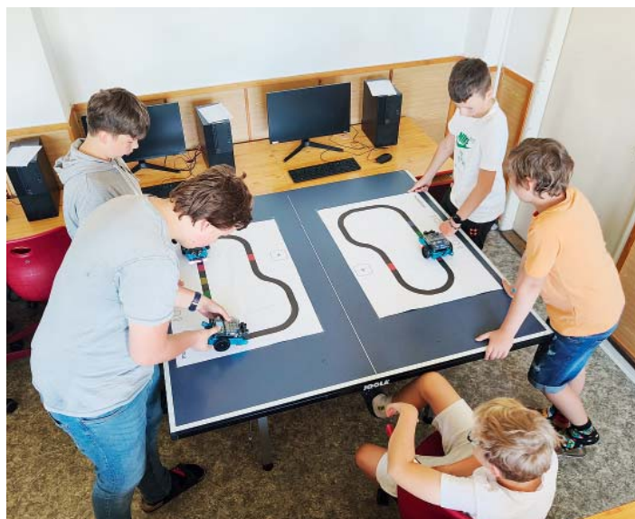
Roboti museli čtyřikrát obkroužit taky trasu po vyznačené linii.