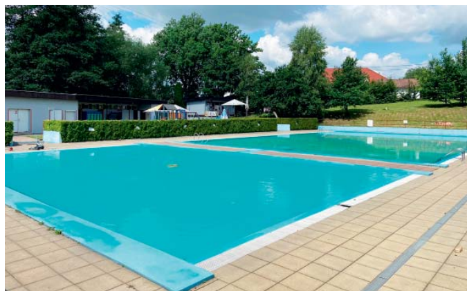
Letošní sezona začala v půlce června.