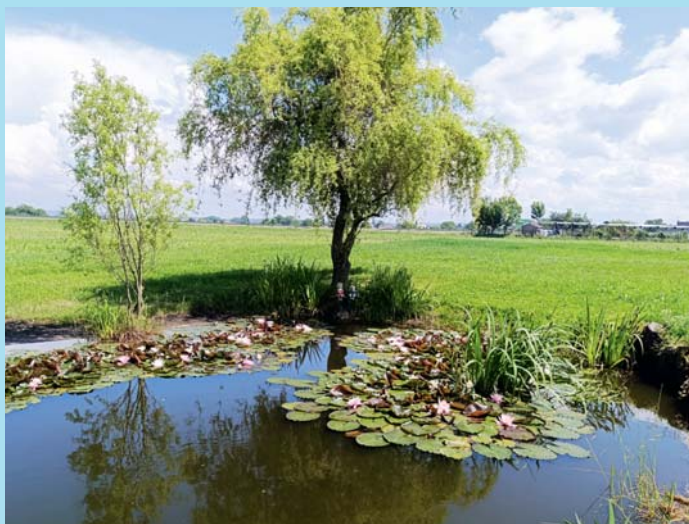
Plno leknínů.