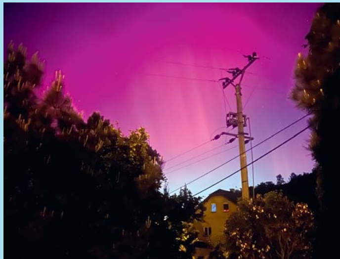
Polární záře.