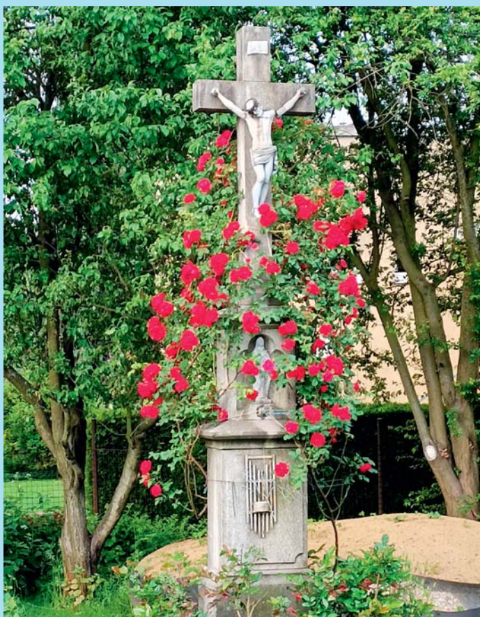
Boží muka z Hliněné.