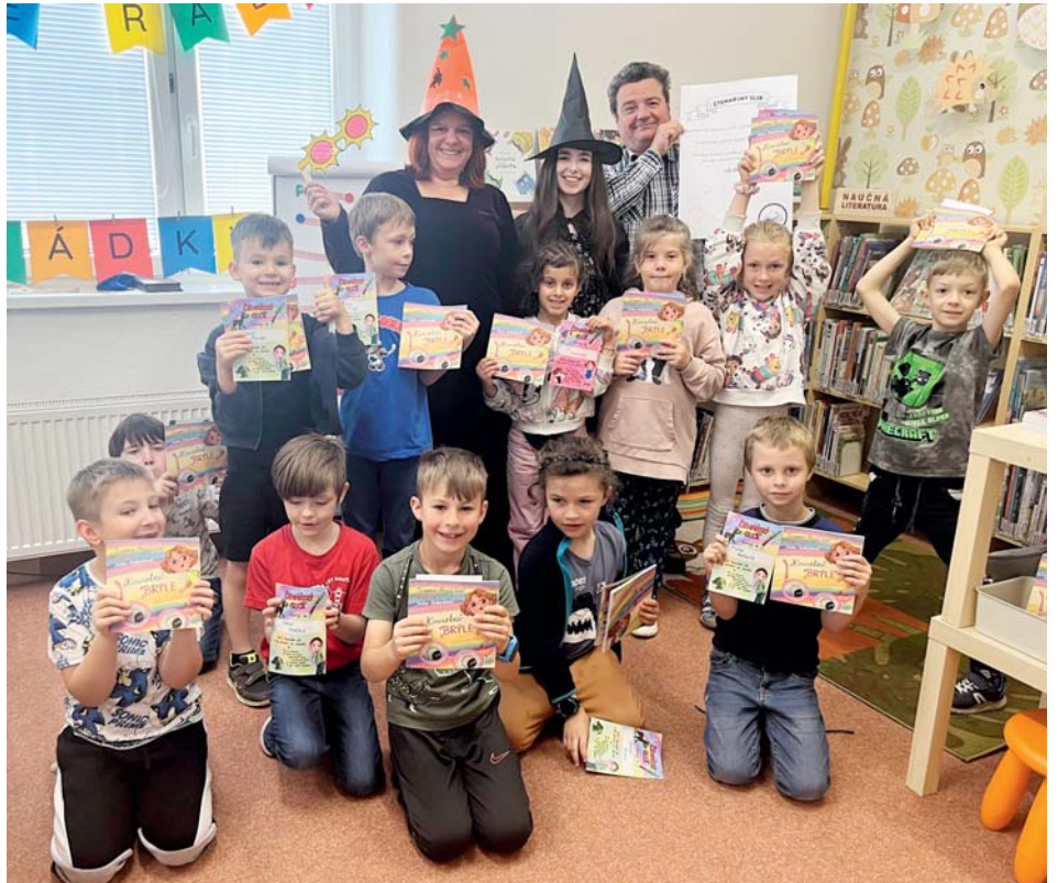
Knihka Kouzelné brýle od Zuzany Pospíšilové. Odměna pro malé čtenáře.