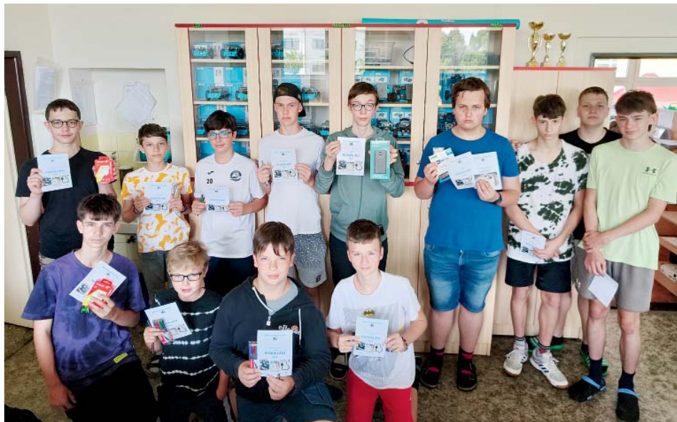
V letošní školní robotické soutěži nastoupilo šest týmů.

Druhým úkolem bylo naprogramovat robota, aby sledoval čáru a projel čtyřikrát stanovenou dráhu. Do bodování se počítal čas, zvukový a světelný signál