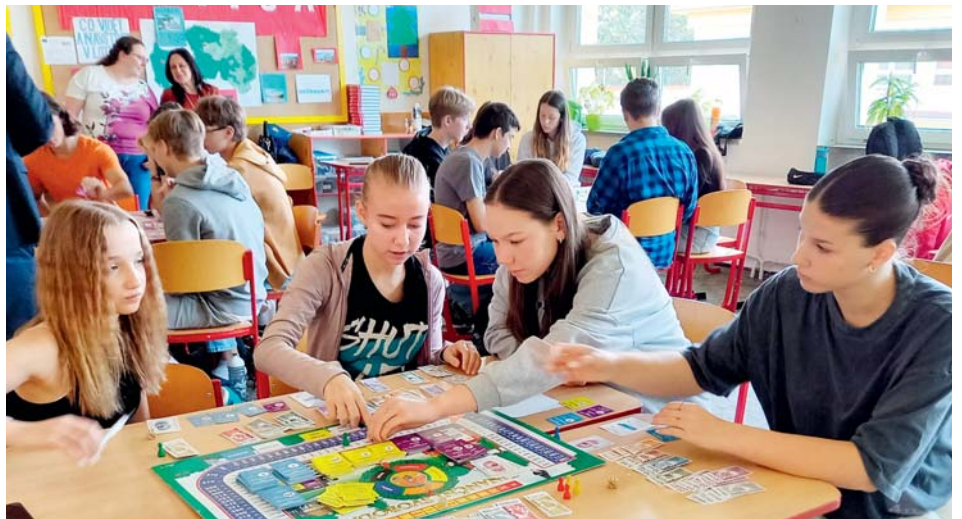
Spoření, úvěr, hypotéka, dluhopis – s pojmy se školáci seznamovali hravě.

Žáky hra hodně zaujala, všichni hráli s velkým zapálením. Kupovali, prodávali, spořili, zbavovali se dluhů, investovali, vymýšleli různé strategie a své finanční úspěchy či ztráty silně prožívali. Během dopoledne se nejen pobavili, ale také