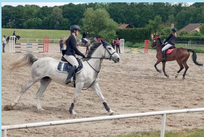
Před Velkou cenou.