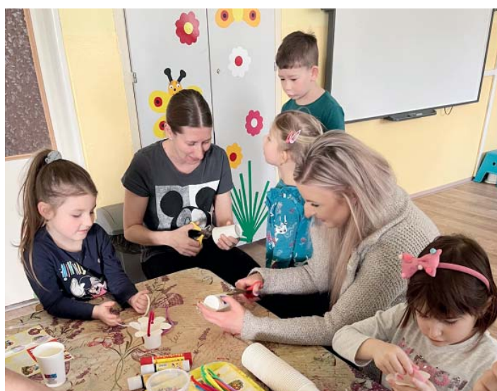
Velikonoční tvoření s rodiči v mateřince Mitrovická.

básniček a tanečků. Předškoláci předvedli krátké vystoupení pro členy Svazu invalidů. Obě třídy jely na školní výlet do areálu Skalka, kde navštívily spoustu atrakcí a prohlédly si místní zoo. Dětem se výlet moc líbil a už se těší na další. Pro předškoláky si místní knihovna připravila besedu s názvem Kamil neumí létat. V květnu došlo i na společné fotografování jednotlivých tříd a oslavili jsme svátek všech dětí – různými soutěžími a plněním zábavných úkolů na zahradě, nechyběly odměny, bohaté občerstvení ani tombola. Na závěr plaveckého kurzu dostaly děti diplomy.