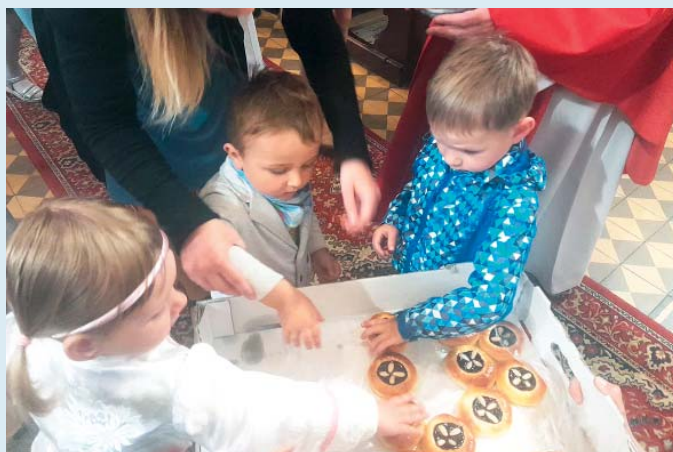
A zájem byl veliký.