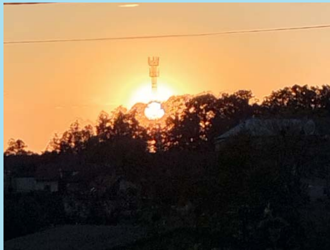
Večerní vysílač.