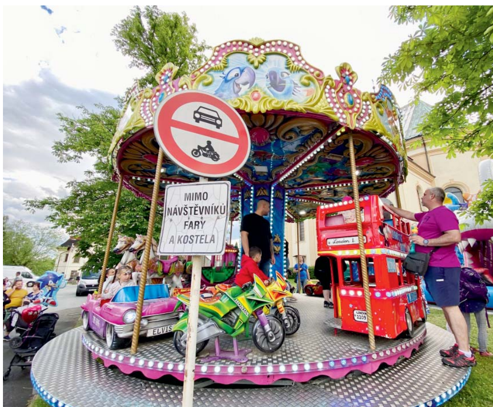
Dvě dětské atrakce obsadily i trávník vedle kostela.