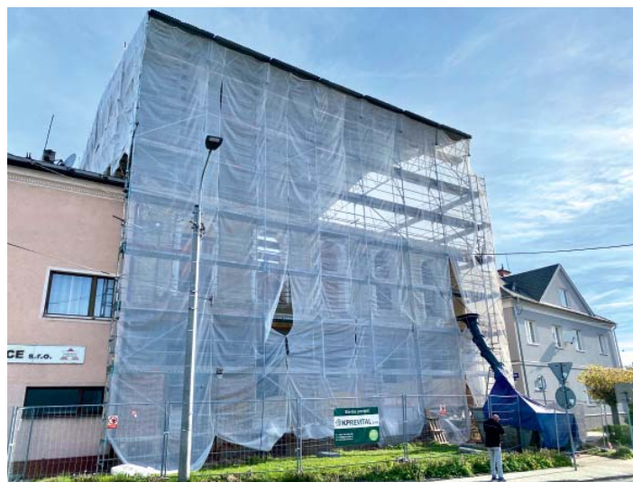
Kavárna bude sídlit v přízemí opravované budovy u kruhového objezdu.

Majitel objektu – městský obvod Stará Bělá – má zájem vybavit prostory kavárny a kuchyňky vybavením v souladu s podmínkami krajské hygienické stanice a po dohodě s vybraným nájemcem.