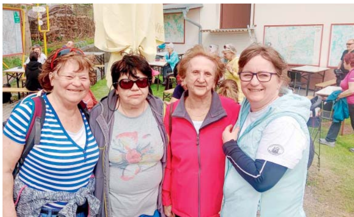
Starobělská Zámčiska se letos šla po dvaapadesáté. A řada turistů se účastní pravidelně.