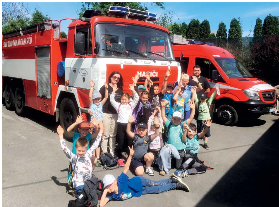
Děti z druhých tříd na návštěvě v hasičárně.

Po prohlídce zbrojnice se drobtina přesunula na přilehlé parkoviště, kde byla připravena hasičská vozidla. Cisternová automobilová stříkačka Tatra CAS 32 - T 815 a dopravní automobil Mercedes-Benz DA 15 L2T byly dětem plně k dispozici. Prošmejdily si kabiny, úložné prostory s technikou, vyzkoušely si zásahový oděv a spojování hadic. Nesmělo ani chybět zablíkaní modrými ma-