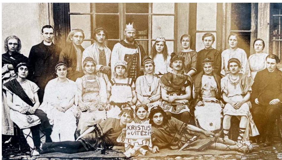
K orlům kdysi patřila i pravidelná divadelní představení.

V zahradě Katolického domu se konalo veřejné cvičení, na němž vystoupili muži s prostnými a na náradí, ženy cvičily