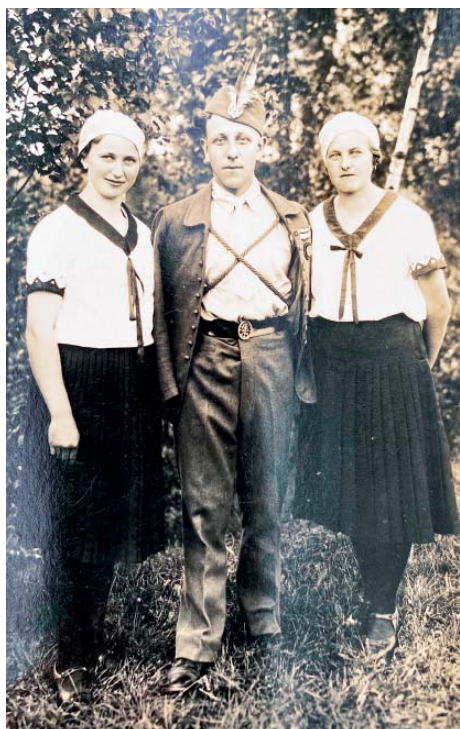
Členové Orla v slavnostním oděvu.

Dnes mají ve Staré Bělé skoro stovku členů. Nejvíce je slyšet o oddílu stolního