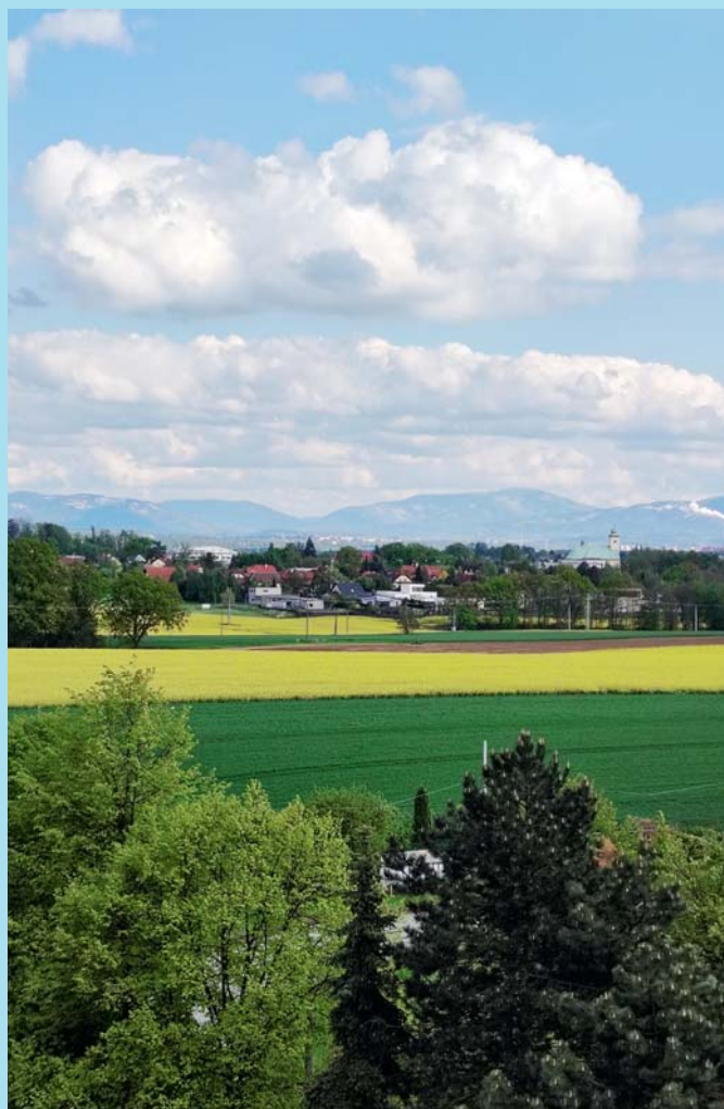
Z věžáku.