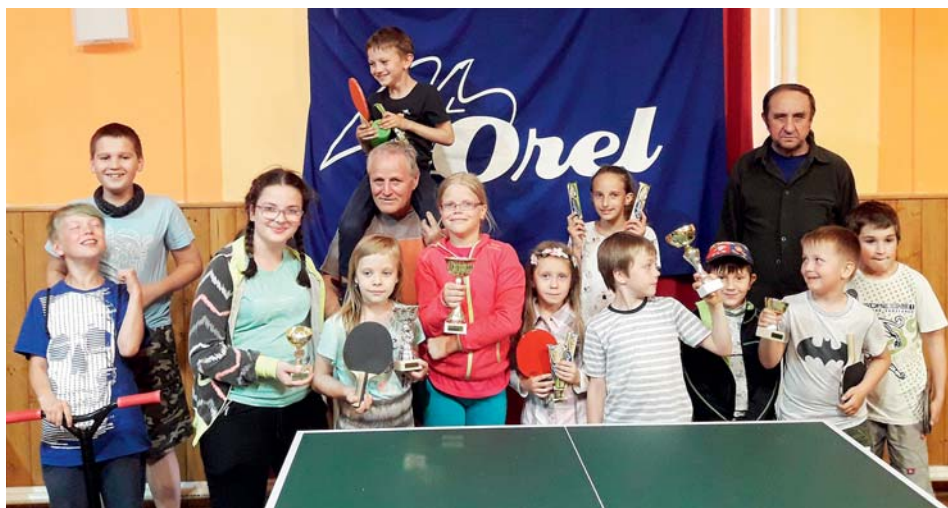
Hráči i s trofejemi, radost v roce 2020.

Zdroje: Pchálek, Jan. Z historie starobělského Orla 1907–1948. Osobní zápisky. Holain, Jan. Prvopočátky: sport i ochotníci. Starobělský zpravodaj. Ostrava-Stará Bělá, 2016, č. 10, s. 7.