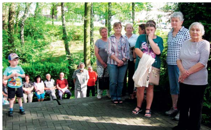
Památník na Zámčiskách připomíná starobělské oběti druhé světové války.