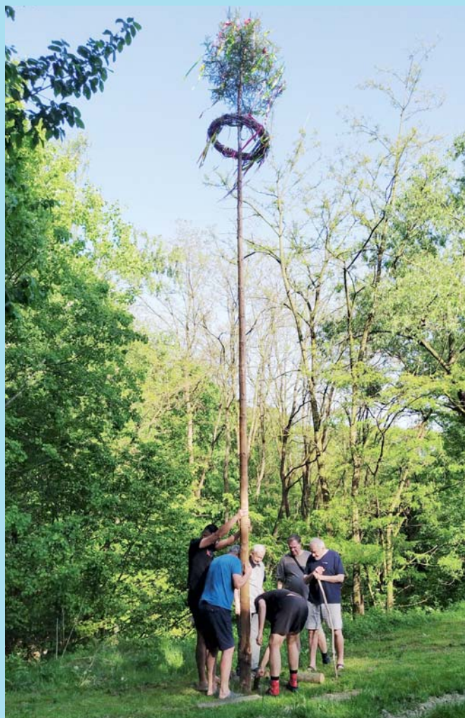
Stavění máje.