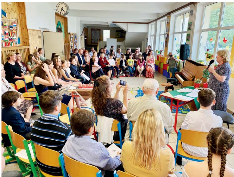
Rodiče, sourozenci, prarodiče – v publiku bylo jako vždy plno.