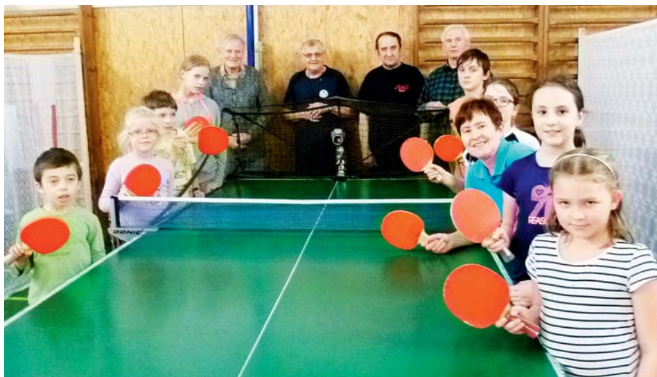
Trénink stolního tenisu – hráči i trenéři v roce 2017.

Orelská jednota Stará Bělá znovu funguje.