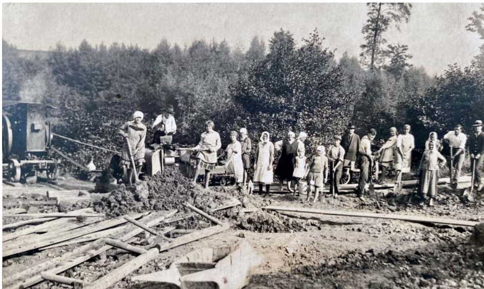
Výroba cihel na Katolický dům.

Orlí provozují od června 2022 zahradní restauraci u Katolického domu. Tréninky dětí i dospělých z oddílu stolního tenisu se konají uvnitř ve velkém sále budovy, kterou sami orlí v letech 1929 až 1931 sta-