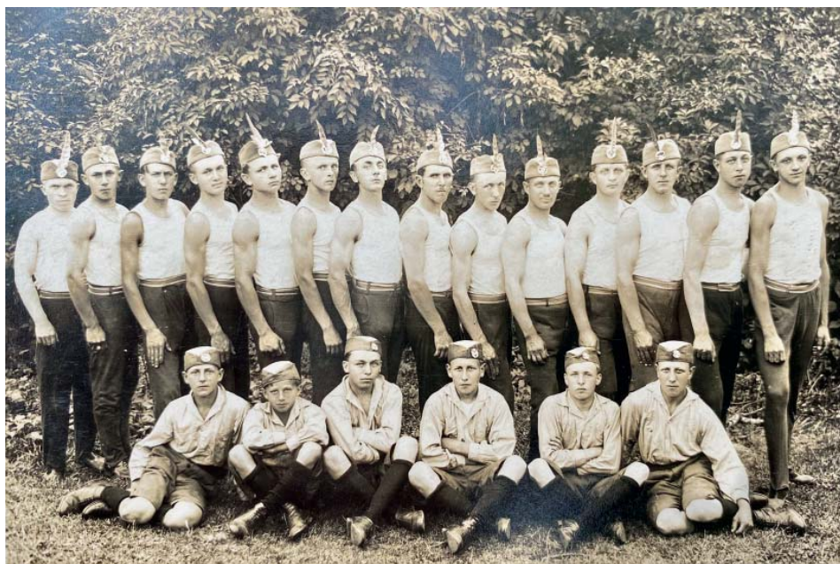
Veřejné cvičení 4. července 1933.