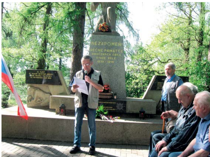
Pietní setkání se koná každoročně 30. dubna.

Letos 30. dubna uplynulo 79 let od osvobození naší obce Rudou armádou pod velením maršála Jereměnka. Tato operace si vyžádala životy 67 vojáků Rudé armády a jednoho československého tankisty. Díky nim je tady naše generace i naši potomci - narodili se jen díky jejich obětem. Historii nemůžeme upravovat ani vymazat z paměti.