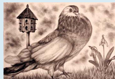
Český stavák je národní plemeno domácího holuba. Existuje už 100 let.

pracemi byl i obrázek starobělské žákyně Terezie Neubertové z 8. B.