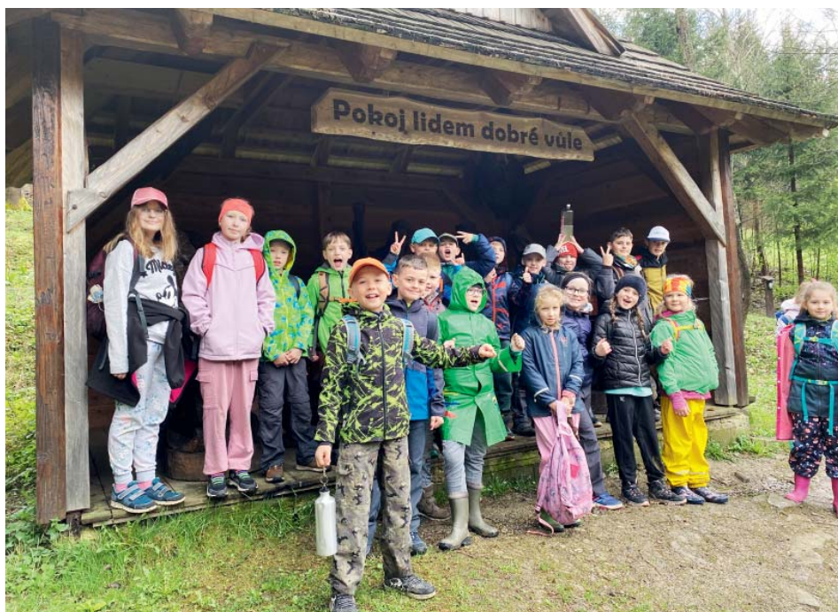
Výlety po svých. K pobytům na čerstvém vzduchu prostě patří.

Ačkoliv se občas někomu zastesklo po domově, všichni jsme si pobyt náramně užili. Nezapomněli jsme ani na naše osla-