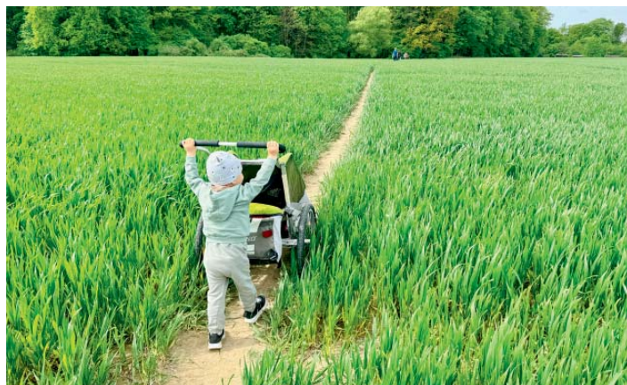
Pochod ale oslovuje i generaci nastupujících fanoušků.