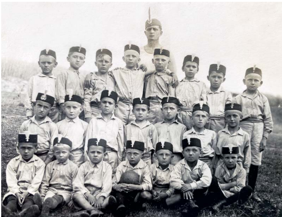
Žákům se u orlů říkalo dorosti.