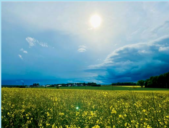
Po dešti, před deštěm.