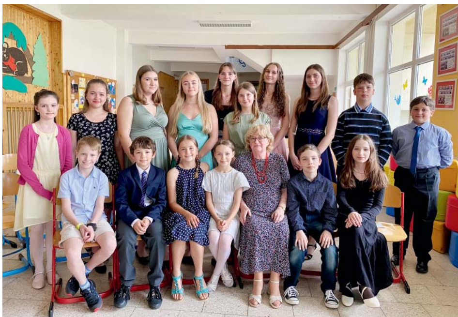
Slavnostní okamžik se žáky před květnovým koncertem.

Pro letošek pečovala o 16 dětí, které se u ní učí ovládat hru na klavír. „Jsou