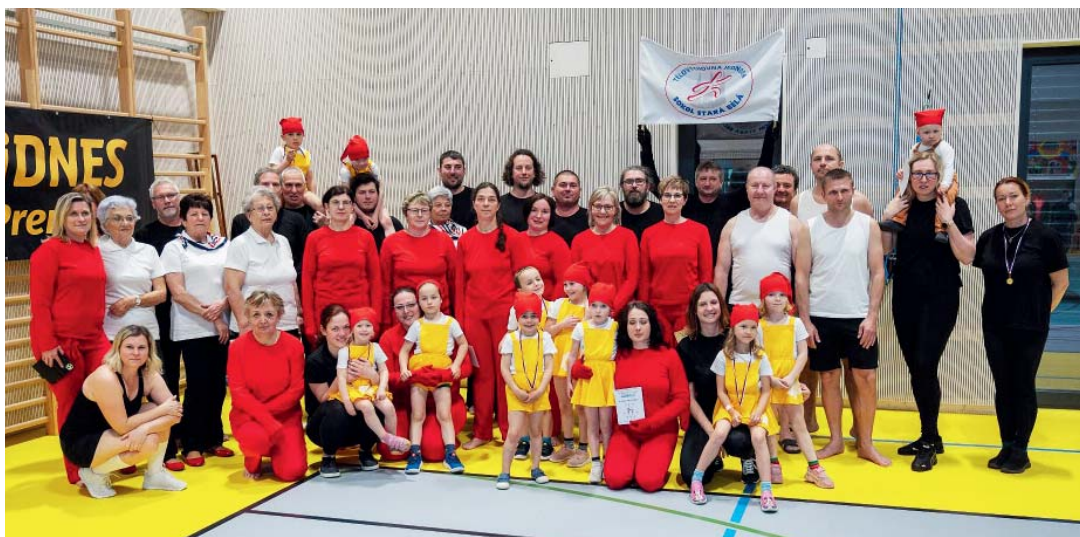
Sokolové znovu vystoupili se skladbami, které secvičili na loňskou výroční akademii.