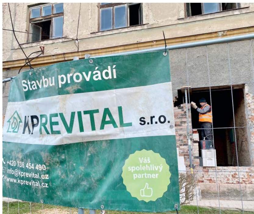
Stavaři začali přizpůsobovat okenní otvory, tak aby později vyhovovaly novým oknům.

Na ulici Malíkova zhruba metr, v přední a zadní části zhruba metr a půl. Chtěl