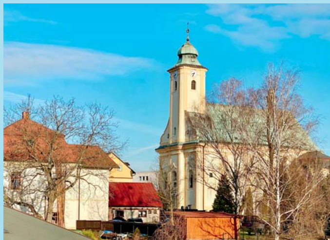
Jiný pohled.