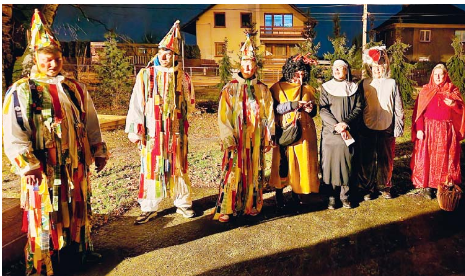
S procesím masek šli také muzikanti, hráli do kroku i k tanci.