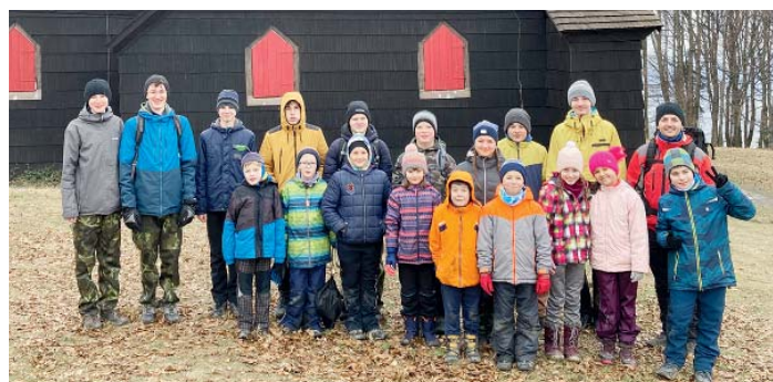
Přes dvě desítky skautů vyrazily na střediskovou výpravu.

Navzdory nabitému programu jsme zvládli okružní výlet, jehož cílem byla turisticky velmi oblíbená Prašivá s kostelem svatého Antonína Paduánského. Po cestě jsme zvládli přesně vyměřit sklon kanalizace a z přírodních materiálů originálně vyzdobit