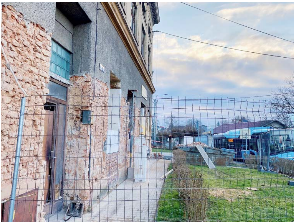
Stavební práce začaly. Dům teď chrání plot, aby byli kolemjdoucí v bezpečí.

Na řadě jsou příčky v přízemí a drobné vyzdívký. Navazovat by mělo zastřešení celé budovy oplechováním a lešením. Je to systém, který se použil už při rekonstrukci Domu pro seniory u kostela. Vznikne sarkofág, který bude budovu