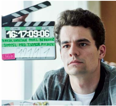
Z natáčení seriálu o těžké nemoci.

Pořád je to pro mě hlavně hobby. Ale potřebuju mít nějaký cíl, třeba zaběhnout dobrý čas. A čím víc lidem o tom řeknu, tím větší tlak a zodpovědnost cítím. Při mé poslední Beskydské sedmič-