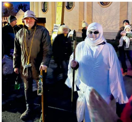
Smrtka občas někoho jen tak upozornila.