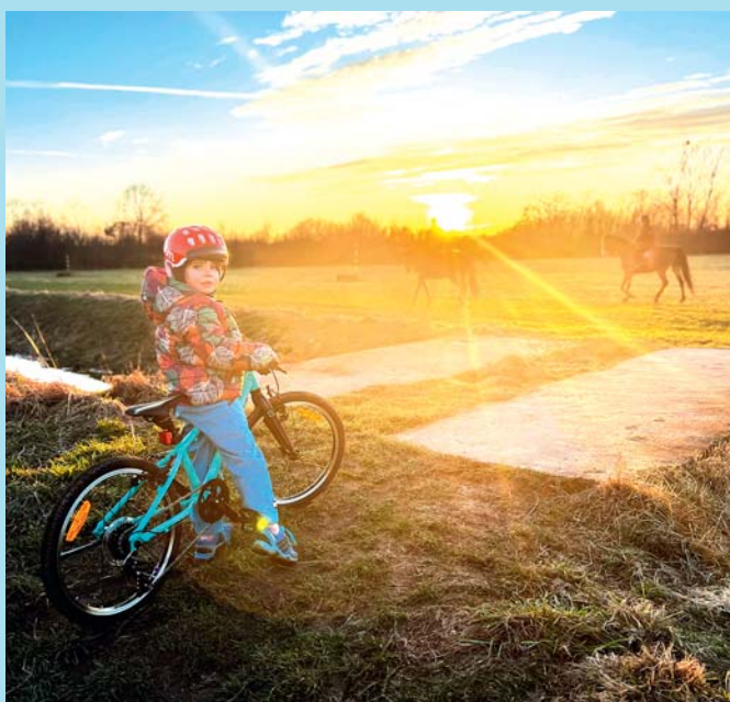
V sedle.