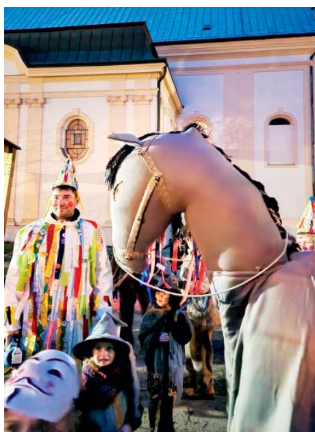
Kobyla, strakatí nebo nevěsta. Masky byly pestré a nápadité.