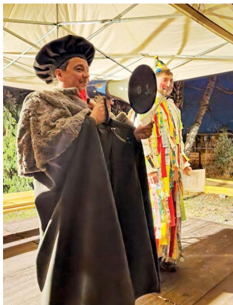
Starosta předával masopustní právo.