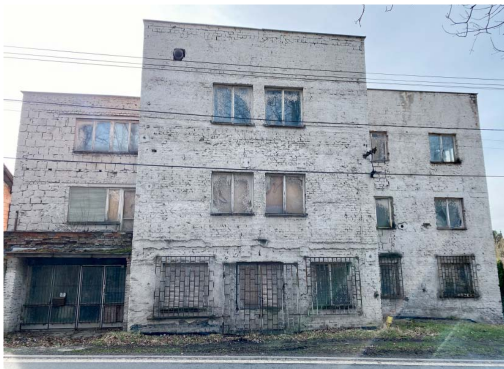
Dům dlouhodobě chátrá, majitel ho prodává i s pozemkem a projektem na přestavbu.