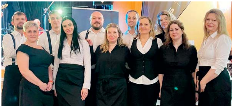
Pořadatelský tým složený z rodičů školáků a jejich blízkých.