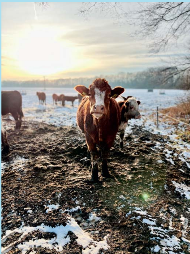
Z Proskovic.