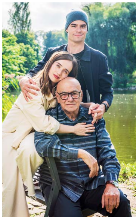
Z natáčení Smyslu pro tumor.

Umím zašít prasečí kůži. Hned v prvním díle jsem na operačním sále, kde pomáhám zašít ránu. Aby to nějak vypa-