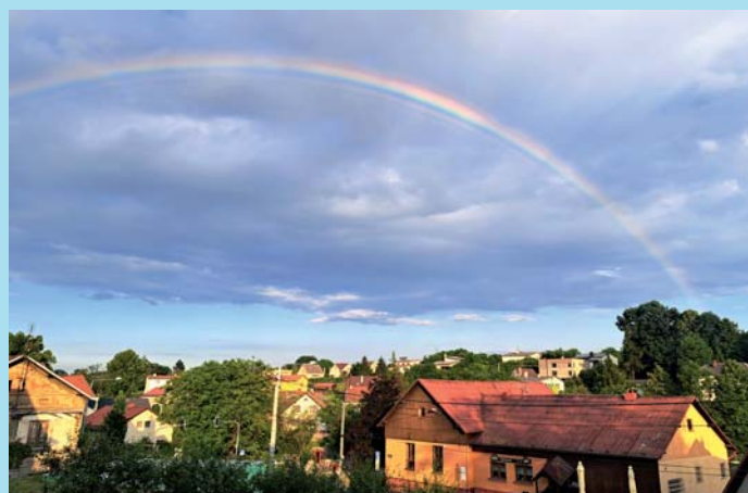
Duha U Lípy. Foto: Vladimíra Onderková