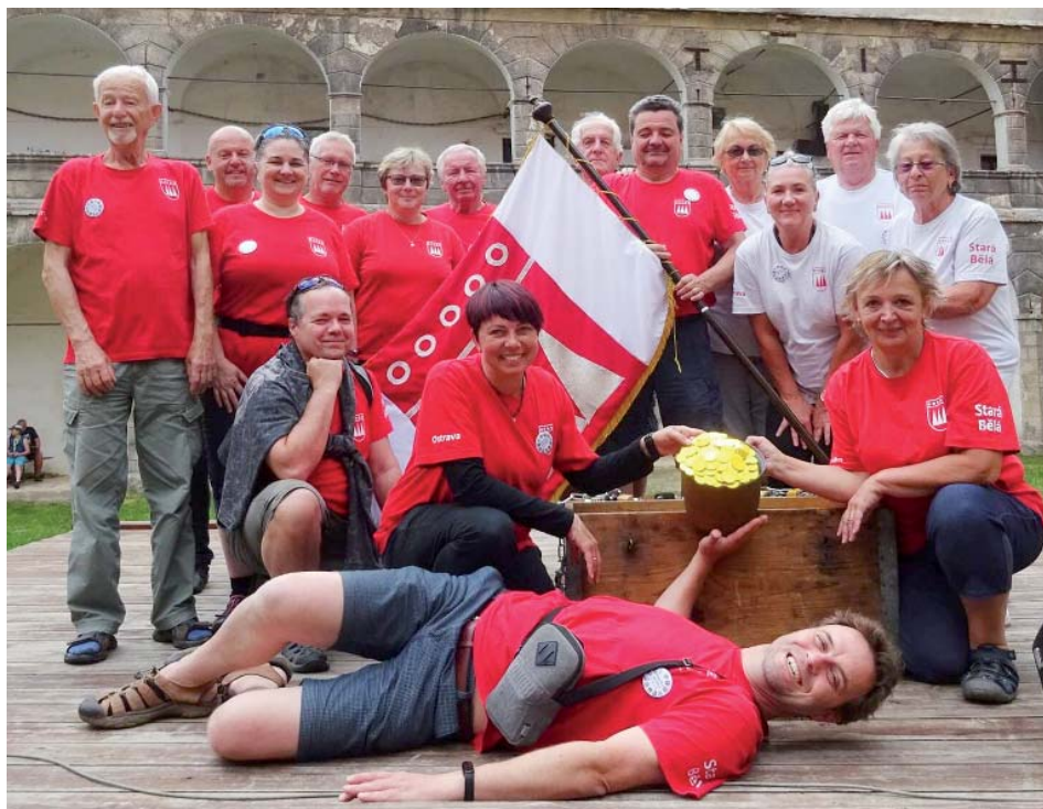
Starobělská výprava na letošním setkání v Bělé pod Bezdězem.