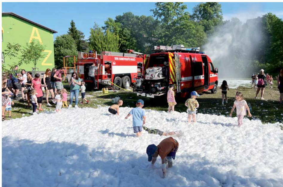
Dětský den ve školce na Mitrovické.