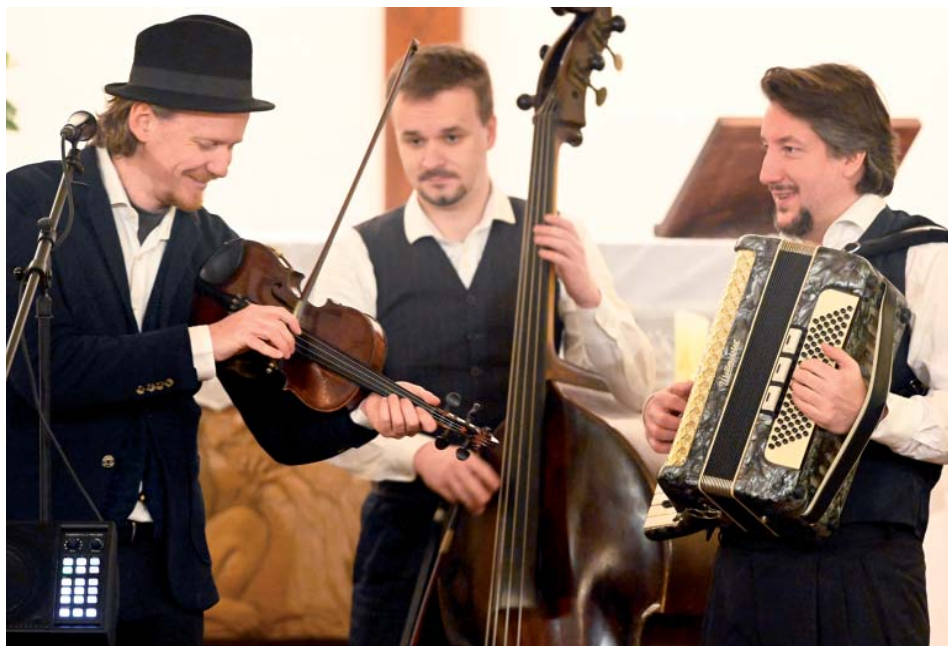
Část ansámblu Létající rabin. Členů má celkem pět.