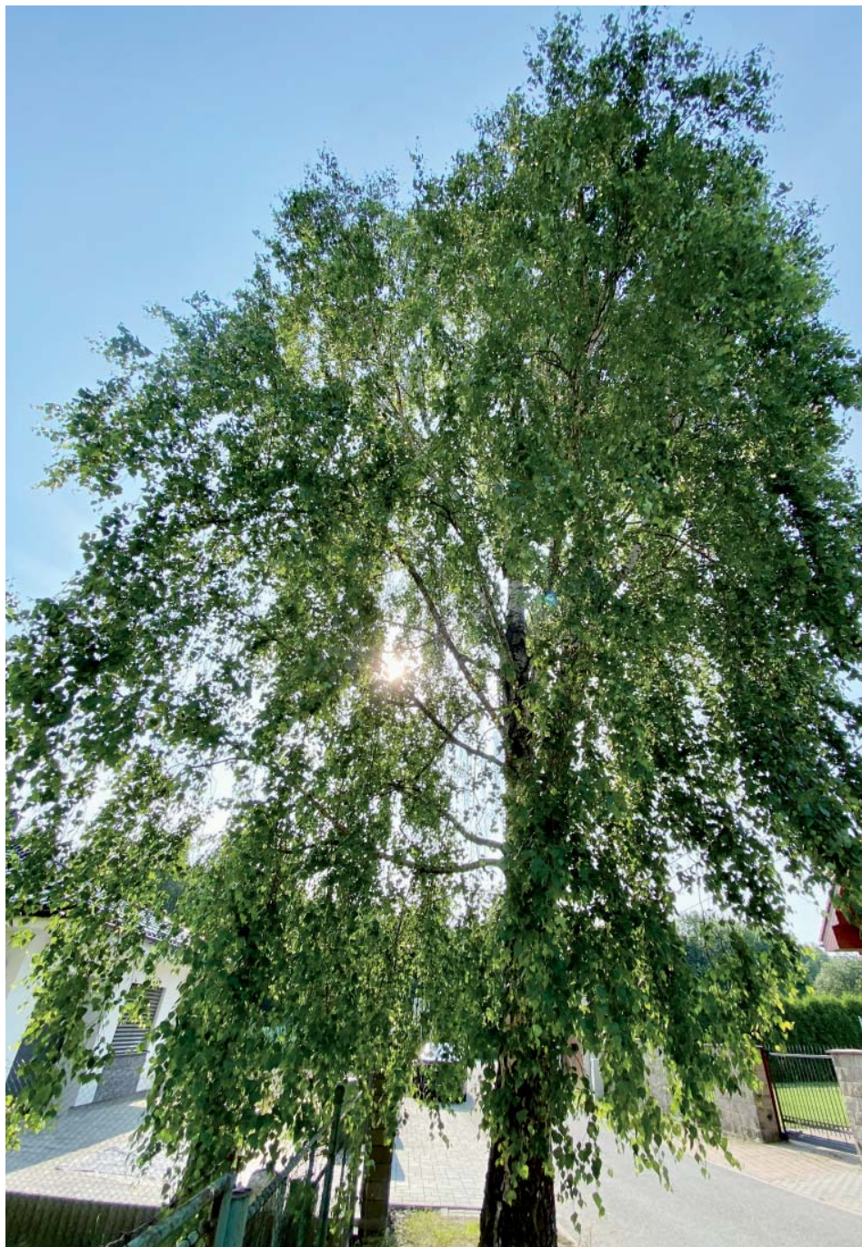
Podle odhadu spolumajitelky břízy má strom okolo padesáti let.

Zda tomu tak skutečně bude, je podle sadaře a zahrádkáře Tonyho Skřipčáka zatím těžké odhadnout. „Můžeme doufat, že útočník nebyl dost důsledný.“