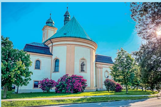
Kvetoucí rododendrony.