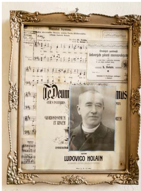
Rodáka připomíná obraz na kůru katolického kostela.