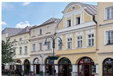
Centrum Krnova.