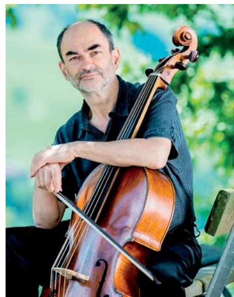
Violoncellista Christophe Coin.