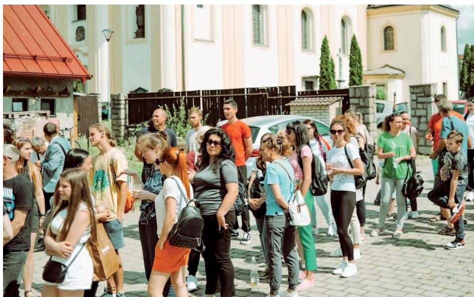
Starobělská fara se proměnila v centrum pomoci ukrajinským uprchlíkům.