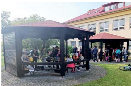
Sportovní den u základní školy.

Sport, zajímavé aktivity a zábava. To vše si užily děti společně se svými rodiči v areálu kolem základní školy. Na poslední květnové páteční odpoledne pro ně zaměstnanci školy a spolek rodičů připravili dvacítku úkolů. Vyzkoušely si sluchové pexeso, skákání v pytlí, slalom s míčem, lukostřelbu, kriket nebo chůzi na laně.