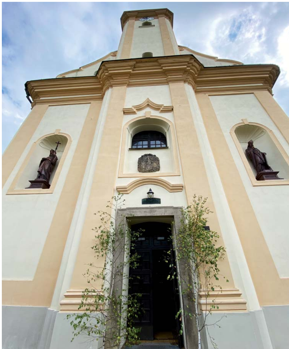
V kostele sv. Jana Nepomuckého Holainovy písně často znějí.

Ludvík Holain byl významným církevním představitelem coby římskokatolický kněz.