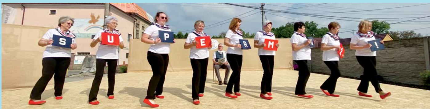
Vyznání sokolek.