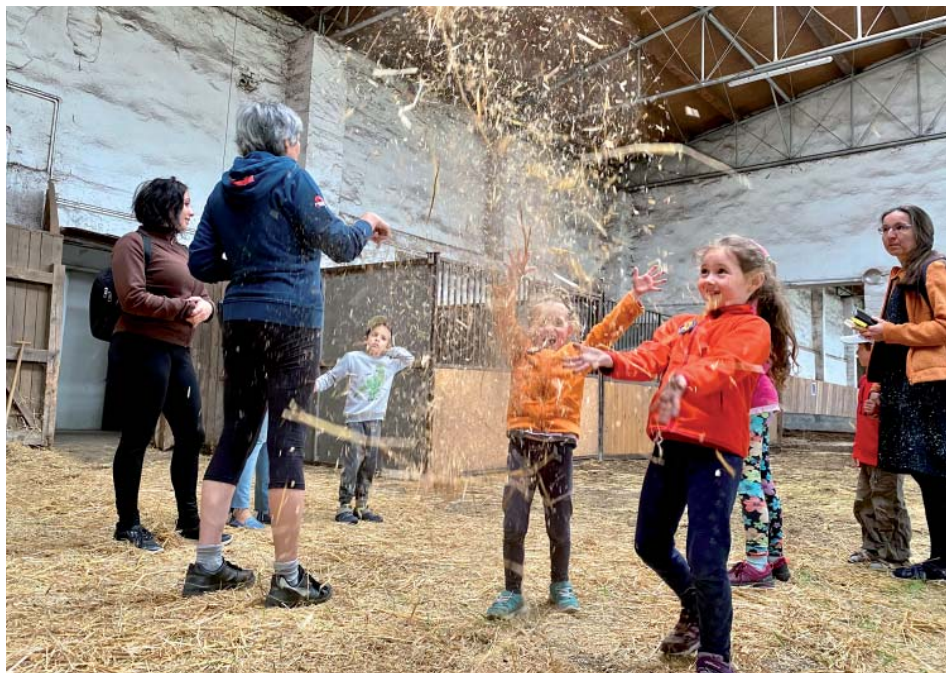
Při exkurzi v hale bylo veselo.

Mnozí z účastníků se zájmem nahlédli i do stájí a zázemí jezdeckého klubu. „Nejčastěji se ptali, kolika let se kůň dožije. Ze statistik u nás vybočuje třeba Sauron, kte-