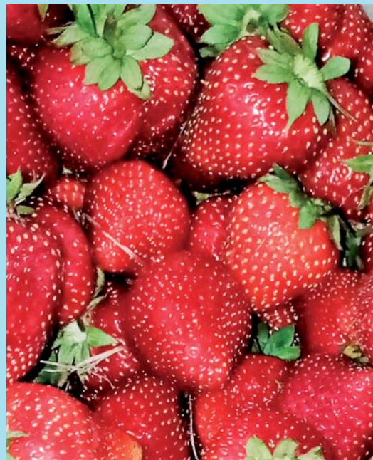
Něžné, luční a jahodové potěšení.