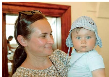
Uprchlícké rodiny se na starobělské faře setkávají každý měsíc.