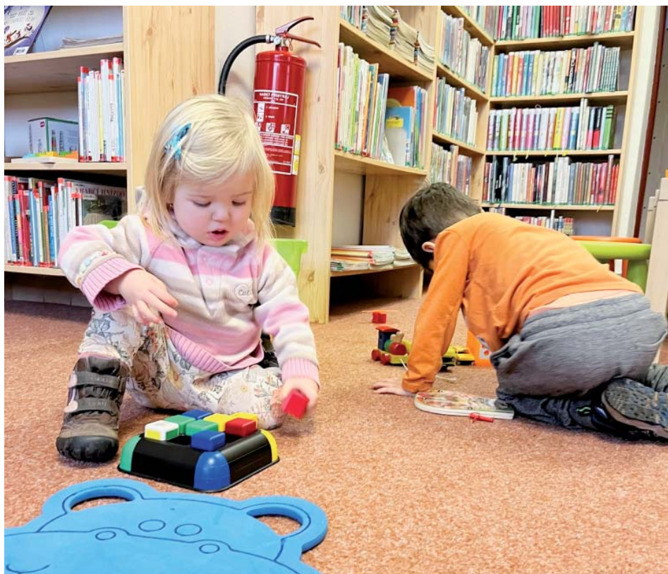
Klub Kulíšek je pro děti do šesti let. S doprovodem stráví v knihovně asi hodinu měsíčně.