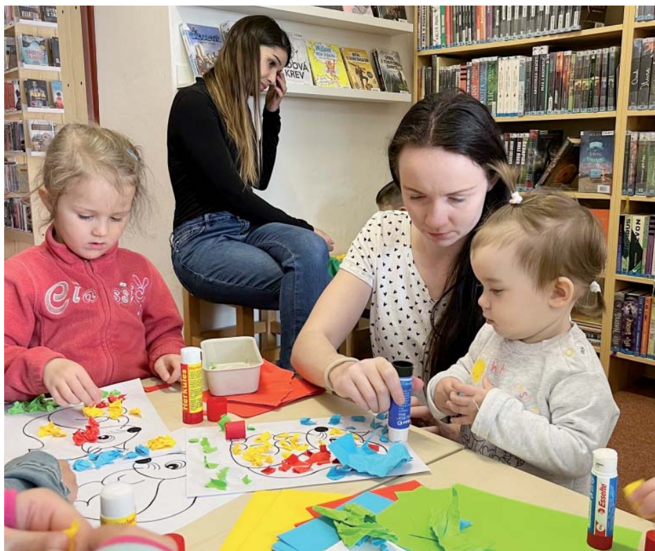
Tvůrčí chvílky. I na ty je v knihovně čas.

Děti v knihovně skládají rozstříhanou omalovánku, staví obrázek z dřevěných kostek, třídí dřívka podle barev, trefují se balónky do otvorů vyřezaných do krabice, prolézají tunelem. „Na setkání často chodí sourozenci. Je pěkné sledovat, jak starší pomáhají mladším,“ dodává. S pomocí rodičů následně i něco vyrobí. V květnu to byl papírový pták k ozdobení květináče, v dubnu obrázek veverky.