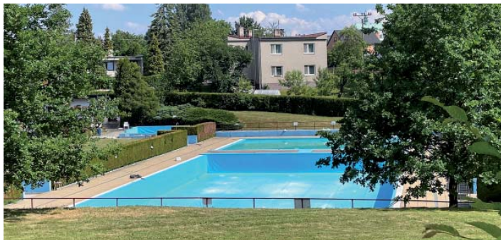
Koupací sezona 2023. Se stejným provozovatelem i cenami.

Starobělské koupaliště v červnu zahájilo další sezónu. „Cena celodenní vstupenky zůstává stejná jako loni. Dospělí zaplatí 110 korun, děti 80 korun,“ uvedl Ivo Maceček, zástupce pronajímatele koupaliště.