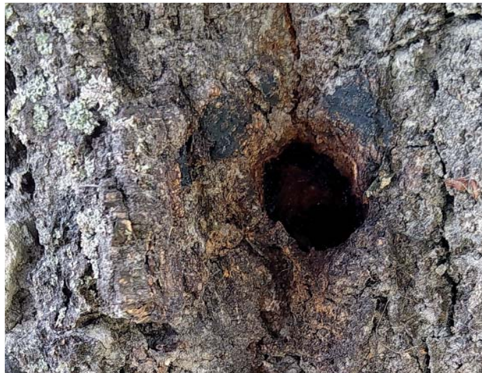
Zahrádkáři: poškodit úmyslně strom je necitlivé.