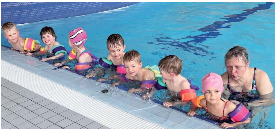
Předškoláci z Mitrovické se zdokonalovali v plavání.

dary, rovněž členkám výboru Dětského úsměvu a maminkám, které pomáhají při organizaci a provozu stánku na obecních akcích.