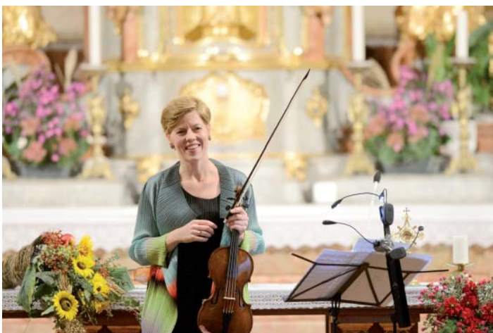
Fenomenální houslistka Isabelle Faust ve Staré Bělé v roce 2018.

ADVENT S PERMONÍKEM: „A NA ZEMI UPOKOJENÍ...“ Kostel sv. Jana Nepomuckého 3. 12. | 17 hodin