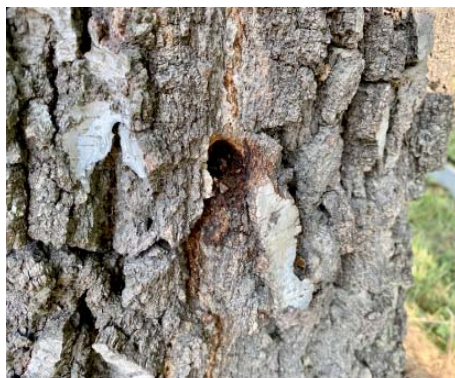
Děr ve kmeni je hned několik.

Záleží, co dovnitř nalil. To nejhorší na tom ale je, že tu máme člověka, který ho podle všeho chladnokrevně zničit chtěl. Strom nejde spravit jako třeba nabouraný plot. Je zbabělost ničit něco, co roste desítky let,“ zdůraznil etickou stránku činu.