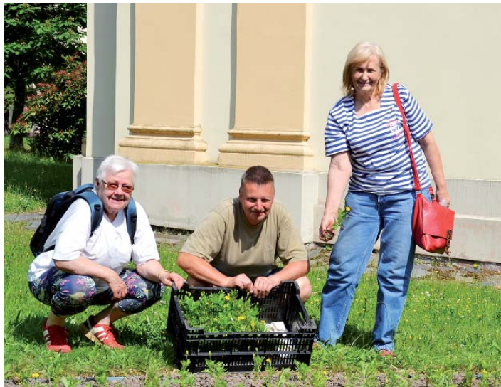
Záhony u pergoly zdobí aksamitníky.

Zahrádkářské sdružení obce Stará Bělá se i letos postaralo o výsadbu květinových záhonů vedle pergoly u Domu pro seniory. Místo teď zdobí 1 500 rostlin aksamitníky, které vypěstoval jeden z našich členů a společně jsme je pak zasadili. Zároveň se staráme již o dřívě vysázené kytky okolo pergoly.