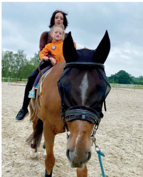
Z koňského hřbetu se rozhledli malí i ti větší. A radost z toho měli bez ohledu na aktuální věk.

léta pořádá jízdárna i dva turnusy pří městského tábora s koňmi. „18. července a 8. srpna tu budeme mít jednodenní Hry s koňmi. A 12. srpna pořádáme Letní parkurové závody s překážkami o obtížnosti od 80 do 120 centimetrů pro hobby jezdce i jezdce s licenci,“ zve k další návštěvě starobělské jízdárny. (joh)