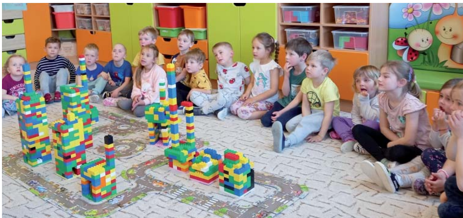
Děti z Blanické stavěly město.