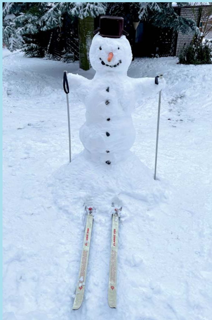
Běžkařský sněhulák.