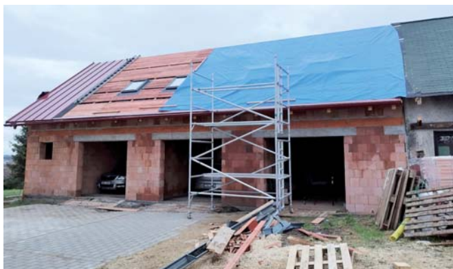
Klubovna skautů je uprostřed velké opravy.