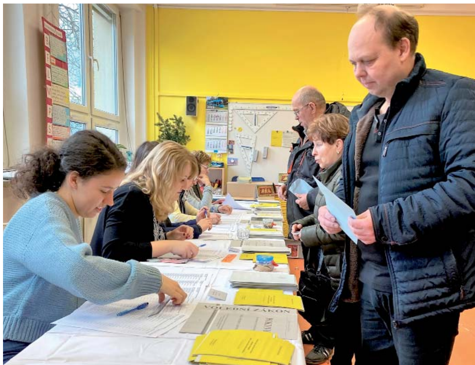
Stará Bělá má tradičně tři volební okrsky – s čísly 20001, 20002 a 20003. Ve všech zvítězil Petr Pavel, nejvýrazněji v prostředním okrsku, kde získal skoro 63 procent hlasů.

Zpravodaj na Facebooku: www.facebook.com/StarobelskyZpravodaj