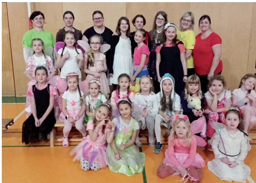
Nocování v sokolovně si malé víly užily po dvouleté pauze.