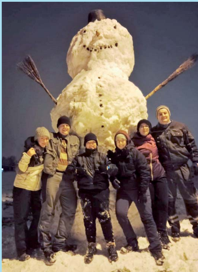
Sněžný gigant.