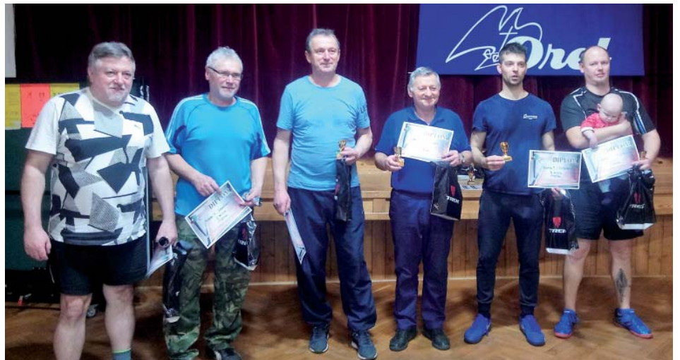
Čtyřhra se účastnilo osm dvojic.