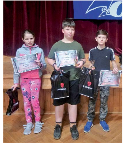
Vítězové mezi žáky.