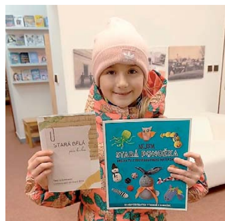
Knížku dětí si lze půjčit.

TJ Sokol Stará Bělá, odbor ASPV, pořádá v neděli 5. února od 15 hod. v tělocvičně Sokolovny