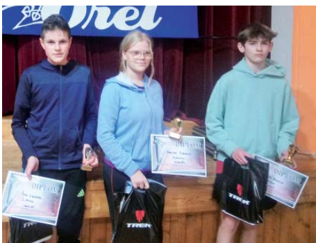
Mezi juniory zvítězila juniorka.