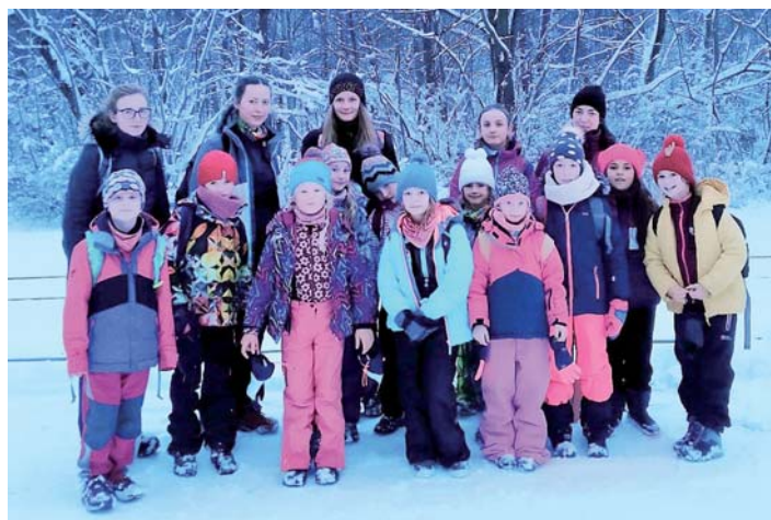
Světlušky vyšly na Velký Javorník. Zima nezima.