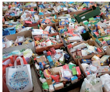
Potraviny roztřídili dobrovolníci.