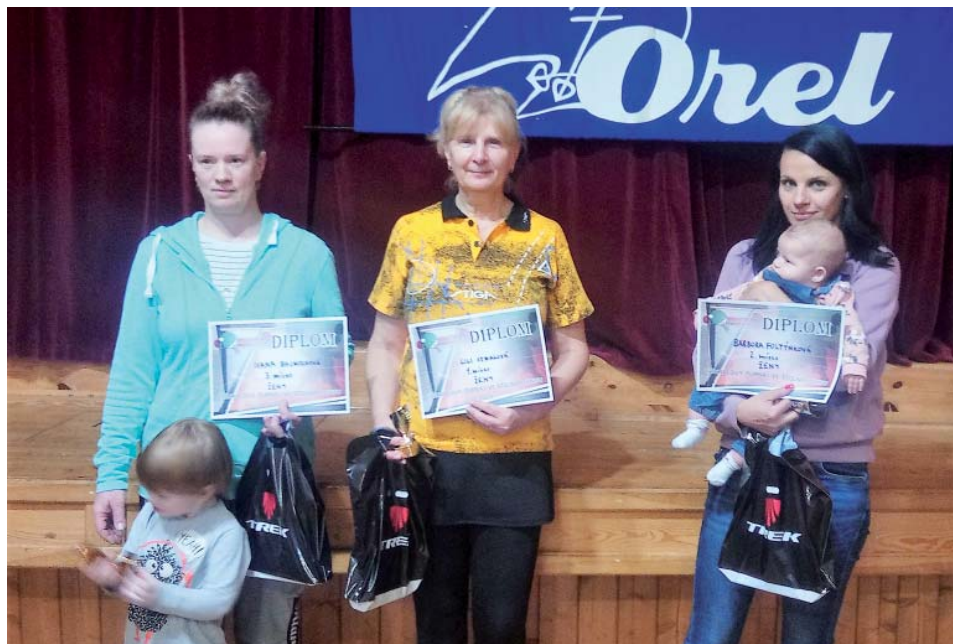
Ženy spoléhaly na nejmladší fanouškovskou základnu.