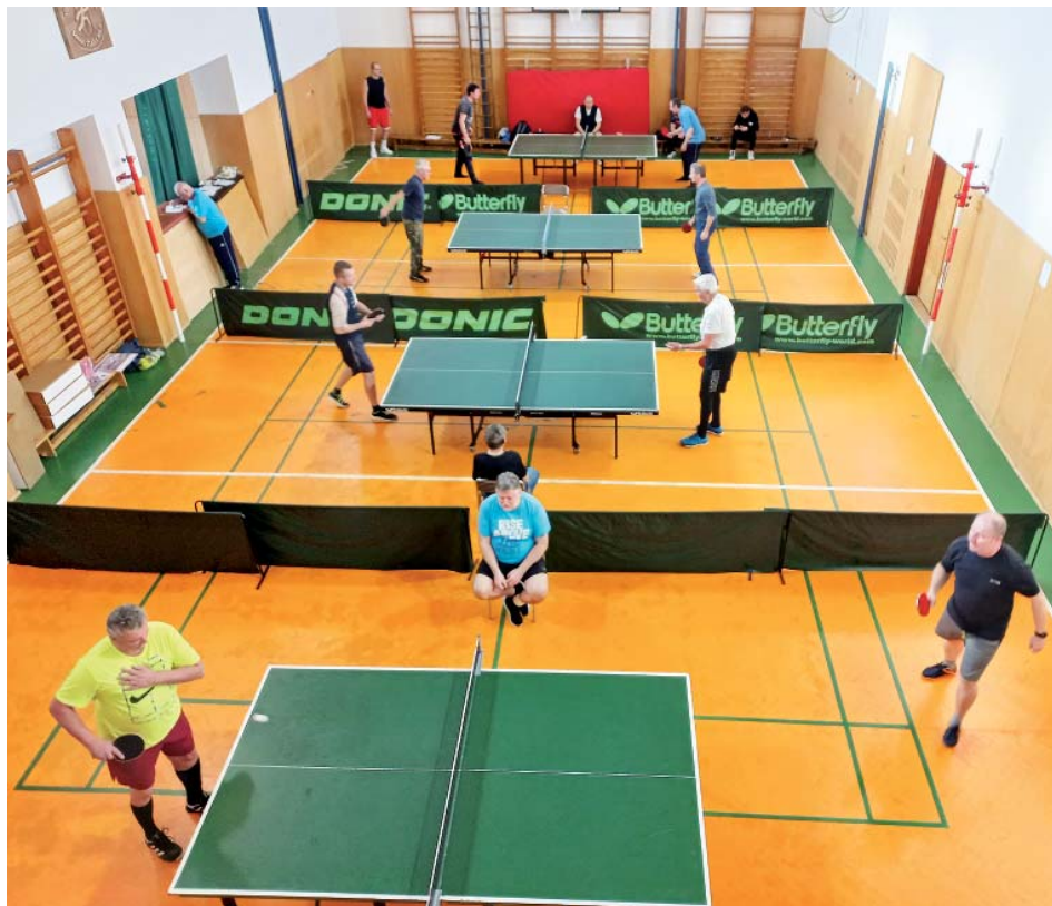
Do tělocvičny se vešly hned čtyři hrací stoly.

Je trošku škoda, že v žákovských a ženských složkách není o tento typ sportu zájem a tudíž je malá účast. Nicméně ti, co přišli, si ho užili a snad v příštím roce jich bude víc.