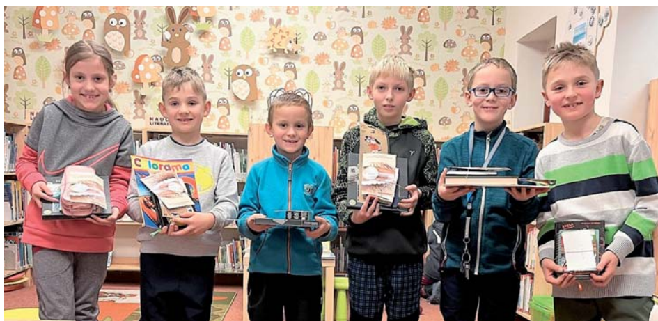
Starobělstí lovci perel.

Zapojilo se 15 účastníků. Výsledkem je knížka z příspěvků všech zapojených dětí. Byli jsme velmi překvapeni, jak pěkné příběhy se nám do knížky sešly. Líbí se mi, že děti mají i v dnešní digitální době stále velkou fantazii. V jejich příbězích se dostaneme do tajemných a kouzelných světů, popletených pohádek a neobyčej-