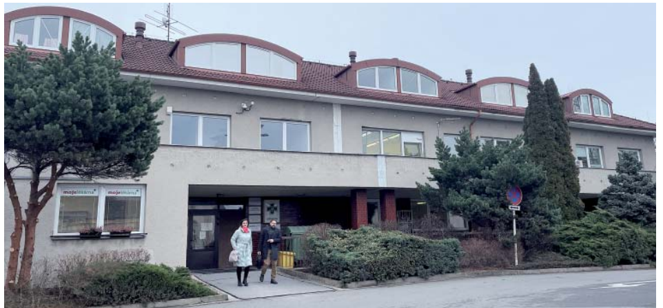
První fáze oprav střediska omezí provoz některých ordinací i služeb.

„Hlavním důvodem rekonstrukce rozvodů je koroze ocelového potrubí a ne-