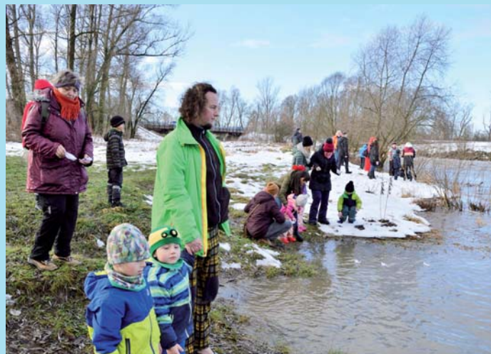
Štědrý den u Honculy.