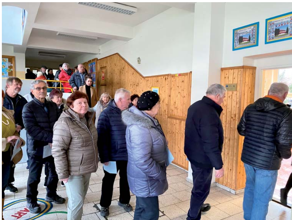
Před otevřením volebních místností se ve foyer školy tvořily fronty. K volbám přišlo v 1. kole přes 75 procent lidí, ve druhém ještě o tři procenta více.

A ve Staré Bělé přišlo taky víc voličů, než kolik čítal republikový průměr. Ve druhém kole prezidentské volby hlasovalo ve Staré Bělé skoro 78 procent lidí – je to téměř o 8 procent víc, než kolik dělala volební účast v celém Česku. A byla také vůbec nejvyšší za dobu, kdy prezidenta volí Češi včetně Starobělanů přímo. V roce 2018 přišlo ve druhém kole něco málo přes 73 procent starobělských voličů, v roce 2013 to bylo dokonce 64 procent. (joh)