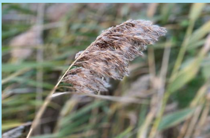
Ve větru.