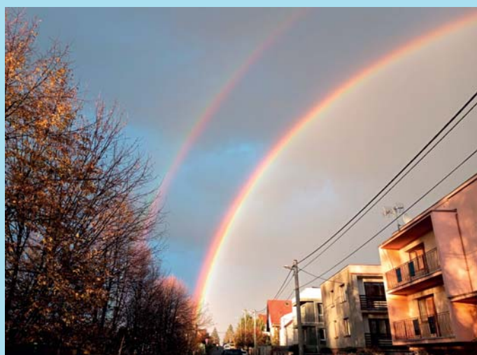
Duha cestou ze školy.