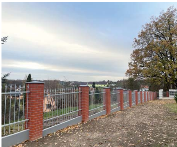
300 metrů. Délka nového oplocení.