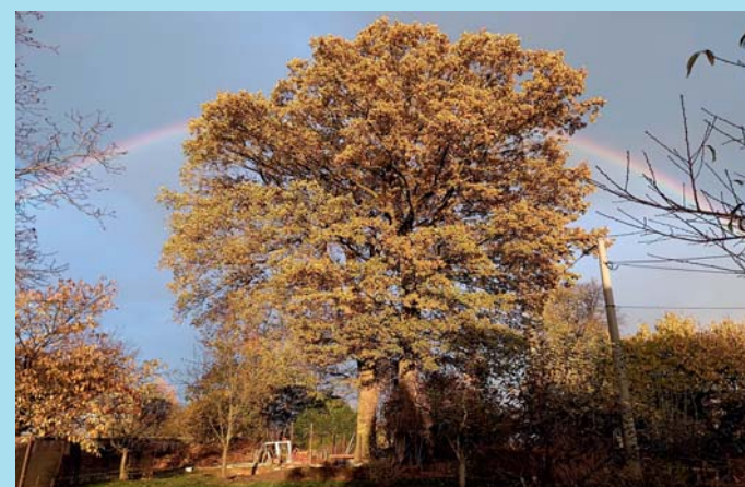
Podzimní pohled.