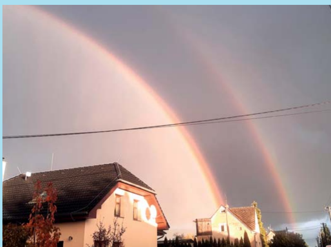
Ještě jednou duha.