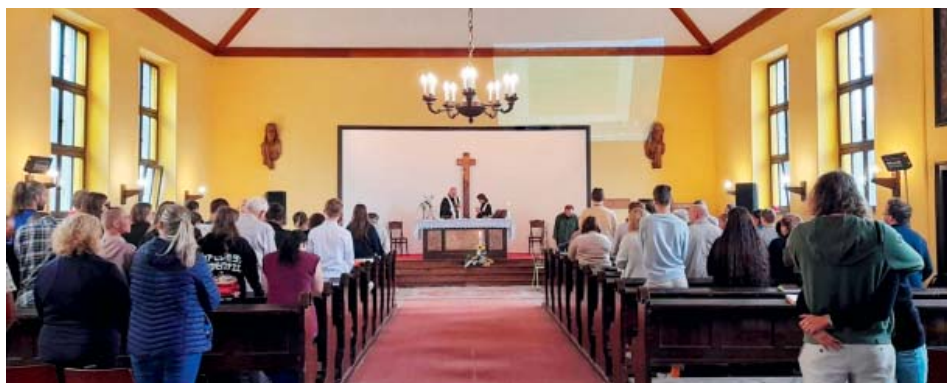
Setkání mládeže přineslo kladné ohlasy na starobělský Husův sbor.