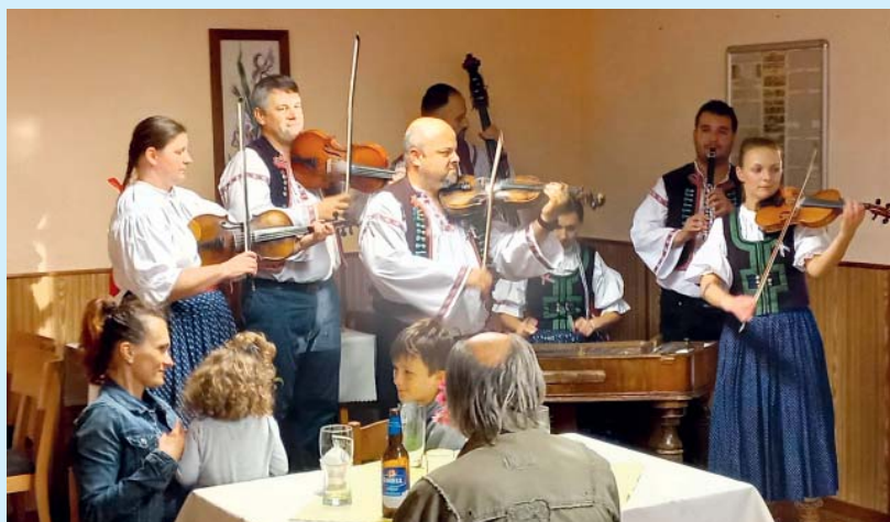
Cimbálovka Úsměv a posezení u guláše – tradiční zakončení starobělské zahrádkářské sezóny.