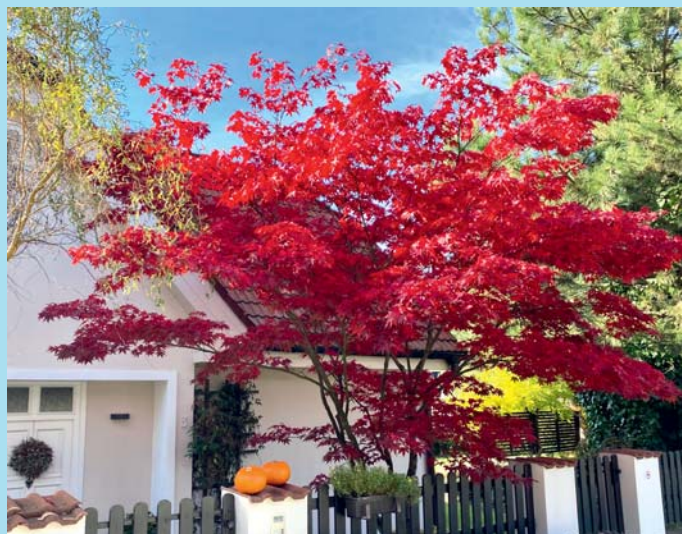
Podzimní důkaz.