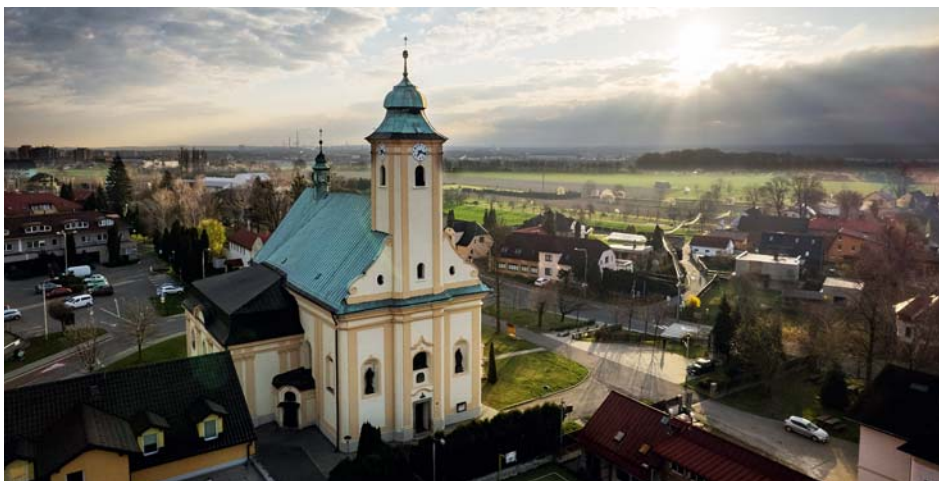
Kostel svatého Jana Nepomuckého.