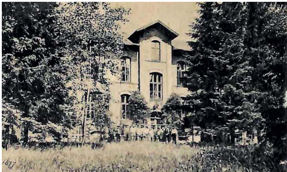
Pohlednice Rekonvalescentu kolem roku 1938.