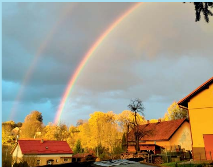
Duhová Bělá.