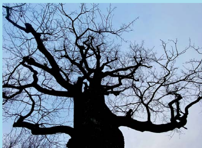
Památný strom.