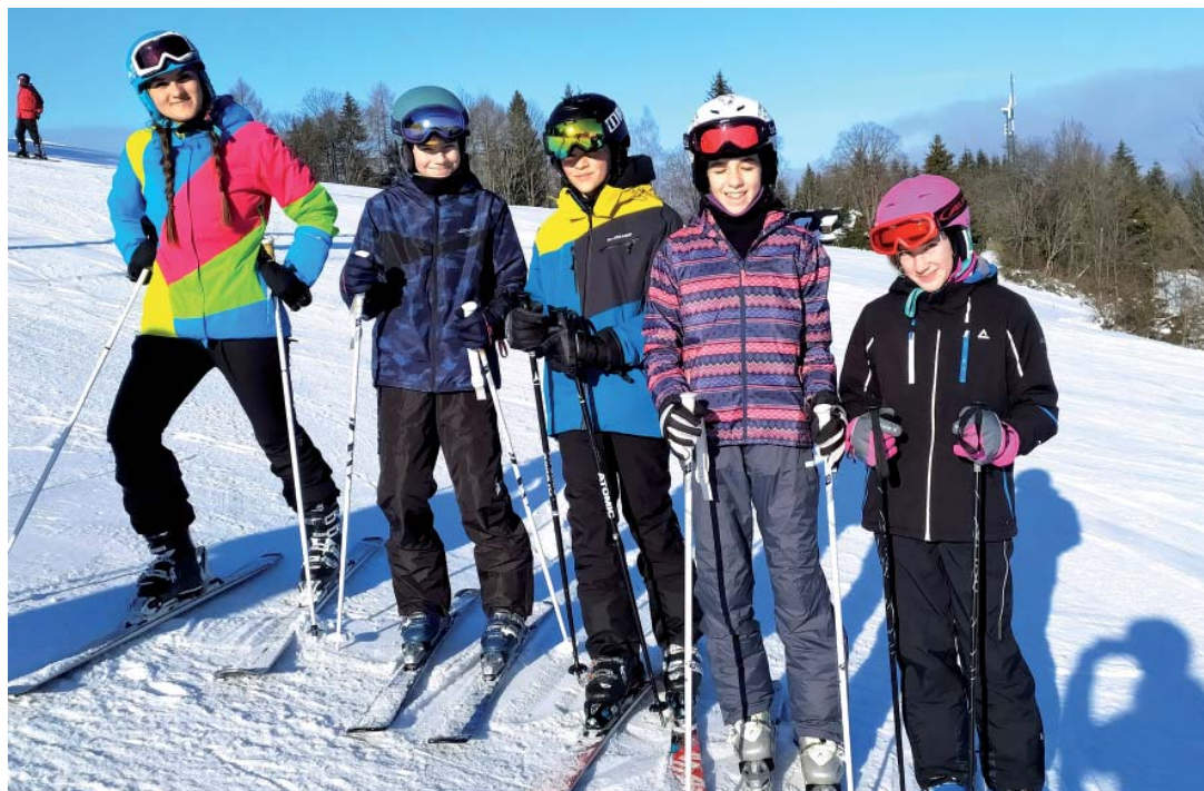
Kromě svahu a sjezdového lyžování děti zkusily i běžky.