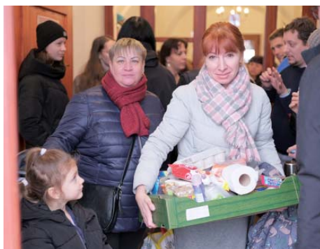
Ukrajinské ženy jsou za pomoc rády.