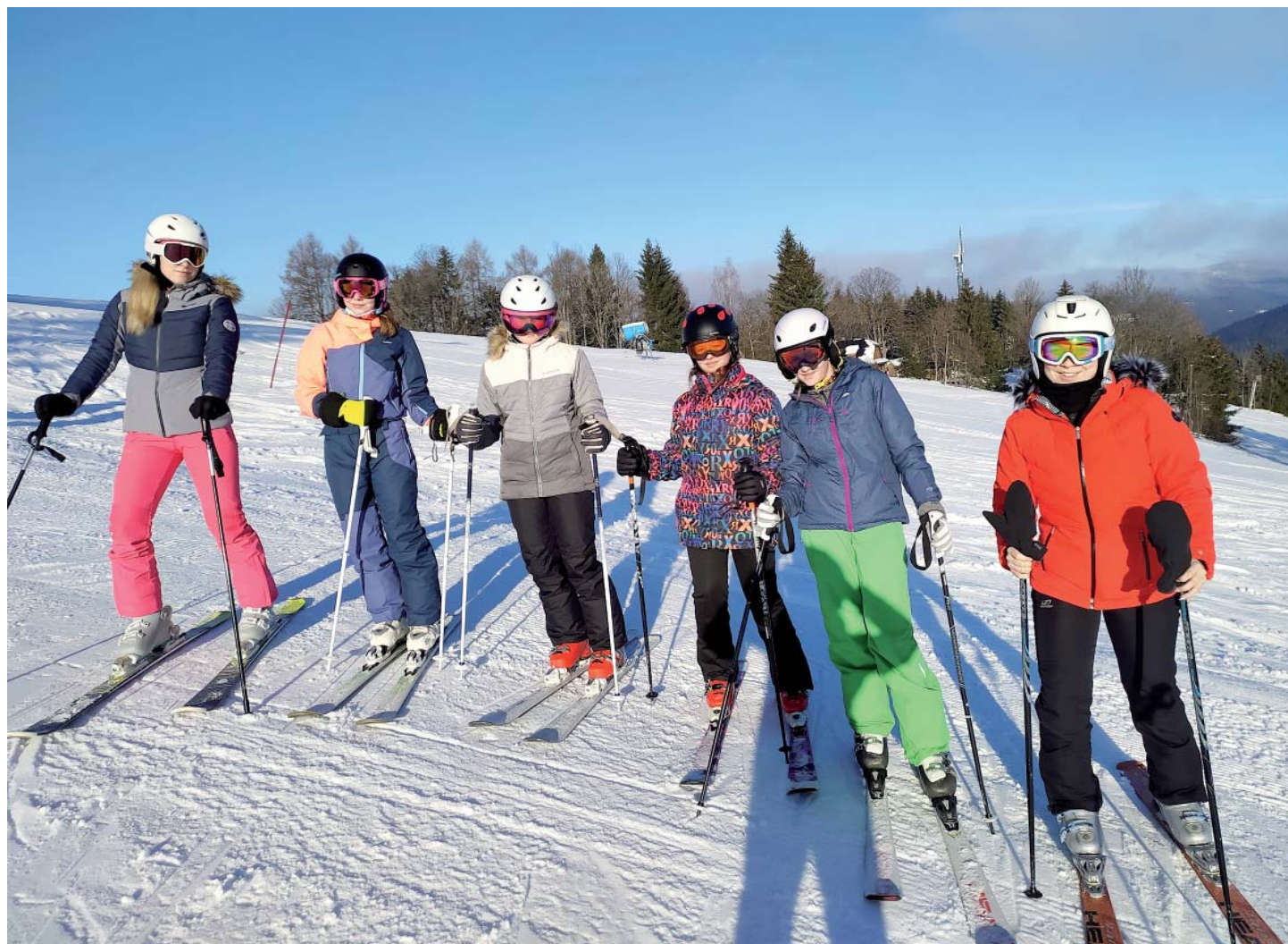
Zimní počasí, zdravý vzduch, pohyb. Ideální kombinace.