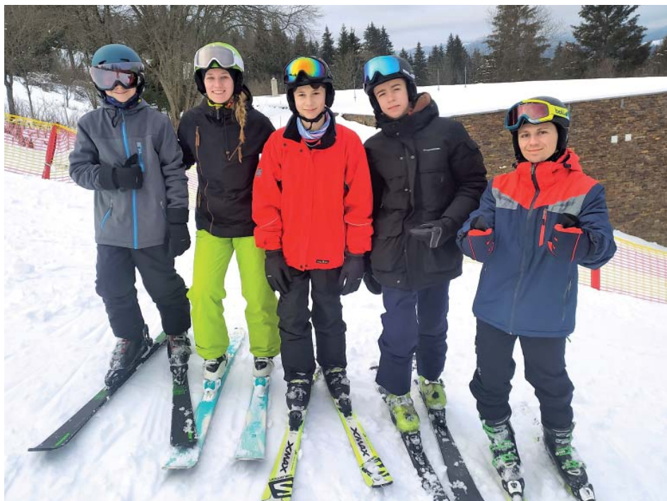
Konec prvního pololetí strávili sedmáci na lyžích.