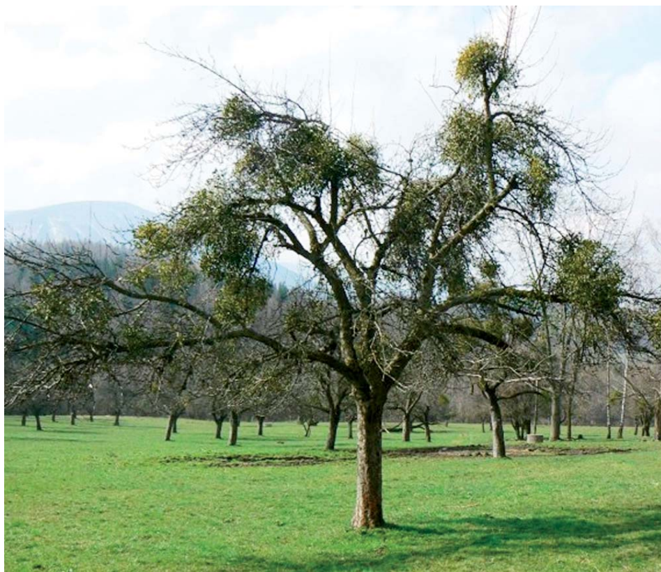
Mechanicky odstranit jmelí nestačí, ve dřevě zůstanou jeho kořínky.

Stromu s dobrou vitalitou a v dobrém zdravotním stavu se pokoušíme pomocí odstraněním jmelí. Nejpoužívanější metodou je odřezání větve alespoň půl metru od místa růstu jmelí tak, aby nedocházelo ke zpětnému prorůstání jmelí z haustorií. Další možností je vylomit keřík z větve, ale zde často dochází k opětovnému rychlému nárůstu. Ke stejným výsledkům docházíme i při postřiku jmelí přípravkem Cerone 480+, který způsobí rozpad keříků, ale nezahubí haustoria, takže v následujících letech se obrost vrací. Návratnost jmelí po ošetření uvedenými metodami je různě rychlá, ale bohužel téměř stoprocentní. Nejlepší metodou tak zůstává hlubší řez kombinovaný s postřikem Cerone 480+ na místech, kde řezat nelze, což je kmen nebo kosterní větve. Obecně platí, že jakýmkoliv opakovaným odstraňováním keříků v intervalu alespoň 2 až 3 roky lze další rozvoj napadení dlouhodobě blokovat.