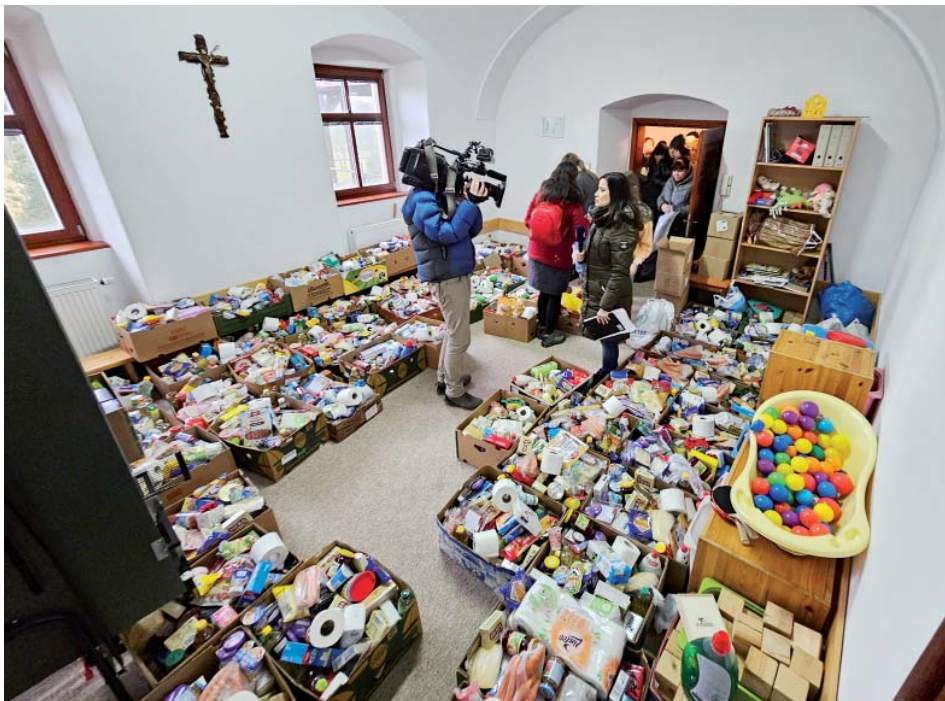
Potraviny, drogerie. Materiální pomoc je stále užitečná.