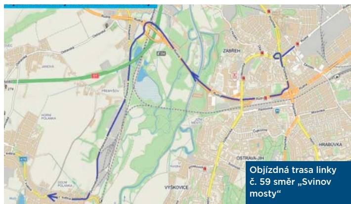
Objízdná trasa linky č. 59 směr „Svinov mosty“