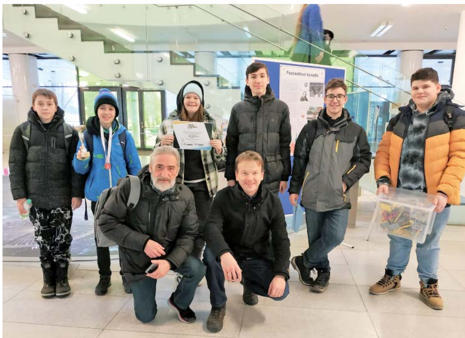
Starobělská žáci se probojovali do finále, nakonec skončili stříbrní.

V robotické soutěži se nám podařilo zajet jízdu s nejvyšším bodovým ohodnocením mezi všemi soutěžícími týmy, a to celkem s velkým předstihem. Z dopoledního programu pak postoupily čtyři nejlepší týmy do odpoledního semifinále. V semifinále jsme byli opět bodově nejlepší, a tak nás čekaly dvě finálové jízdy proti týmu z Gymnázia Zábřeh na Moravě, který v soutěži v loňském roce reprezentoval Českou republiku. Jedna jízda se nám bohužel nepodařila. Přesto jsme dosáhli na krásné 2. místo.