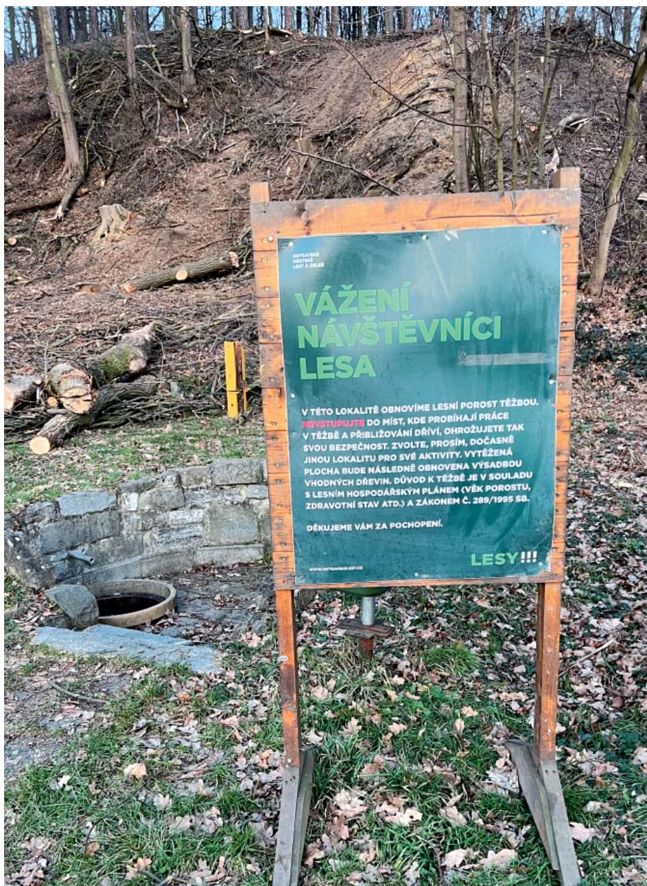
Lesníci rozmístili u lokalit, kde pracují, informační tabule.

terénu vydají s pilami a těžkou technikou. Pokud musí těžít poblíž domů, je proces technologicky náročnější a dražší. Často musejí povolát lesnické traktory, díky nimž regulují směr, kterým strom padá. „V případě porostu u ulice Na Popí bylo potřeba vysokozdvizné plošiny a v drtivé většině kácených stromů také horolezeckou metodu. Asistence horolezců jsme využili také v porostu na ulici Proskovická,“ popsali lesníci.