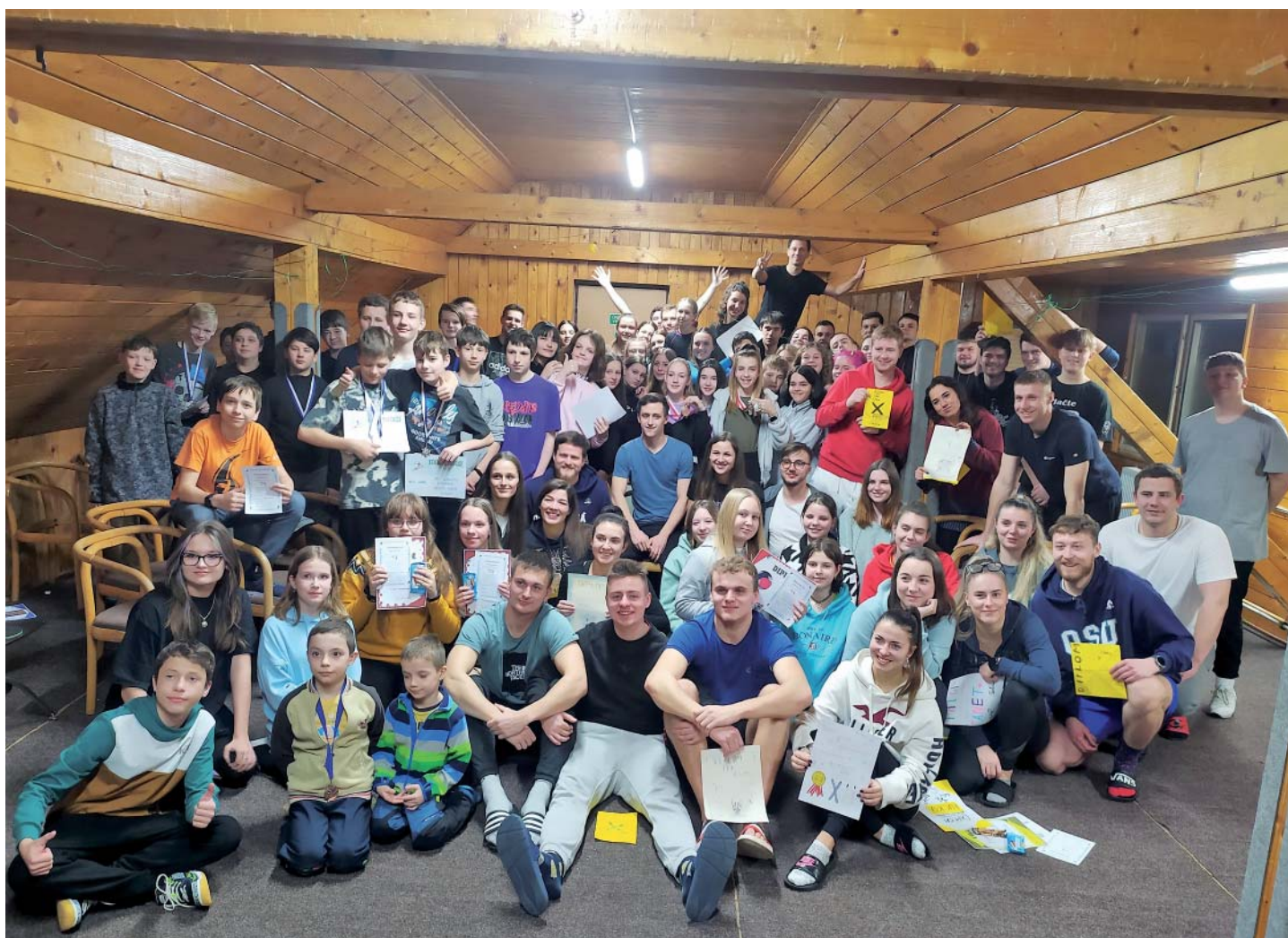
Žáky už tradičně učí lyžovat studenti tělesné výchovy Ostravské univerzity.