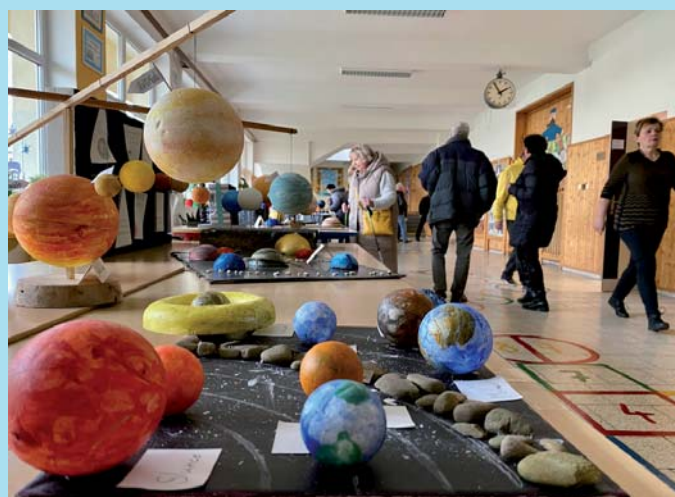
Sluneční soustavy.