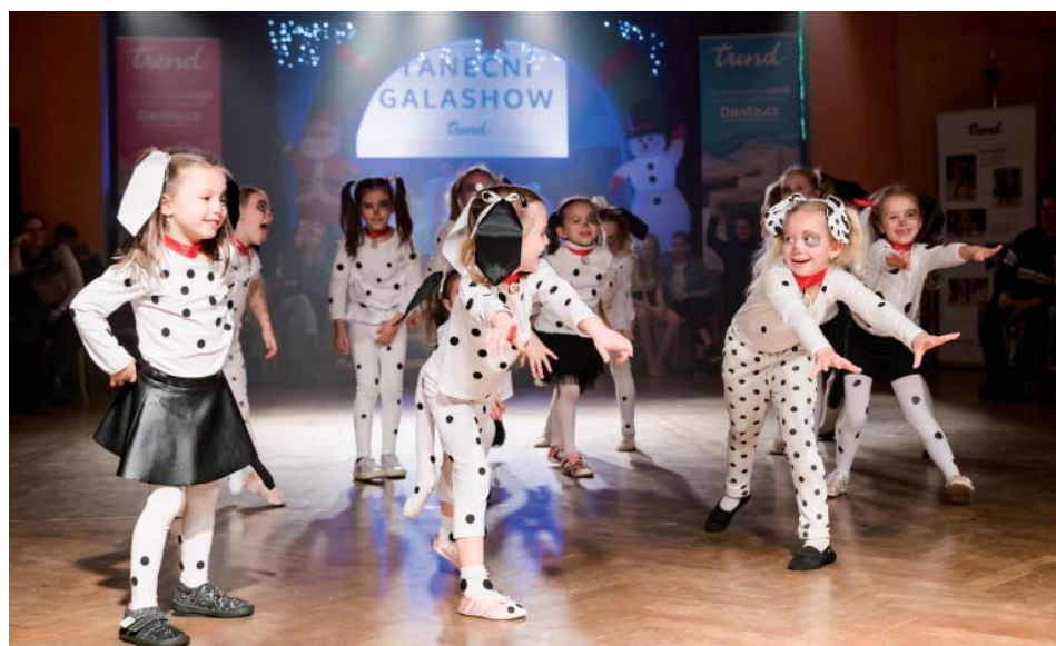
Když jsou na parketu dalmatini. Celá smečka.

Pokud partner řekne, že to pro druhého udělá, může snadno zjistit, že tančit není tak složité. A pokud skutečně řekne ne, máme i kurzy pro zájemce bez partnera – sólo ženy, kde dámy tančí samostatně, nebo ProAm lekce, kdy spolu tvoří pár profesionální tanečnicki a laik. Takže má možnost úplně každý – i ten, kdo přijde sám. (joh)