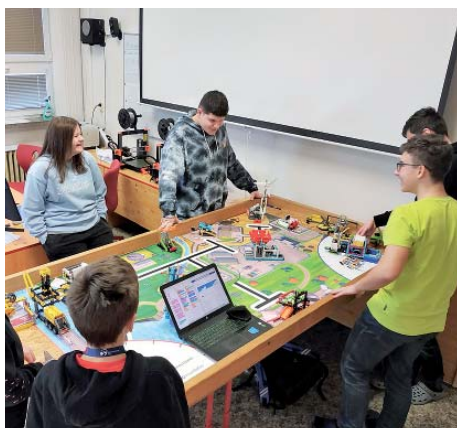
Na únorovou soutěž se žáci chystali od září.