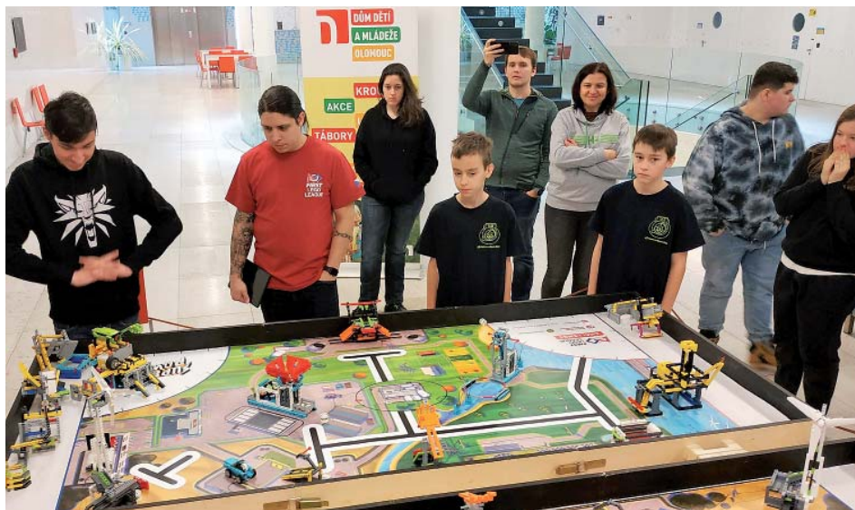
Roboti z Lega museli plnit zadané úkoly. Co nejspolehlivěji.

Příprava na soutěž trvala od loňského září do začátku letošního února. Žáci měli za úkol postavit ze stavebnice Lego robota a k němu sestavit příslušenství, takzvané přístavby, které robotu pomohou splnit co nejvíce předem daných úkolů. Cílem bylo nasbírat co nejvíce bodů za 2,5 minuty. Robot musel vyjet samostatně ze základny, splnit naprogramovaný úkol a vrátit se sám zpět na základnu.