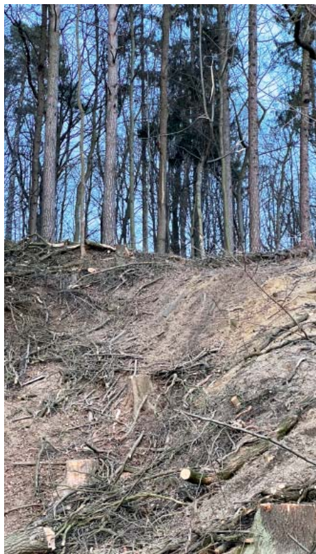
Jedna ze strání na dolním konci.

Pokročilý věk lesa, jeho špatný zdravotní stav, nestabilní stromy ohrožující návštěvníky nebo blízké nemovitosti – to jsou nejčastější příčiny, proč se lesníci do