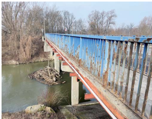
Most je ve velmi špatném stavu, zrekonstruován měl být již loni.

vyhrála firma Strabag. Dostane za ní 54,2 milionu korun – 49,1 milionu zaplatí kraj, 5,1 milionu město. „K navýšení ceny došlo v souvislosti s aktualizací cenové úrovně rozpočtových nákladů stavby, ve spojitosti také se zvýšenou mírou inflace a v neposlední řadě s doplněním většího rozsahu úprav navazující komunikace, která nebyla opravena v době probíhající celkové rekonstrukce vozovky v roce 2021 a 2022,“ vysvětlil Jahn, co stojí za navýšením ceny.