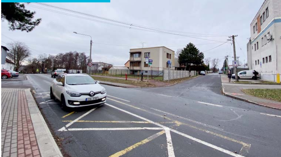
Část ulic Blanická a Ruskova čeká kompletní výměna za nový typ potrubí.