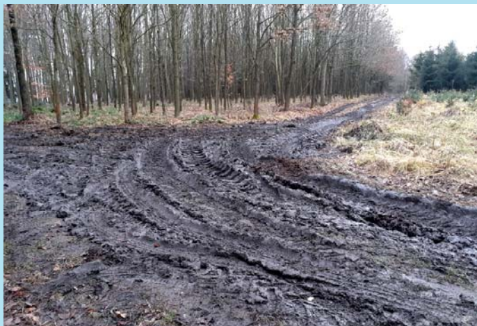
Nešťastné dílo, které napáchali v Palesku lesní „odborníci“.