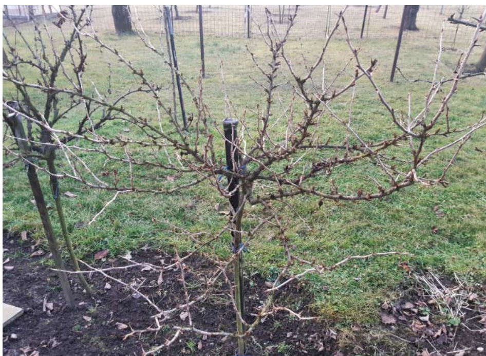
Angrešt často raší již počátkem března, proto s jeho řezem začneme už nyní.

Pokud počasí dovolí, můžeme koncem února připravit také pařeniště.