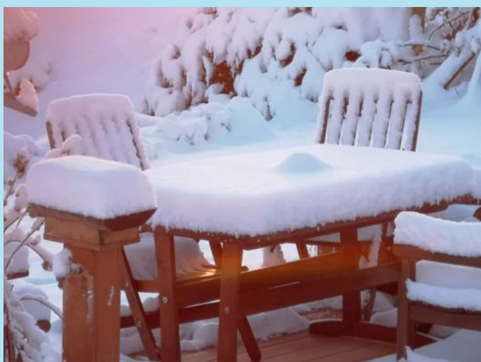
Úplně jako v pohádce.