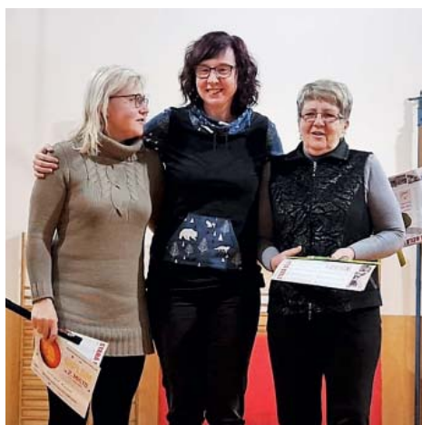
Tři dámy, kterým to šlo nejlépe.