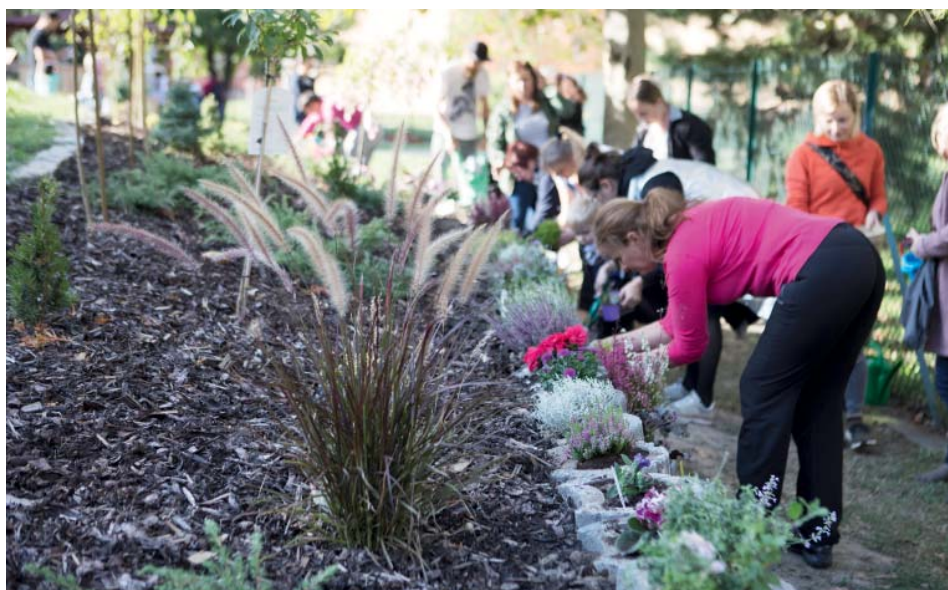
Díky předchozím pěti ročníkům výzev se povedlo uskutečnit řadu nápadů.