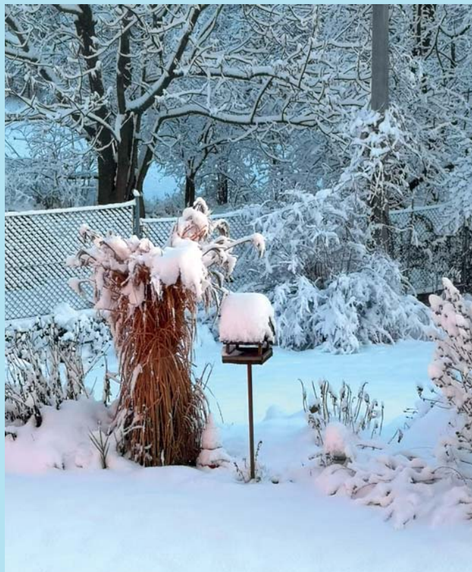
Ranní pohled.