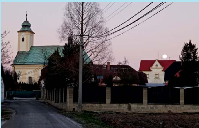
Měsíc v úplňku.