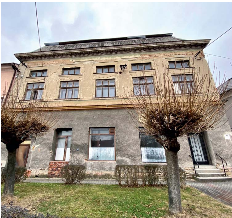
Zlatý jelen kdysi býval chloubou Staré Bělé.

Obavy z dalšího využití nemovitosti mají především přímí sousedé.