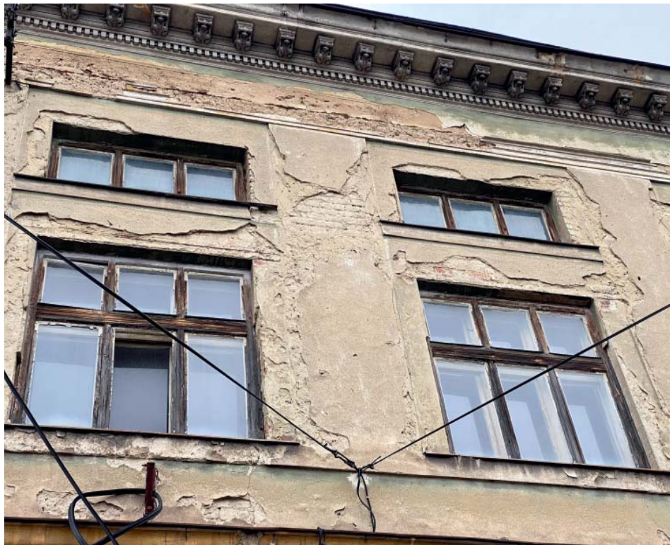
Dům potřebuje kompletní rekonstrukci.

Zpráva potěšila především Starobělany, kteří měli z projektu obavy. Řadu