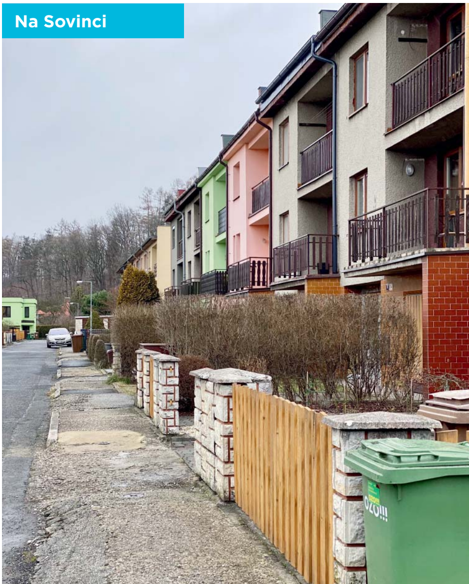
V lokalitě Sovinec se bude kopat nová kanalizace.