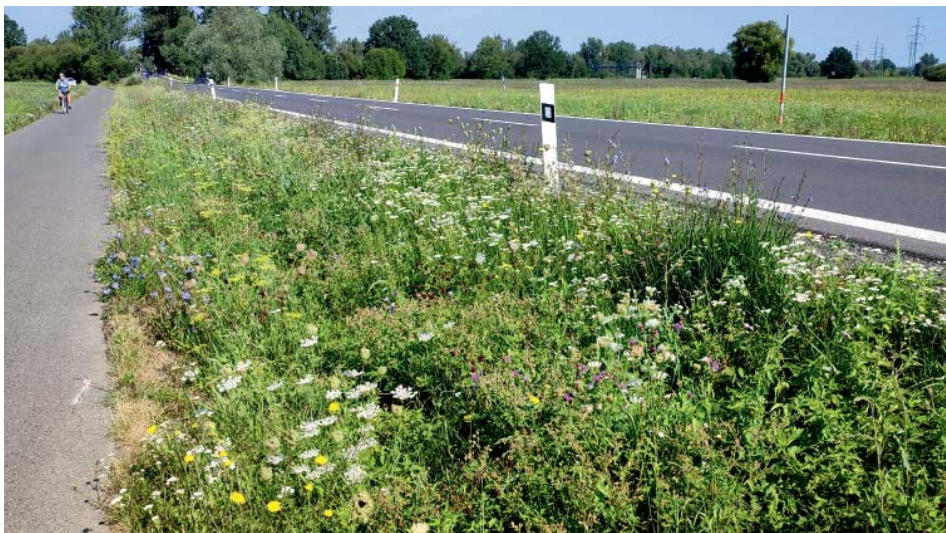
Jedinou rostlinou, na které se může modrásek rozmnožovat, je krvavec toten.