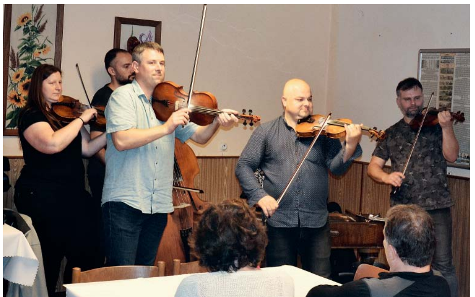
Posezení i letos zpříjemnila cimbálovka Úsměv.