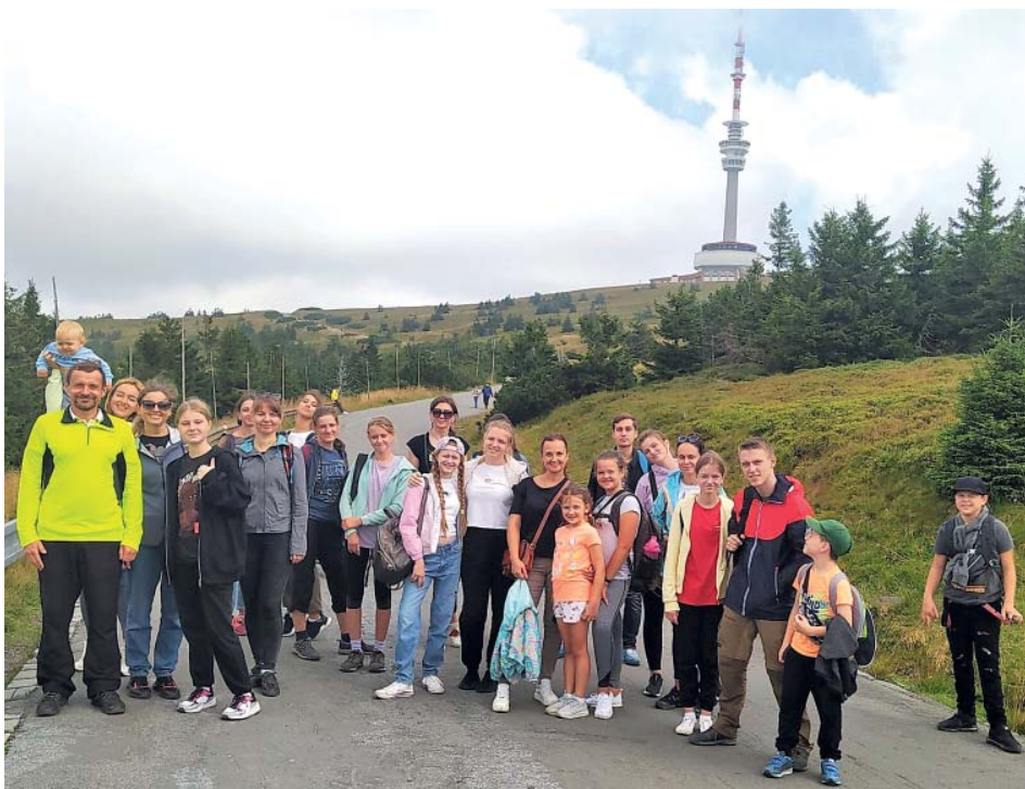
Z výletu na nejvyšší jesenický vrchol.