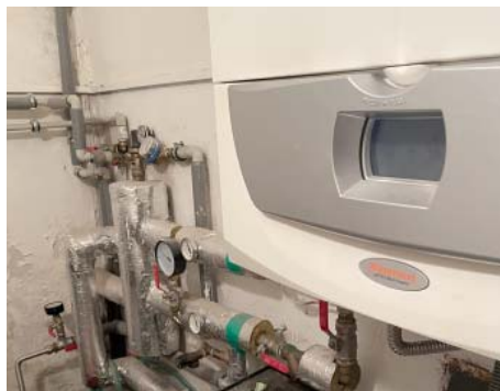
Obec topí plynem.

spotřebu více než desítky objektů v obci. „Je v tom úřad, zdravotní středisko, byty nad střediskem, nad školou a pro seniory, nebytové prostory Gregárek, spotřeba u údržby, což je objekt u jízdárny. Dále spotřeba na hřbitově, na koupališti, v hasičské zbrojnici a ještě jsou malé odběry v areálu zemědělského družstva a u rybníka u koupaliště,“ vyjmenovala. Část uhrazených nákladů na energie však