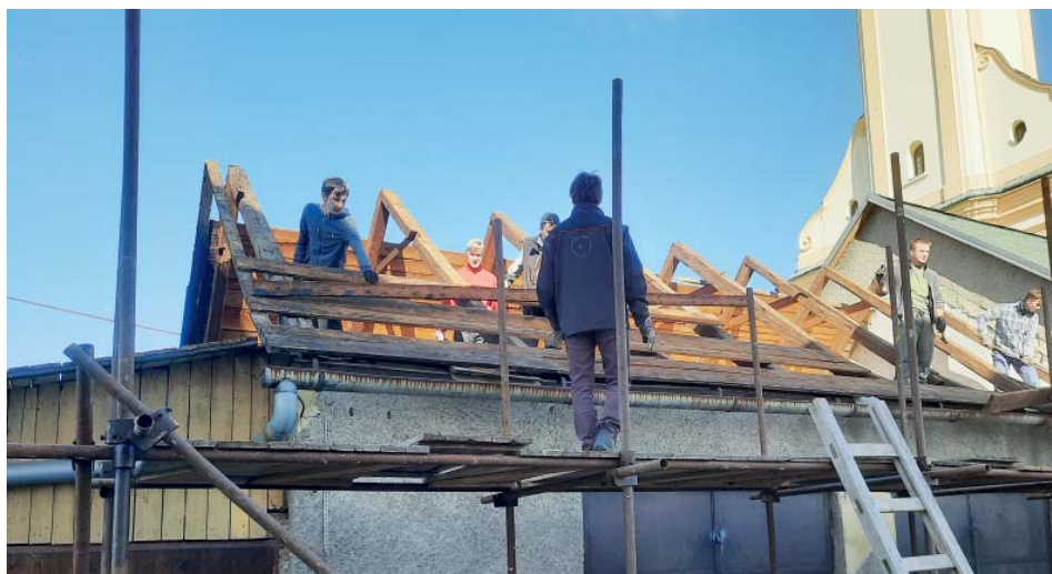
Do zimy je nutné mít hotovou střechu.