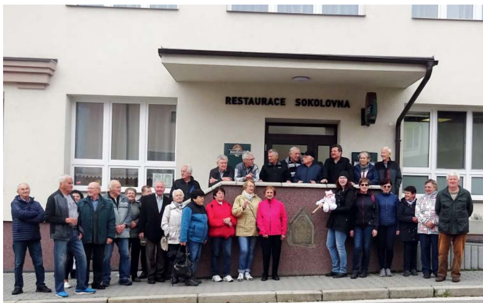
Stavba místní sokolovny začala před sto lety. A cvičí se v ní dodnes.

Někteří si jistě ještě vzpomenou na dobu, kdy tělocvičná činnost byla přesunuta do kulturního – tedy Katolického – domu, později pak do školní tělocvičny. V sokolovně se v roce 1926 začaly promítat filmy, vzniklo tam kino. Postupem doby však tělocvična ve škole nedokázala pokrýt vzrůstající nároky sportov-