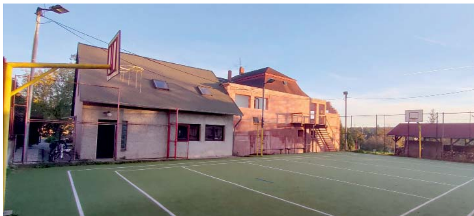
Skauti se pustili do rozsáhlé rekonstrukce svého zázemí.

Zajímá vás, jak přesně chceme klubovnu přestavět? Rekonstrukcí vznikne v podkroví nezávisle přístupná společenská místnost, sociální zázemí a příruční sklad. V přízemí bude přehledný, garážovými vraty přístupný sklad táborového