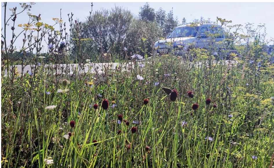
Díky dohodě mezi ochránci přírody a obcí Stará Bělá má motýl ideální podmínky podél cyklotrasy u Honculy.

se, že ve velkém hnízdě může dokončit vývoj až několik desítek housenek. Ty v mraveništi přezimují, na jaře se tam zakuklí a po vylíhnutí motýl rychle opouští mraveniště. Na sobě má šupinky, které se uvolňují, když se jej mravenci snaží neúspěšně chytit, v té době už totiž nevylučuje feromon, který předtím mravence přitahoval a housenku tím chránil.