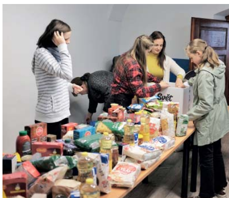
Potraviny jsou stále potřeba.

V neděli 2. října se konalo setkání ukrajinských rodin z Ostravska na faře ve Staré Bělé – příjemné posezení u kávy, čaje, popovídání o radostech i starostech a běžných problémech. Připravili jsme pro každou rodinu také dárku jídla a poukázky do Tesca v celkové hodnotě 40 tisíc korun, zakoupili jsme je z darů farníků. Velké díky všem dárcům potravin a drogerie – především farnosti Ostrava-Zábřeh a P. V. Řehulkovi, farnosti Krme-