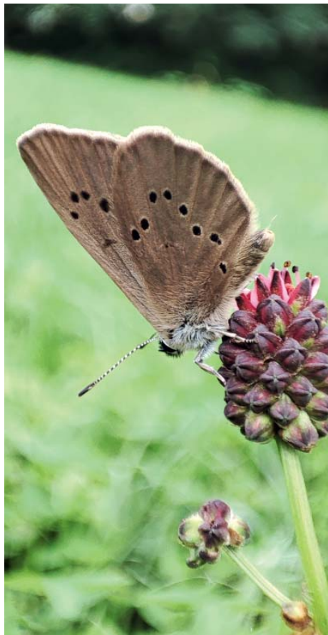
Základní barva svrchní strany křídel modráška bahenního je hnědá.

Tento ohrožený druh našich denních motýlů má velice zajímavý životní cyklus. Jedinou rostlinou, na které se může modrásek rozmnožovat, je krvavec toten. Samička naklade vajíčka do květu krvavce, housenky po vylíhnutí vyvírají asi 2 až 3 týdny jeho květní hlávky. Poté květy opouštějí pádem na zem, kde čekají na transport do mravenčího hnízda, které musí být poblíž rostliny - asi do 2 metrů. Hlavním hostitelským druhem je mravenec žahavý ( Myrmica rubra ), který se nechá zmást feromony, které housenky vylučují, a celkově se snaží napodobit mravenčí larvu. V mraveništích jsou housenky krmeny nebo se živí mravenčím plodem - larvami a kuklami. Uvádí