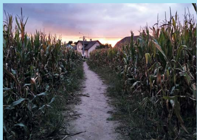
Mezi kukuřicí.