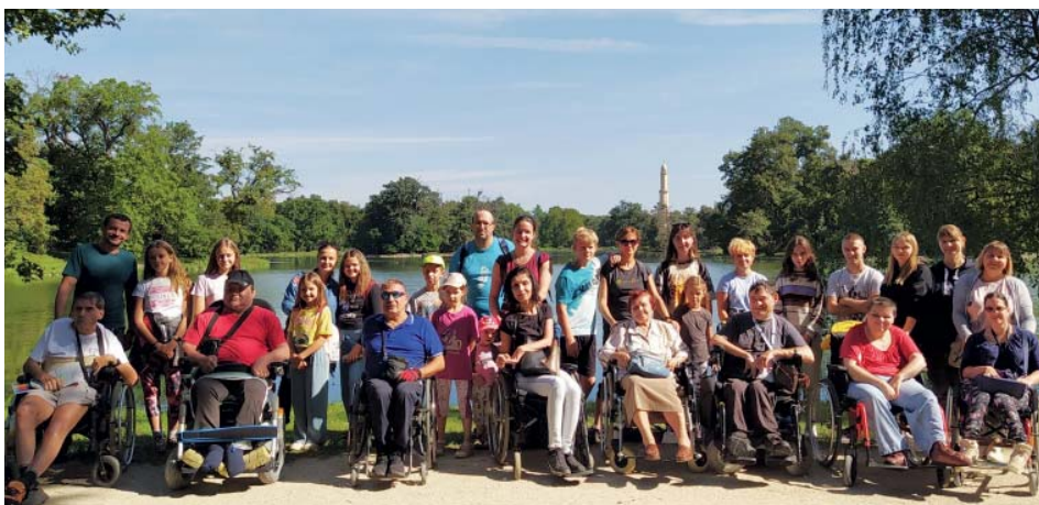
Na jihu Moravy jsme asistovali výletníkům z Hrabyně.