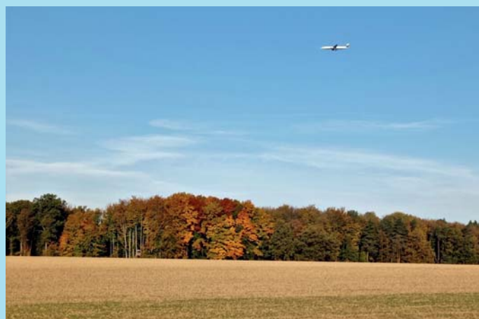
Podzim na Drahách.