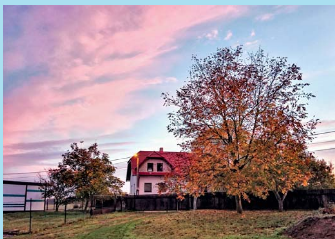
Podzimní den.