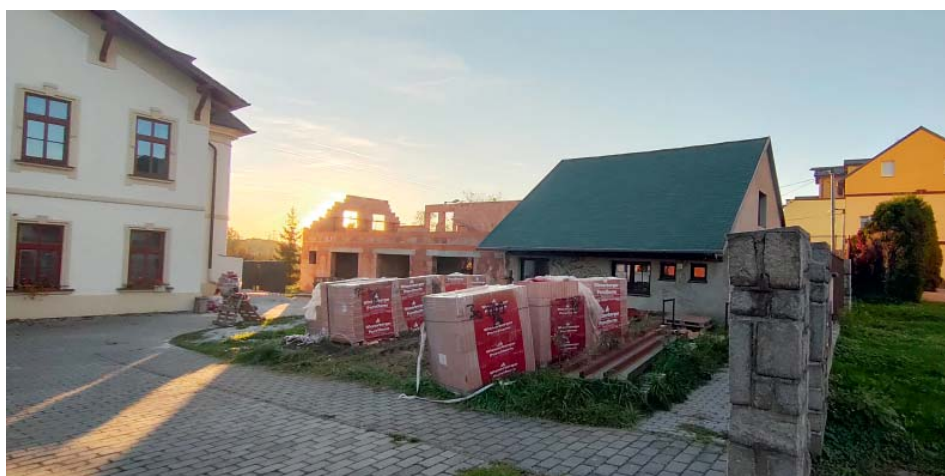
Na kompletní přestavbu přispívají nadace, obce i dárci-jednotlivci.

materiálu a tři prostory sloužící farnosti – dvě garáže a sklad.