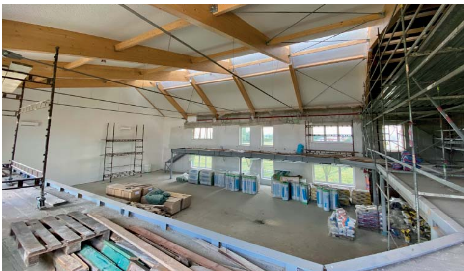
V největším sále bude možné pořádát taneční soutěže.

jim bude vyhovovat, a k tomu si přivést a servírovat vlastní občerstvení. „Jediné, co tady nebudeme provozovat, je restaurace,“ upřesnil podnikatel.