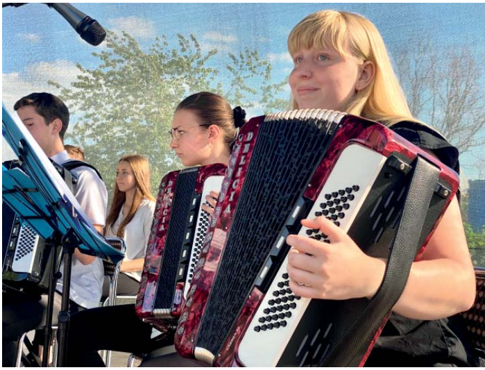
Zahráli žáci Základní umělecké školy Viléma Petrželky.