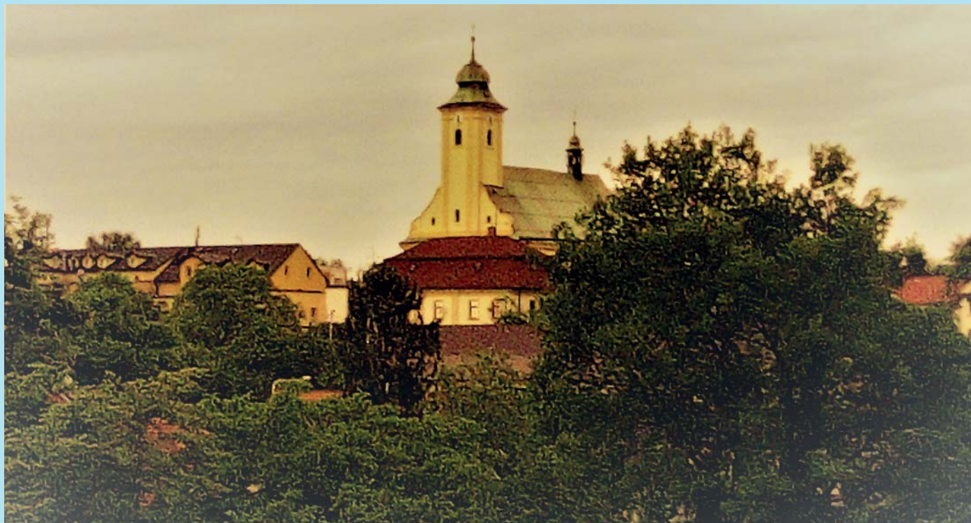
Jako ze staré pohlednice.