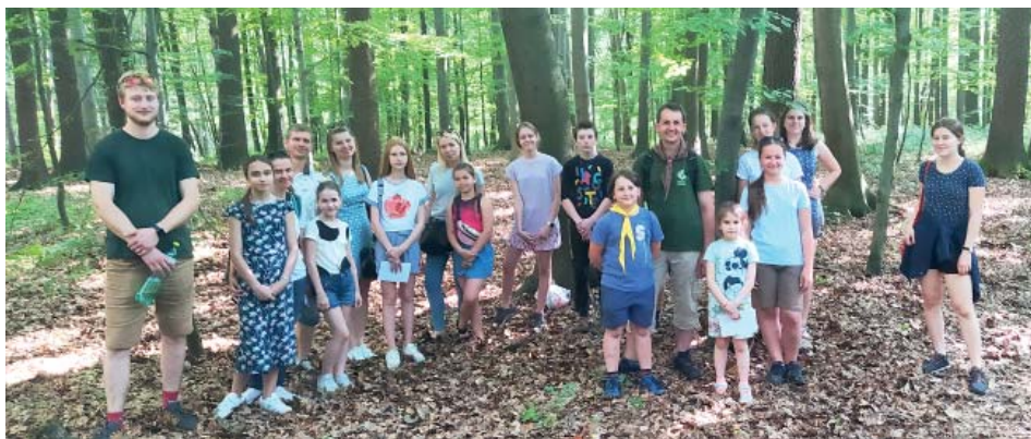
Skauti připravili odpoledne plné her v Bělském lese.

vity pro ukrajinské děti a rodiny – starobělská skauti zorganizovali pro ukrajinské děti v neděli 12. června odpoledne her v Bělském lese. Maminky ze spolčenství Skřítko kvítka připravily v neděli 19. června Dětský den na farní zahradě, zúčastnili se děti i rodiče z českých i ukrajinských rodin.