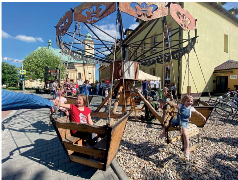
Dřevěný kolotoč udělal dětem radost.

ně mění k lepšímu. Například centrum Staré Bělé, kde se můžou lidé potkávat při kulturních a společenských akcích, to tady dlouhou dobu chybělo. Nebo velmi pěkná cyklostezka na dolním konci.