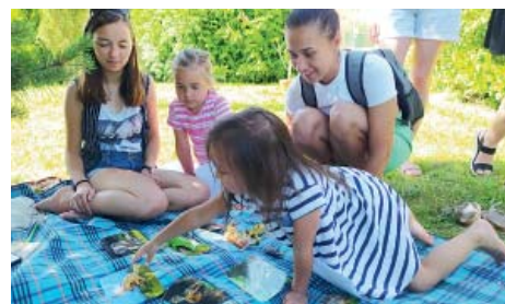
Soutěže připravily maminky ze Skřítko kvítka.