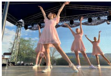
Vystoupení tanečnic Trendu.