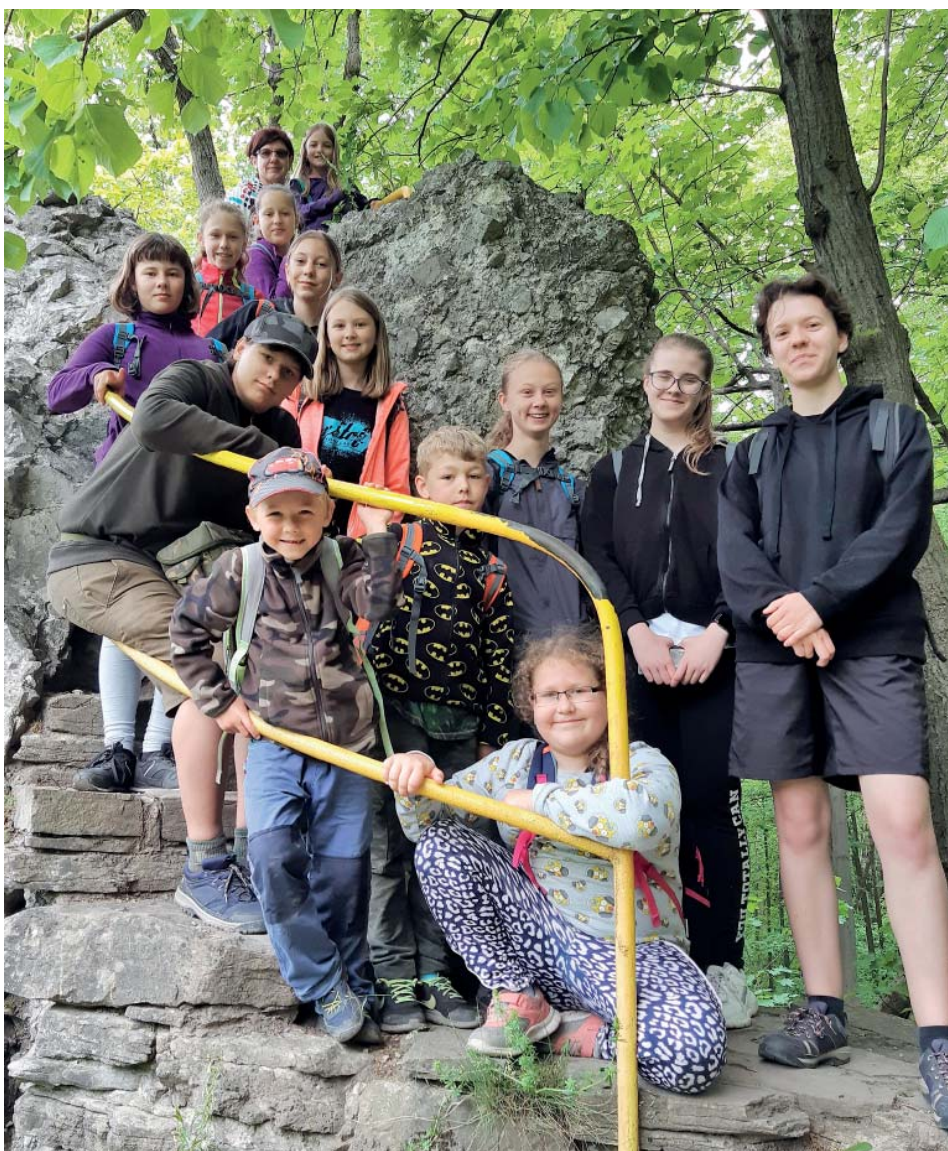
Výletníci vystoupali i na zříceninu hradu Šostýn nebo Raškovou vyhlídku.