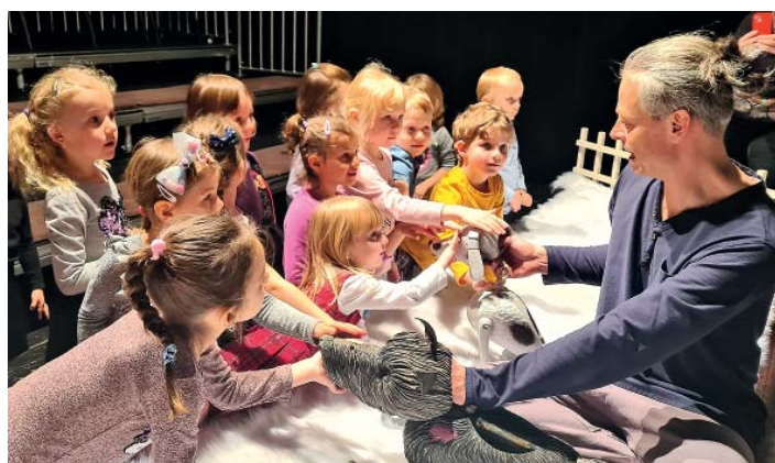
Psí hrdinové z loutkového představení se líbili.

V červnu jsme oslavili Mezinárodní den dětí s klaunem Hopsalínem, programem plným zábavy, tanečků, soutěží, balonků a bublin, a rozloučili se s předškoláky. Prožili jsme dopoledne s hasiči ze Staré Bělé a obvodu Ostrava-Jih. Na oslavách Dne obce jsme předvedli kulturní vystoupení, které mělo velký úspěch.