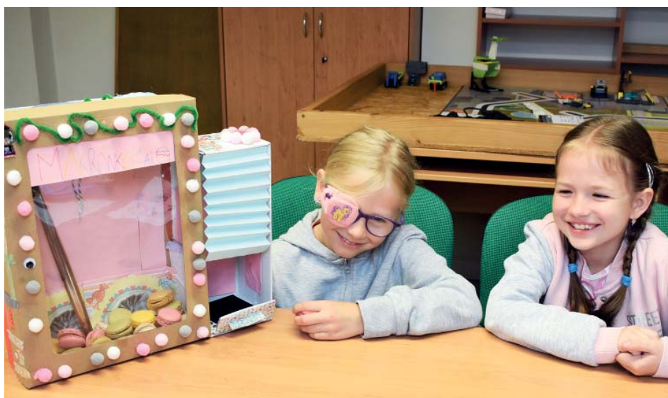
Automat na makronky, sen mnoha fanoušků laskomin.