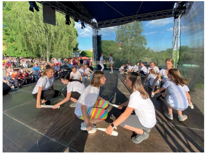
Žačky starobělského sokola.