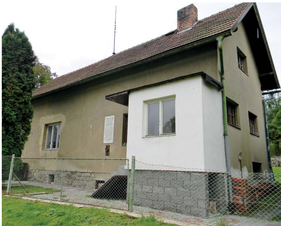
Ouběnice, Středočeský kraj. Dům, kde život starobělského rodáka skončil.