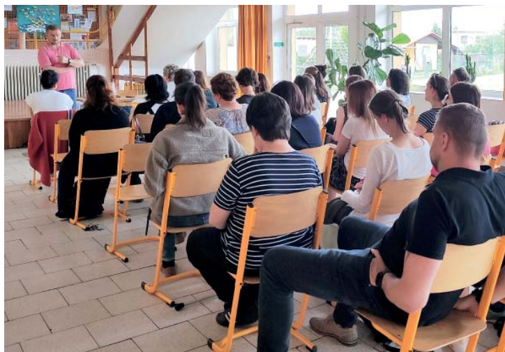
Přednáška byla pro každého, kdo se chce zdokonalit ve výchově.