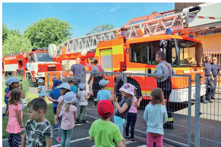
V dolní školce se zastavili hasiči. I s autem.