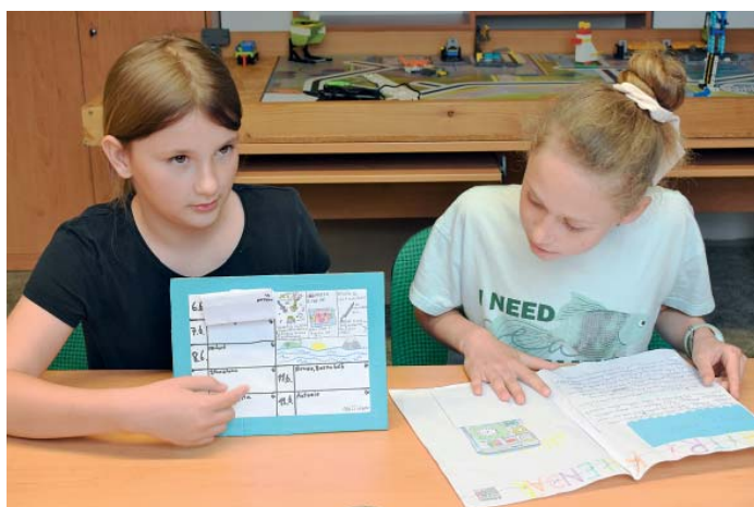
Chytrý kalendář je jedním z letošních úspěšných nápadů.