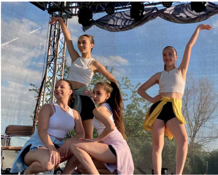
Pódium patřilo i tanci.