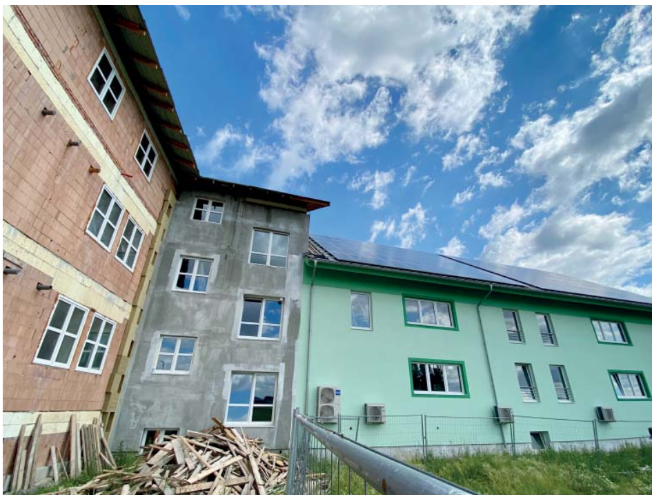
Stavba má půdorys tisíc metrů čtverečních. A na střeše sadu solárních panelů.

V přízemí investor zařizuje dvě kuchyňky s vybavením, tak aby si lidé mohli pronajmout sál o velikosti, která