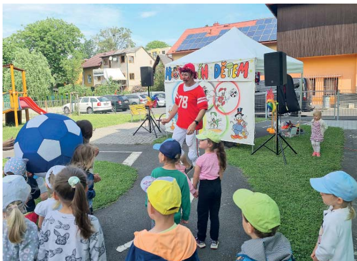
Zábavu s Hopsalínem si užily děti v horní i dolní školce.

V květnu jsme oslavili Den matek besídkou, které se zúčastnili i ostatní členové rodiny. Navštívili jsme Záchranou stanici zvířat v Bartošovicích. Společně jsme se vyfotili na školní fotografii a předškoláci na tablo, které bude k nahlédnutí v prodejně Hruška ve Staré Bělé.