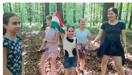
Ukrajinské děti si hry užily.