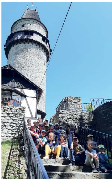
Trúba – jedna ze zastávek.