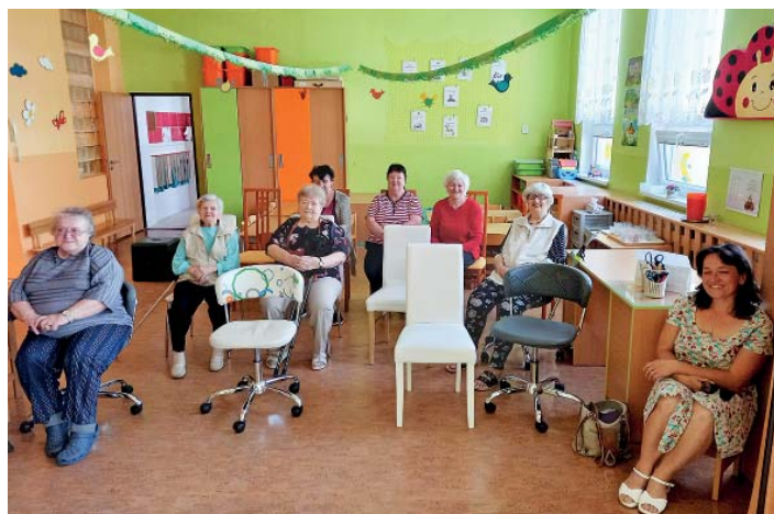
Děti z Blanické pozvaly na besídku i babičky.