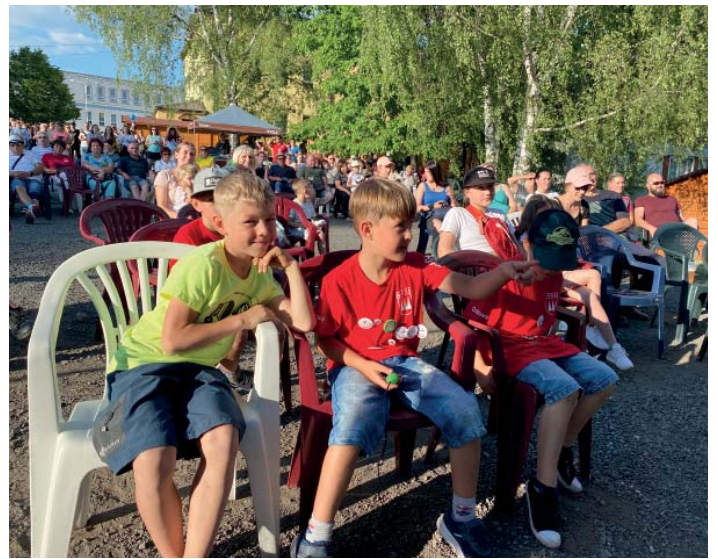
Účinkující podporovalo plné hlediště.