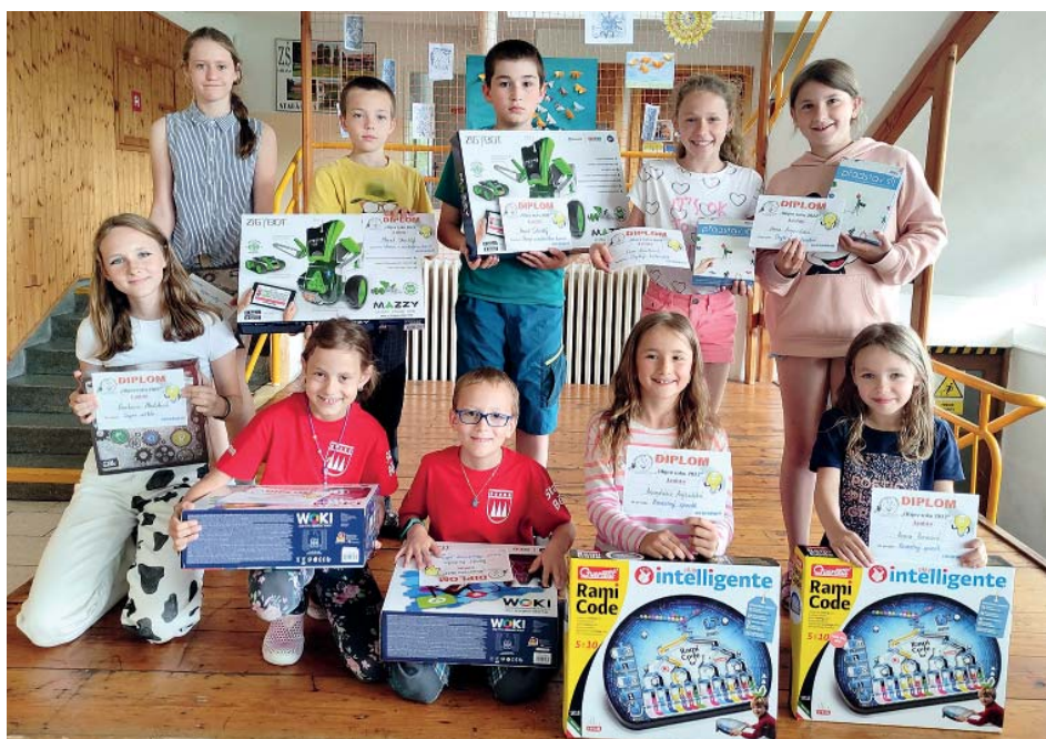
Letošní vítězové pospolu.