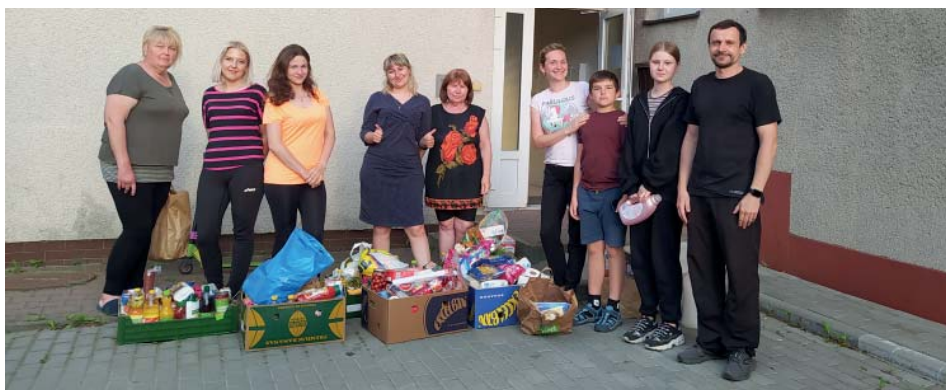
Sbírký potravin a potřebných věcí pokračují.