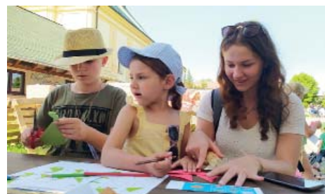
Na zahradě fary se konal dětský den.