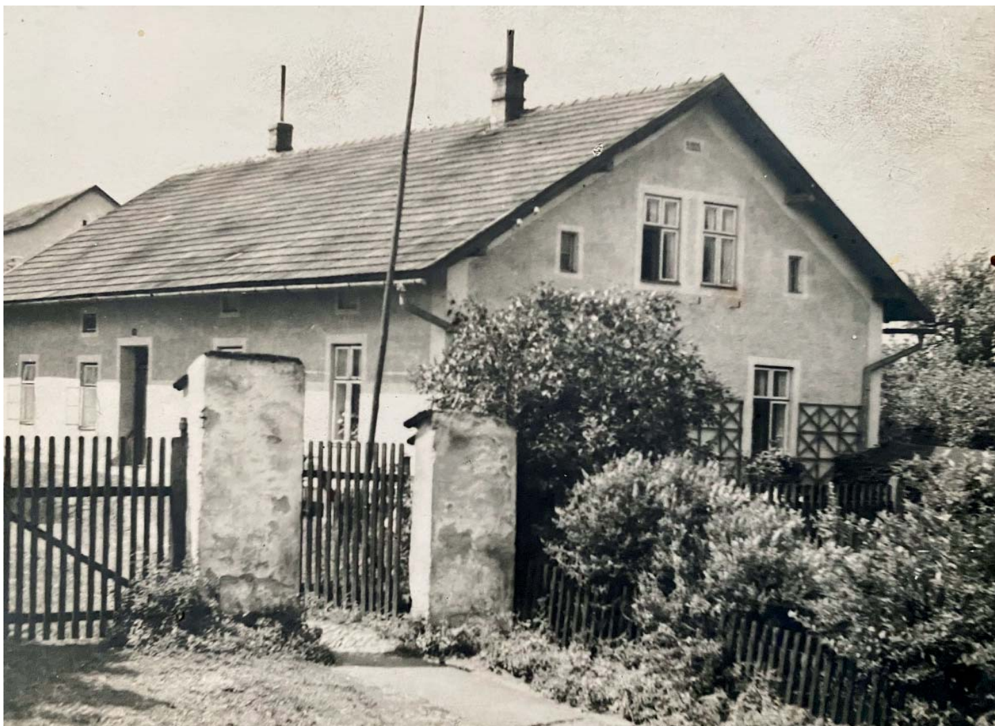
Lyčkův rodný dům ve Staré Bělé.

Zranění v oblasti obličeje, hlavně oka. Asi se to moc nelepšilo, protože když