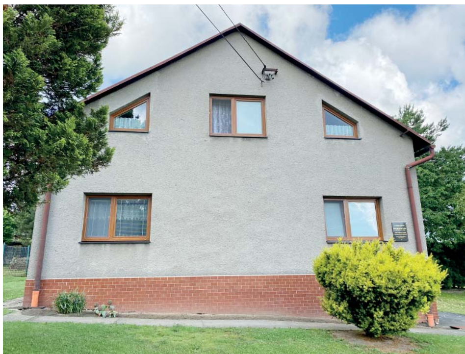
Rodný dům dnes. Je na něm pamětní deska. Celá ulice se na počest významného rodáka jmenuje Lyčkova.

V lékařské zprávě píšou: zastřelen gestapem do pravého spánku. Nechtěli uvést, že to byla sebevražda. Chtěli to napsat kulantně.