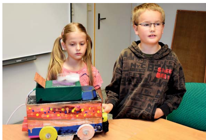
Kdo by nechtěl létající auto?