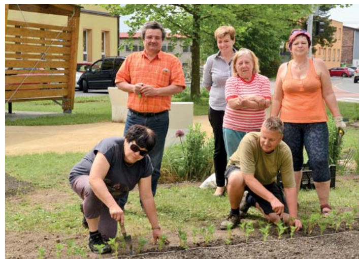
U pergoly v centru obce zahrádkáři sázeli nové rostliny.