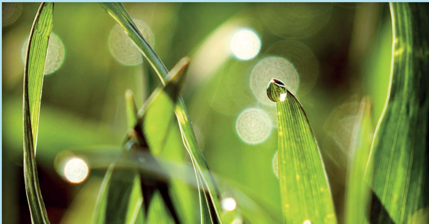
Ranní rosa z polí nad myslivnou.