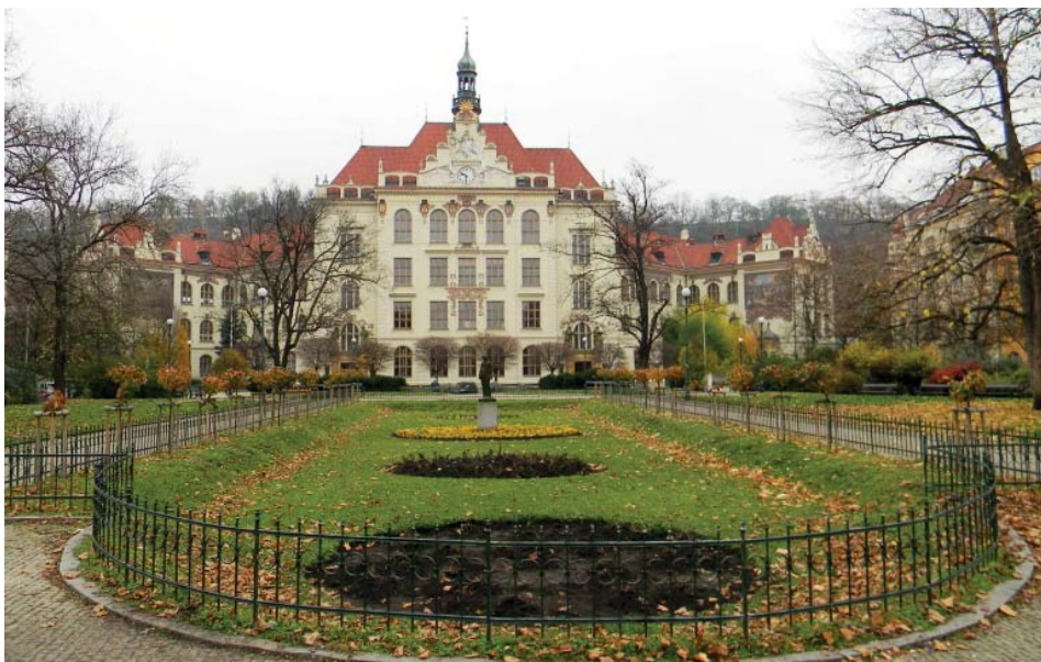
Základní škola na Lyčkově náměstí v pražském Karlíně. Secesní budova školy má více než 110 let.