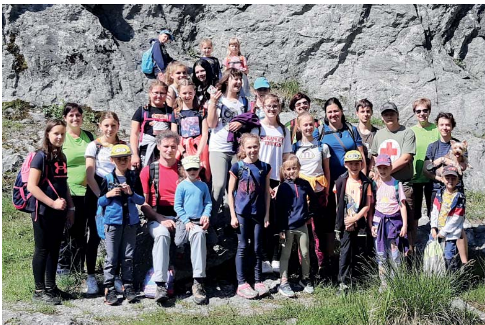
Starobělská výprava vyrazila směr Štramberk a Kopřivnice.