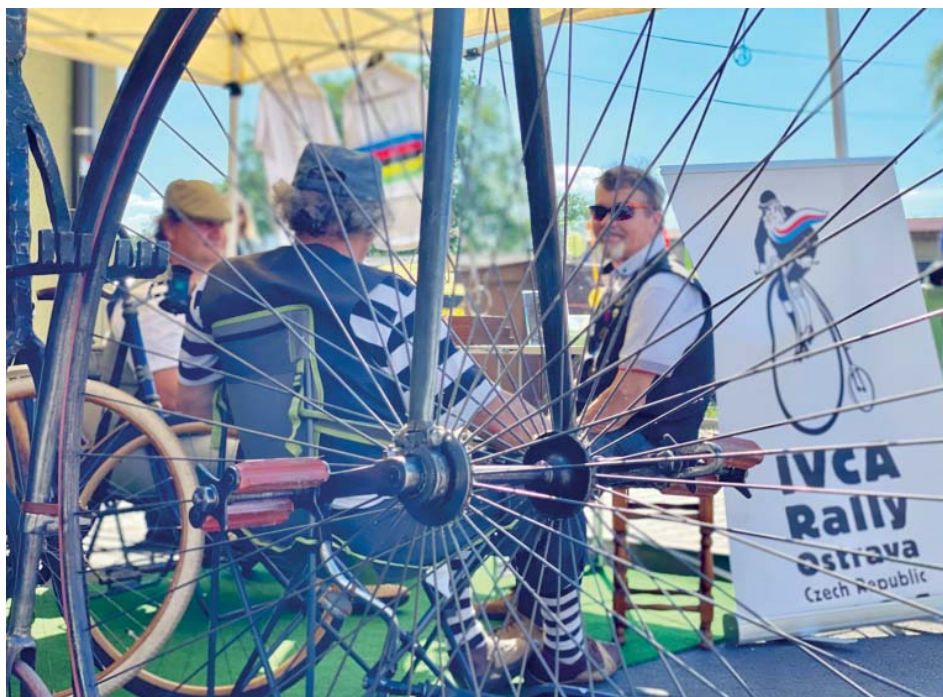
Své historické cyklistické skvosty přivezli velopedisté z Hrabové.