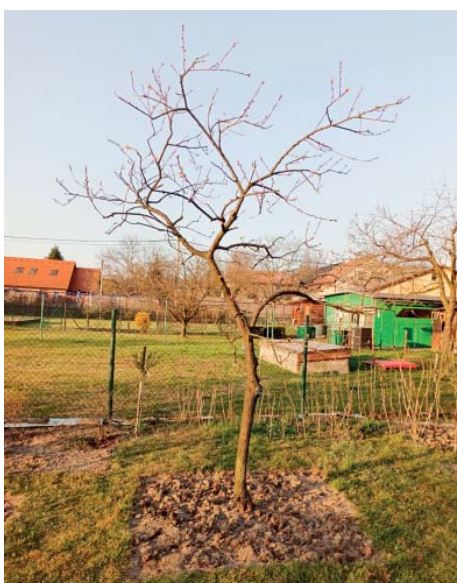
Vypletí příkrmenného prostoru a následné přihnojení stromům prospěje.

Březen je prvním měsícem, během kterého se pouštíme i do chemické ochrany. Ač nejsem příznivcem přílišného používání pesticidů, jsou choroby a škůdci, kteří zde zásadně limitují velikost sklizně u některých druhů. Mou filosofií je, že jsou lepší dva postřiky ve vhodnou dobu a vlastní úroda než stromy bez úrody a následný nákup ovoce z obchodů, které je stříkáno 25–30krát za rok. Toto číslo není nadsazené, třicet postřiků je běžný standard v produkčních sadech, zvláště v cizině.