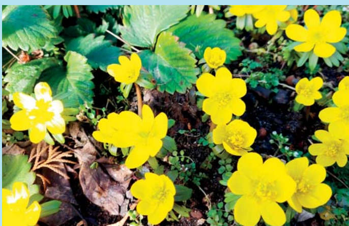
Talovíny vykvetly brzy.