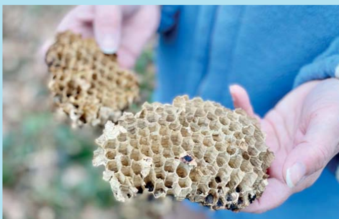
Poctivá práce.