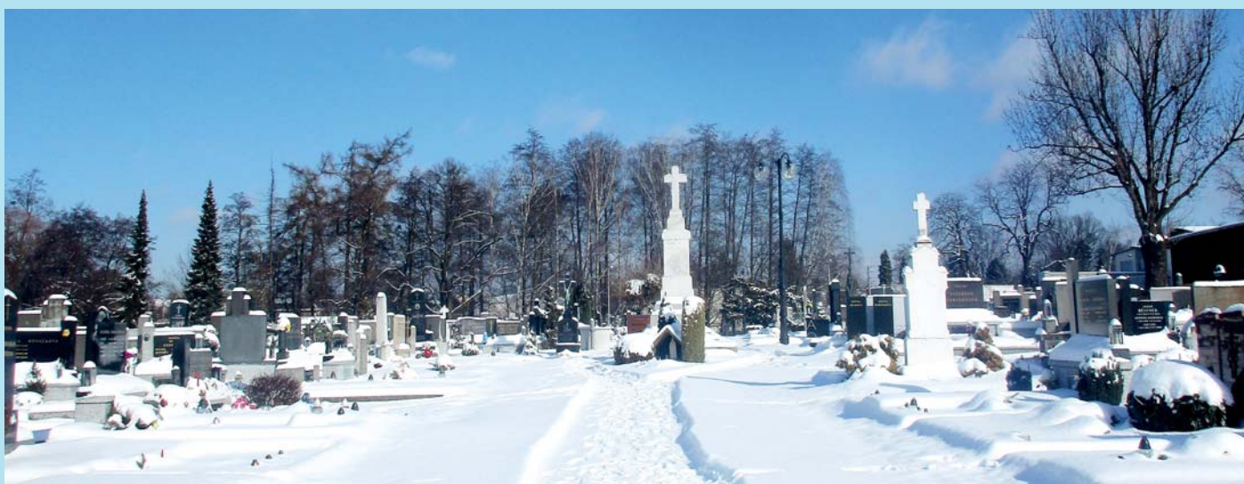
Zimní hřbitov.