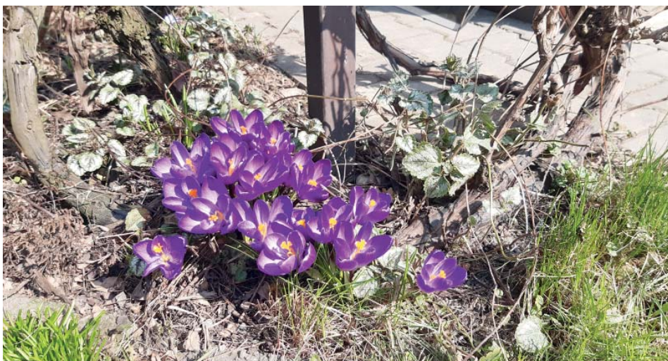
Rozkvetlé krokusy jsou symbolem jara.

Březen je nejvhodnější měsíc pro výsadbu broskvoní, můžeme však vysazo-