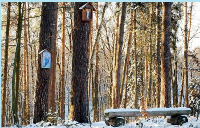
Lesní kaplička.