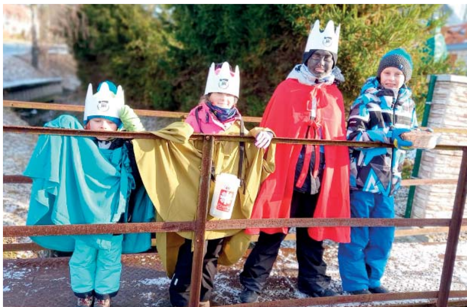
O Tři krále není ve Staré Bělé nouze.