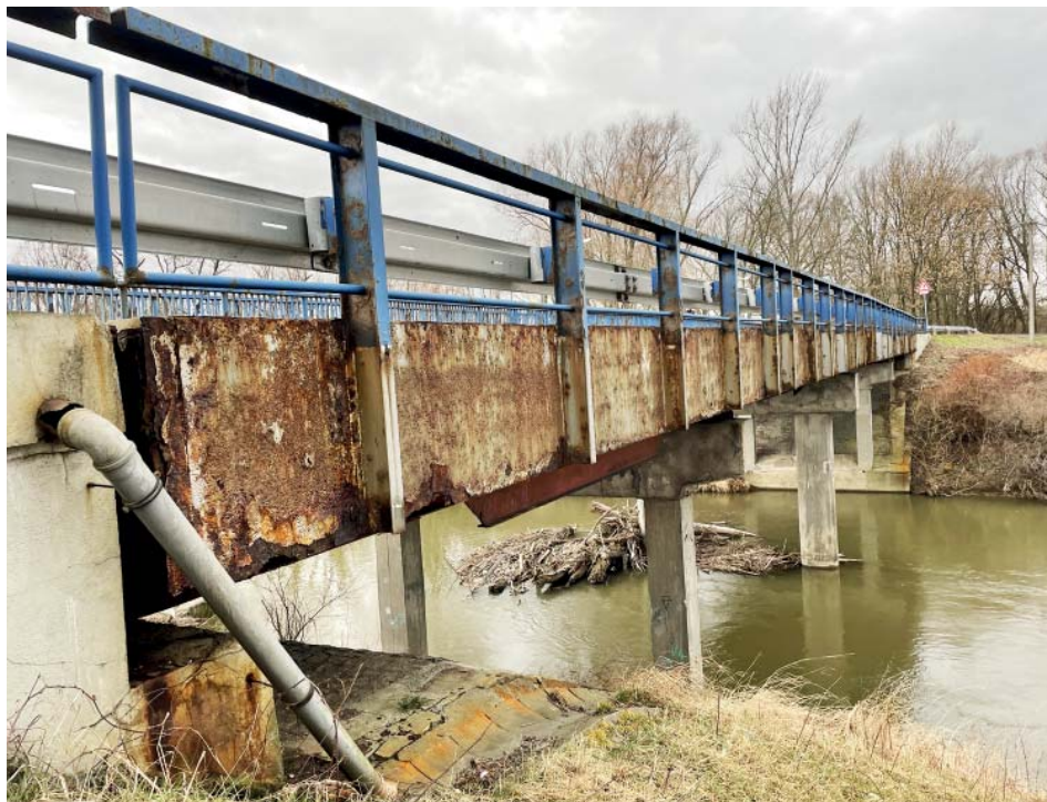
Stáří mostu? Není známo. Stav? Velmi špatný. Řešení? Demolice a stavba nového.