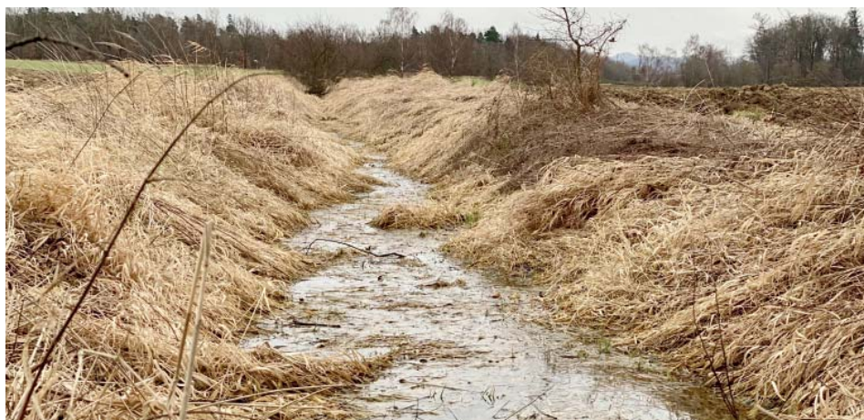
Potok v místě, než podteče pod Plzeňskou ulicí.