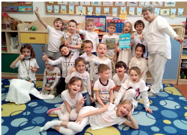
Do barev se oblékali žáci prvního i druhého stupně.

Každá barva měla svou vítěznou třídu z řad prvního a druhého stupně. Na závěr týdne se vyhodnotil i absolutní vítěz, který si odnesl hlavní cenu: den bez zkoušení, písemek a domácích úkolů plus sladkou odměnu. Celkovým vítězem prvního stupně se stala třída 3. A. Na druhém