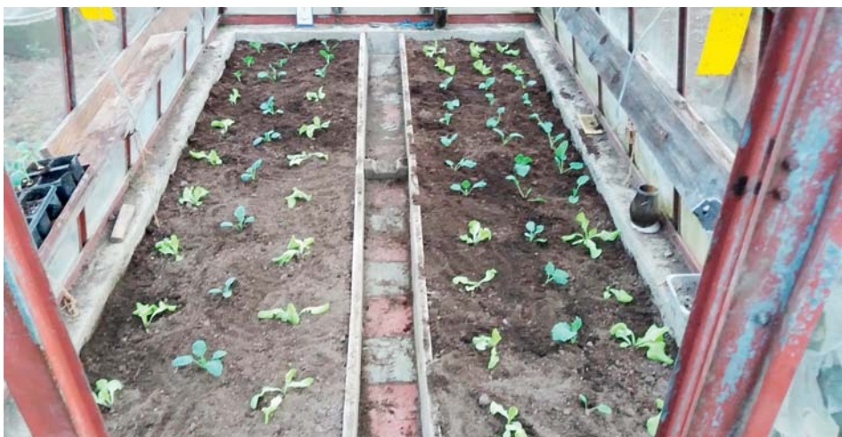
Taloviny letos rozkvetly už v první polovině února.

chvojí, netkanou textilií a další materiály, kterými jsme chránili citlivé druhy před zimními mrazy. Od keřů rovněž odhrneme nakopčenou půdu.