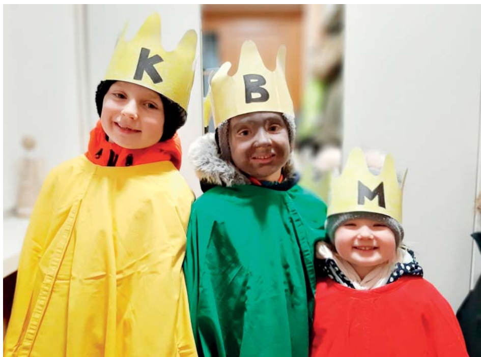
Koledování se v rodinách často posunulo na další generaci.