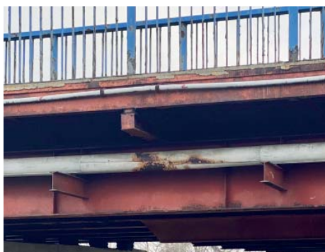
Detail mostní konstrukce.