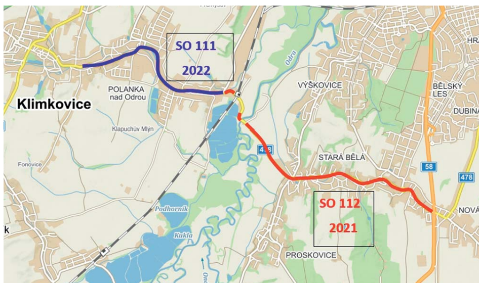
Rekonstrukce silnice II/478 letos zkomplikuje cestování do Polanky.