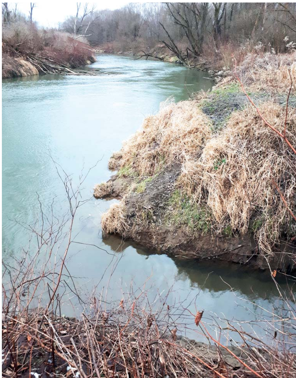
Starec neboli Starobělský potok vlévající se do Odry.

Druhý problém na území Staré Bělé je, že potok je obestavený domy. A ty jsou hodně blízko. Dřív, třeba v 19. století, to