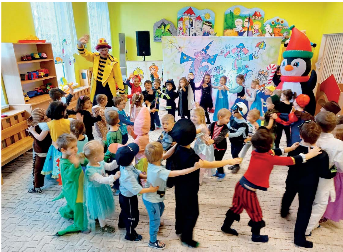
Karnevalový rej s klaunem Hopsalínem.