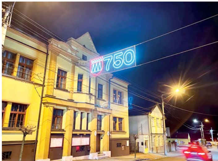
Významné jubileum bude celý rok připomínat jedinečné osvětlení.

Stará Bělá má letos 750 let. Hlavní oslavy jsou sice v plánu až na červen, významné výročí si však bude obec připomínat po celý rok. V lednu se proto nad cestou u starobělského úřadu rozzářilo osvětlení s logem Staré Bělé a číslem 750. „Za nápis úřad zaplatil 51 183 korun, za jeho montáž 9 075 korun,“ uvedla tajemnice Staré Bělé Jarmila Kaločová. (gro)