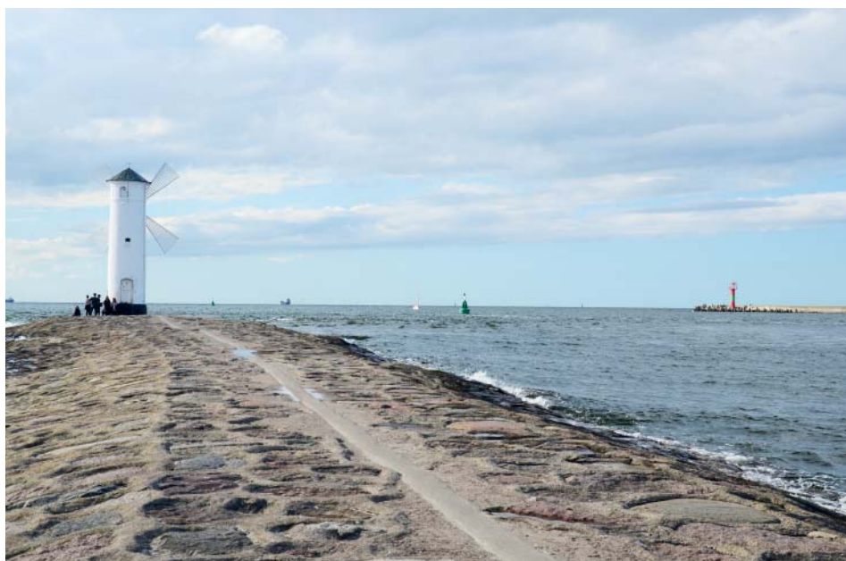
Svinoústí, Polsko. Místo, kde se vlévá stopa starobělské vody do Baltu.

Byl jsem před dvěma lety v Polsku ve Svinoústí a schválně jsme se vypravili až na nejzazší konec, kde se vlévá řeka do moře u majáku. Odra vtéká do vod Baltu ve Štětínské deltě, ale berme jako skutečný konec Svinoústí.