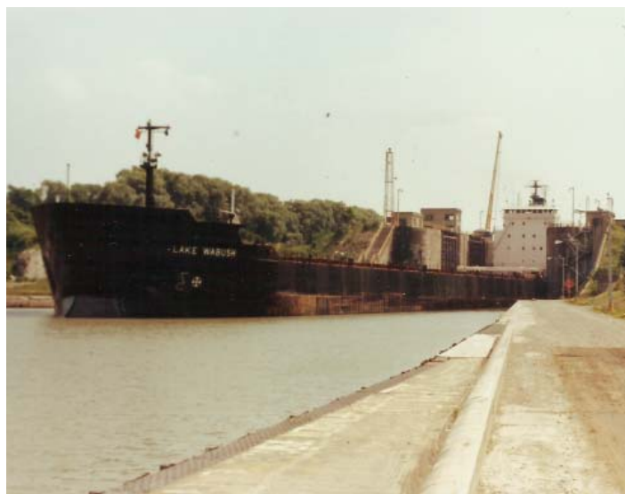
Lod' opouštějící zdymadlo na Welland Canal.

Velmi brzy po mém příjezdu jsme navštívili Niagarské vodopády, které se nacházejí od Toronta asi 120 km daleko. Vždycky jsem si představoval Niagaru někde uprostřed lesů, přírody, dále od civilizace. Opak je pravdou. Na padající spousty vod do hloub-