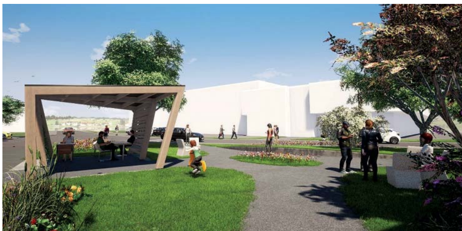
Původní vizualizace altánu i prostoru okolo něj.

Nyní vážně. Samozřejmě při kombinaci deště s větrem bude do altánu částečně pršet jako do každého jiného altánu, který nemá zástěnu, zídku či extrémní přesahy. S větrem je to obdobné. Jak jsem uvedl, záměrem nebylo vystavět uzavřenou pergolu – z důvodu zachování „lehkosti“ tohoto významného exponovaného parteru. Dalším důvodem je fakt, že v případě většího uzavření by se pergola mohla stát útočištěm nejen pro ty, pro které je primárně určena. Veřejný pro-