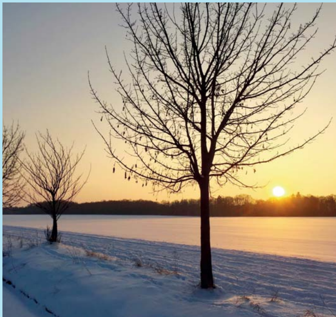
Zimní Dráhy.