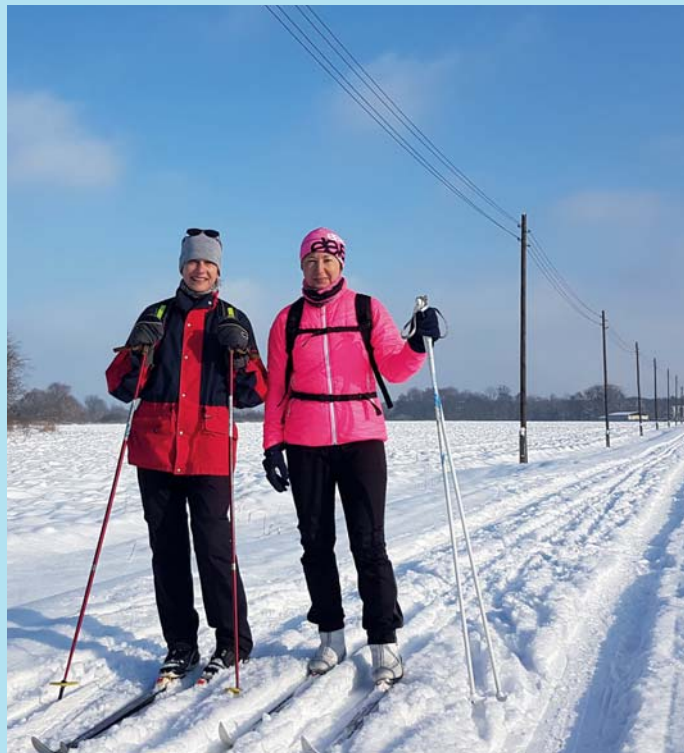
Na běžkách Poodřím.