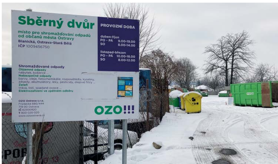
Sběrný dvůr ve Staré Bělé je otevřen denně, kromě nedělí a svátků.

Od prosince 2020 mohou Starobělánek ještě lépe třídit, a to díky rozmístění čtyř speciálních černých popelnic na olej. Městský obvod však s firmou Trafín Oil, která tyto popelnice provozuje, dohodl jejich přemístění. „Nebyli jsme zcela spo-