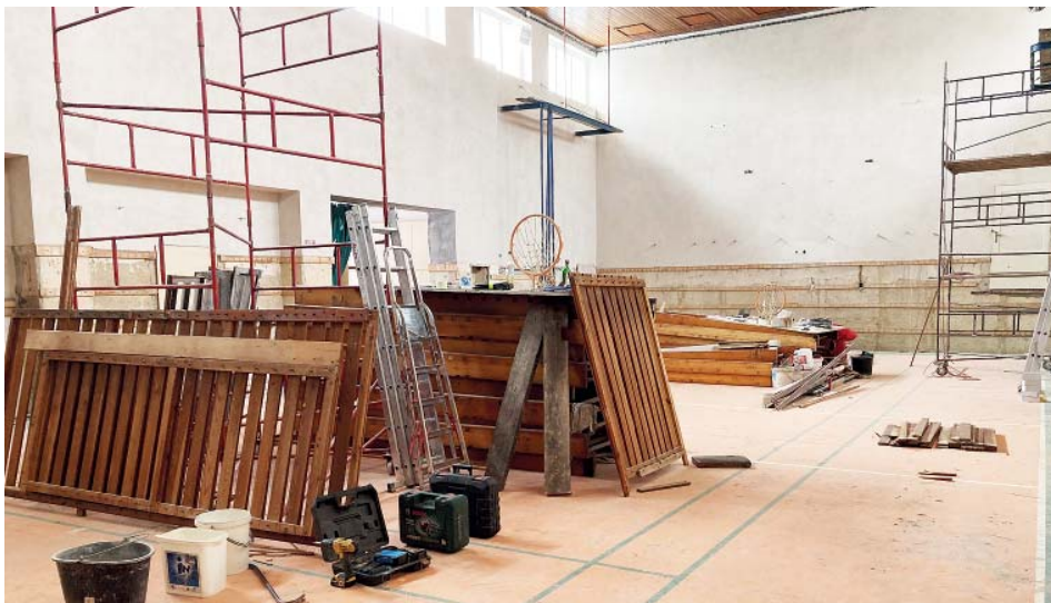
Pohled do zákulisí dění v sokolovně v polovině ledna.

Hned na první brigádě však zjistili, že práce bude podstatně více. Původní malba nedržela, a tak se musela oškrábat.