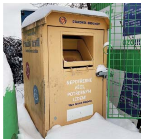
Kontejner na textil lidé najdou i ve sběrném dvoře.