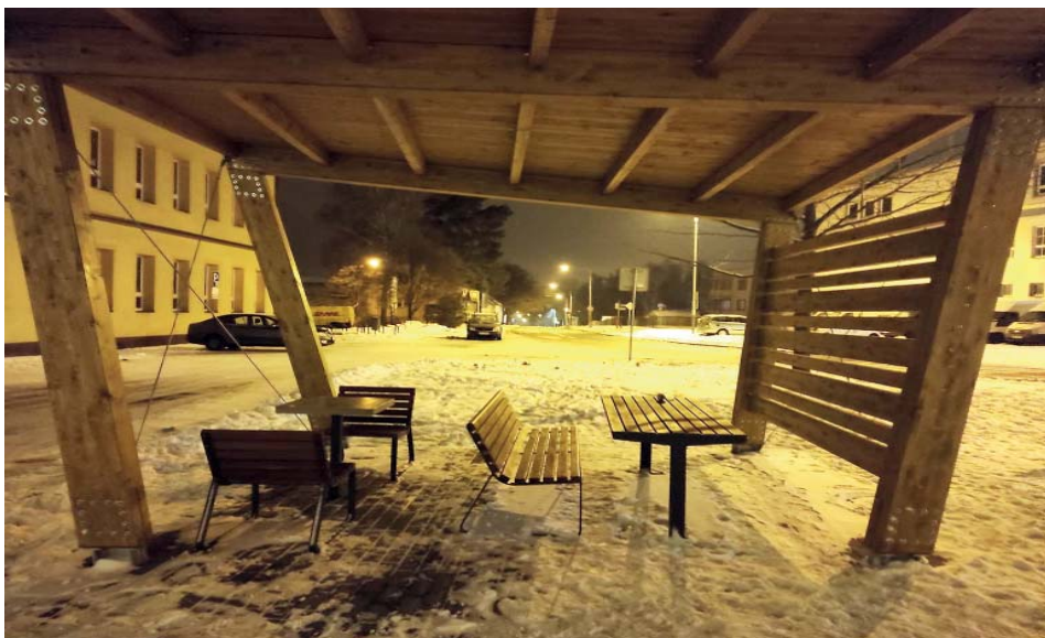
Altán stojí v prostoru mezi kostelem a seniorskými obecními byty.

Oponenti mohou namítat, že výše zmíněné praktické nedostatky jsou pouze výsledkem jiného úhlu pohledu. Opravdu se jedná pouze o názor, který se mnou každý nemusí sdílet. Ovšem ne o všem,