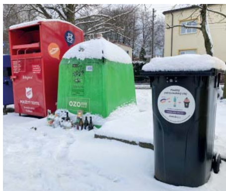
V prosinci se ve Staré Bělé nově objevily černé popelnice na potravinářský olej.

kojeni s vybranými lokalitami, zvolili jsme proto pro kontejnery vhodnější místa, kde se koncentruje více lidí,“ vysvětlil důvody starosta Staré Bělé s tím, že k přesunu dojde v rámci svozu na začátku února. Kromě této novinky lze odevzdávat použité jedlé oleje a tuky ve sběrném dvoře společnosti OZO.