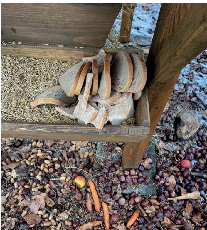
Jeden ze starobělských krmelců letos v lednu – cedulka se žádostí myslivců nezabrala.