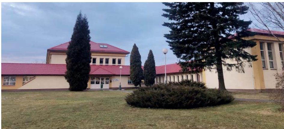
Základní školu navštěvovaly před koncem pololetí jen děti prvních a druhých tříd. Ostatní se učily online.

Jak uplynulých pět měsíců hodnotí, co si z nich vzali pro další kantorskou práci? Budou kvůli výuce na dálku děti méně vzdělané? A jak učitelé přistoupili k pololetní klasifikaci? Své zkušenosti shrnulo několik vyučujících starobělské základní školy.