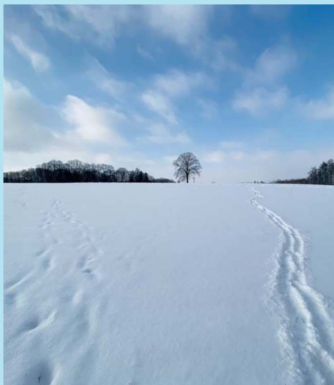
Kříž na obzoru.