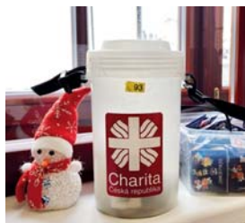
Kasička stála i na úřadu.

Bez koledníků v ulicích a co nejméně kontaktně – letošní Tříkrálová sbírka se musela přizpůsobit proticovidovým zásadám. Kasičky tentokrát neputovaly spolu s koledujícími od domácnosti k domácnosti. Lidé mohli přispět buď online prostřed-