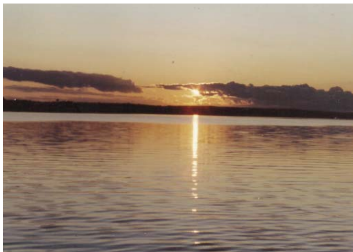
Západ slunce nad řekou Ottawou v Chalk River.