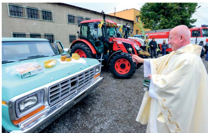
Mezi zemědělskou technikou parkovaly i nezemědělské unikáty.