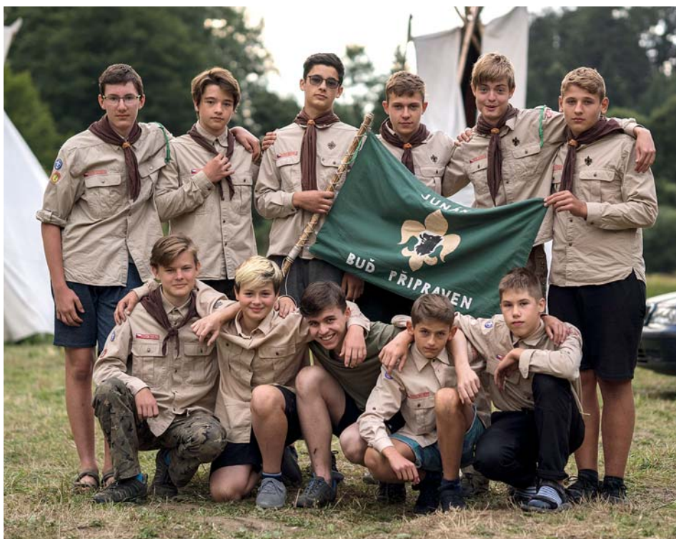
První týden v srpnu patřilo tábořiště Čermná ve Slezsku skautům.

Dva dny však byly trochu speciální. Prvním z nich byla olympiáda. Celé tábořiště se rozdělilo na dva týmy – Stará