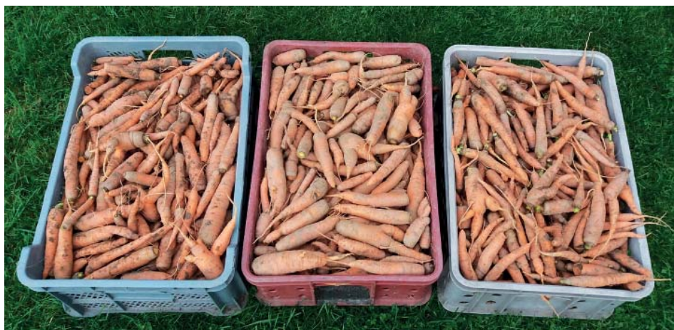
K říjnu patří sklizeň kořenové zeleniny.