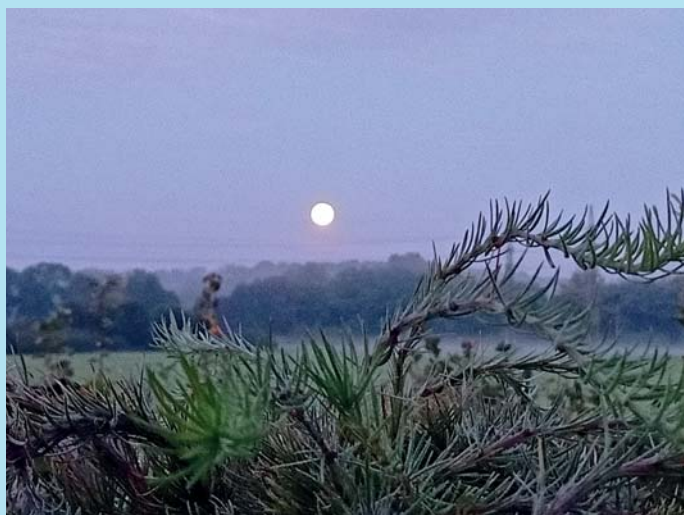
Úplněk nad Odrou.