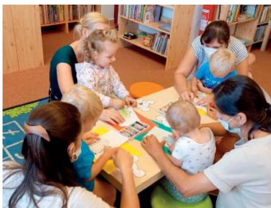
Myši v knihovně? Jen ty vyrobené z papíru.

Pro starší děti byly připraveny akce v rámci kampaně Evropský týden mobility. Tvořivá dílna Malování na kamínky ovšem nepřilákala do knihovny jen děti, ale i dospělé. Fantazii se meze nekladly, a tak vznikla spousta krásných kamínek. Své výtvary si účast-