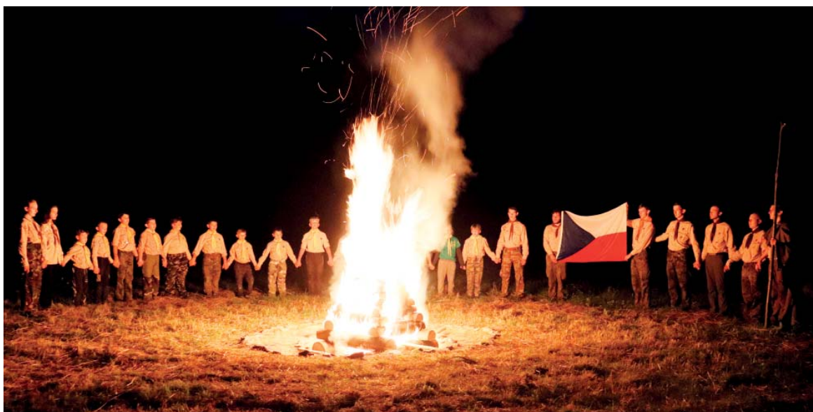
Dvě rot, náročný výsadkářský výcvik. Vlčata se vrátila do éry druhé světové války.