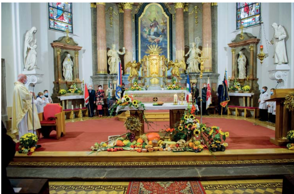
Mše v katolickém kostele patřila poděkování za úrodu.

Díky zahrádkářům a včelařům jsme měli krásně vyzdobený areál za školní jí-