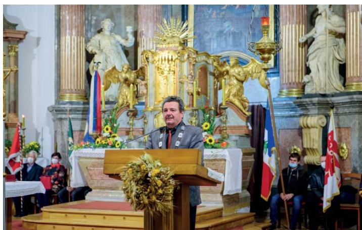
Bělské dožínky slavivají společně Staro- a Novobělané.