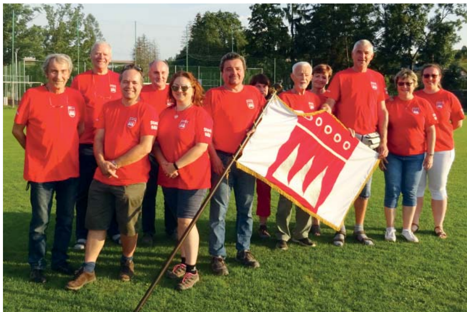
Setkání Bělých se zúčastnilo dvanáct Starobělanů.

Obec se akce účastnila potřetí a v příštím roce bude hostitelem. „Setkáme se v rámci oslav 750 let Staré Bělé, tedy 10. až 12. června. Běláky přivítáme v pátek s malým kulturním programem a občerstvením, v sobotu všechny Bělé přizveme do dopoledního průvodu obcí a poté se budou moci naši občané seznámit se všemi Bělými na společné prezentaci obcí. Odpoledne je v plánu kulturní program a oslavy 750 let obce,“ popsal Krejčíček. (joh)