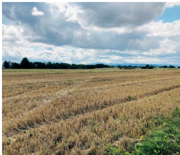
Místo, o které jde – pole u Junácké.