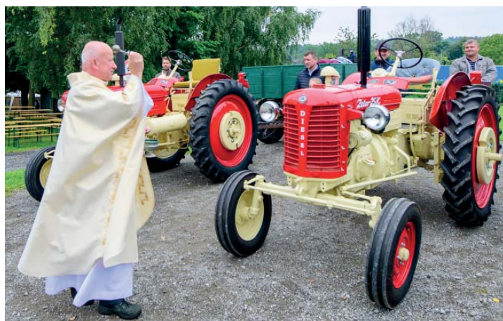
Požehnat strojům, i to k dožínkám patří.