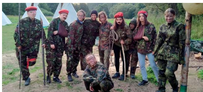
Skautky alias vojínky císaře pána.