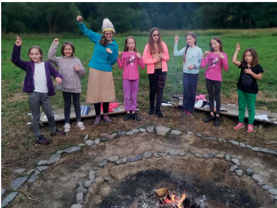
Namísto skautských přezdívek dostaly světlušky na táboře jména indiánská.

Na táboře panoval smích, vůně a praskot táborového ohně, který jsme měly každý večer rozdělaný, zpěv táborových a pohádkových písniček a dobrá