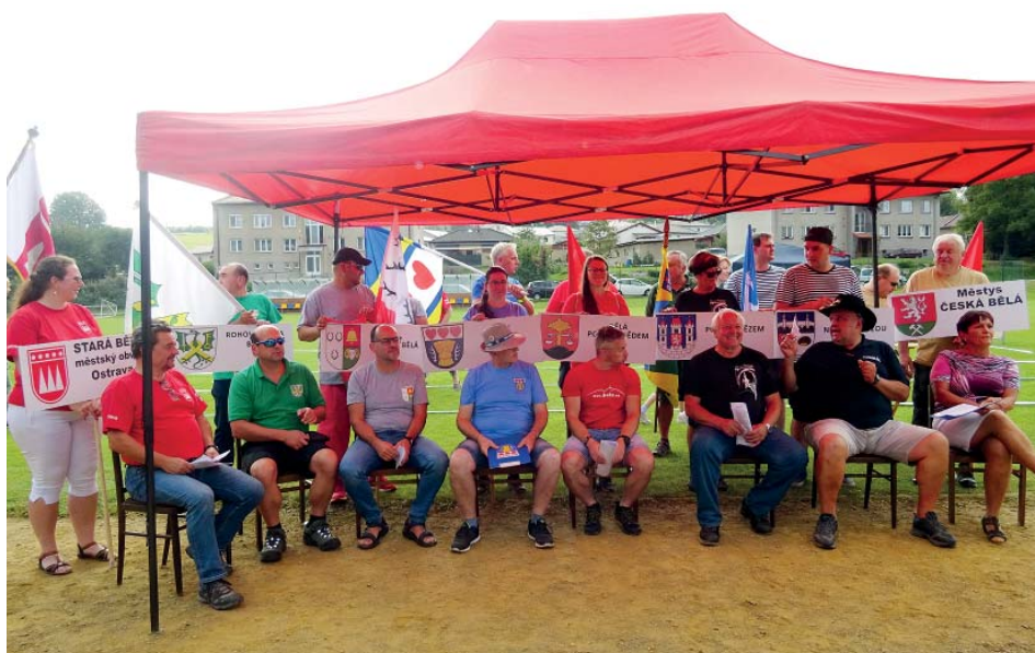
Tradice bělských setkání vznikla v roce 2013. Stará Bělá se připojila potřetí.