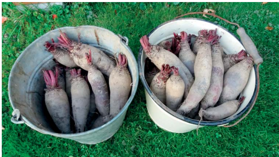
Červená řepa se vrací mezi oblíbené plodiny. Je z ní vynikající čerstvá šťáva.