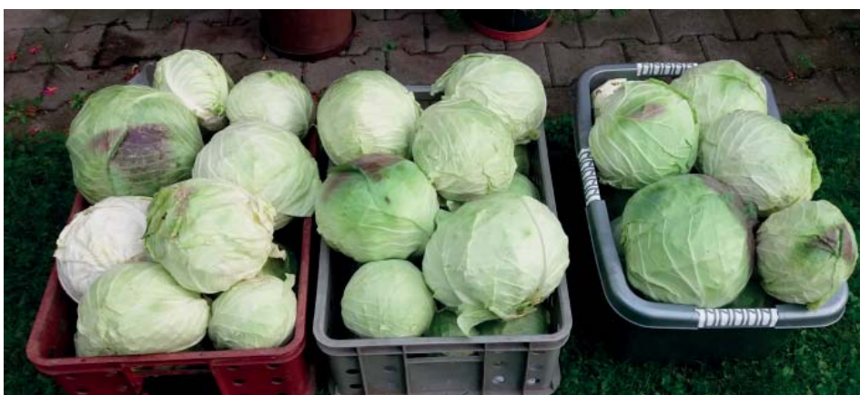
Zelí na salát, jako příloha nebo nakrouhat a naložit. Možností je mnoho.