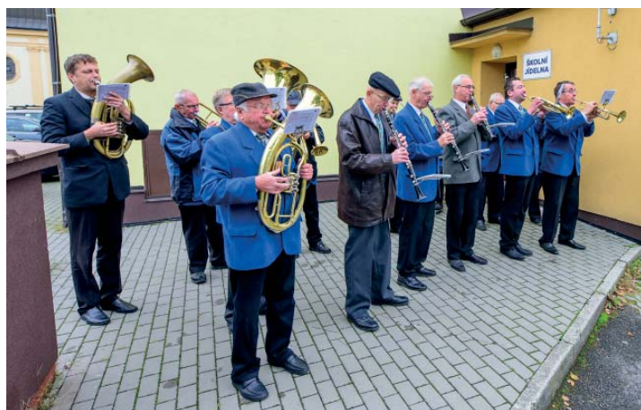
O atmosféru se postaralo hned několik hudebních uskupení.