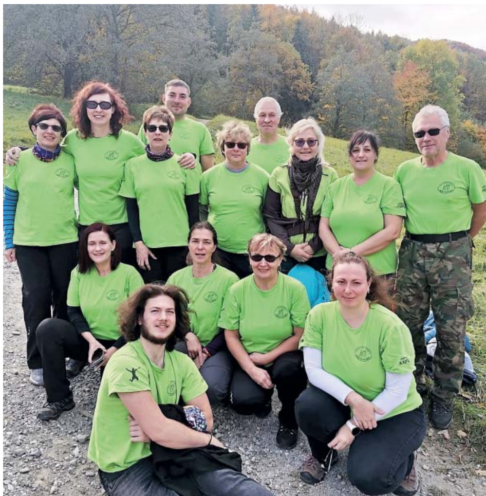
Starobělská sokolská cvičitelská parta drží pospolu.

Děkují cvičitelům za práci, která není v dnešní uspěchané době vůbec jedno-