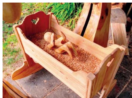
Ježíšek v kolébce vystlané pilinami.