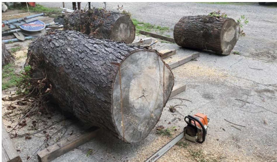
Kaštanové špalky. To byl výchozí tvůrčí materiál. Strom vyrostl ve Staré Bělé.

a rozhodné jednání ho příjemně překvapilo. „Co jsme dohodli, platilo. Po celou dobu,“ chválí si starobělskou spolupráci.