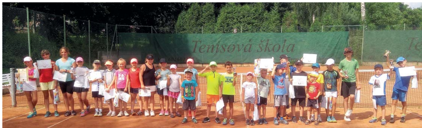
Na příměstském kempu se v půlce července bavily tenisem skoro tři desítky dětí.

Rezervace kurtu v hale www.starabelatenis.cz