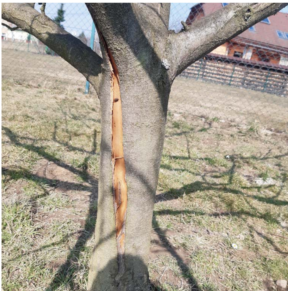
Mrazové trhliny na osluněné straně kmene.

V případě pokračujícího podzimního sucha nezapomene i v prosinci zalít nově vysazené stromy a keře .