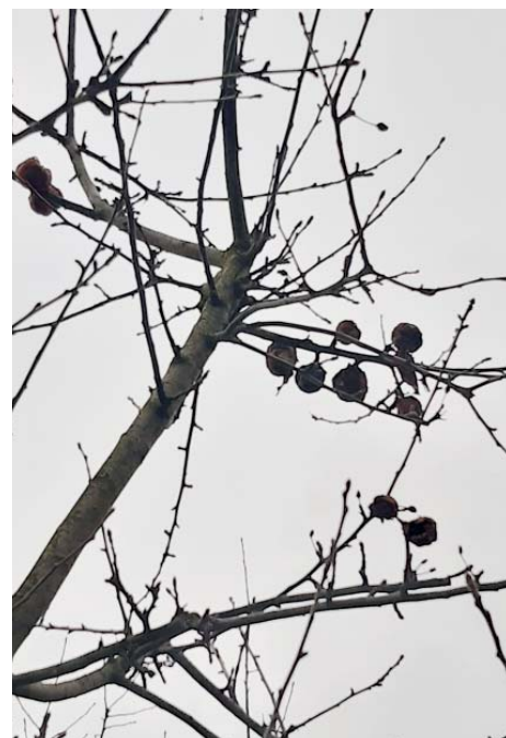
Mumifikované plody musejí pryč.