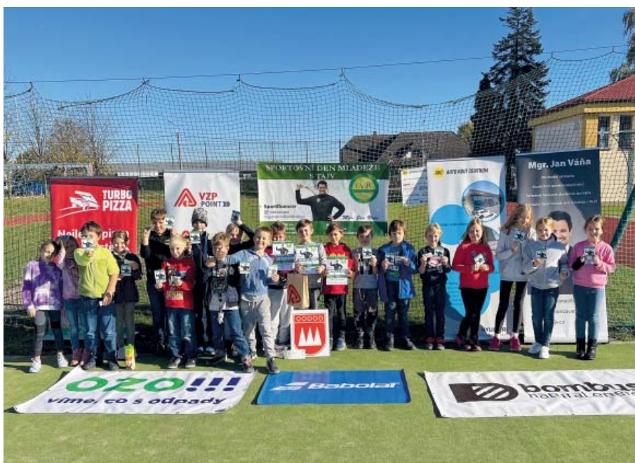
Poslední říjnové pondělí se na hřišti konal sportovní turnaj.