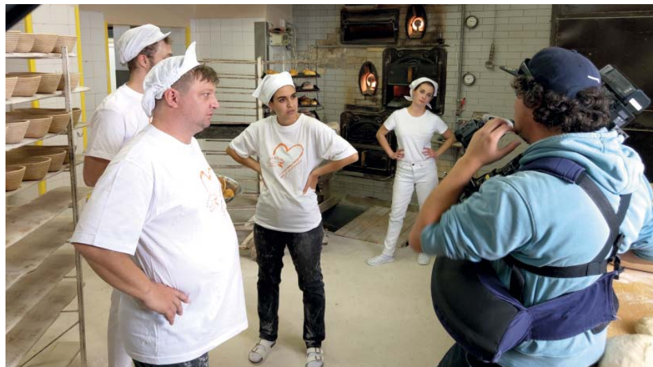
Filmovalo se o víkend, aby štáb neomezil skutečnou výrobu pečiva.

Natáčelo se z pátku na sobotu, kdy se už nepeče a pekárna je zavřená, takže jsme žádné omezení nepocítili. Filmaři po sobě vzorně uklidili, my jen doladili a poté vzhledem k současné situaci také vydezinfikovali veškeré prostory.