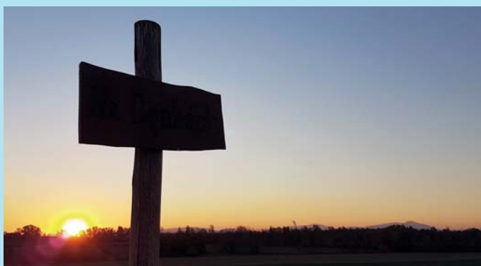
Na Drahách.