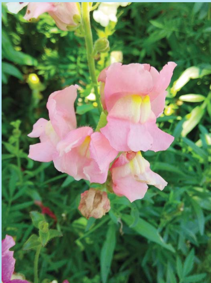
Radost se dívat.