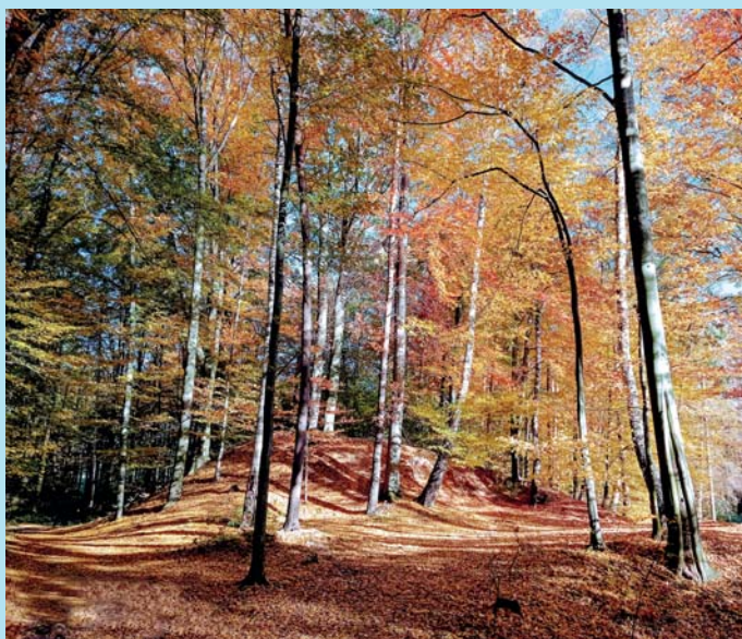
Podzimní relax.