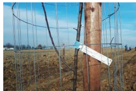
Pletivo chrání před okusem.

Prosinec je vhodným obdobím pro nařezání kmenů ovocných stromů vápnem . Zvláště na konci zimy se stává, že během dne slunce již pěkně hřeje, zatímco v noci padají teploty hluboko pod bod mrazu. Tyto velké rozdíly mezi denní a noční teplotou stejně jako teplotní rozdíly mezi jižní, osluněnou, a severní stranou způsobují vznik takzvaných mrazových desek – kůra na kmeni praská a stává se vstupní branou pro nejrůznější patogeny. Bílá barva vápenného nátěru sluneční pa-