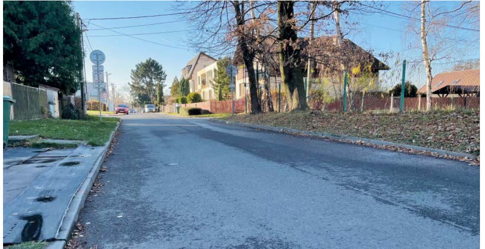
Postupná rekonstrukce kanalizace ve Staré Bělé se příští rok dotkne částí ulic Ruskova a Blanická.

Do budoucna jsou v obci v plánu ještě další opravy a budování kanalizace. „V projekční nebo povolovací fázi jsou