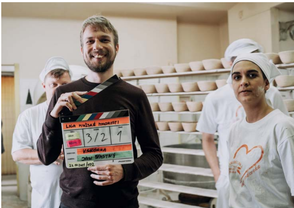
Liga mužské moudrosti těsně před klapkou.