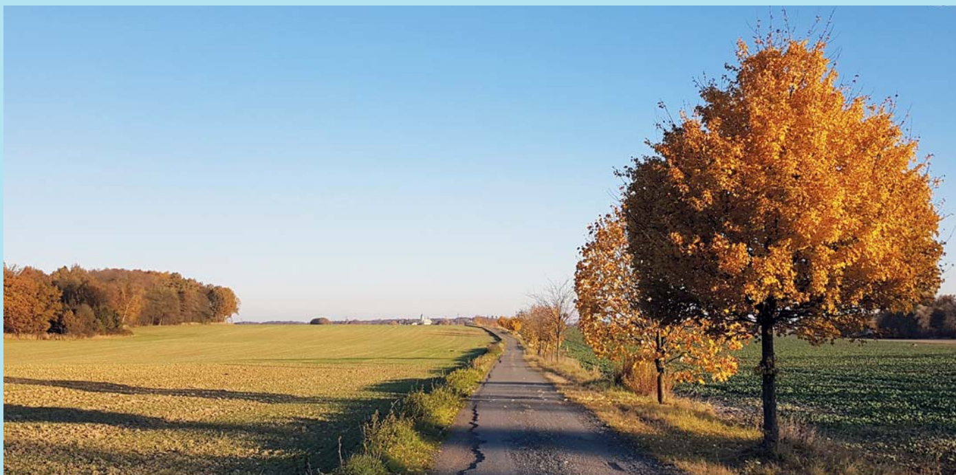
Poslední říjnové ráno.