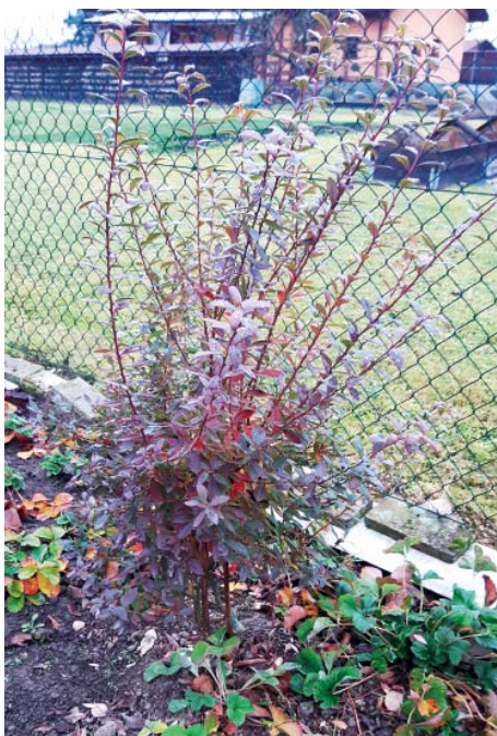
Zahradní borůvky rozhodně nevápňte.