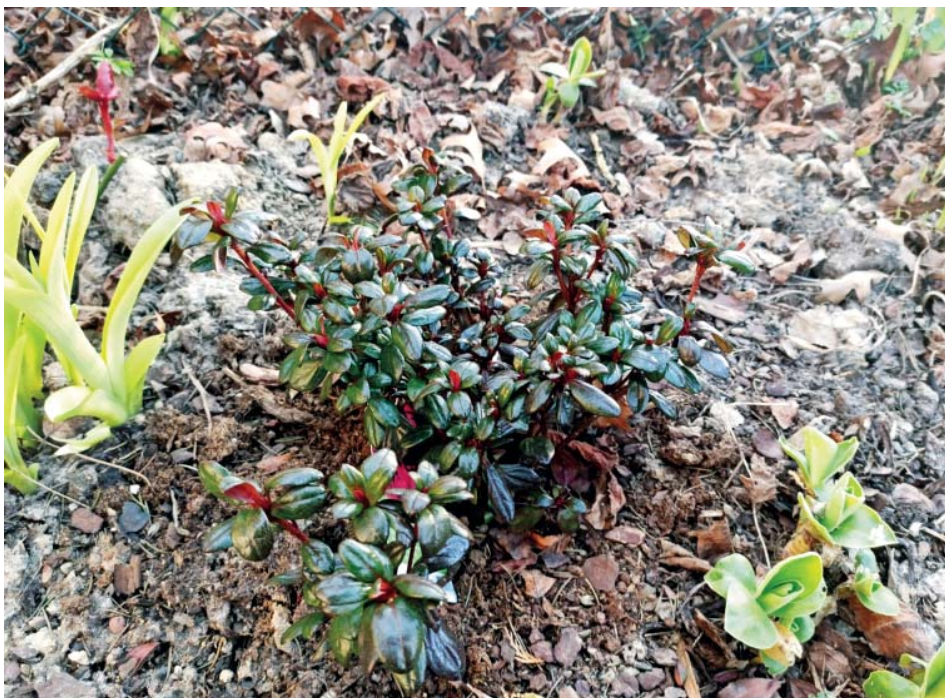
Když je sucho, zalévejte stálezelené dřeviny.