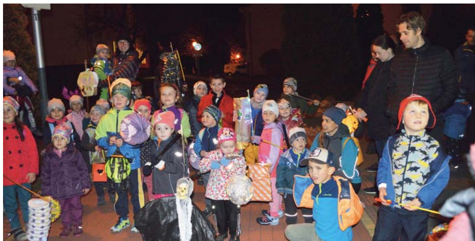
V průvodu už tradičně svítily lampióny koupené i vyrobené.

V pondělí 1. listopadu se u tělocvičny sešly děti se svými rodiči či prarodiči, každé v ruce lampión a za doprovodu cvičitelky se třicet světlušek vydalo na