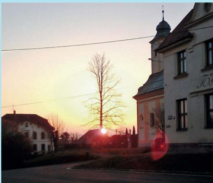
Nad obzorem.