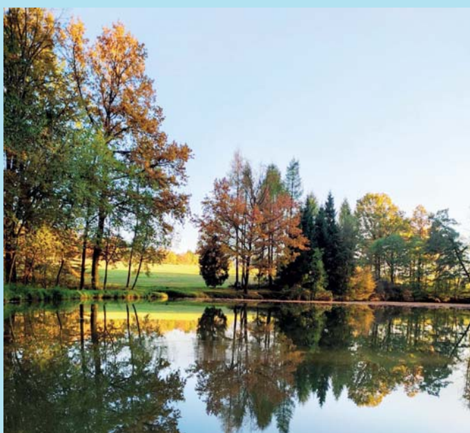
Rybník v Palesku.