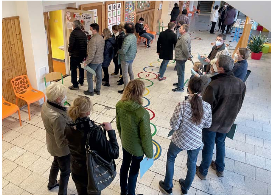
První den voleb si někteří voliči museli před odevzdáním hlasu dokonce vystát frontu.

Výsledek referenda je vzhledem k vysoké účasti platný a pro zastupitelstvo obvodu i závazný. „Pro nás to znamená, že pokud budeme účastníkem řízení o výstavbě, tak nebudeme moci vydat