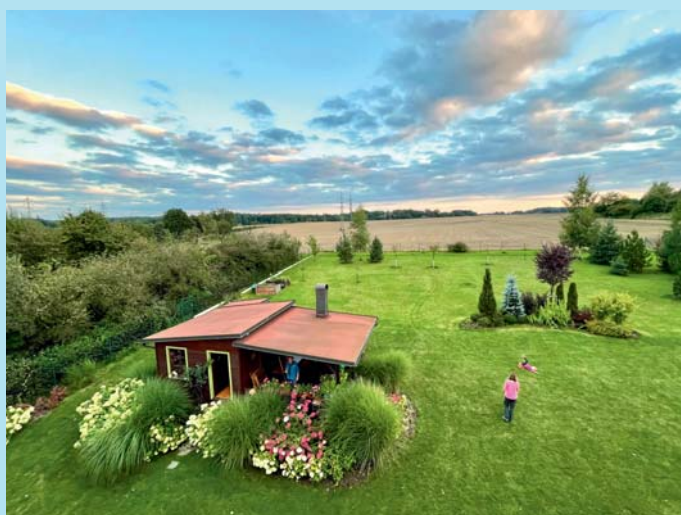
Z nahledu.