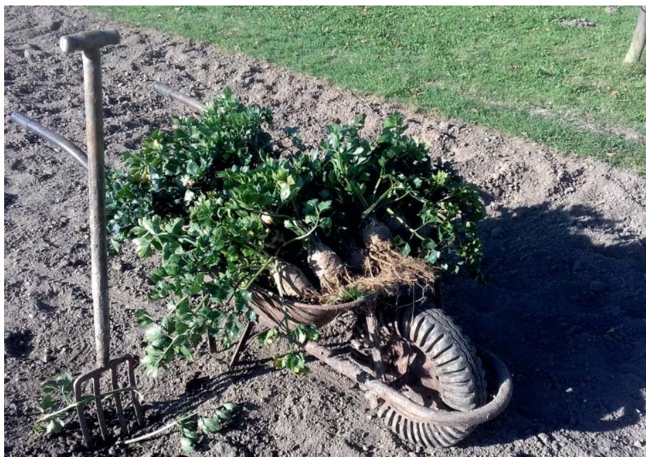
Pěkný celer vypěstujeme pouze na půdách dobře zásobenými živinami a vláhou.

Tony Skřipčák tony.skripcak@seznam.cz 732 853 372