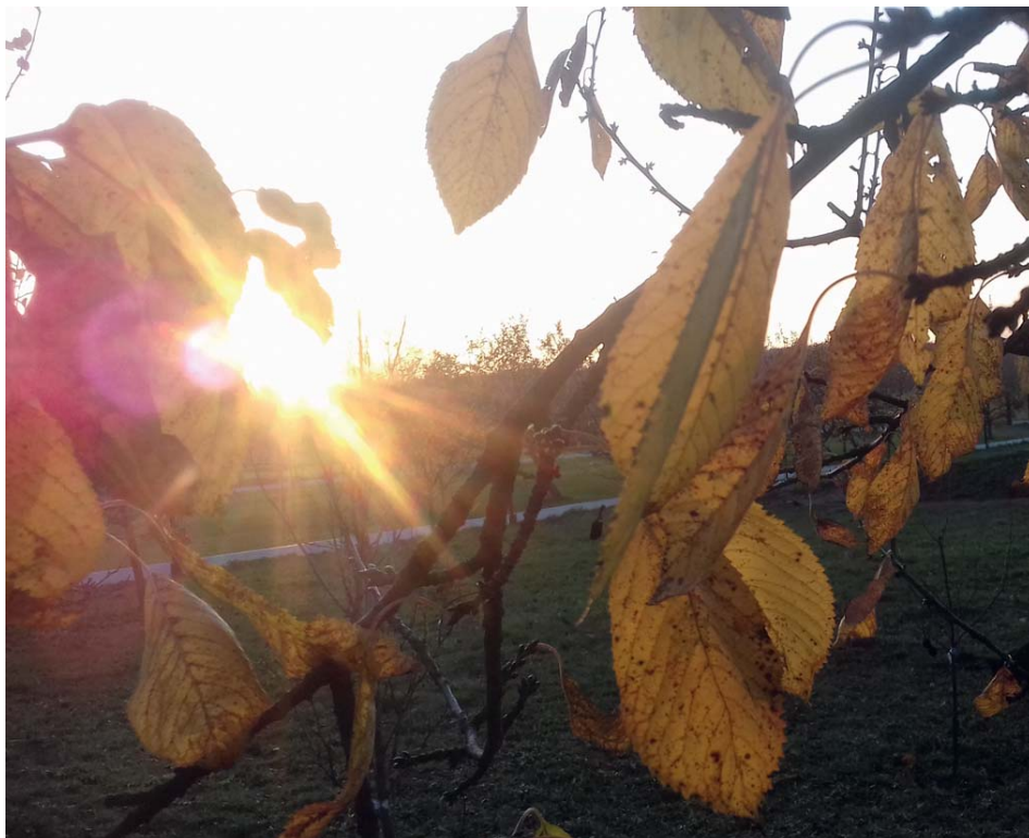
Zbarvená třešeň aneb podzimní idyla.

Věnujeme se hrabání a odstraňování spadaného listí , na kterém by mohli přezimovat původci nejrůznějších chorob. Nezapomeneme vyčistit i záhony s jahodami, kde by rostliny pod spadaným listím z ovocných stromů mohly zahnívat. Do samotných jahodníků již nezasahujeme.