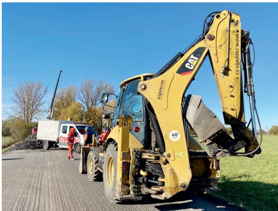
V ulici Na Lukách se stále pracuje.

číme s koncem listopadu a poslední úsek otevřeme, cedule zmizí také. V případě že ulice Na Lukách zůstane uzavřená i přes zimu, budou tam muset cedule z legislativních důvodů zůstat až do konce února, případně začátku března.