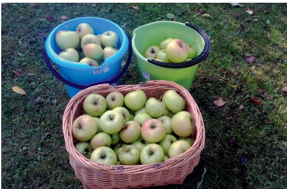
Velmi pozdní, kvalitní odrůda jabloně Goldstar.