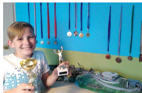
Začínal jako řada dětí – v míčové přípravce Ostraváček.