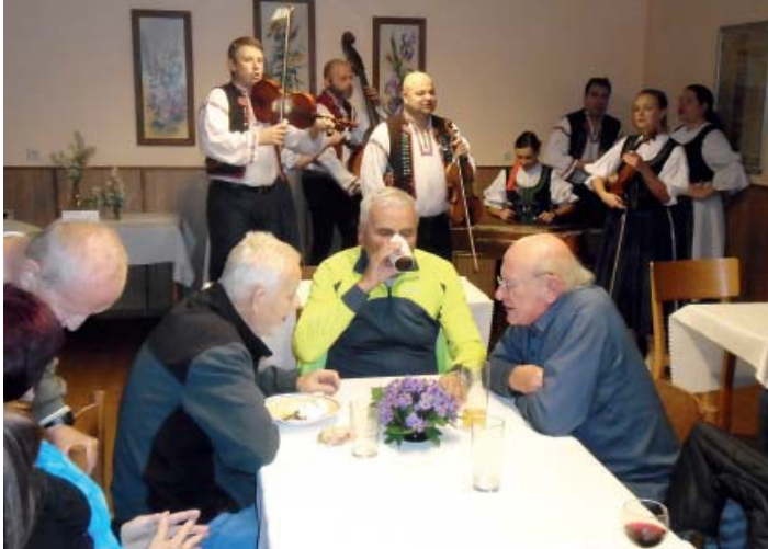
K posezení zahrála cimbálovka Úsměv.