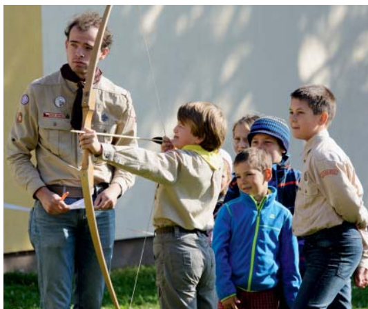
Střelba z luku, luštění šifer – kdo chtěl, piloval skautské dovednosti.