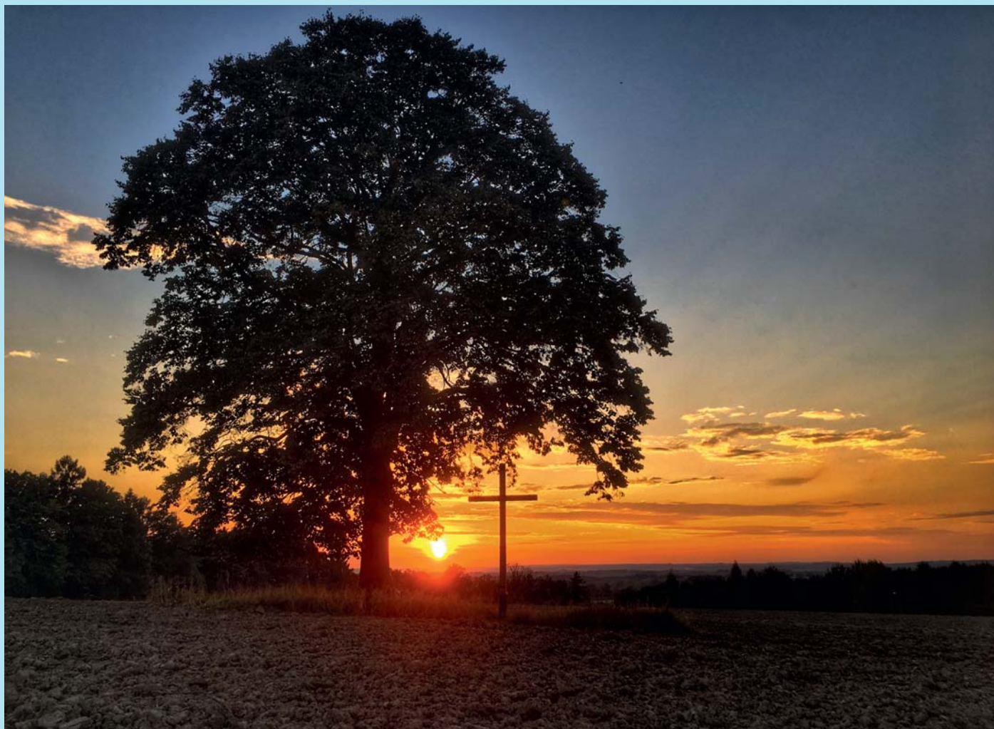
Slunce s duší.