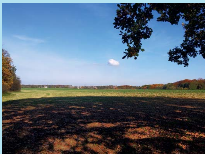
Z Proskovic do Bělé.