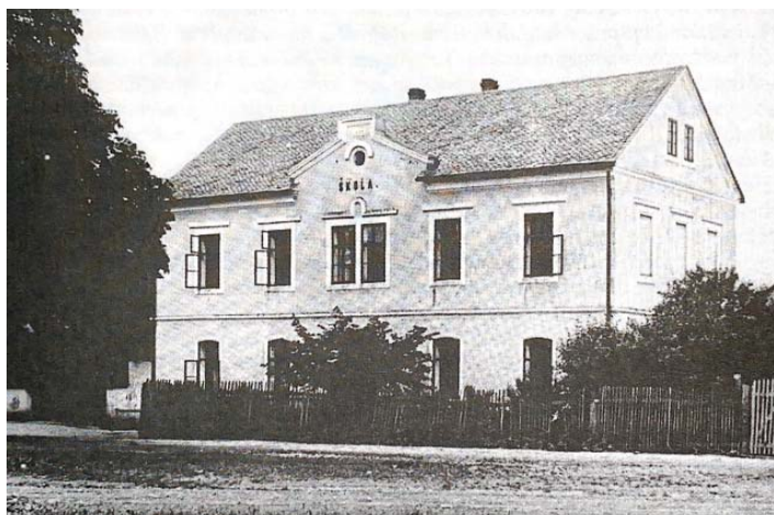
Obecná škola, foto 1890.

Musíme mít na paměti, že Stará Bělá byla založena coby křesťanská obec, a musíme si uvědomit, že veškerý život a setkání probíhaly víceméně v okolí kos-