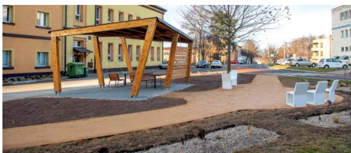
Nový altán u kostela.