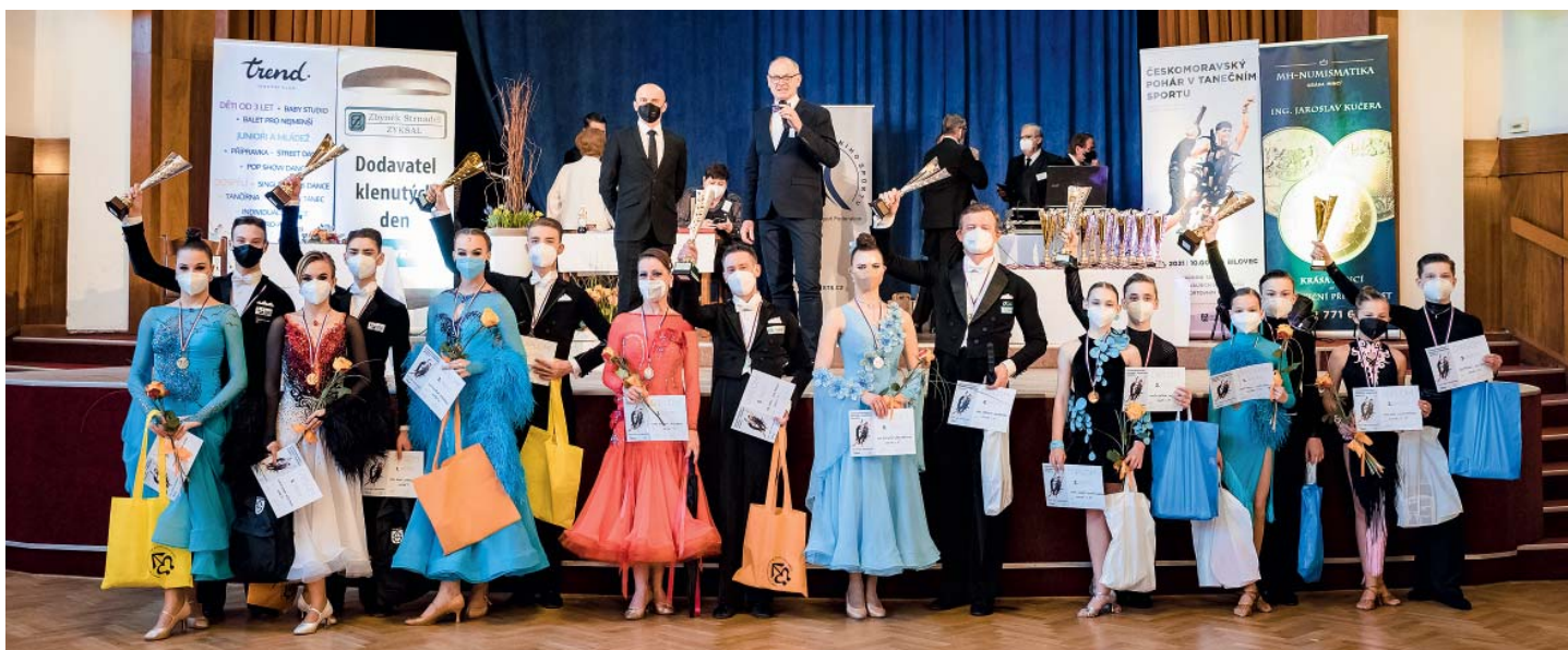
Místní taneční klub v dubnu pořádal soutěž pro profesionální tanečníky.