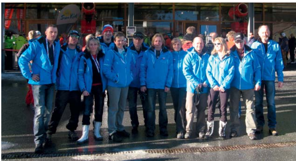
Výprava Interski 2011.

Jelikož se v roce 2011 kongres konal u našich jižních sousedů, příležitost se naskytla a já jsem se stal součástí české delegace. Tohoto kongresu se zúčastnilo celkem 46 členských zemí z celého světa a téměř všech kontinentů, chyběli jen zástupci Afriky a Antarktidy. Byl to pro mě