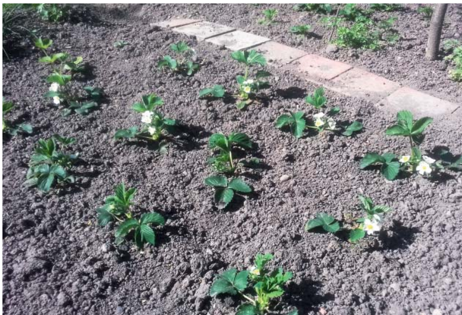
Mladé sazenice jahodníku Polka.

Naopak již dříve můžeme vysazovat košťáloviny . Je velká škoda, že zelenina z této skupiny z našich zahrad téměř zmizela, přitom například zelí se zde i v posledních letech velmi dobře daří a může nám být cenným zdrojem vitamínů po celý rok. Proto neváháme a alespoň pár rostlinek vysázíme.