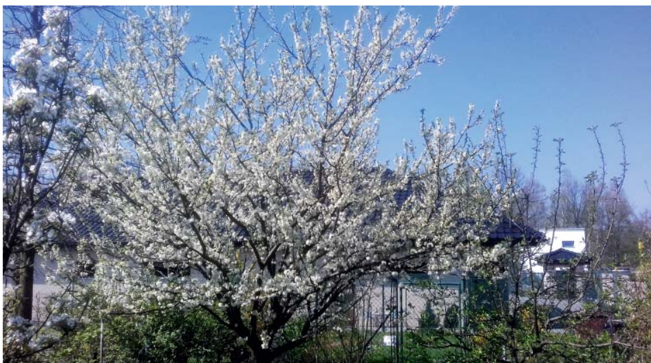
Kvetoucí slíva Opál.

Věnujeme se také přihnojování . Kromě tradičních dusíkatých hnojiv dbáme i na zajištění dostatku hořčíku a železa, jejichž nedostatek způsobuje chlorózy – nervatura listů zůstává tmavě zelená, zbytek listů však žloutne.