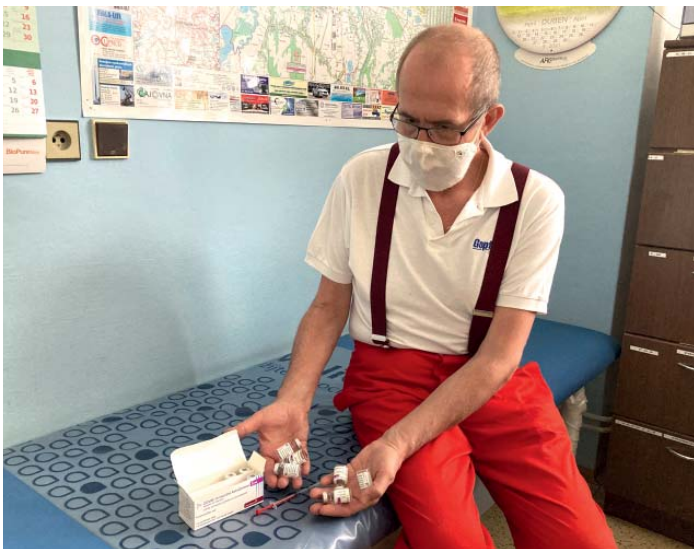
Oba lékaři očkovali proti covidu prvně v březnu.