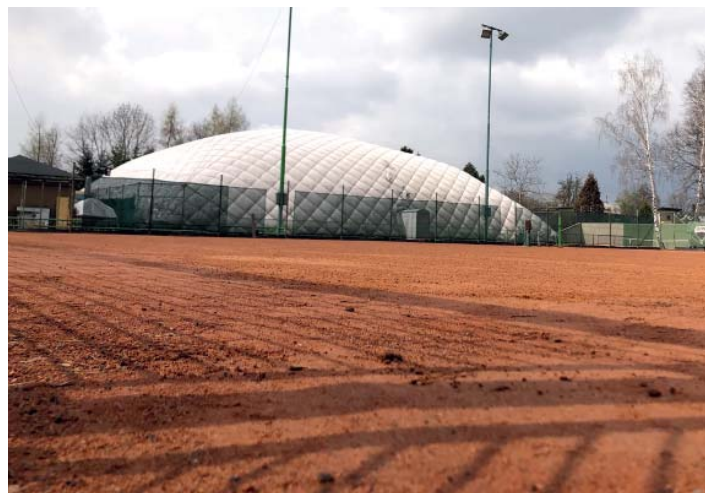
Přípravu kurtů komplikovala tenistům dubnová nepřízeň počasí.