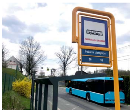
Oprava ovlivní i trasy autobusů.