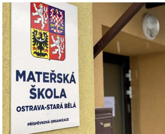
Do školky se mohli od 12. dubna vrátit předškoláci.

Vzhledem k nepříznivé epidemiologické situaci byla naše mateřská škola od 1. března 2021 uzavřena. Během této doby jsme s předškoláky pracovali pomocí e-mailu, kde jsme jim posílali různé náměty pracovních činností. Mladším dětem byly nabídnuty aktivity na webových stránkách školy dle třídních vzdělávacích programů. Tímto bychom chtěli poděkovat všem rodičům a dětem, kteří s námi spolupracovali. Výsledky dětského tvoření a úspěšné plnění zadaných úkolů byly následně vkládány do sekce fotogalerie jednotlivých budov na www.msstarabela.cz .