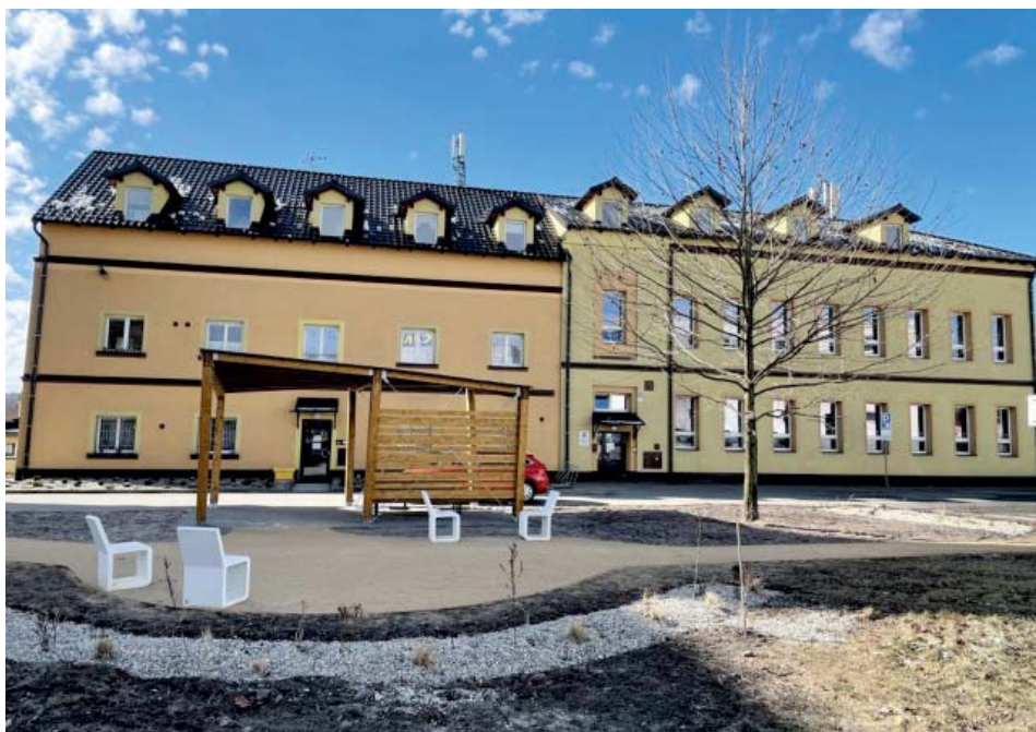
Současný stav, březen 2021.