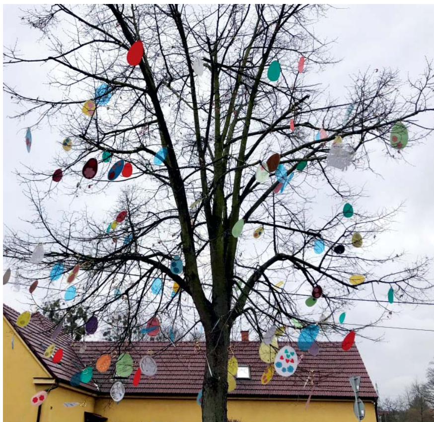
Sokolský nápad, sokolské provedení. Ozdoby zůstaly i pár dní po Velikonocích.