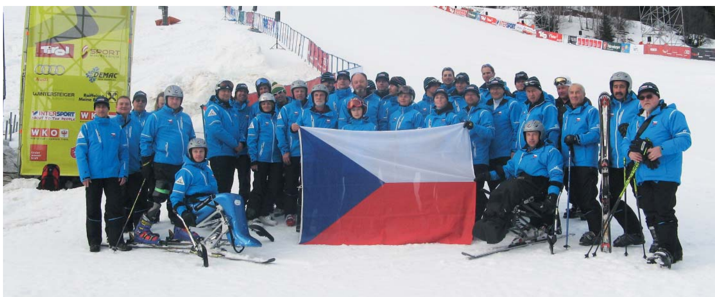
Společné foto z rakouského St. Antonu. Za dva roky se bude lyžařský kongres konat ve Finsku.