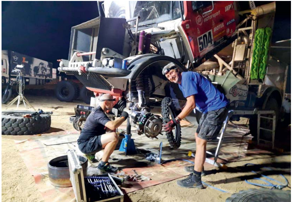
Dobrá nálada byla základ.

Dojmy ze Saudské Arábie? Nafta v přepočtu za tři koruny, voda za šedesát, lidé příjemní a vstřícní, ochotni pomoci ať už radou, pozváním na čaj nebo rovnou ke stolu. Ovšem pokud něco požadujete