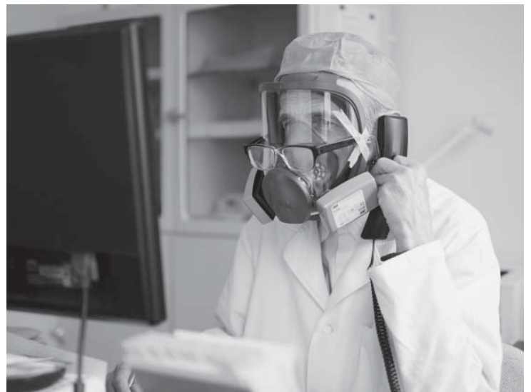
Zoufalé jaro 2020.