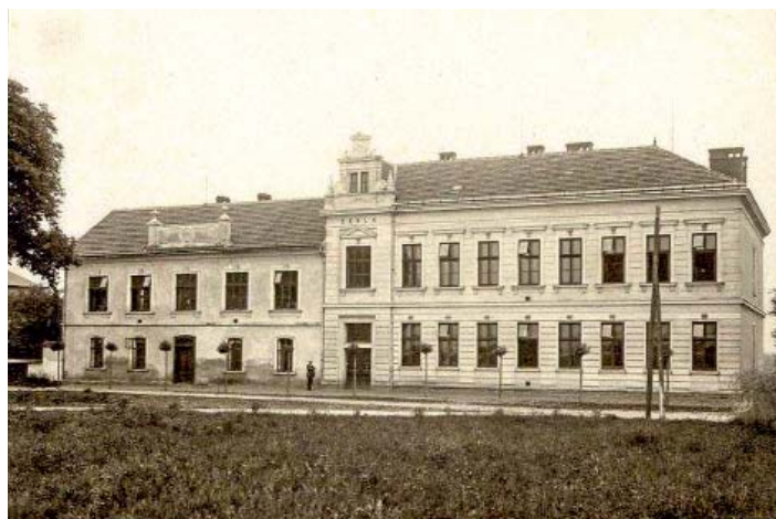
Obecná škola, foto 1908.