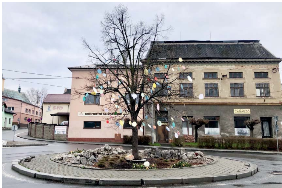
Lípu uprostřed kruhového objezdu zdobila velikonoční vajíčka.

Na Škaredou středu sokolové strom se souhlasem obce nastrojili. Pod něj na zem rozložili ještě hnízda z břechtanu, usadili do nich vajíčka – plastová plus jedno větší z vodního skla. Ozdoby na místě nakonec zůstaly i dlouho po svát-