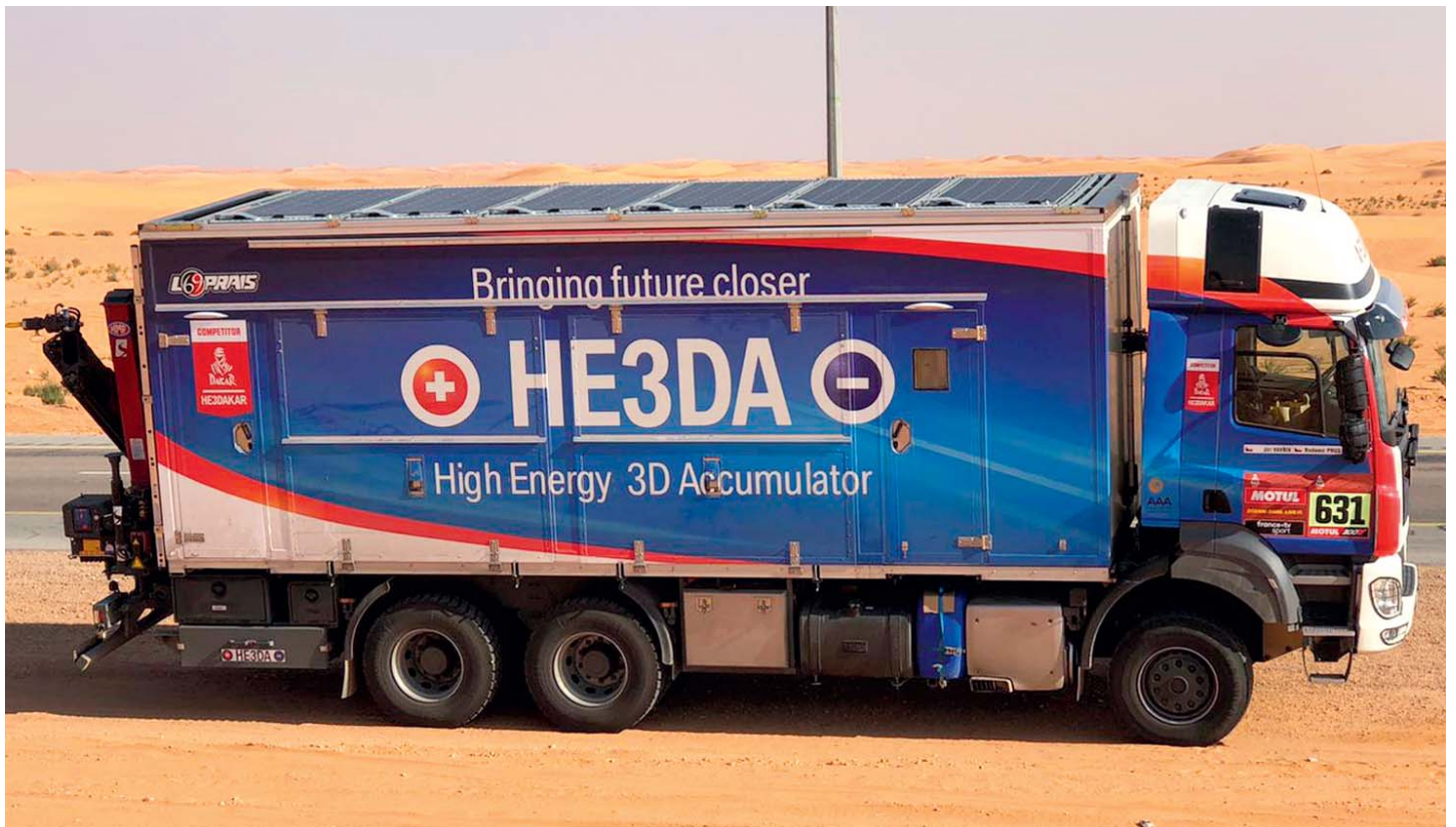
Tatra Phoenix HE3DA.