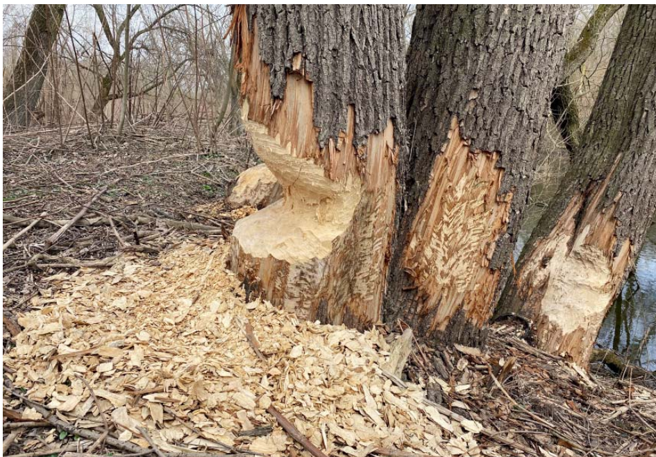
Bobří okusy jsou v Ostravě vidět u Odry i Ostravice.