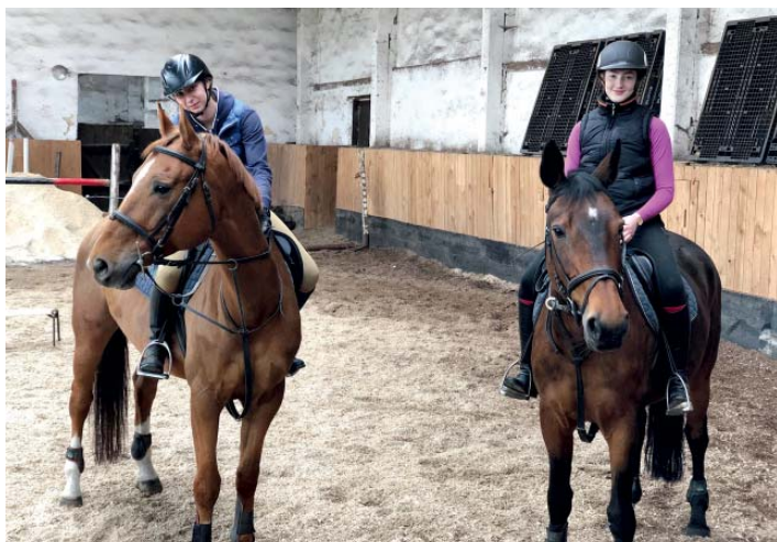
Jezdecký klub musel i v lockdownu denně pečovat o koně.