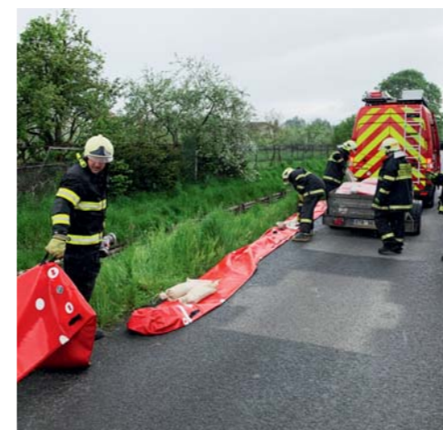
Hasiči vyzkoušeli nové protipovodňové zábrany 15. května ve Starecké ulici.

s pískem jsme museli objednávat a čekali jsme na ně někdy i tři hodiny, což je moc dlouho, po takové době už občas byly bohužel k ničemu. Markéta Groholová