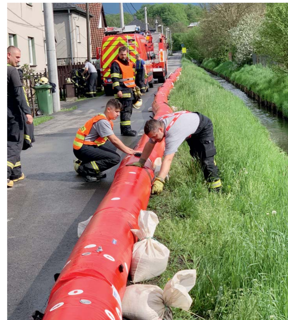
Každý válec má deset metrů na délku.

Koupily se primárně pro Stareckou. Pokud ale bude obec chtít, není problém je využít jinde. Postavíme je vždy, když bude hrozit, že se potok vylije. Tře-