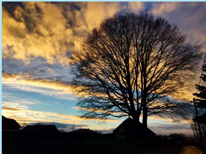
Dub letní.