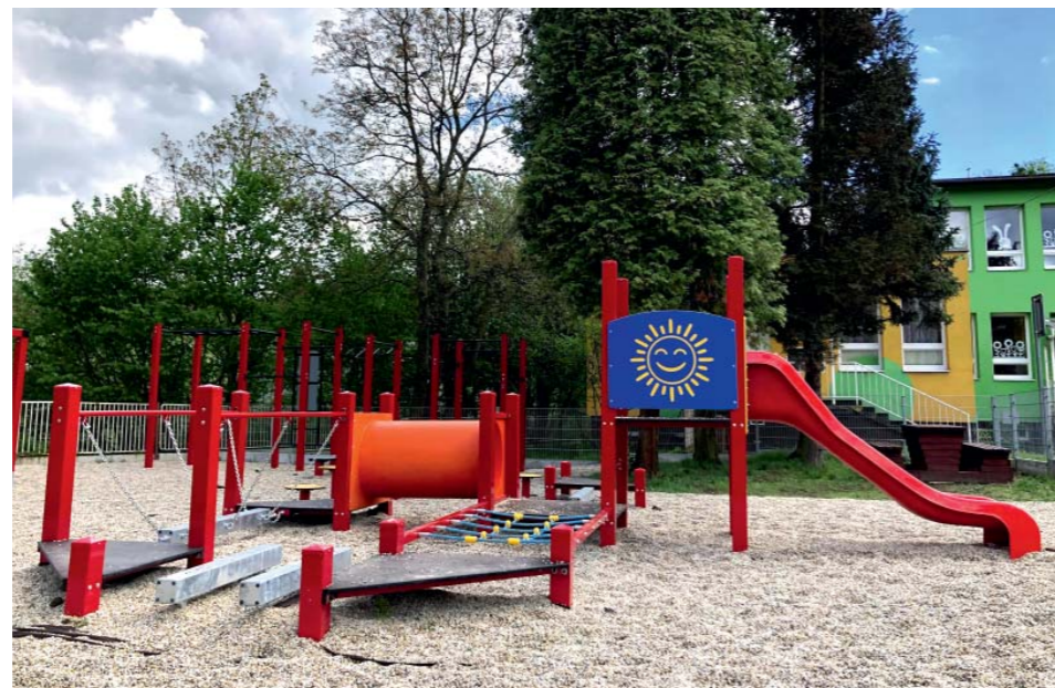
Na hřišti se vyžijí děti i dospělí – součástí je workout.