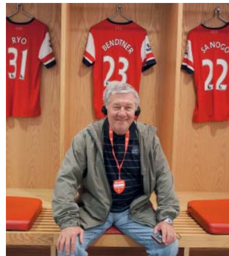
Fotbal měl moc rád.

Celoživotním koníčkem mu byl sport. Začalo to v dětství v SK Slavie Potoky, kde kluci pořádali lité boje s okolními starobělskými klukovskými spolky nejen ze Sovince. Fotbal, hokej, atletika. Za Starou Bělou hrál fotbal. V dorosteneckém věku se přihlásil do hokejového klubu Vítkovice, své místo našel v bráně. V 60. letech