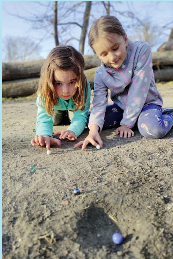
Kuličky a Kuliferdy.