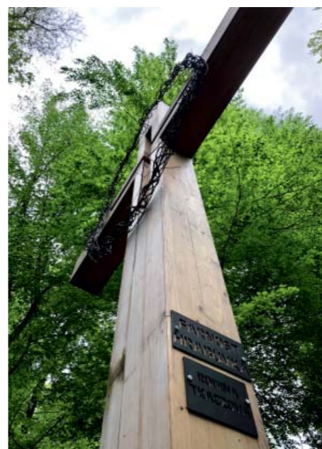
Smrkový kříž má šest metrů.