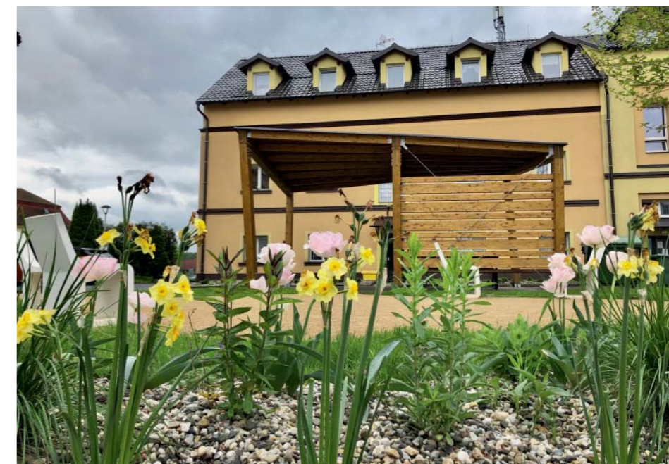
Altán dál budí diskuzi.

jste někdy služeb zahradnické firmy? My ano. V roce 2004 jsme se rozhodli zrekonstruovat zahradu. Vyčistil jsem ji, takže bylo nutné jen zkyprít půdu, osadit rostliny a vyset trávník. Bez jakýchkoli chodníků a zpevněných ploch. Projekt včetně práce nám nabídla a nacenila zahradnická firma. I když jsem jim počty rostlin vydělal dvěma, stejně ta cena byl šok. Kolik by to stálo při dnešních cenách, si netroufnu odhadnout. Nechali jsme je udělat jen to, co bylo vidět z ulice, a zbylou část jsme pak léta dodělávali sami.