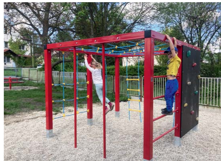
Šplhací sestava má devět prvků, jako jsou lana, tyče nebo malá lezecká stěna.