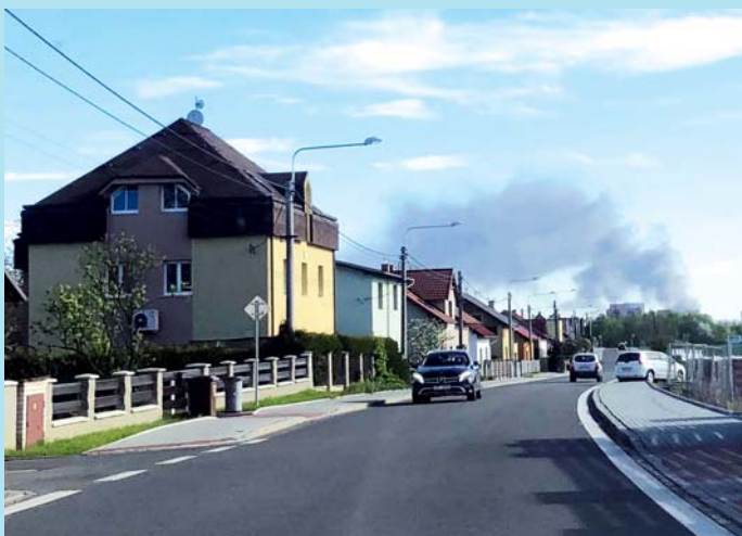
Hoří autolakovna.