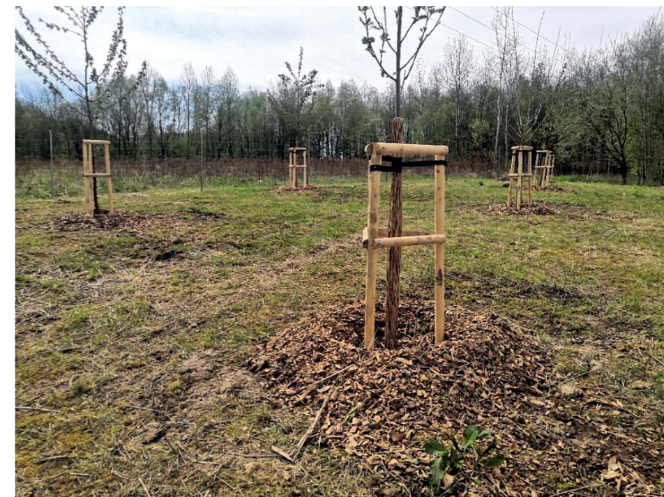
U myslivny je nový ovocný sad.

Stromořadí se sedmnácti duby a pěti hrušněmi přibyla i nedaleko odpočívky Na Honculi. Stromy sadili na konci břez-