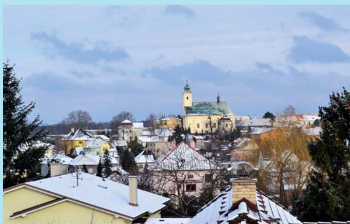
První jarní den 2021.