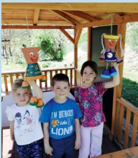
Výrobky z květináčů nově zdobí pergolu na zahradě školky.