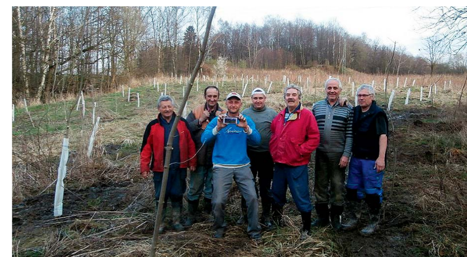
Brigádníci v dubnu sázeli stromy v pískovně na dolním konci.