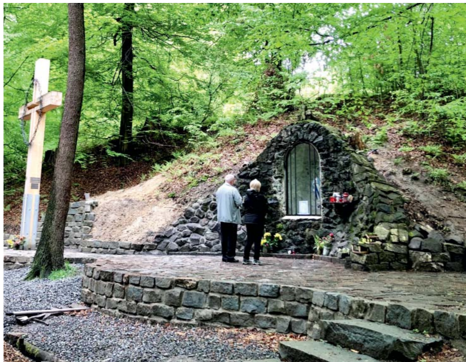
Místo u kapličky a kříže je po kompletní opravě.

Ke zvelebení místa přispěly i ostravské obvody Stará Bělá a Jih, jejichž technické služby na místě pracovaly. „Především jsme poskytli techniku, neboť do údolí potůčku se velké auto nedostane. Takže pokud bylo potřeba něco přivést, přemístit, byli jsme po ruce. Lurdy jsou starobělské. Bylo by nepochopitelné, kdybychom se o ně nezajímali. Určitě stojí za návštěvu. A když si počkáte, až přes du-