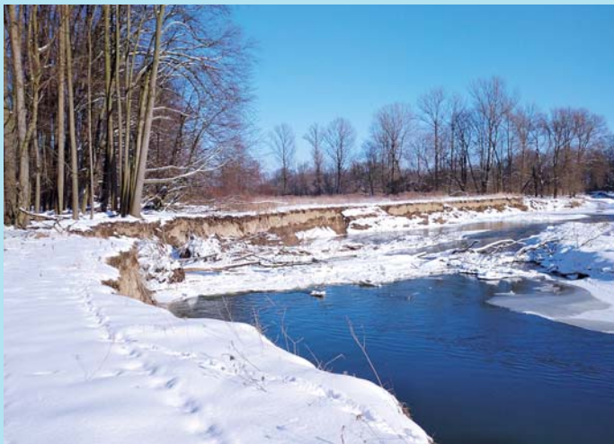
Odra v zimě.