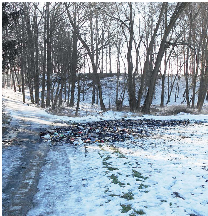
(joh) Požár černé skládky hasily dvě jednotky hasičů.

Svědci se mohou obrátit přímo na tajemnici Jarmilu Kaločovou - zavolat na číslo 723 430 780 nebo napsat na mail jkaloцова@starabela.cz .