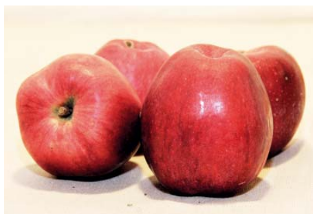
Stará odrůda jabloně Malinové hornokrajské.

V mé generaci není úplně běžné, že by se zahradničením někdo v takové míře zabýval. Na druhou stranu, čím jsem starší, tím větší pochopení mí vrstevníci mají. Mám takový tajný tip, že mnozí z nich se k aktivnímu zahradničení v průběhu života také dostanou.