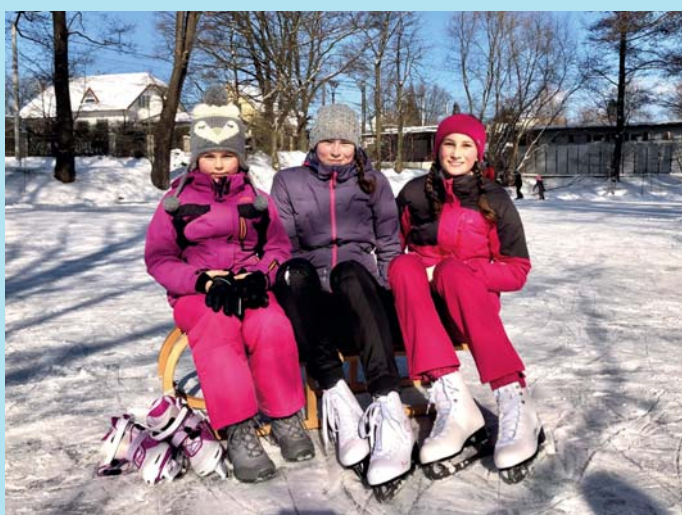
Na rybníku.