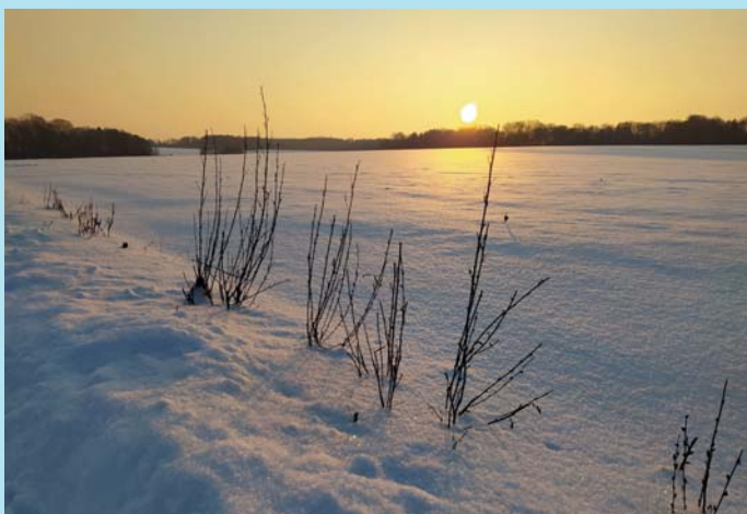
Zimní pohádka.