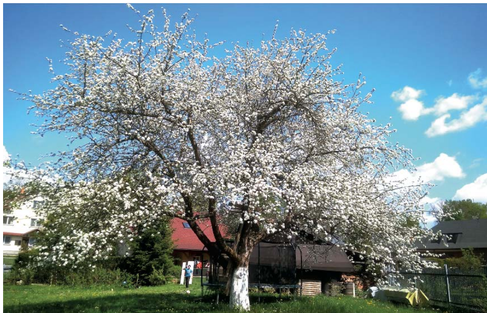
Stoletá Jadernička moravská v květu, Stará Bělá, květen 2020.

Velkým kladem těchto odrůd je také to, že jsou osvědčené v místních pod-