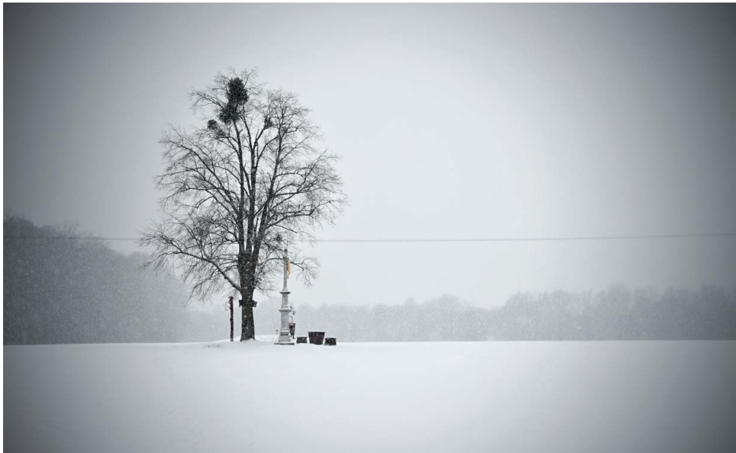
Staňkův kříž. „Foceno Nikonem D 7500, objektiv Nikon 35 1,8 mm,“ dodává Jan Král.