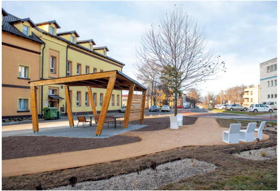
Altán u kostela má fanoušky i kritiky.

Co se týče dvou bleskových textů oponentů pod mým článkem. První z nich připomíná, že vybudování altánu měla KDU-ČSL ve volebním programu, jehož plnění samozřejmě oceňuji. V návaznosti na mou otázku ohledně ceny projektu se však autor článku snaží argumentovat jakýmsi srovnáním ceny altánu s cenou plotu a opěrné zdi. Respektive se autor snaží porovnat neporovnatelné. Myslím si, že většina Starobělanů stavěla plot, altán se zámkovou dlažbou a někteří i opěrnou zeď. Občané tak mají pojem