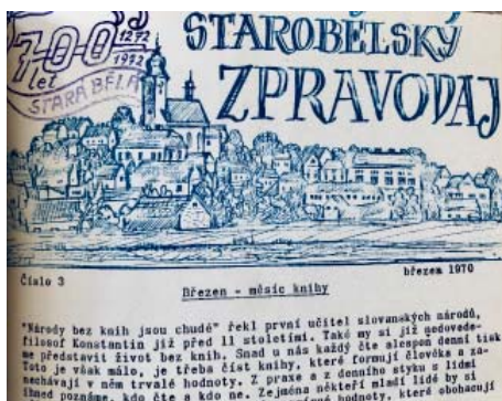
Titulní strana z března 1970.

Bělá zase součástí Ostravy, musel každý text schvalovat odbor kultury národního výboru. Schvalovali všechno. I plakáty na fotbalová utkání.