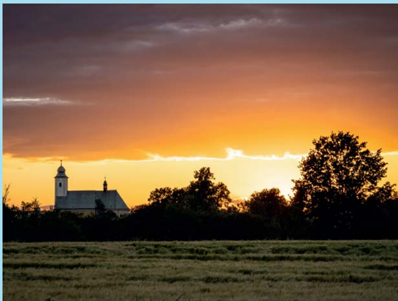
Kostel při západu.