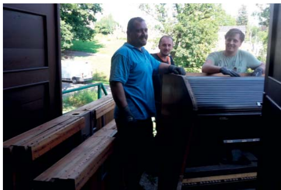
Stěhování nástroje není jen tak.