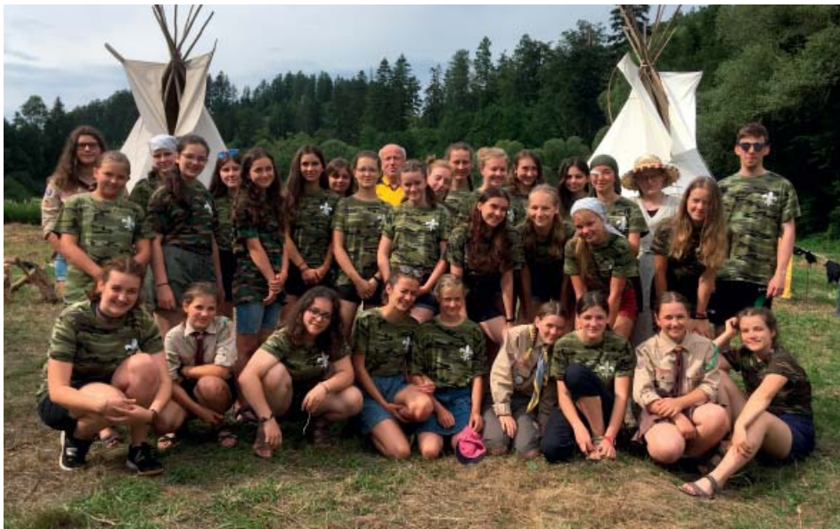
Staroběšské skautky se letos na táboře věnovaly také vědě a vesmíru.

Dominantní jsou ale vždy hry etapové. To jsou ty, které určují táborové téma. Letos jsme byly vědkyně sestavující raketu Movisiti modelu 25, která měla vzlétnout do vesmíru, konkrétně do galaxie Kerjasama, ve které se nachází planeta Paseduru. Státy Grónsko, Indie, ČAD, Řecko a Mexiko (což byly naše sku-