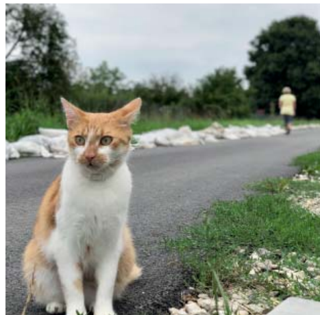
Obyvatelé Starecké volají po prohloubení koryta potoka.

Od km 1,650 začíná levobřežní zástavba kolem ulice Na Lukách, v km 1,850 až 2,100 se nachází ulice Starecká. Další orientační body: Ulice Na Surdíku začíná