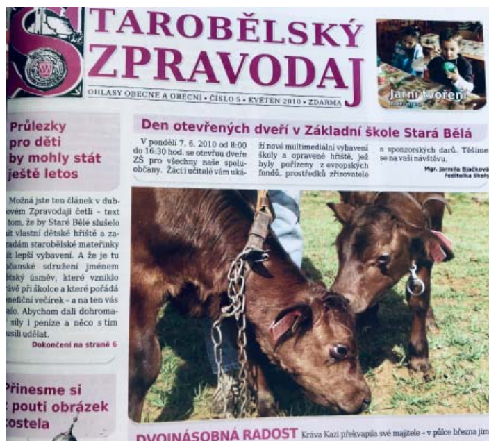
V květnu 2010 vypadala první strana následovně.