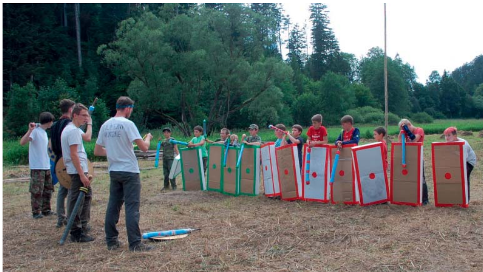
Vlčata v akci. Proměnila se v římské legionáře.

Letošní tábor 22. Smečky vlčat se konal 5.-14. července nedaleko vesnice Čermná ve Slezsku. Desetidenní pobyt v přírodě se zúčastnilo čtrnáct dětí ve věku od šesti do jedenácti let.