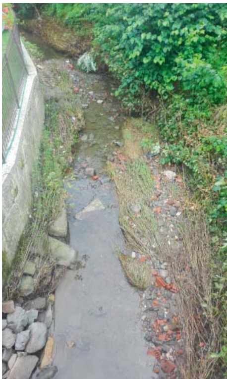
Starobělský potok po povodni v červnu 2020 - stavební suť do vodního toku nepatří.

A přesto se objevují požadavky na zatrubnění i nyní a mnohdy s neuvěřitelným argumentem, že voda v toku „smrdí“ a je hygienickou závadou. Modernizace obcí znamenala za posledních 50 let vybudování inženýrských sítí, pro které však občané neposkytli pozemky, a ty jsou pak vedeny bezprostředně podél