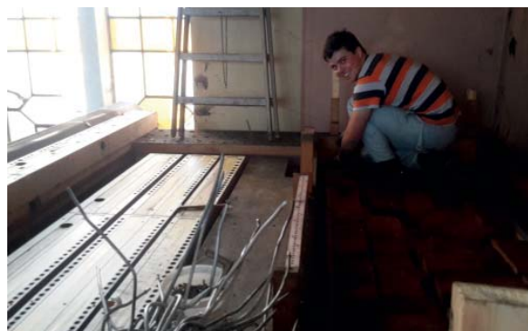
Vše se musí rozebrat a na novém místě přeložit.