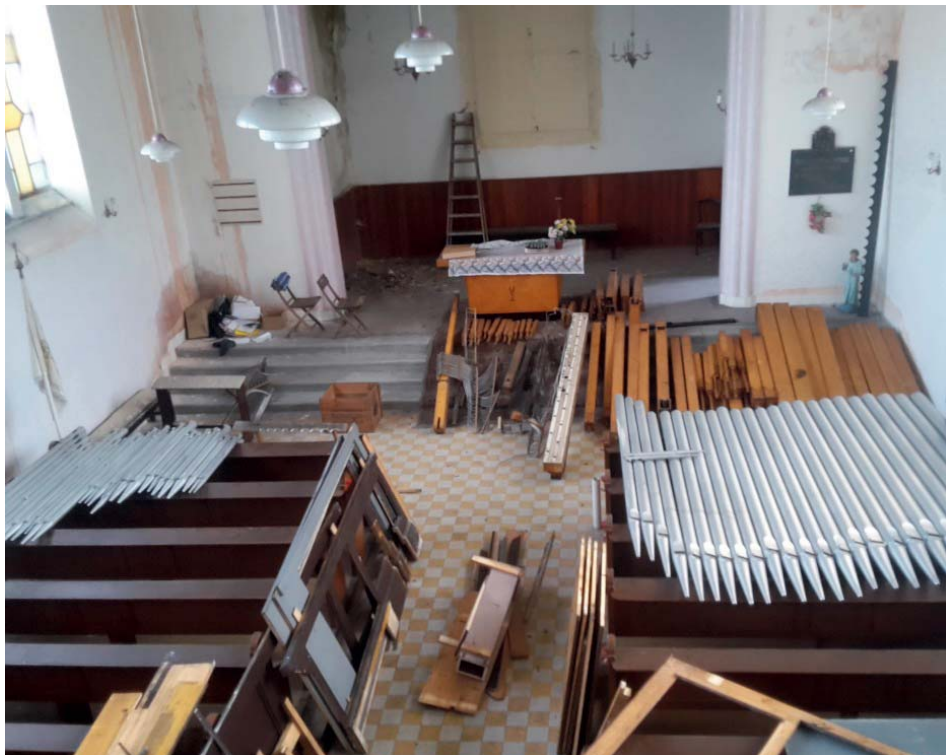
Nástroj, na nějž se bude v husitském kostele hrát, není nový. Je dovezený z jiné farnosti.