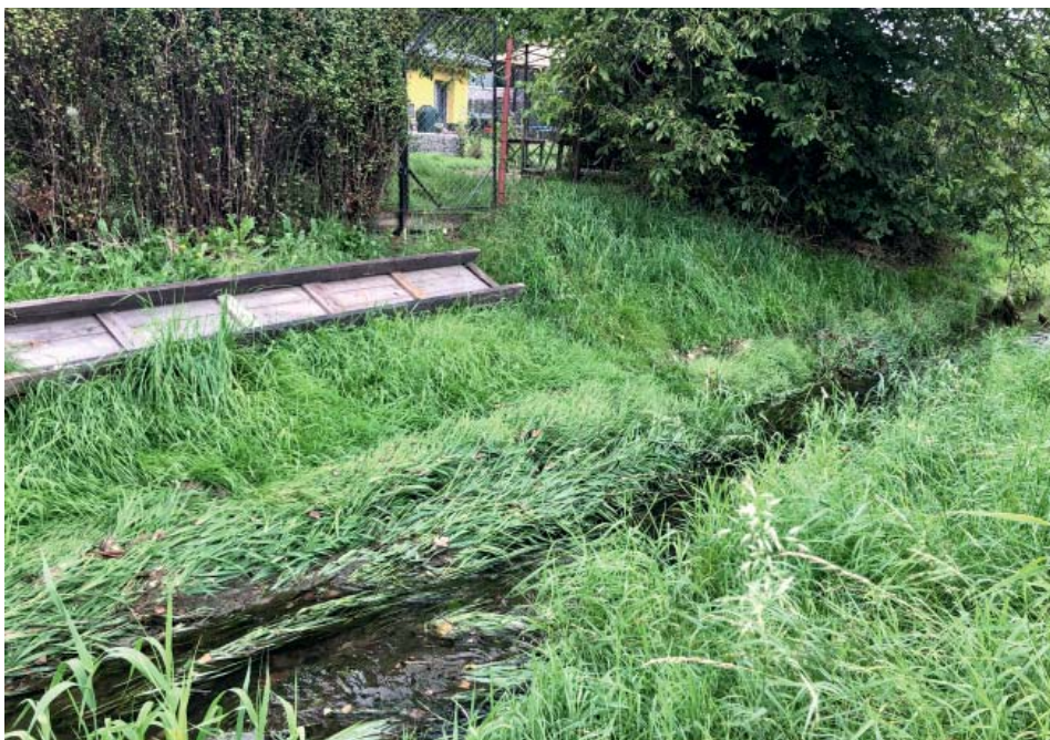
Starecká ulice na dolním konci. Starobělský potok se tu letos opakovaně vylil z břehů.

na km 2,615, stupeň na ulici Potoky je km 3,720 a zatrubnění toku u Masaryka začíná na km 5,084.