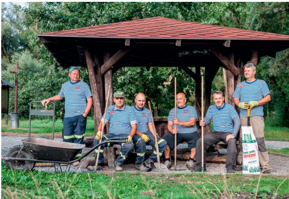
O proměnu odpočívadla na Honculi se postarali především vodáci.

Kromě vodáků s pracemi na odpočívadle vypomohou i starobělští fotbalisté či hasiči, tak aby platilo, že jde o komunitní projekt napříč spolky. „Honcula vždy vybízela k setkávání lidí, k výletům, v létě ke koupání, je to vstupní brána do Poodří. Na takové místo patří zázemí. A když