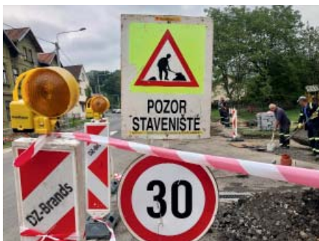
Přestavba zastávky U Lípy.

Došlo také na úpravu přechodu pro chodce - ten se o kousek posunul, ale především je doplněn o světelnou signalizaci. Funguje na stisknutí. „Přechod se semaforem u zastávky je určitě dobrá volba. Za mě by semafor měl mít integrovaný radar a při překročení rychlosti přepnout na červenou jako například v Klimkovicích. A takových přechodů by mělo být na Mitrovické více,“ okomentoval na