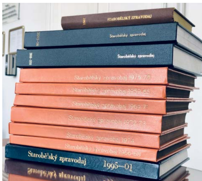
Jednotlivá vydání a ročníky jsou seskupené do svazků.