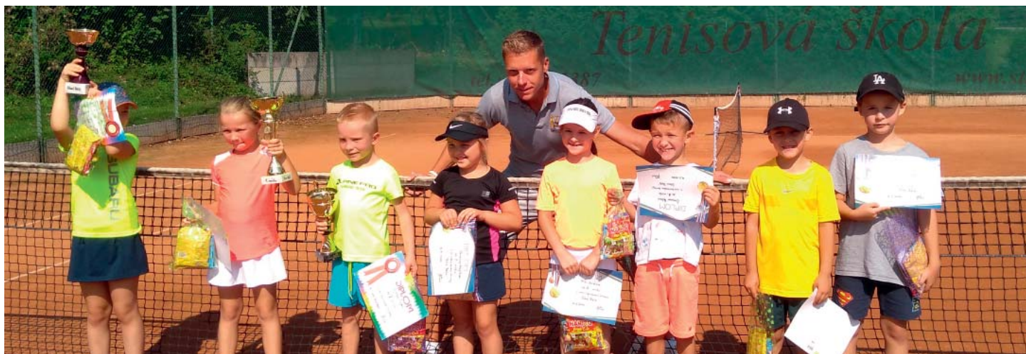
Tenisová škola, kde se děti učí tenisovým dovednostem, vyučuje už řadu let na starobělské antuce.