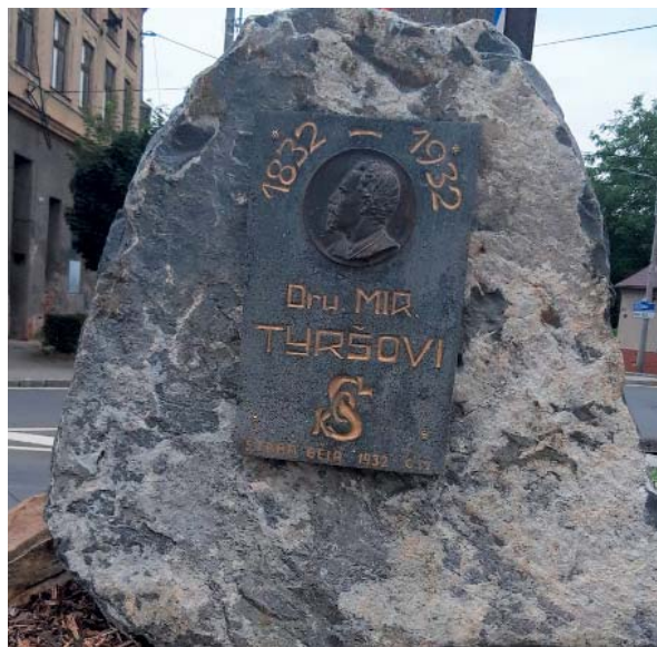
Historická a současná podoba pomníku. Deska je tatáž, změnilo se pozadí.