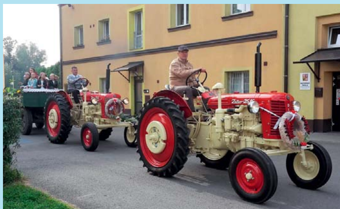
Bělské dožínky.