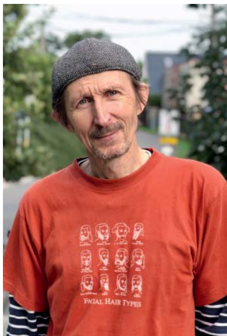
Herec Vladimír Javorský.

Kolikrát jsem tu proležel čtrnáct dnů prázdnin. Tenkrát se dovolené tolik nenosily, všichni museli do práce. Takže já jsem byl buď po táborech, nebo tady u babičky. Na křižovatce byla cukrárna,