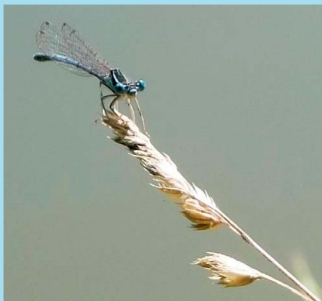
Vážka na stéble trávy.