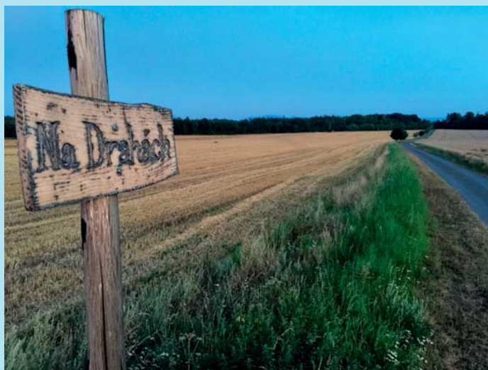
Na Drahách.