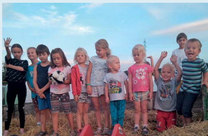
Radost ze společného setkání koncem léta měly i děti. Užily si překážkovou dráhu vystavěnou i z toho, co dalo pole.