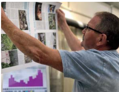
Tištěné strany je potřeba průběžně kontrolovat. Podílí se na tom postupně hned několik lidí.

Je zřejmé, že tiskařina je alchymie, musíte znát zákonitosti a přistupovat k papíru pokorně, jinak se vám dařit nebude. Starobělský zpravodaj logicky není tím jediným, co firmu vytěžuje. Kromě radničních listů z kraje a jiných koutů Česka tu na digitálním i ofsetovém tisku vyrábějí vizitky, plakáty, brožury, katalogy i knihy. „Zpravodaje jsou jedna z nejpříjemnějších prací, děláme je nejraději. Patří k těm méně složitým zakázkám. Vše na jednom papíře, vytiskne se, sešije a je hotovo,“ vysvětlují oba jednatelé společně.