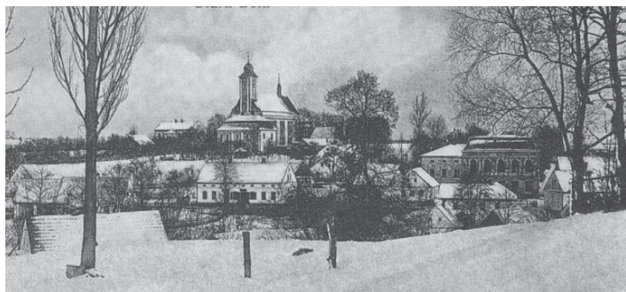
Stará Bělá na archívním snímku.