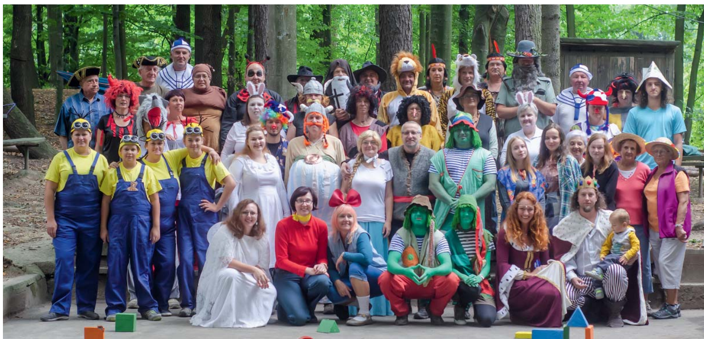
Bez starobělských Sokolů a jejich blízkých by to nešlo. Organizátorům to rok od roku sluší víc!