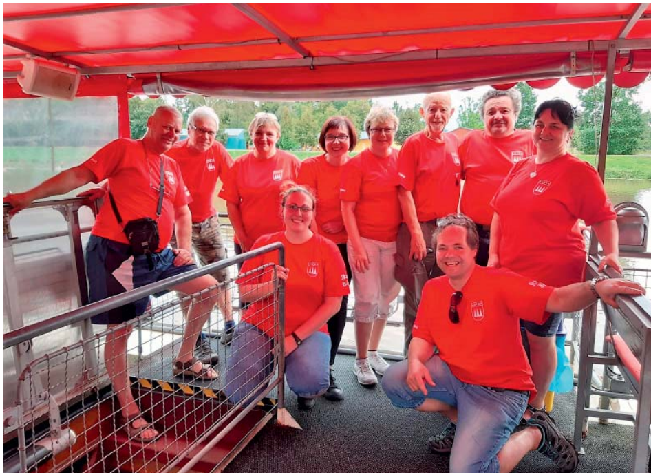
Starobělská výprava na letošním setkání čítala deset lidí.

V příštím roce se setkání Bělanů koná v České Bělé a hned poté – v roce 2022 – bude akci hostit Stará Bělá. „Budeme slavit 750 let vzniku obce, tak si na druhý červnový víkend nic neplánujte,“ připomněl zdejší starosta. (joh)