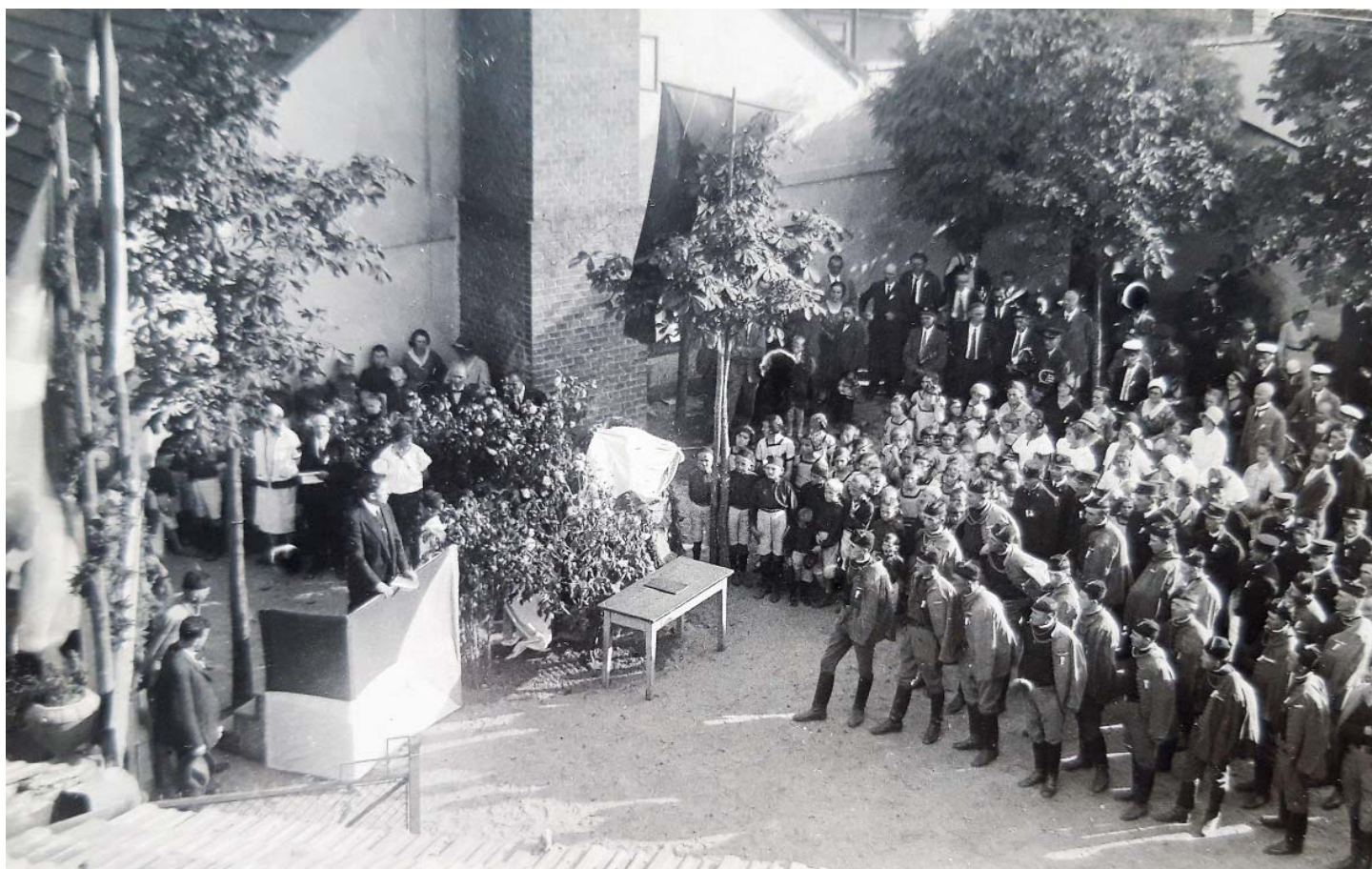
Odhalení pomníku bylo velkou slávou. „Po odhalení uspořádána byla v sokolovně tělocvičná besídka,“ stojí ve starobělské sokolské kronice.