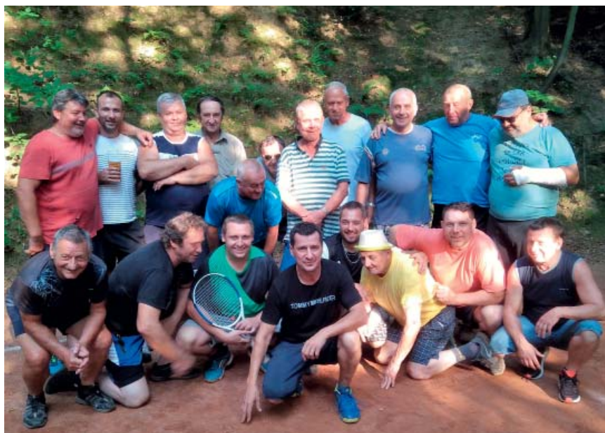
Účastníci tenisového turnaje v pískovně.