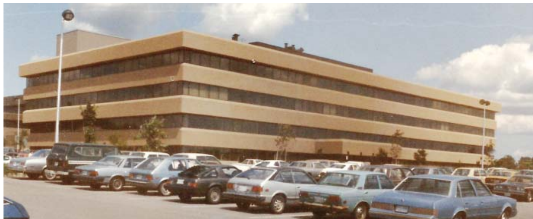
Sídlo Kanadské atomové agentury v Mississauga.

Jenom pro představu, jaké má těleso parogenerátoru VVER 1000 rozměry - délka 14,5 m, průměr 4,5 m, tloušťka stěny 80 mm, celková hmotnost cca 220 tun. Do tělesa jsou veřazeny dva nerezové kolektory, které jsou uvnitř nádoby spojeny soustavou nerezových trubek o průměru 16 mm a tloušťce 1,6 mm. Do vstupního kolektoru je nerezovým potrubím o průměru 600 mm přiváděna parovodní směs z reaktorové nádoby