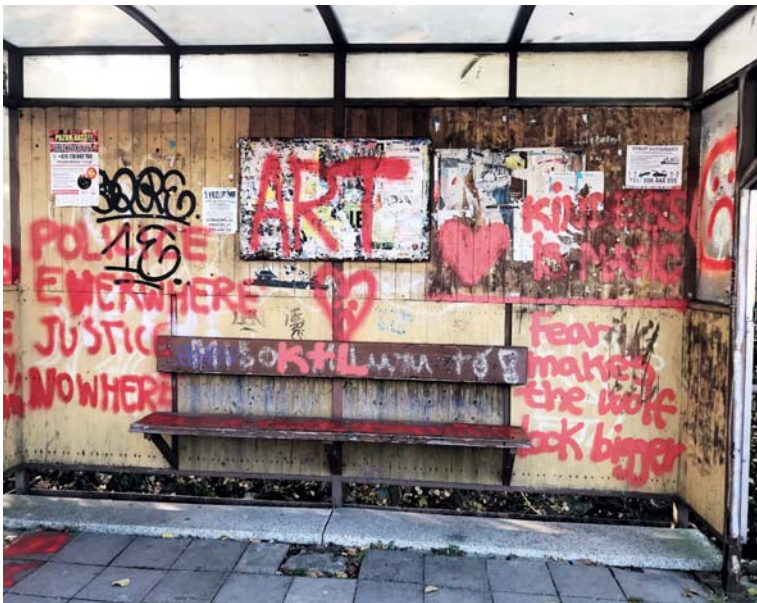
Výsledek řádění vandala.