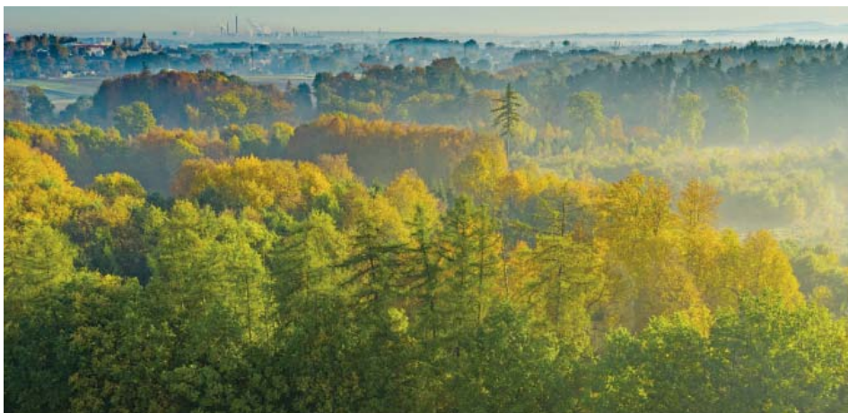
Starobělský východ slunce.

jímavý a okouzující, a když mi kamarád ukázal tento druh fotek, bylo rozhodnuto. Zakoupil jsem před rokem a půl dron a začal se učit ovládání a seznamovat se s focením z dané perspektivy.