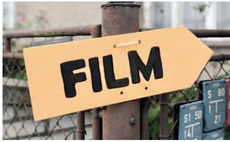
Cedulka napovídala směr.