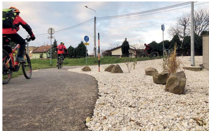
Pojí se tu stezky z Proskovic, Polanky a Staré Bělé.

Z provedení akce Trojúhelník, jak si ji pro sebe doma pojme-