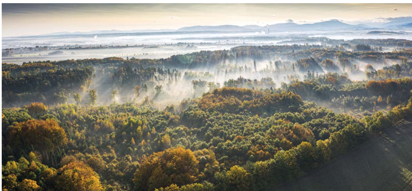
Paskov a za ním beskydské panorama.