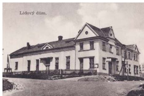
Katolický (lidový) dům.