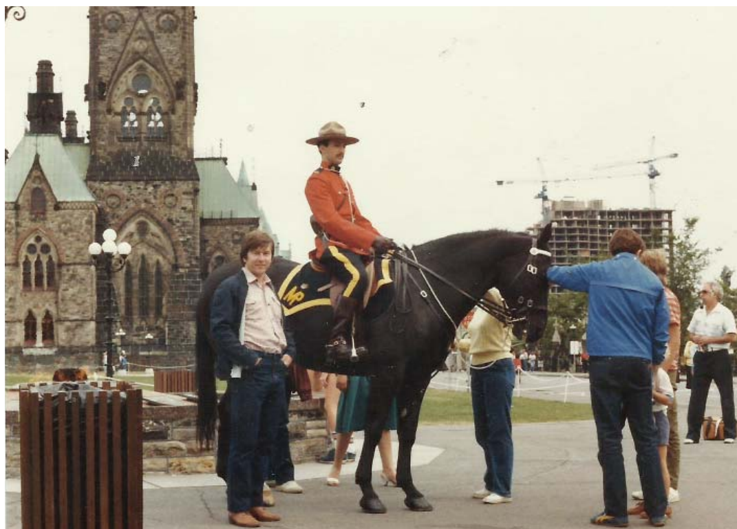
Jezdec kanadské jízdní policie před kanadským parlamentem v Ottawě.

na takovou dobu jednodu- chou záležitostí. Měl jsem tehdy 34 let, v roce 1981 jsem prodělal těžký úraz popálením, který byl sice již zhojen a lékaři mi v odjezdu nebránili, měl jsem doma ženu a dvě děti ve věku 11 a 9 let, jel jsem tam úplně sám, do neznámé-