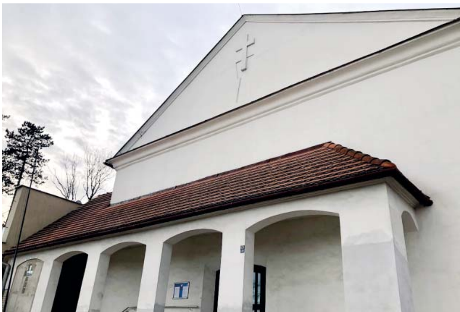
Na kúru v Husově sboru je nový hudební nástroj.

Po prohlídce těchto varhan jsme zhodnotili, že jsou stále dost dobře funkční a použitelné, i když se na ně dlouho nehrálo a nebyly opravovány. Po dlouhém zvažování a diskusi jsme se rozhodli pro