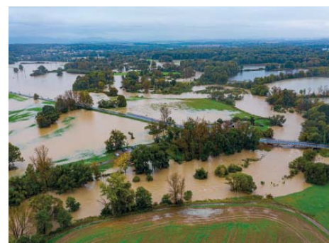
Odra ven z koryta.