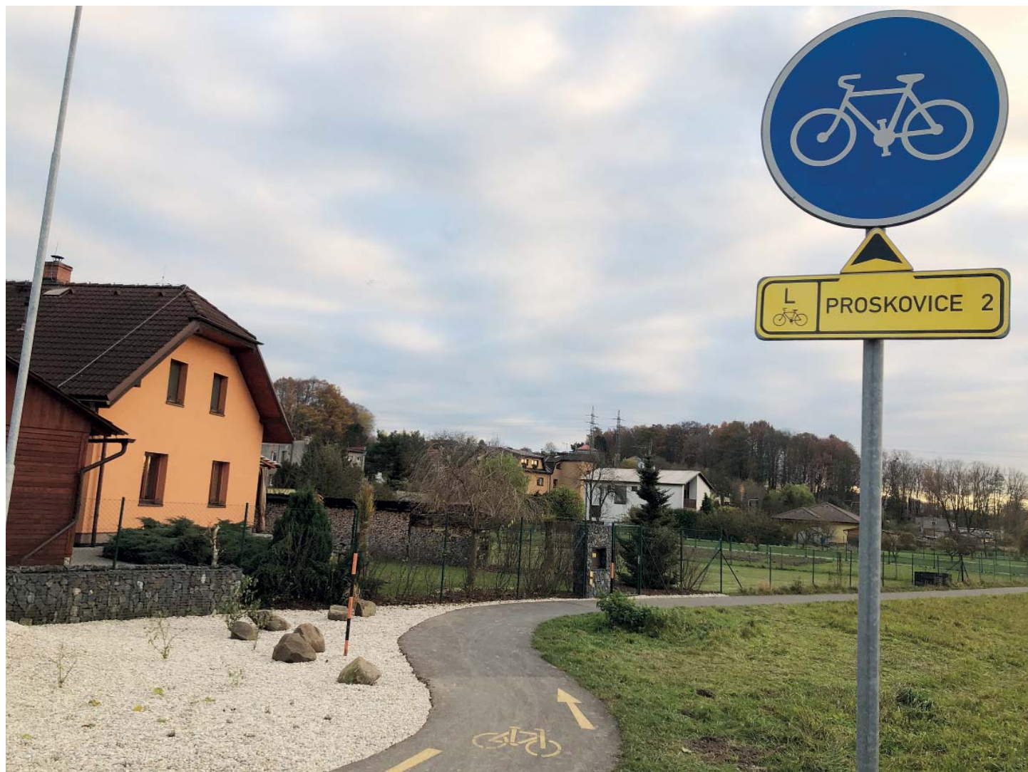
V zatáčce byl původně obyčejný travnatý záliv. Teď ho nahradil kačírek s většími kameny a rostlinami.

novali, jsou nadšení. „S manželem jsme jen chtěli, aby to tady u nás, na dolním konci, bylo hezké, útulné. Podle našeho názoru i dle prvních ohlasů sousedů a cyklistů se to povedlo. Jsem tomu ráda. Pracovali poctivě a rychle. Teď budu doufat, že to vydrží léta pěkně,“ věří Starobělanka. (joh)