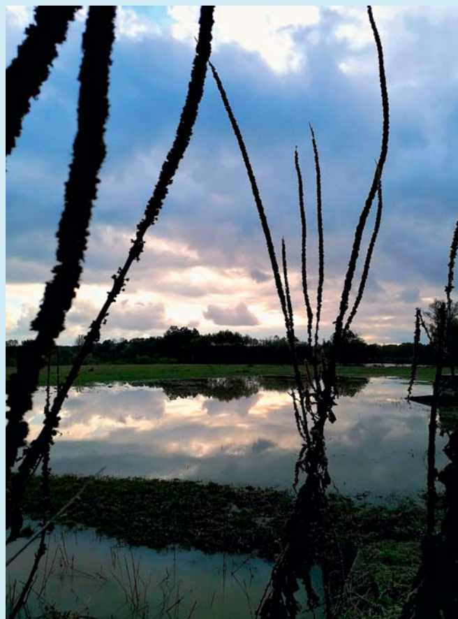
Luka pod vodou.