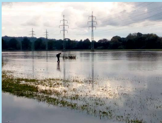
Luka pod vodou.