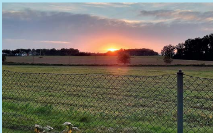
Západ slunce.