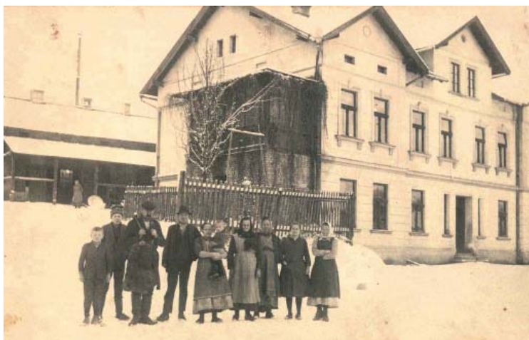
Jedno a totéž místo na současném a historickém snímku. Dům býval jedním z architektonických skvostů obce.