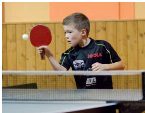
Nejmladší posila rodinného týmu.