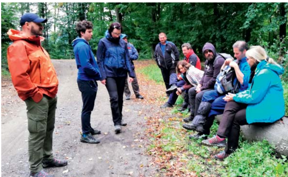
Sokolové rovná se pohyb. Společné výšlapy k sokolské partě patří.

Letos se cvičitelé vydali do Oder-ských vrchů na chatu Kaménka. Počasí sice moc nepřálo, ale přesto se vydali