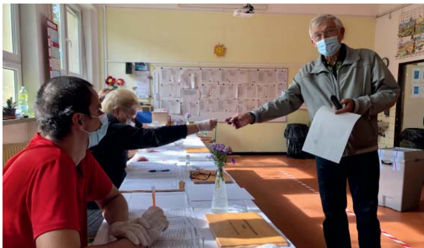
Hygienická opatření museli ctít voliči i členové komisí.