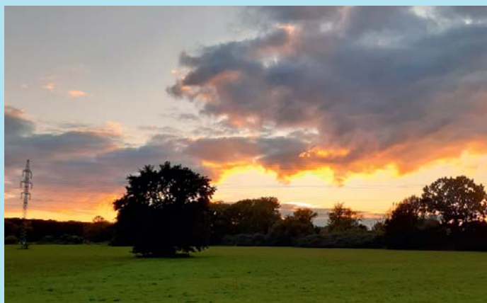
Neděle na lukách.