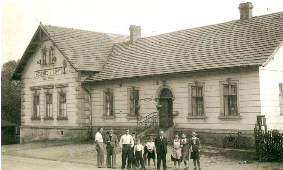
Foto hostince U lípy kolem roku 1939. Uprostřed lidí majitel Karel Choleva.

Součástí hostince se v roce 1899 stala také dřevěná kuželna, jak je vidět na pohlednici z roku 1907. Ve dvacátých letech minulého století bylo na zahradě, patřící k hostinci, vybudováno sportoviště, kde