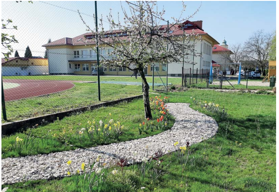
Školní zahrada rozkvetla. Až se děti vrátí, budou se v ní učit přírodovědě.

Školní web je v těchto dnech základním komunikačním prostředkem.