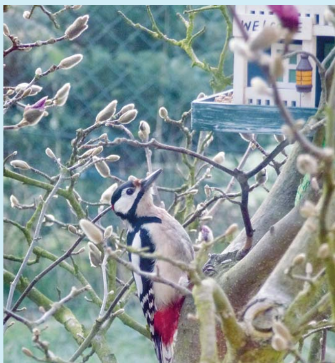
U krmítka.