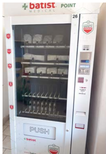
Rouškomat stojí v přízemí zdravotního střediska.

Obvod zdarma rozdává i roušky látkové, stačí si pro ně zajít do budovy úřadu. „Díky starobělským ženám máme ušito více jak dvě stě bavlněných roušek,“ osvětluje starosta.