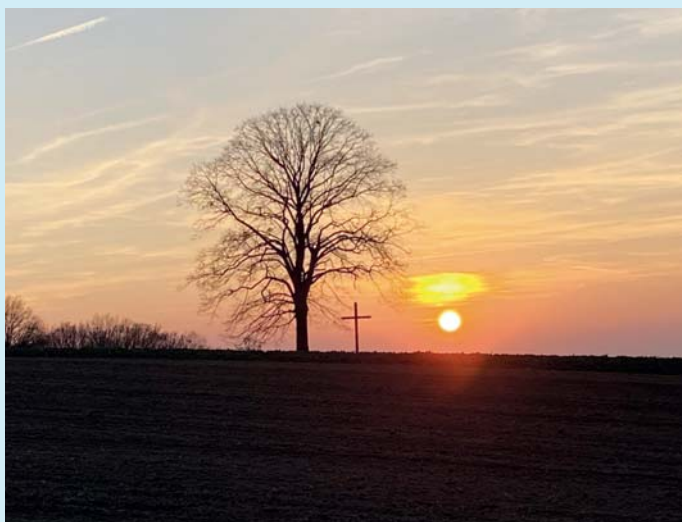
Nad Klečkovou.