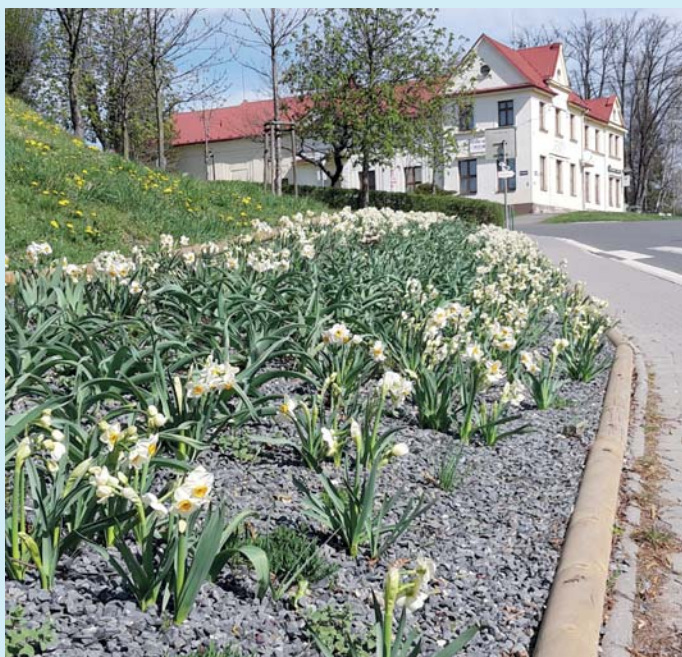
Pod Katolickým domem.