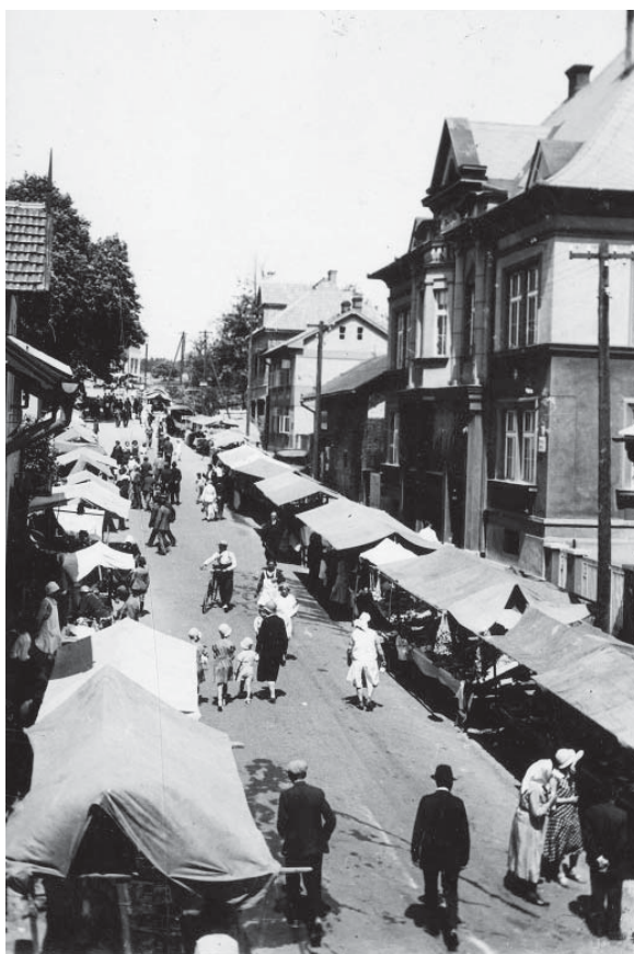
Pouť v roce 1935.