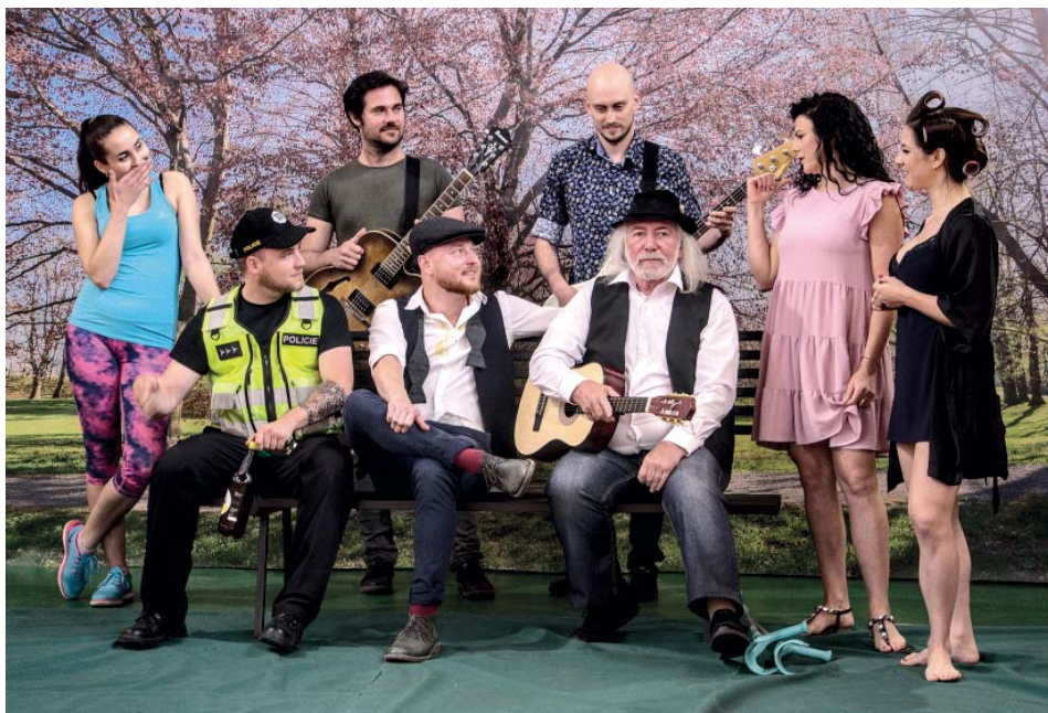
Během covid-jara si pronajali sokolskou tělocvičnu a natočili klip k autorské písni Otázky.