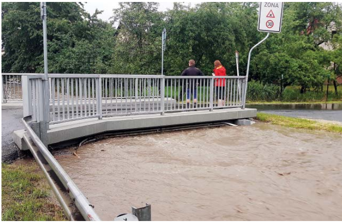
Starobělský potok se místy vešel tak tak do koryta.