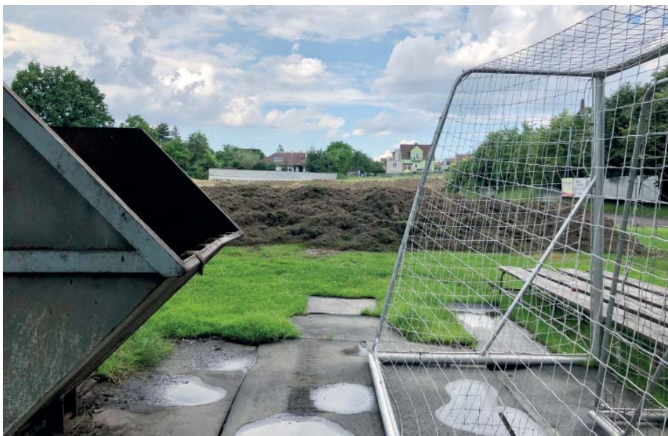
Trávník na hřišti prochází velkou rekonstrukcí. Původní krytí muselo kompleť dolů.

Jak asi starobělská veřejnost ví, je fotbalový areál od roku 2012 v majetku města Ostravy. Proto jsme již od roku 2013 podávali pravidelně požadavky na tyto investice do našeho fotbalu, avšak vždy se našly důvody, proč nám nebylo vyhověno. Argumentovali jsme i tím, že náš FK je na území města Ostravy co do počtu aktivní mládeže na 3.-4. místě po Baníku Ostrava a Vítkovicích a mož-