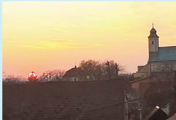
Západ nad kostelem.