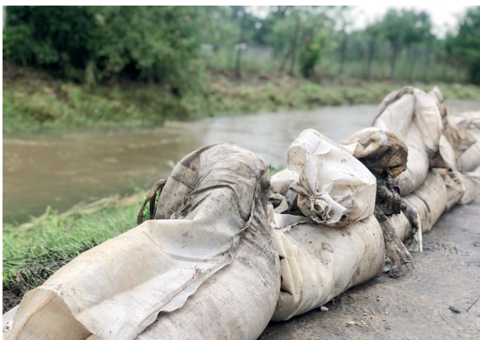
Pár pytlů s pískem u břehu Starobělského potoka.