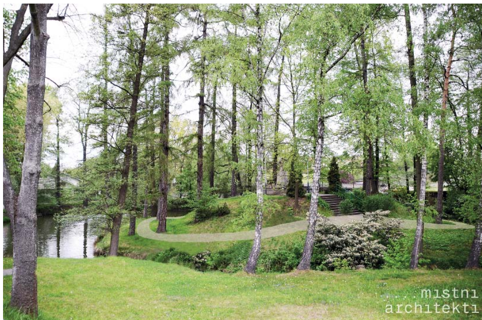
Jak by mohla vypadat starobělská Zámčiska po proměně.

Výrazně upravenější podobu dostane dlouhý pás zeleně mezi ulicemi U Sochy a plotem hřbitova. Mělo by se z něj stát místo pro relaxaci s výhledem na vodu. „Momentálně je přepad z rybníka zatrubněný do kanalizace. První krok je to otevřít, pustit místem potok. Terénně je to příznivé, takže by se mohl rozlít a vznikla