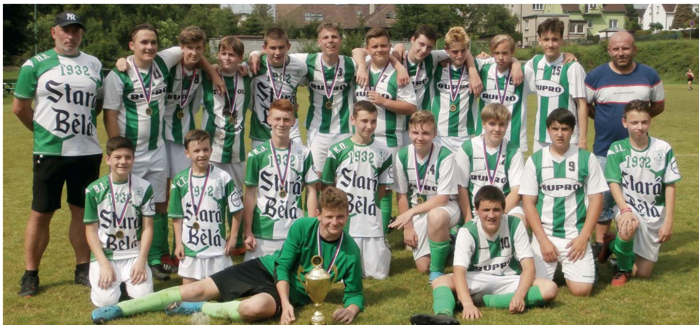
Tým starších žáků po finálovém utkání na domácím hřišti.