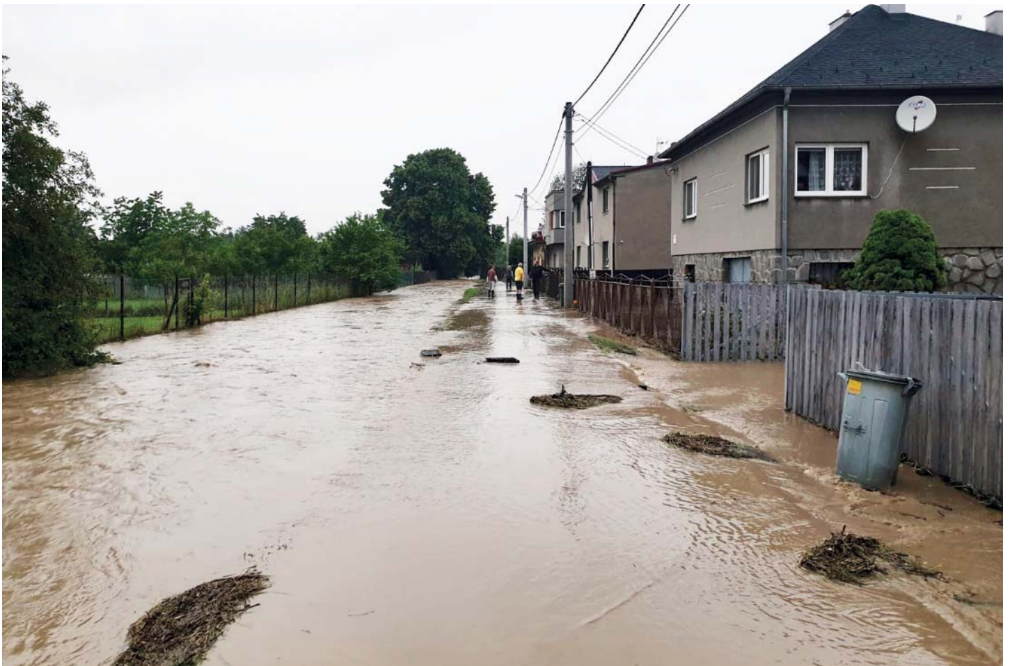
V klidovém stavu je vlevo rozeznatelné koryto potoka na Starecké, vpravo silnice.