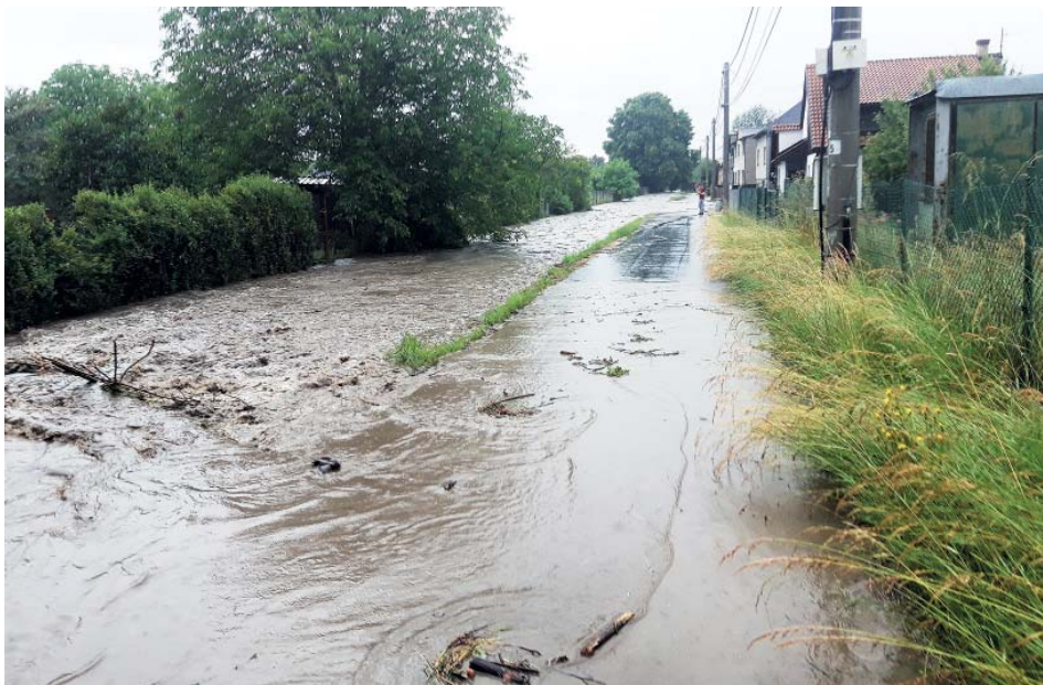
Ulicí Stareckou se 18. června prohnala voda. Situace se opakovala také o osm dní později.