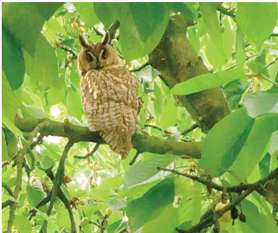
Opeřence identifikovali hostitelé i odbornice ze zoo jako kalouse ušatého.

V podstatě si však kalousi dneska mohou vybrat z velké nabídky hnízd krkavcovitých pěvců i dravců, takže nedostatkem hnízdních příležitostí určitě netrpí.“ Jak mluvčí doplnila, pokud se u vás kalous objeví, nejsou potřeba žádná extra opatření ani výpomoc. Stačí opeřence nerušit. „Pokud u vás zahnízdí, pak se po nějaké době začnou ozývat mláďata