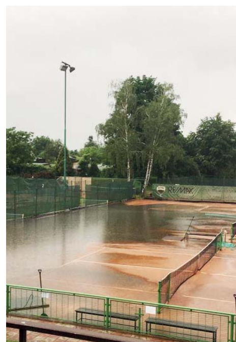
Přívalový déšť zaplavil i kurty.