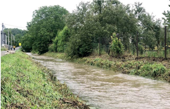
Když neprší, voda téměř nebývá vidět.