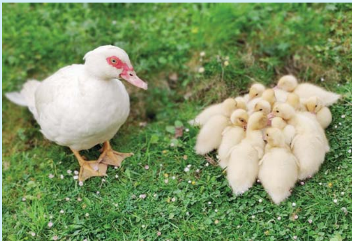
Jaro je tady.