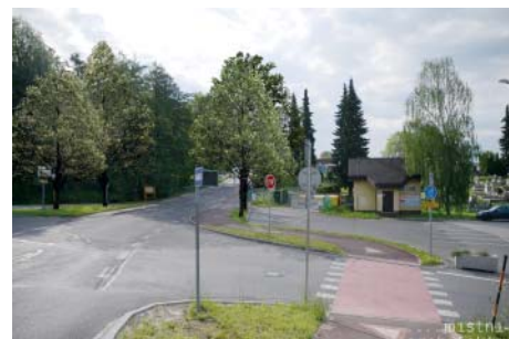
U křižovatky by měly přibýt stromy.