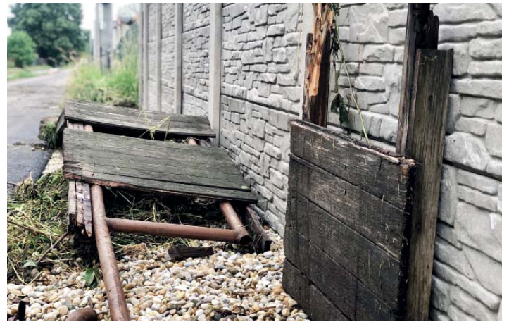
Hasiči museli odstranit můstek.