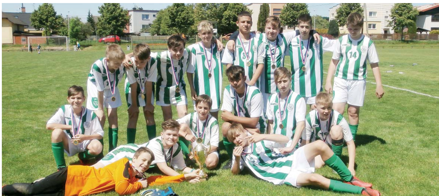
Mladší žáci FK Stará Bělá po finále na hřišti SK Šenov.