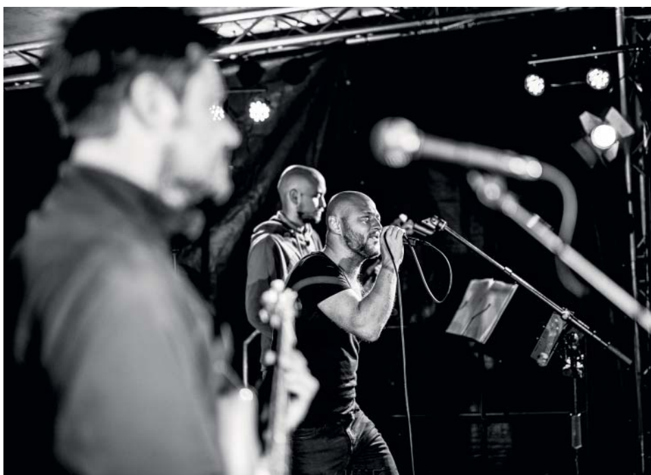
Foxy Hunters hrají povětšinou písničky v angličtině.

» koníčky: florbal za TJ Sokol Stará Bělá, on-line hra NHL na Xboxu