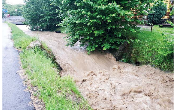
Lidé ze Starecké si stěžují, že potok má zanesené koryto.