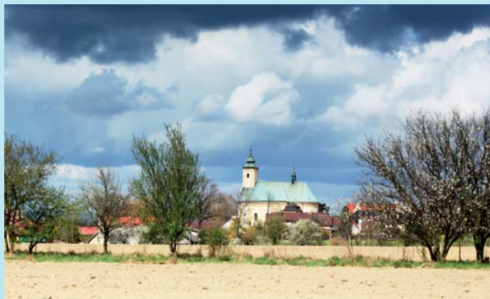
Z drah.