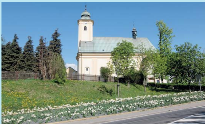
Kostel na jaře s narcisy.