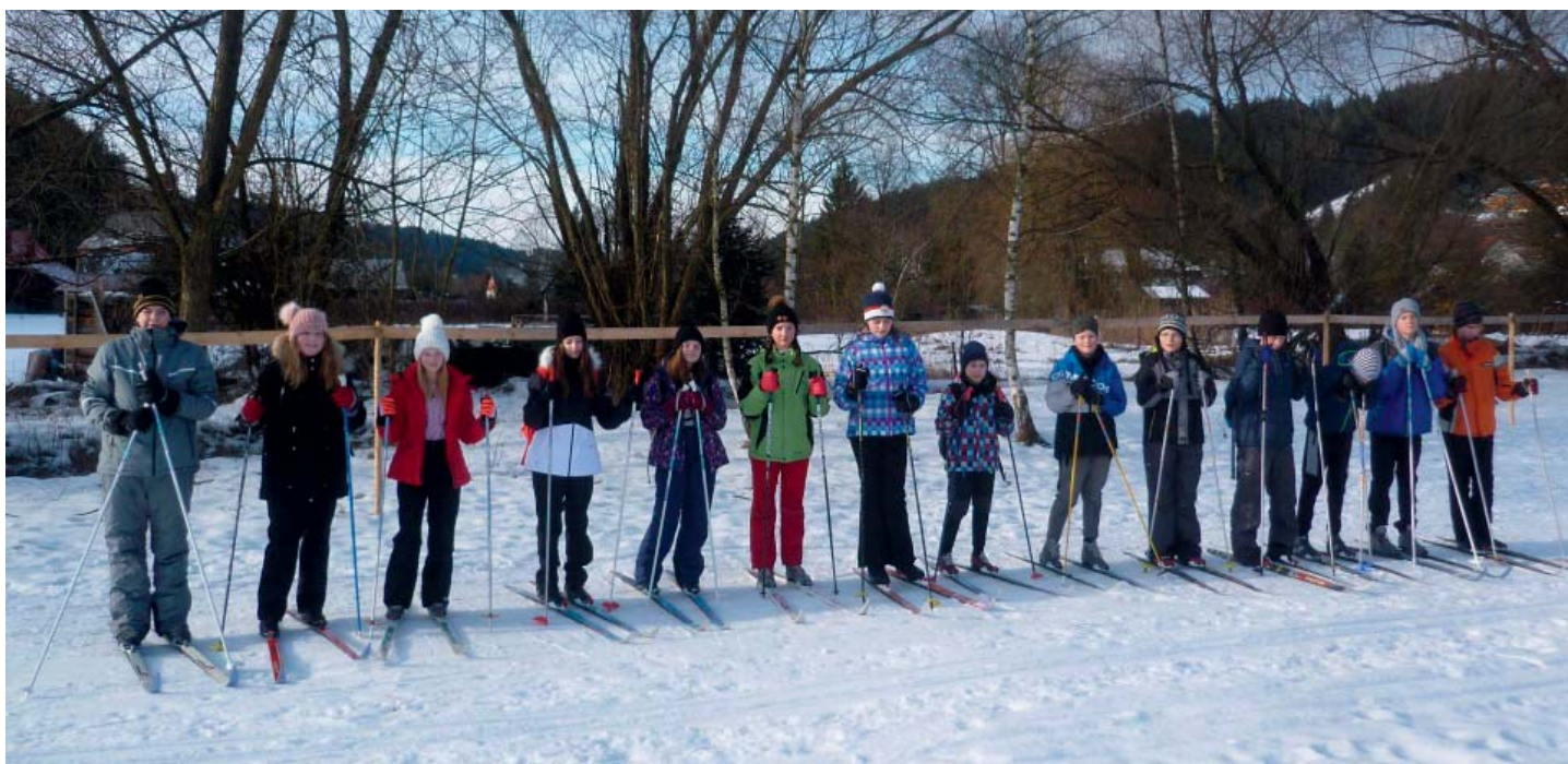
Kromě sjezdového lyžování došlo i na tradiční výcvik na běžkách.