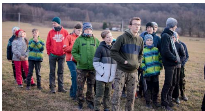
Když výprava, tak v terénu.