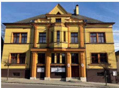
Úřad starobělského obvodu.

V rámci rozsáhlé integrace byla připojena v roce 1975 k Ostravě, což platí pro většinu vnějších částí. Do roku 1975 Ostrava dynamicky populačně rostla. Poté začala ztrácet, už nebyla atraktivní pro