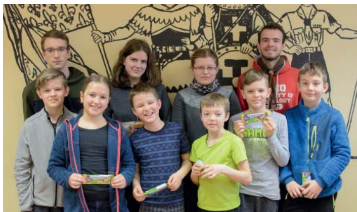
Skauti vyrazili do Kopřivnice.