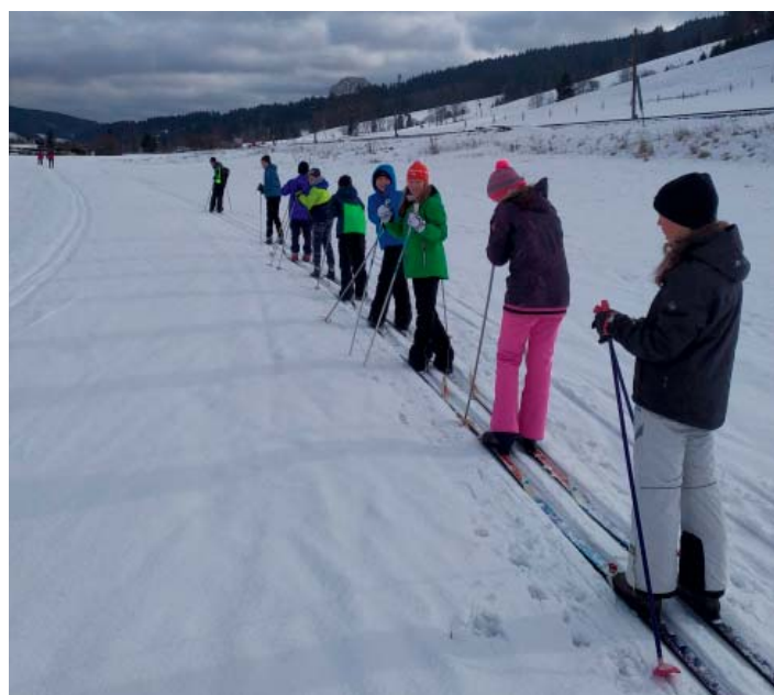
V běžecké stopě. Mnozí poprvé.