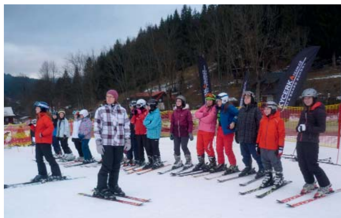
Rozdělení do družstev k lyžáku patří.