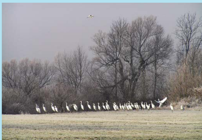
Ranní probuzení u Odry.