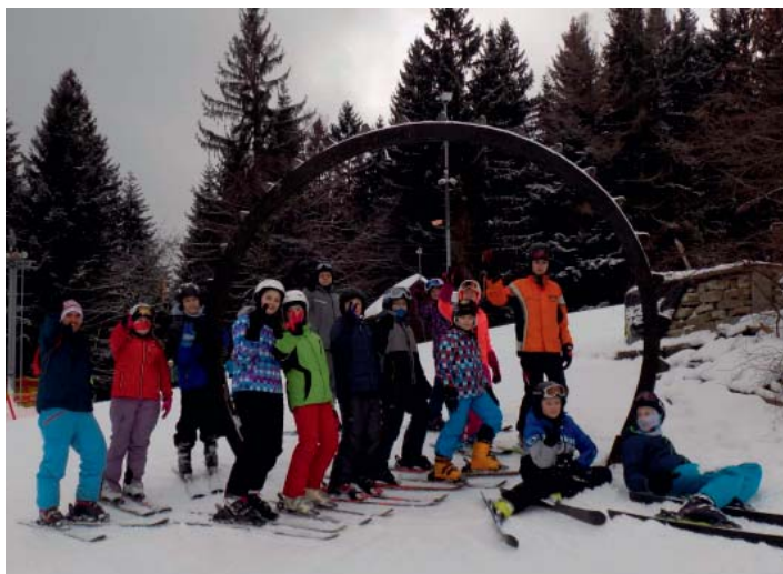
Vedle sportování šlo i o tužení party.