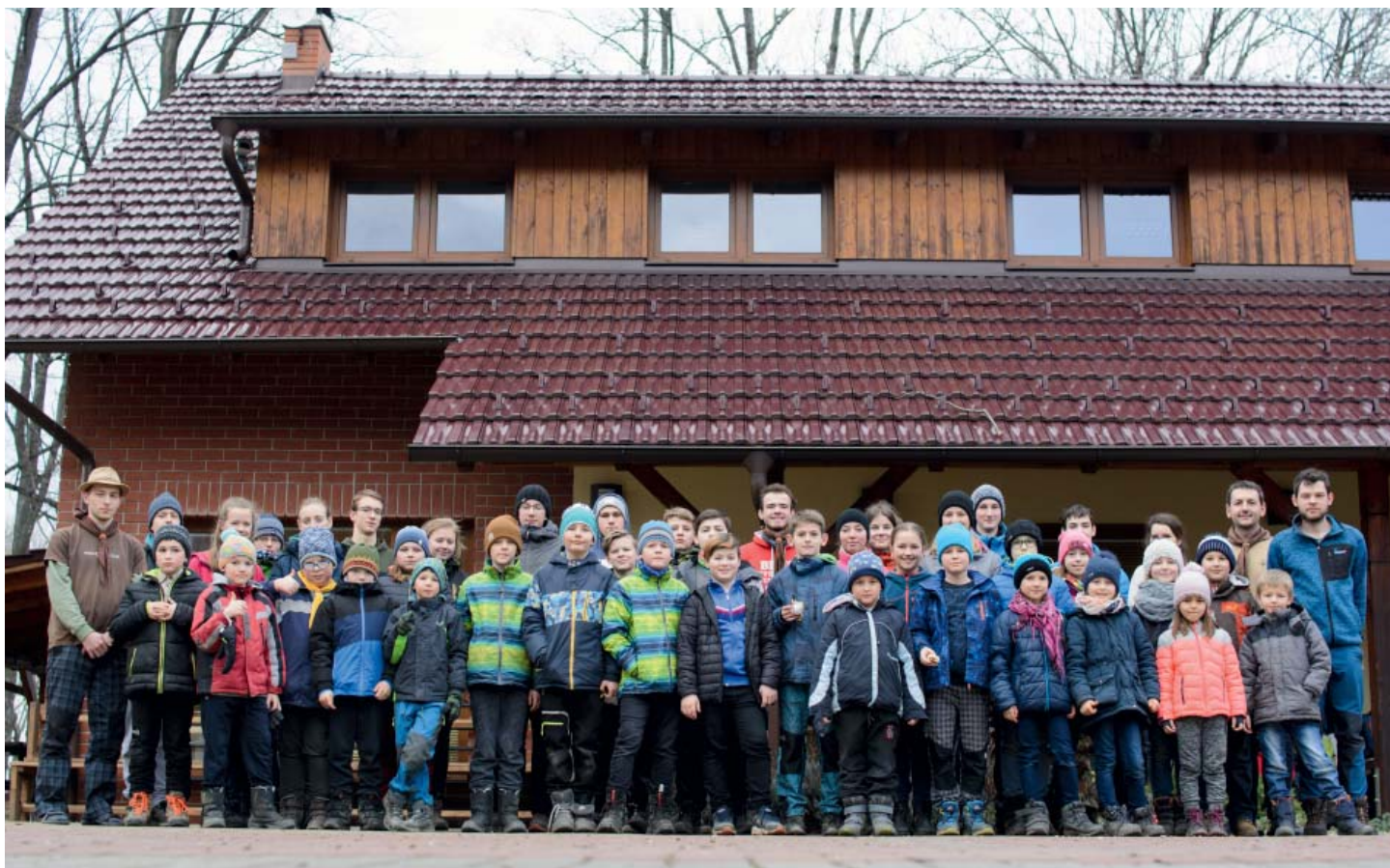
Čtyři oddíly starobělských skautů na společné výpravě.