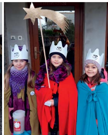
Kolednické skupinky ve starobělském terénu.