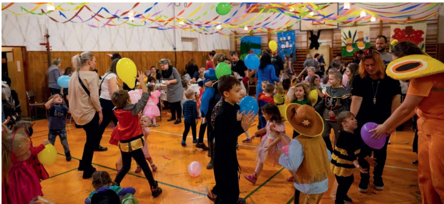
Na maškarním reji v sokolovně je vždycky veselo. Další snímky: sokol-stara-bela.rajce.idnes.cz