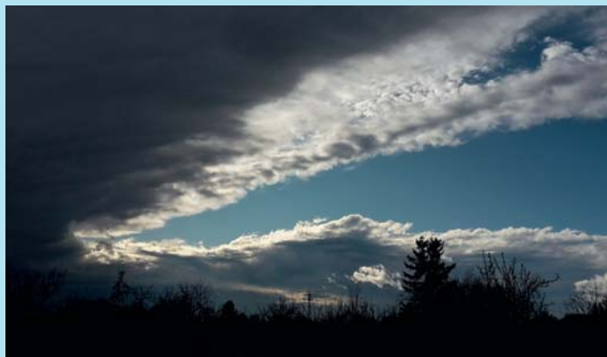
Před orkánem.