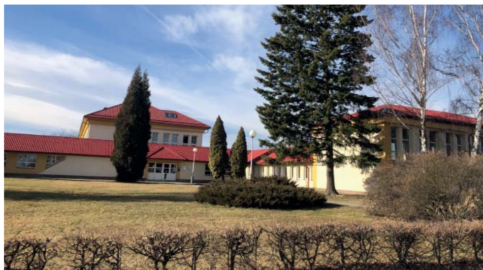
Základní škola se všemi devíti ročníky je jednou z velkých výhod obvodu.