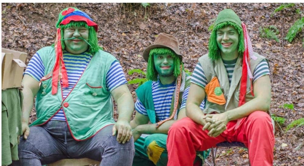
Zelení mužáci potřebovali pomoc s výlovem ryb.