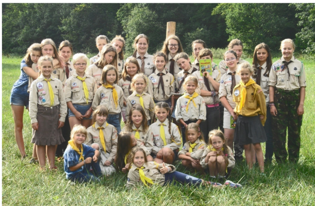
Louka pod Kyjovicemi - prázdninové stanoviště starobělských oddílů.

Od září se v klubovně u kostela opět scházejí oddíly k pravidelným schůzkám a tak vás zveme, přijďte ochutnat skautování.