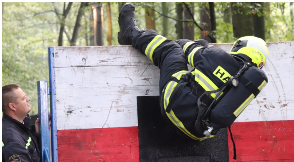
Jeden ze závodních úkolů - překonání dvoumetrové bariéry v plné výstroji s dýchacím přístrojem jako zátěží.