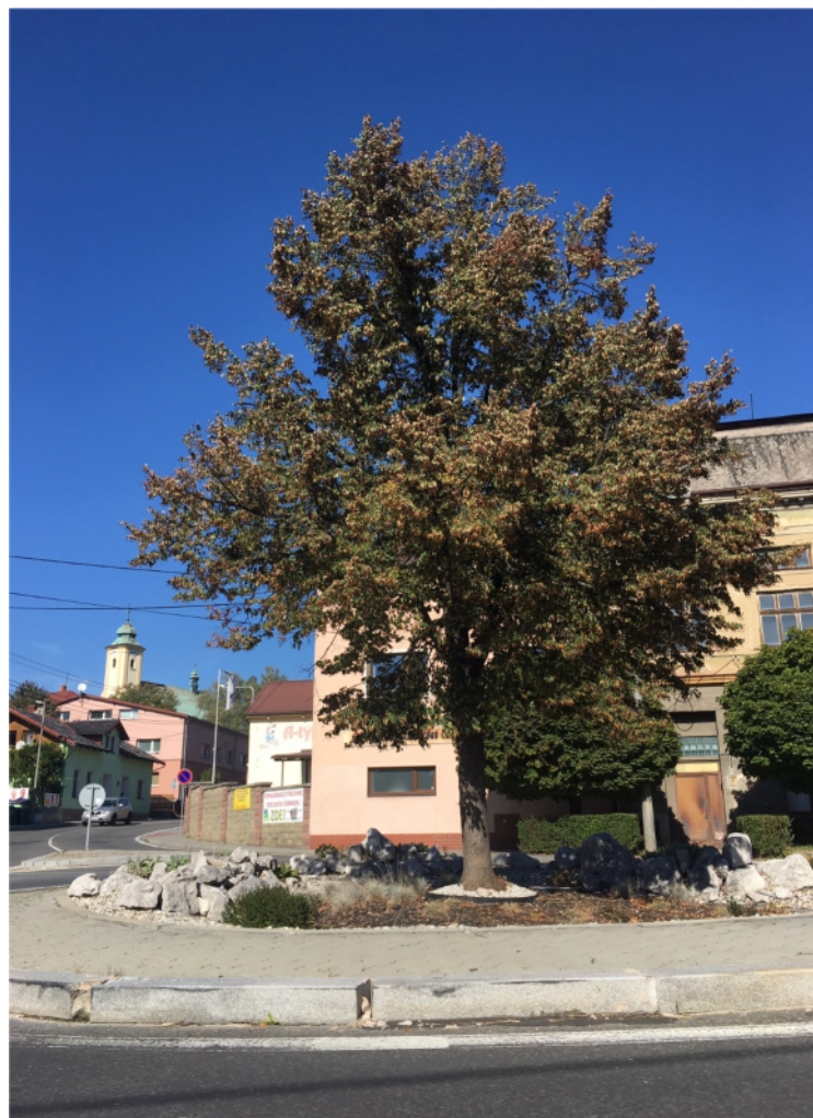
Před školou stojí lípa svobody půl století. Ta uprostřed rondelu, dříve se říkalo na náměstí, už je třetím stromem v pořadí - první tu Starobělští zasadili v roce 1946.