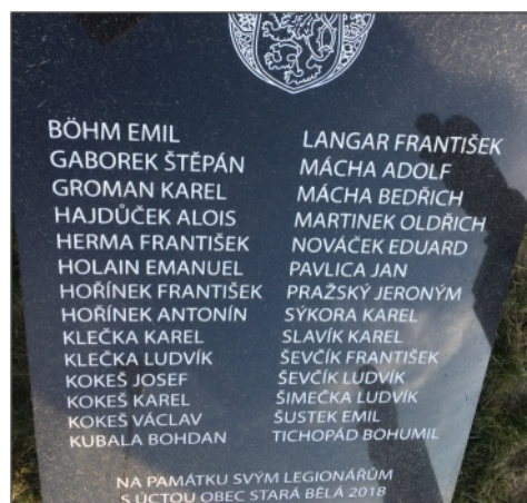
Deska je poctou zdejšími legionářům.

Osmadvacet Starobělanů, kteří se za první války dali k legiím, má svou pamětní desku. Leží v trávě v parčíku u Mitrovické, u pomníku s Masarykem a Švehlou, a den před stým jubileem republiky ji čeká slavnostní odhalení.