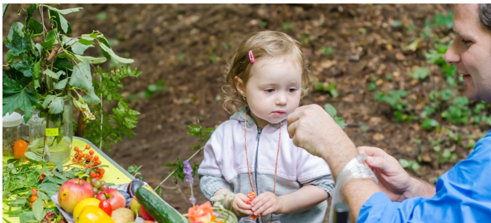
Co roste v lese, v sadě, na zahradě? I na to letos přišla řeč.

Schován za stromy či výmoly na ně čekal nespočet pohádkových bytostí a strašidel. Cestou si děti u ježibab vyrobily na památku dřevěné medailonky, zdobily stromek večerníčkovými obrázky, poustevníci je učili rozpoznat rostlinky a lesní plody, vodníkům zase pomáhaly vylovit z rybníka rybky. U krále s hradním strašidlem si vyzkoušely střelbu z kuše na hradby, s čerty zdolaly házení do ohně a svou šikovnost ukázaly u Bořka stavitele, kde zatloukaly do prken hřebíky a stavěly z kostek různé tvary. Křemílek s Vochomůrkou si přichystali přišívání knoflíku na kalhoty, Maková panenka a motýl Emanuel jim pomohli projít známou hrou Člověče, nezlob se, u pirátů, krom házení kruhu na lodní stožár, přešly vodu se žraloky. U Boba a Bobka je čekalo házení mrkví do klobouku a Ferda mravenec sbroukem Pytlíkem je učili trefovat míčkem květinu a skládat puzzle s obrázky výtvarníka Ondřeje Sekory. S indiány si mohly zazpívat a vyzkoušet házení oštěpem na cíl. Po lese se procházel Krakonoš, který dával za odměnu či na památku Krakonošovo razítko, a pán lesa. U myslivny, kde na ně čekal loupežník Sarka Farka s vysloužilým vojákem, si zastřílely z laserové vzduchovky a na pláčku pod taktovkou