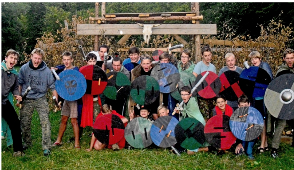
Vikingové, policejní výcvik, svět Malého prince či království Elesféra, to bylo letošní skautské léto.

Jak ale prožili léto? Jako první se pustili do táboření na louce pod Kyjovicemi kluci – skauti. Většina členů oddílu si táboření prodloužila na bezmála tři týdny o účast na stavěčce, takže další generace nahlédla a osahala si stavbu vojenského hangáru, který musí stát jako první, a dalších staveb - umývárny s koupelnou a samotížným vodovodem, kuchyně s jídelnou, latrín, tee-pee a klasických áček. No a po tomto, řekněme stavebním koncertu, skautům započal tábor vikingů. Následoval tábor skautek, které vyrazily na kolech podle instrukcí tajemného dopisu zachraňovat království Elesféra. Světlušky následovaly pozvání Malého prince a na tábor letěly letadlem – tramvají s polepem letadla. Tábor vlčat se proměnil ve výcvikové středisko policie. Jako poslední si táboření užili roveři, kteří pak pomohli tábor zbořit a uklidit louku.