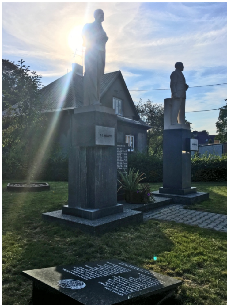
Legionářská deska leží v trávě hned u Masaryka se Švehlou.

Slavnostní odhalení bude součástí starobělských oslav výročí republiky. Kromě zástupců Staré Bělé a zdejších spolků přislíbila účast také Československá obec legionářská. Starosta doufá, že lidí přijde co nejlvíce. „Starobělané mohou zavzpomínat na své předky a uvědomit si své kořeny. A pro ty nejmladší je deska připomínkou, že nic není zadarmo.“ (Joh)