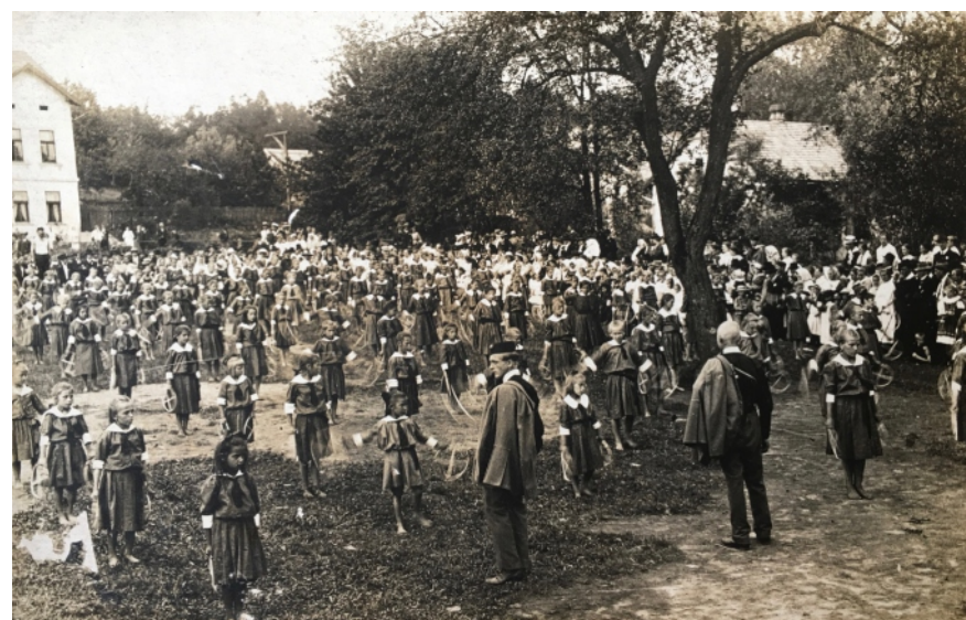
Slavnostní veřejná cvičení patřila k tehdejšímu životu.