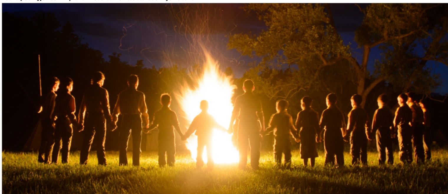
Skautské táboření - pospolitost a neobyčejné zážitky.