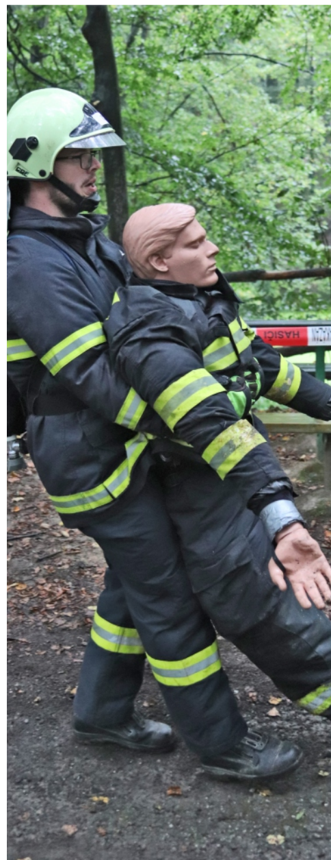
Přenesení osmdesátikilogramové figuríny dalo zabrat i těm nejlepším.