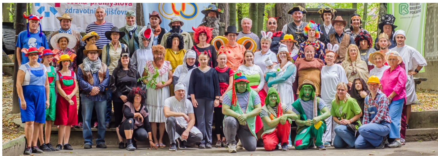
Cvičitelé, jejich blízcí, fandové zdejšího sokola. Díky nim se les u myslivny každoročně mění v pohádkový.