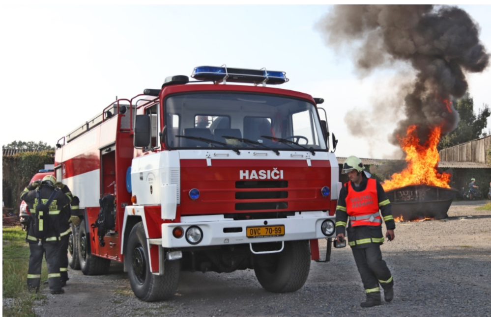
Cvičením jednotek dobrovolných hasičů oslavili starobělští 130. výročí sboru.

S tratí se nejlépe vypořádal polský šampion Marcin Zdzieblo, který s časem 3:04,626 ne-