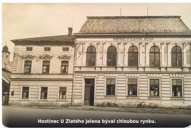
Hostinec U Zlatého jelena býval chloubou rynku.

Zajímám se o bělskou historii a historii okolních vesnic detailně. Jsem schopen si představit, jak Bělá vypadala v jakékoliv době cca k roku 1600, kde co stálo, kde byly rychty, kdo hospodařil v jednotlivých gruntech a chalupách, kdo seděl na faře. Toto vše se dá doložit historickými prameny. Ale co bylo předtím? Které rody žily na usedlostech v počátcích novověku - cca rok 1500 a v dějinné epoše zvané středověk, tedy v době před objevením Ameriky? Život tady