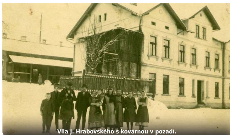
Vila J. Hrabovského s kovárnou v pozadí.