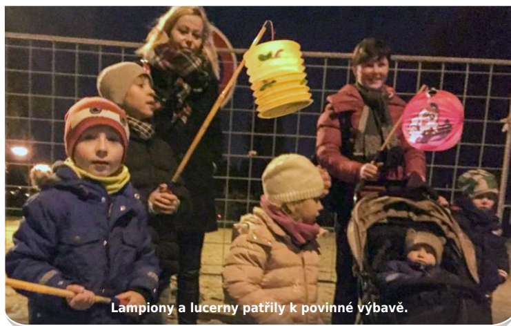
Lampiony a lucerny patřily k povinné výbavě.