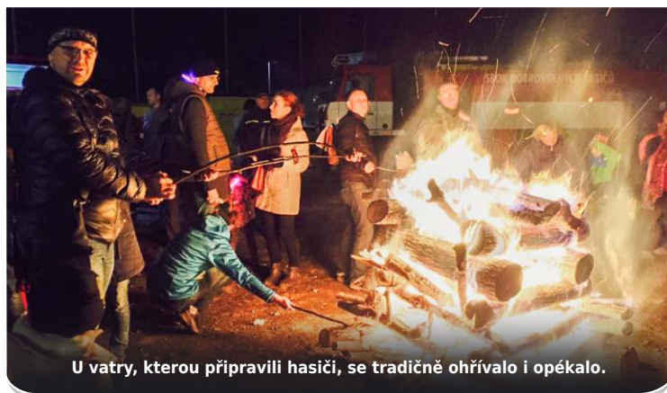
U vatry, kterou připravili hasiči, se tradičně ohřívalo i opékalo.