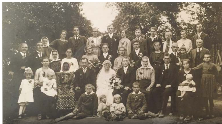
Rodinné portréty patří ke skvostům starobělského fotoarchivu Jiřího Klegy.

Já si ji možná idealizuji. Jsem tak trochu nostalgik. Možná že kdybych se ocitl v Bělé před oněmi padesáti lety, rychle bych spěchal zpět. Nevím. Doba ale byla méně hektická. Auto měl málokdo, telefonovalo se z pošty, cesta do Ostravy nebo vyřizování záležitostí v Místku, kam jsme v 60. letech 20. století pařili, to bylo téměř na celý den. Našel jsem onehdy statistiku, kterou jsem si jako chlapec dělal jednoho letního dne v roce 1967. V tento všední den projelo za hodinu po Mitrovické od Nové Bělé k rynku a zpět pouhých dvanáct aut, šest motocyklů a čtyři koňské potahy. Dnes bychom napočítali aut kolem čtyř set, akorát koně nejspíš žádné.