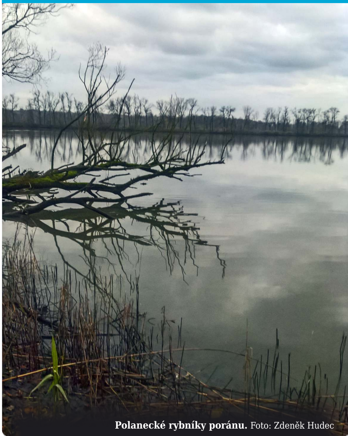
Polanecké rybníky poránu.

Pošlete nám jej na e-mail starobelsky.zpravodaj@gmail.com . Rádi jej otiskneme. (red)