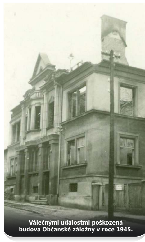
Válečnými událostmi poškozená budova Občanské záložny v roce 1945.