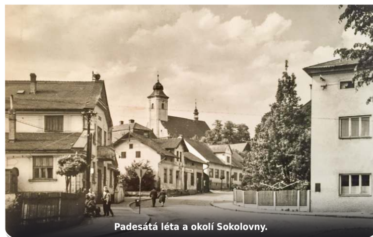
Padesátá léta a okolí Sokolovny.

Nemá již takový status vesnice jako před padesáti lety. Od roku 1990 jsme statutární obcí města Ostravy a mnoho se tím změnilo. Vesnický život se pomalu vytrácí, inklinujeme spíše k životu městskému. Těžko se smírují s tím, že se Bělá takto mění. Mizí staré domy a stodoly, kácí se letité duby a kaštiny, na hřbitově mizí staré náhrobky s významnými bělskými osobami, jako byli naduči-