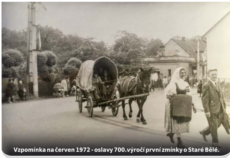
Vzpomínka na červen 1972 - oslavy 700. výročí první zmínky o Staré Bělé.