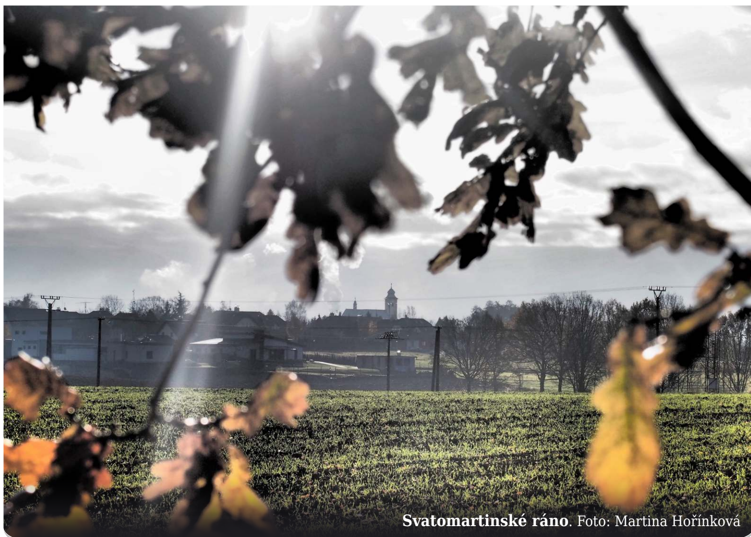
Svatomartinské ráno.