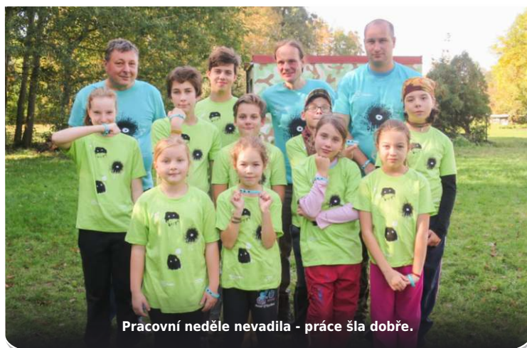
Pracovní neděle nevdala - práce šla dobře.