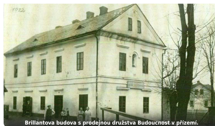
Brillantova budova s prodejnou družstva Budoucnost v přízemí.