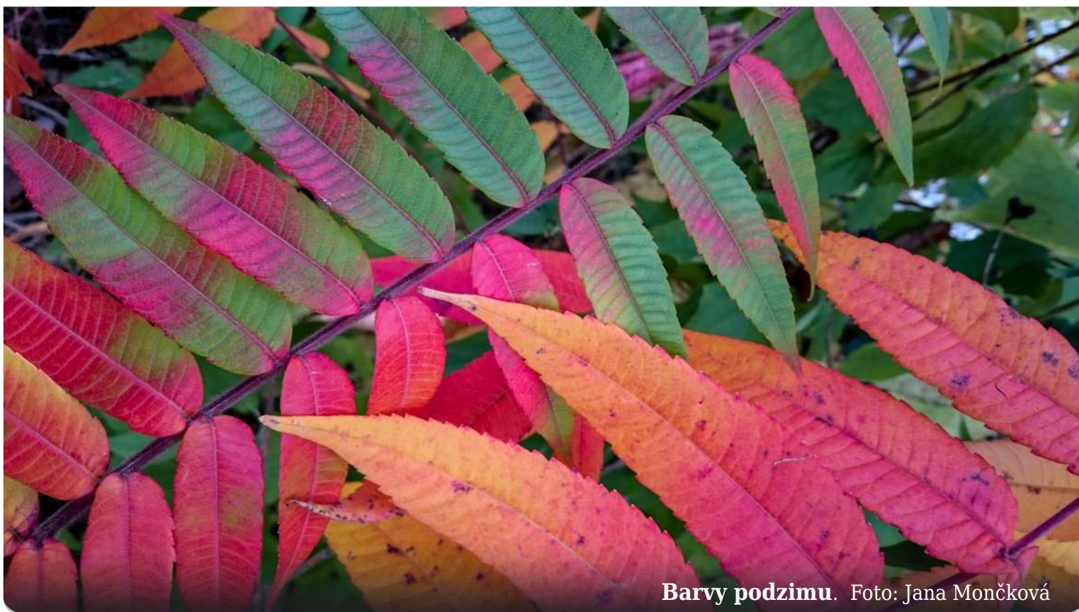
Barvy podzimu.