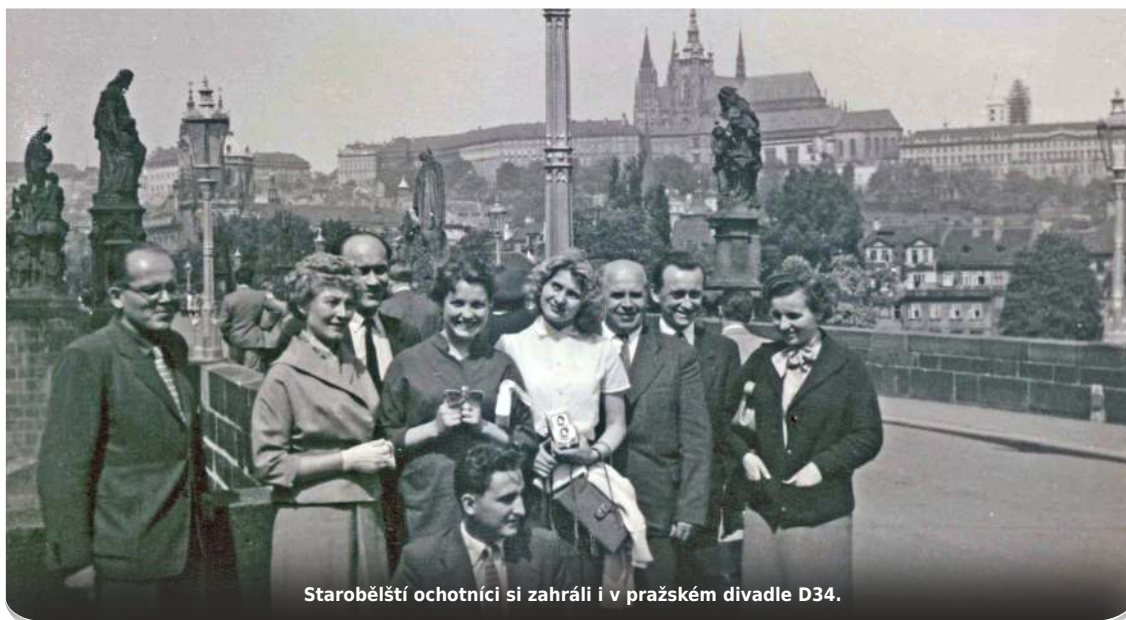
Starobělští ochotníci si zahráli i v pražském divadle D34.