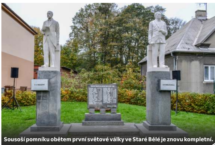
Sousoší pomníku obětem první světové války ve Staré Bělé je znovu kompletní.