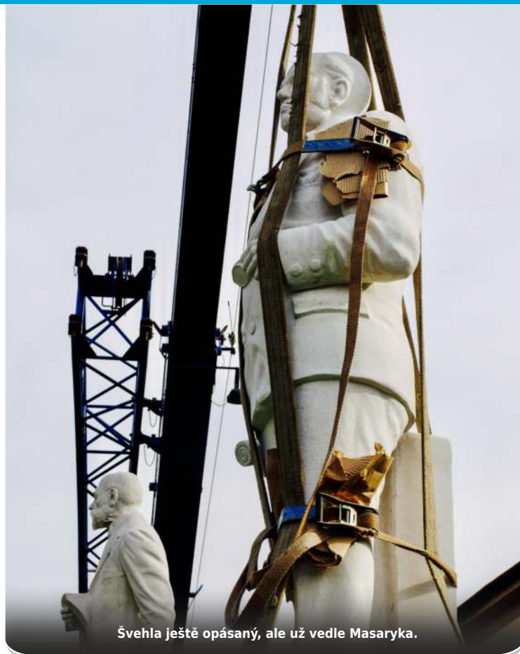
Švehla ještě opásaný, ale už vedle Masaryka.