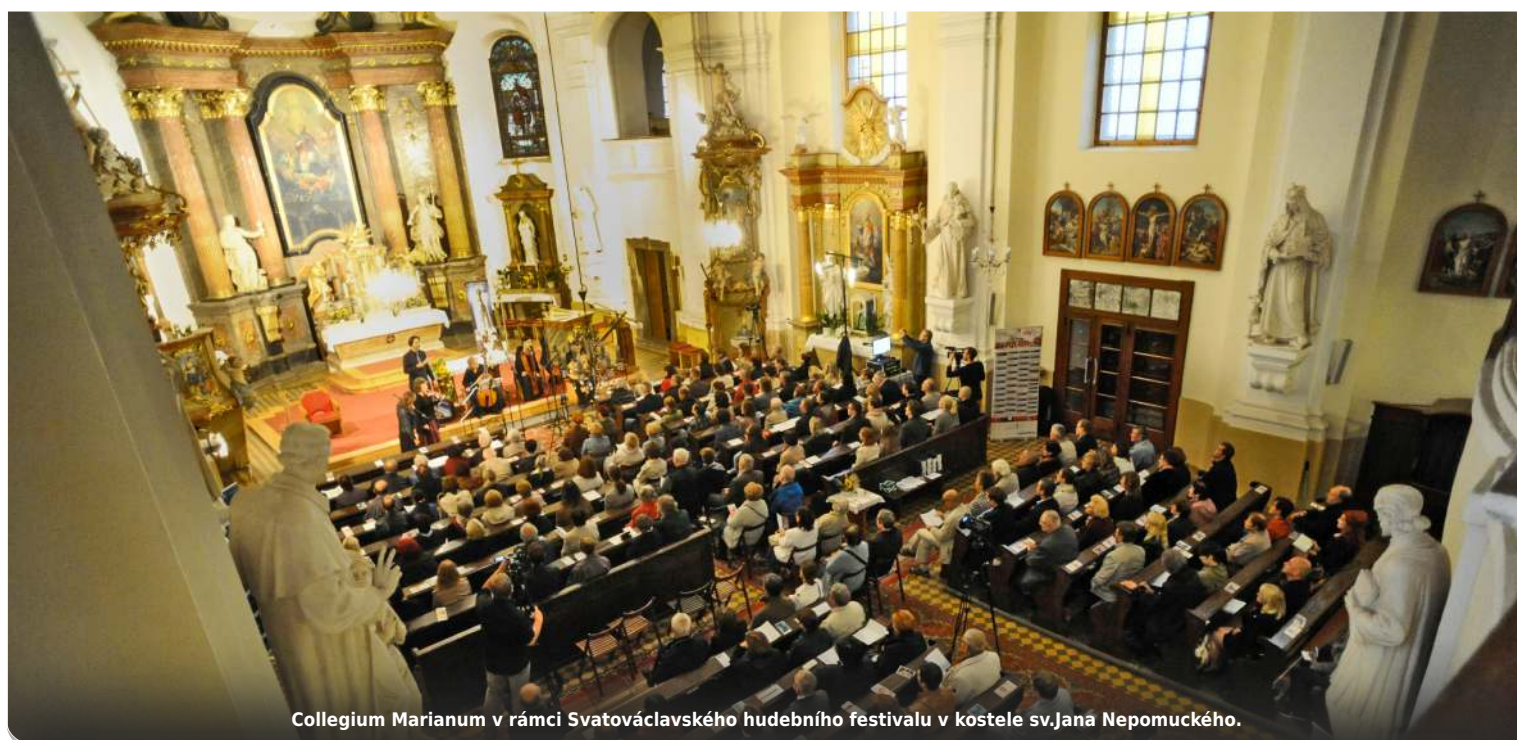
Collegium Marianum v rámci Svatováclavského hudebního festivalu v kostele sv. Jana Nepomuckého.