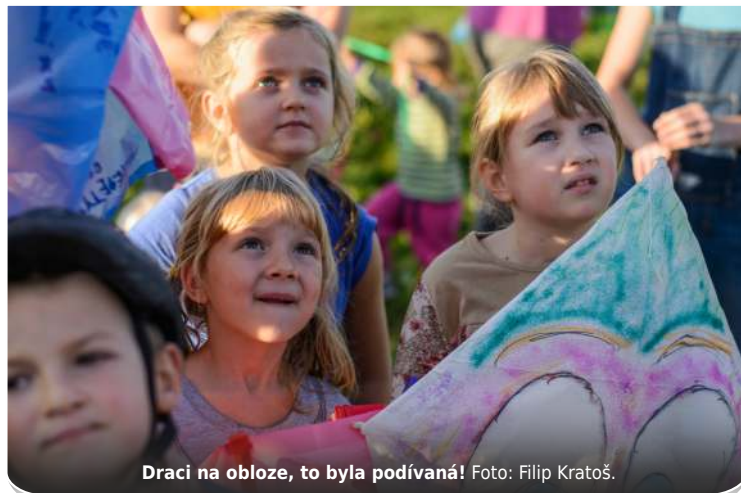
Draci na obloze, to byla podívaná!

Druhý den odpoledne se na lukách sešlo odhadem sto nadšenců, kteří za mírného vánku prožili příjemné odpoledne. V jeden okamžik se nad bělskými lukami houपालo na 60 draků různých konstrukcí a tvarů.