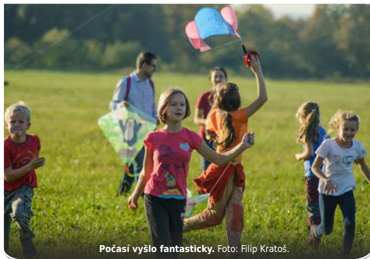
Počasí vyšlo fantasticky.

letěli domů snad všichni návštěvníci, kterých bylo kolem čtyřiceti. Druhý