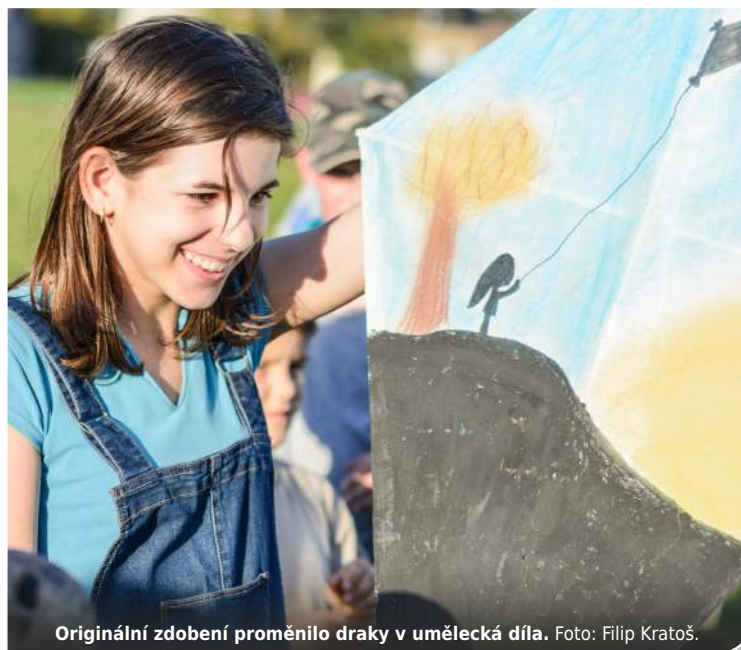
Originální zdobení proměnilo draky v umělecká díla.

Drakiádu svolali a vyhodnotili vedoucí oddílů vlčat. Kluci, díky moc!