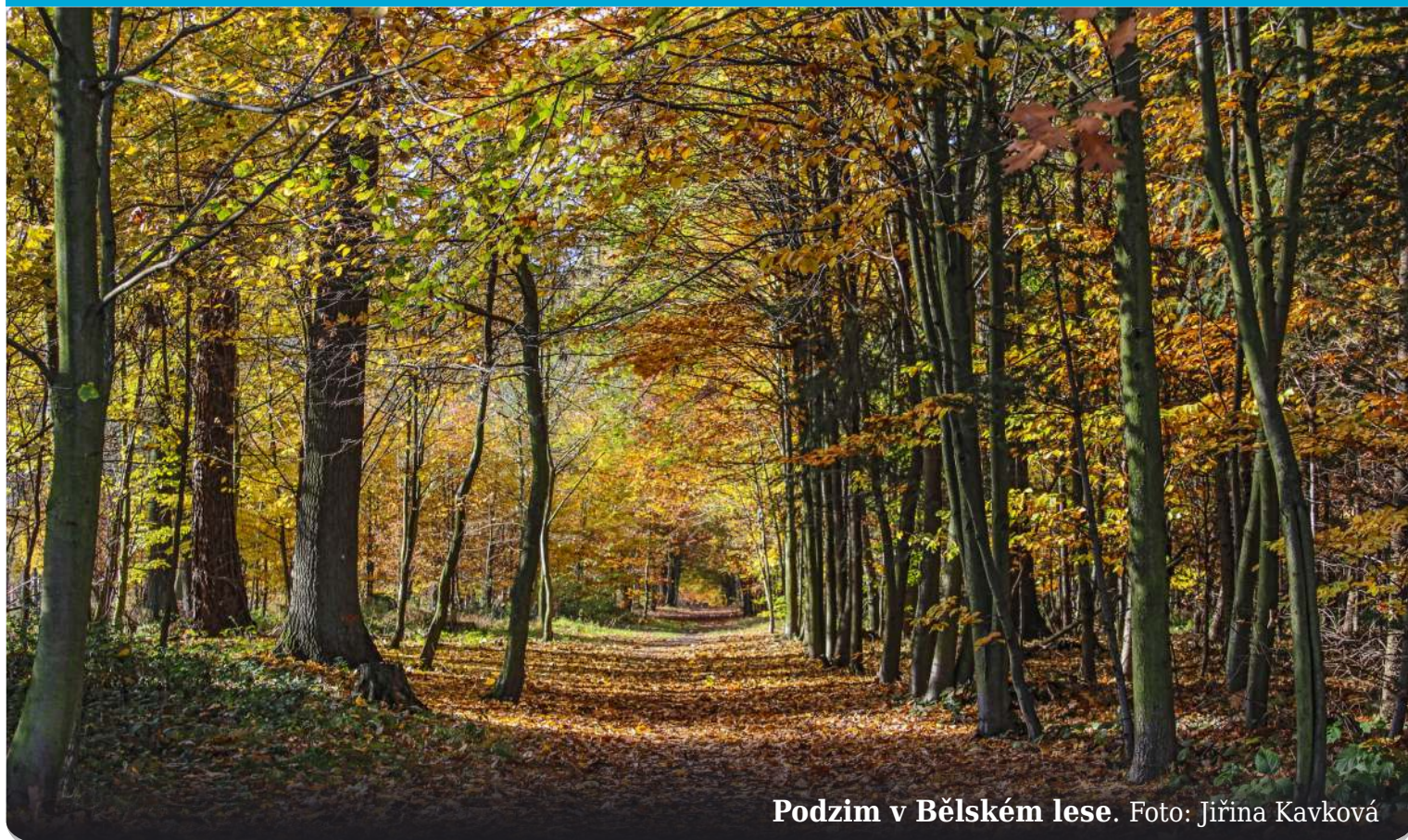
Podzim v Bělském lese.

Povedl se vám pohledný snímek Staré Bělé? Pošlete nám jej na e-mail starobelsky.zpravodaj@gmail.com . Rádi jej otiskneme. (red)