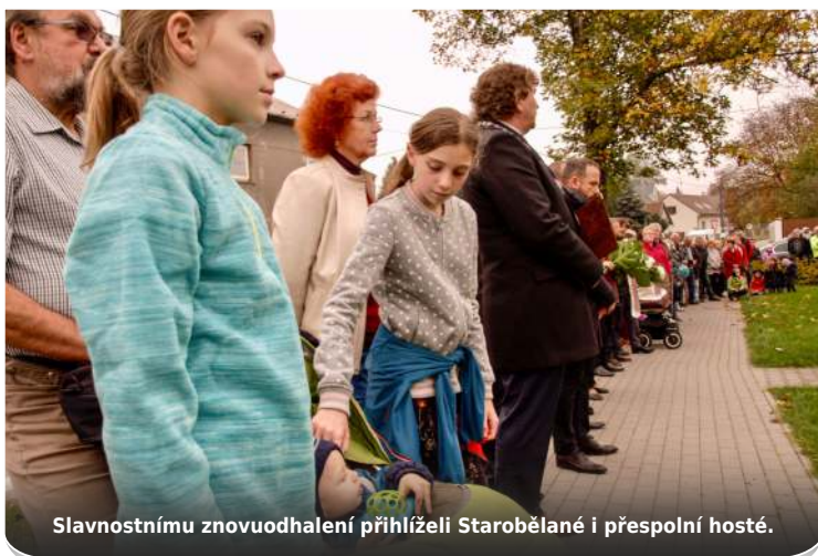
Slavnostnímu znovuodhalení přihlíželi Starobělané i přespolní hosté.