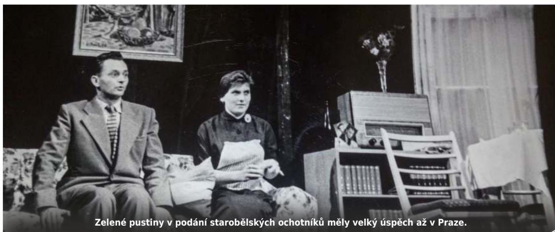
Zelené pustiny v podání starobělských ochotníků měly velký úspěch až v Praze.