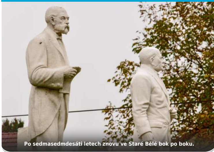
Po sedmasedmdesáti letech znovu ve Staré Bělé bok po boku.

Památník obětem první světové války ve Staré Bělé je znovu kompletní - k T. G. Masarykovi se po sedmasedmdesáti letech vrátil Antonín Švehla. Obě prvorepublikové ikony spolu pietní místo střezily v letech 1936-1940, než musely kvůli protektorátnímu nařízení dolů. Po druhé válce už se vztyčoval jen Masaryk. Švehlova socha nejprve nahoru nesměla, později se po ní slehla zem.