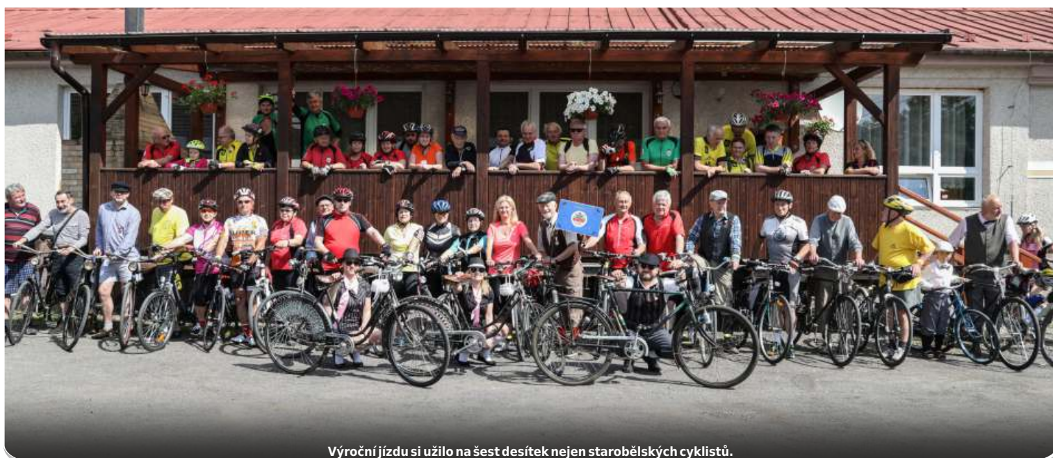
Výroční jízdu si užilo na šest desítek nejen starobělských cyklistů.