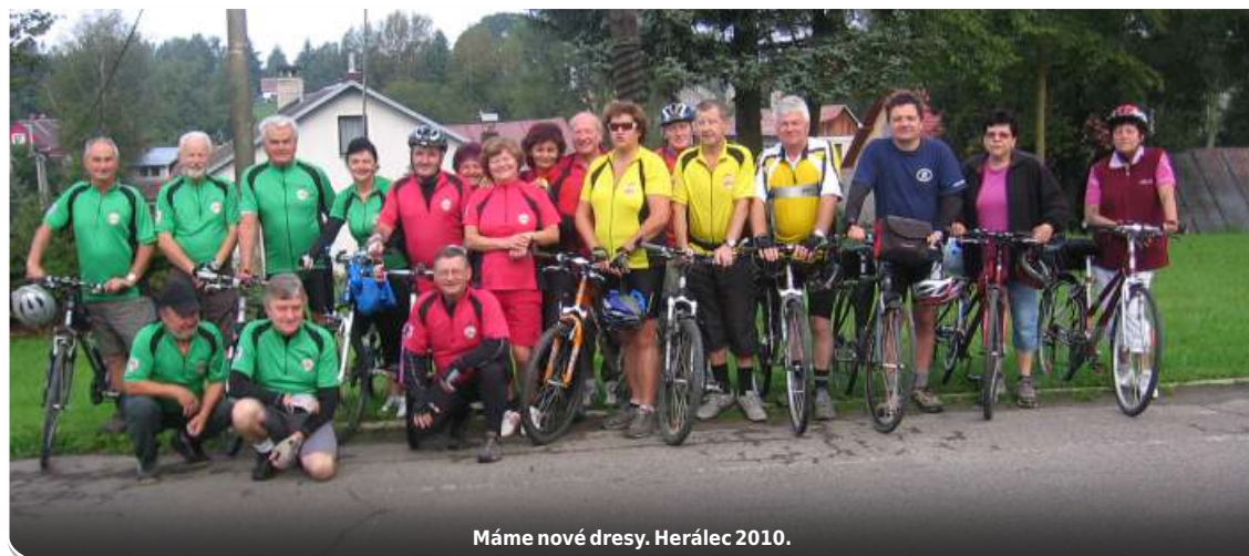
Máme nové dresy. Herálec 2010.