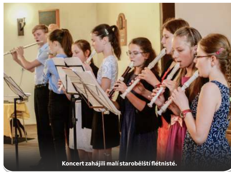
Koncert zahájili malí starobělstí flétníci.