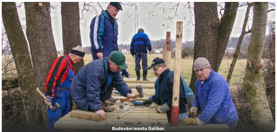
Budování mostu Dalibor.