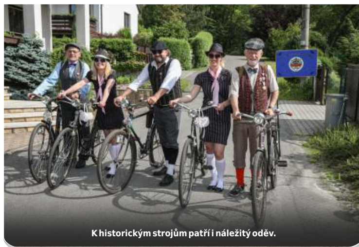
K historickým strojům patří i náležitý oděv.

Po načerpání tolik potřebných sil jsme se vrátili na most přes Lubinu a za ním jsme odbočili na cyklostez-