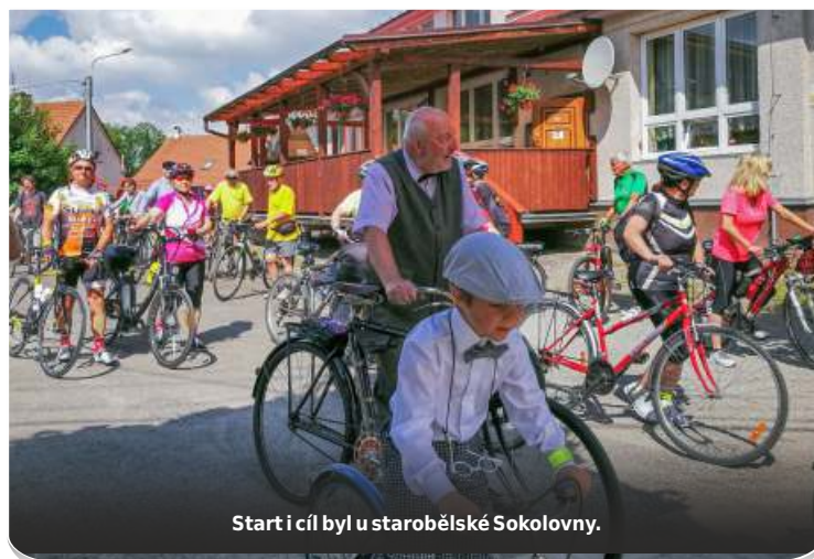
Start i cíl byl u starobělské Sokolovny.

Druhá skupinka pokračovala přes Oprechtice, kolem šachty Staříč, přes Staříč, Místek, podél přehrady Olešná, přes Zelinkovice a Chlebovice do Rychaltic, kde byla v restauraci Richard polední přestávka.