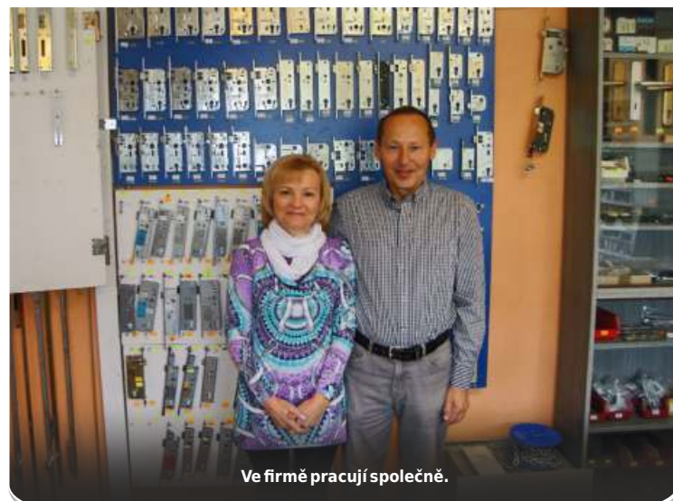
Ve firmě pracují společně.