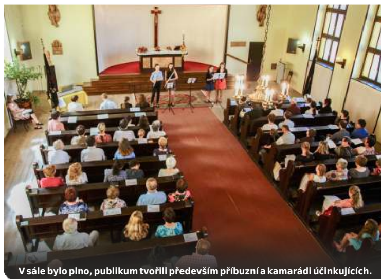
V sále bylo plno, publikum tvořili především příbuzní a kamarádi účinkujících.