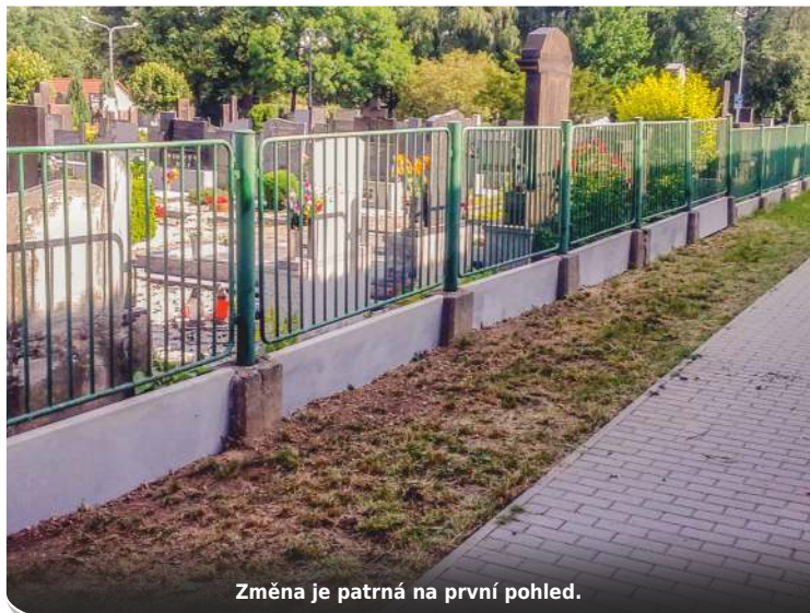
Změna je patrná na první pohled.

se starostou úřadu Mojmírem Krejčíčkem a správcem hřbitova Milanem Foltou pokračovali ve výměně plotových desek na hřbitově.