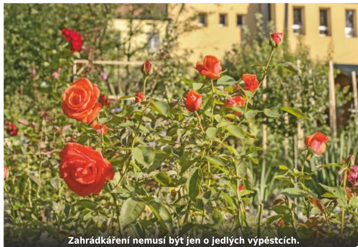
Zahrádkáření nemusí být jen o jedlých výpěstcích.