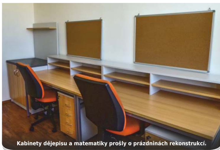
Kabinety dějepisu a matematiky prošly o prázdninách rekonstrukcí.