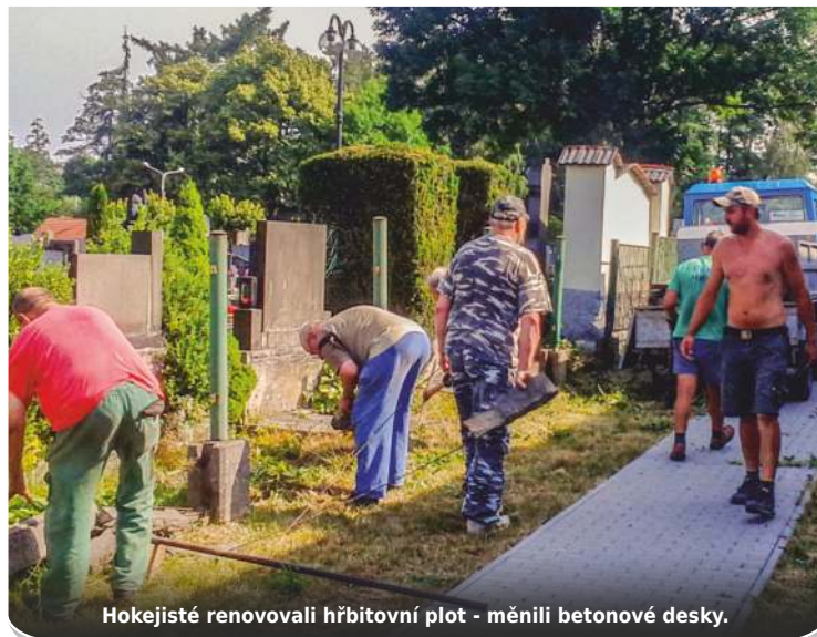
Hokejisté renovovali hřbitovní plot - měnili betonové desky.

Bylo nutné ve spolupráci se správcem nejdříve odšroubovat plotové rámky, demontovat zvětralé betonové desky a vyčistit prostor okolo plotu. Pak následovala montáž nosných betonových desek a znovu našroubování kovových rámků. Že při tom dostali brigádníci zabrat, není pochyb -