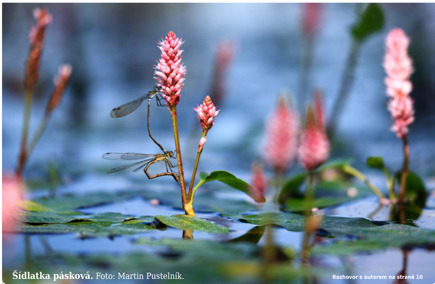
Šídlatka pásková.

Povedl se vám pohledný snímek Staré Bělé? Pošlete nám jej na e-mail starobelsky.zpravodaj@gmail.com . Rádi jej otiskneme. (red)