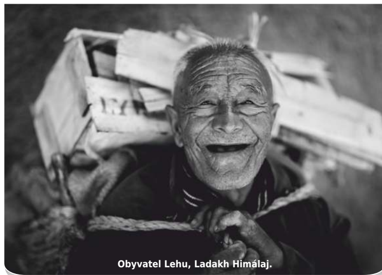
Obyvatel Lehu, Ladakh Himálaj.

Červená, to je něco jiného než vážka rudá. Je původem z Afriky, teď žije i u nás. A pak Cecilia, taková leskle zelená, říká se jí Cecilia.