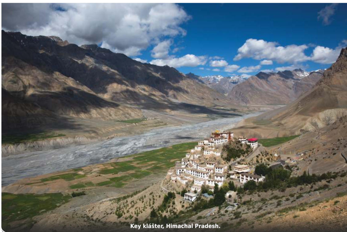
Key klášter, Himachal Pradesh.