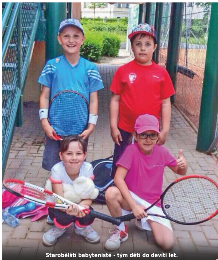
Starobělská babytenisté - tým dětí do devíti let.