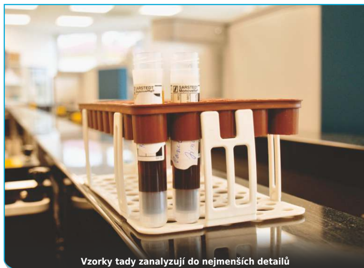
Vzorky tady analyzují do nejmenších detailů

Laboratoř se postupně chystá na nápor předjarních a jarních chřipek. „Ale letos by nemusela být tak rozsáhlá jako vlani,“ tipuje doktor Vyvlečka. „U chřipky se to poměrně pravidelně střídá - jeden rok je to horší, druhý rok bývá výskyt nižší. S téměř železnou pravidelností. Toto pravidlo ovšem neplatí pro pande-