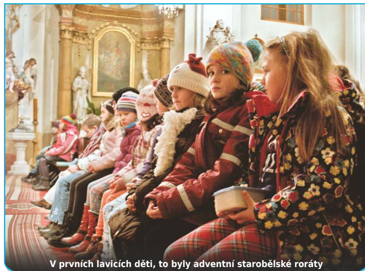
V prvních lavicích děti, to byly adventní starobělské roráty

Soutěžní otázky píše otec Bohuslav na papírek vždy dvě - pro mladší a starší děti. Mnohé z nich odpovídají