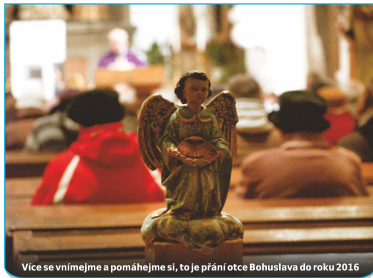
Více se vnímejme a pomáhejme si, to je přání otce Bohuslava do roku 2016

Čokoodměnou a rozdáváním další soutěžní otázky rorátní starobělské ráno nekončí - z kostela se všechny děti přesouvají na faru. Na snídani. Připravují ji babičky a mámy, na střídačku, jak se která přihlásí. „V kostele je takový papír a tam se napíšou. Mamka chystala snídani v sobotu. Zapečený rohlík se šunkou, sýrem a kečupem. A buchty, makovou a jablčnou, bála se, aby toho nebylo málo,“ přidává Adéla.