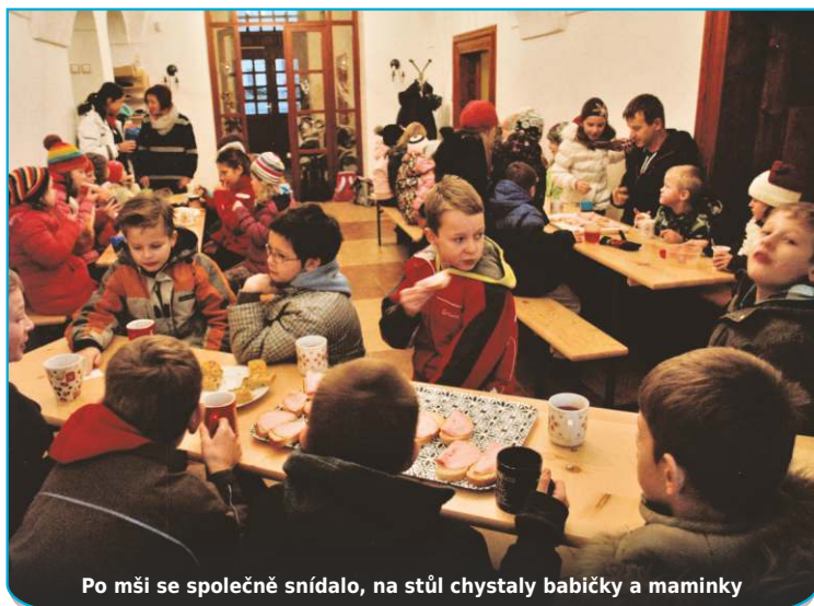
Po mši se společně snídalo, na stůl chystaly babičky a maminky