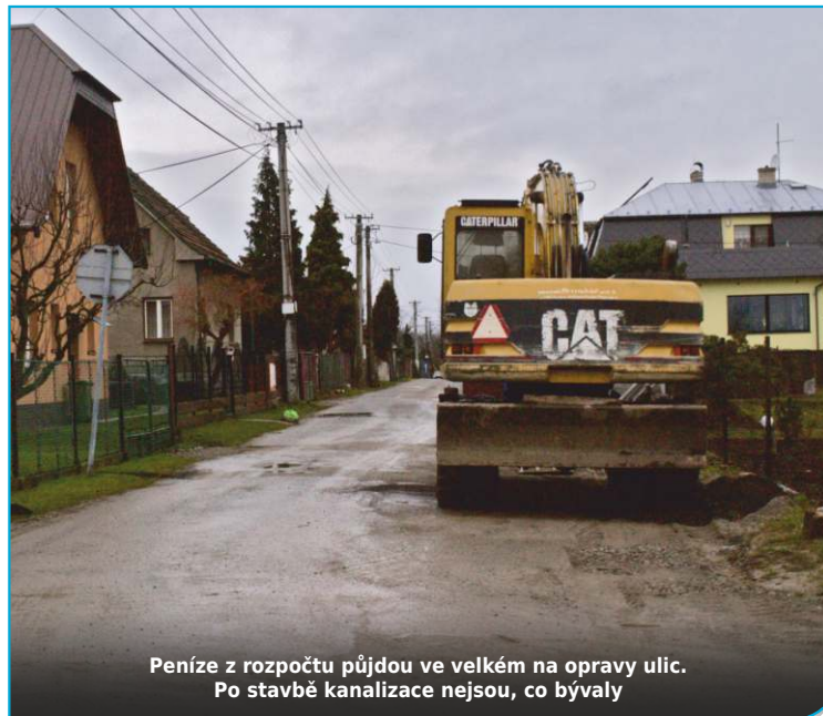
Peníze z rozpočtu půjdou ve velkém na opravy ulic. Po stavbě kanalizace nejsou, co bývaly