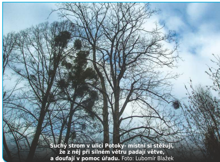
Suchý strom v ulici Potoky - místní si stěžují, že z něj při silném větru padají větve, a doufají v pomoc úřadu.

i střed obce - a sami zhodnotili stav. Konkrétně v ulici Potoky je řada stromů, které by bylo nutné pokácet nebo upravit, ořezat tak, aby neohrožovaly majetek občanů a občany samé. Je pravdou, že se kácí v obci stromy, ale mnohdy to vypadá tak, že žadatel je osobnost. Jinak obec dělala v roce 2015 dost dobrého, aby občané byli spokojeni v dalších letech.“