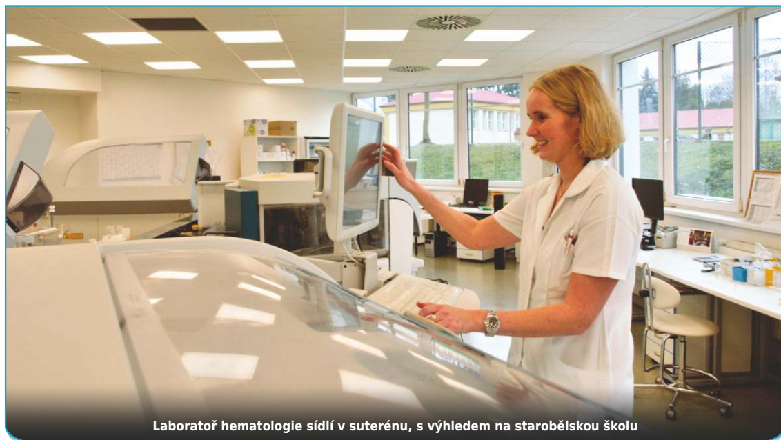
Laboratoř hematologie sídlí v suterénu, s výhledem na starobělskou školu

když měl někdo klíště. Může za tři týdny přijít a nechat si zjistit, zda mu hrozí borelióza. Nebo jak vysokou má hladinu protilátek proti tetanu - zda už by se měl nechat přeočkovat. Případně můžeme vyšetřit přítom-