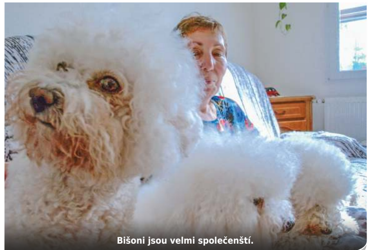
Bišoni jsou velmi společenští.

Je to právě ona, kdo se na výstavách stará, aby to jejich bišoní modelce slušelo. Do takzvaného kruhu - na samotnou promenádu a předvedení před porotce - nastupuje zásadně