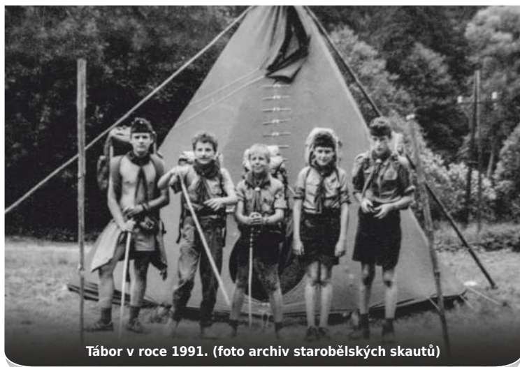
Tábor v roce 1991.