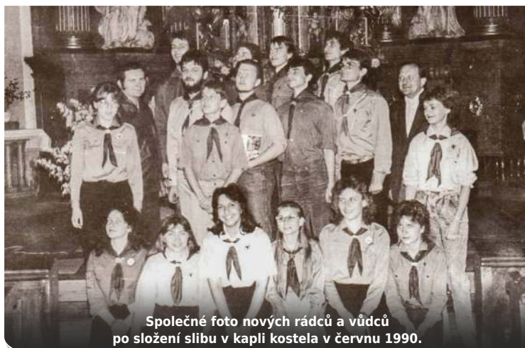
Společné foto nových rádců a vůdců po složení slibu v kapli kostela v červnu 1990.