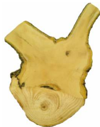
Řez větví v horní části haustoria jmelí.