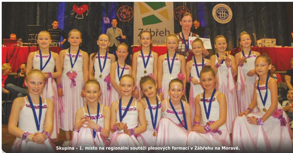
Skupina - 1. místo na regionální soutěži plesových formací v Zábřehu na Moravě.