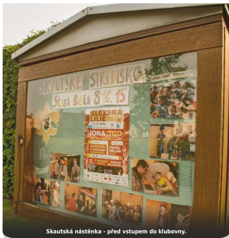
Skautská nástěnka - před vstupem do klubovny.

předávání Beltslémského světla v klubovně a při bohoslužbách v kostele, sbírka dárků pro potřebné děti, živý Betlém