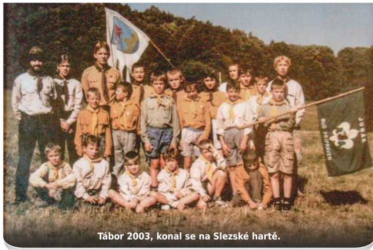
Tábor 2003, konal se na Slezské hartě.