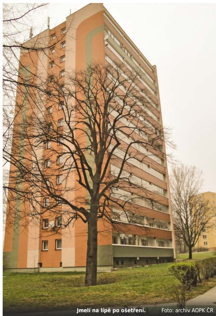
Jmelí na lípě po ošetření.