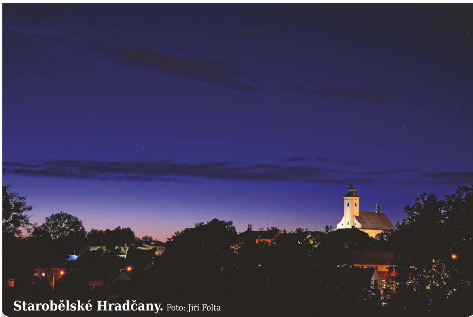
Starobělské Hradčany.