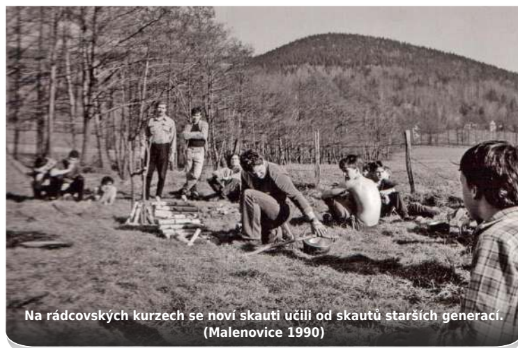
Na rádcovských kurzech se noví skauti učili od skautů starších generací. (Malenovice 1990)

přednesl výzvu v kostele, abych zma-poval terén. Hned se přihlásilo mnoho dětí. A tak bylo třeba najít a vyškolit schopné skautské vedoucí,“ přibližuje samotný vznik střediska Sokol.