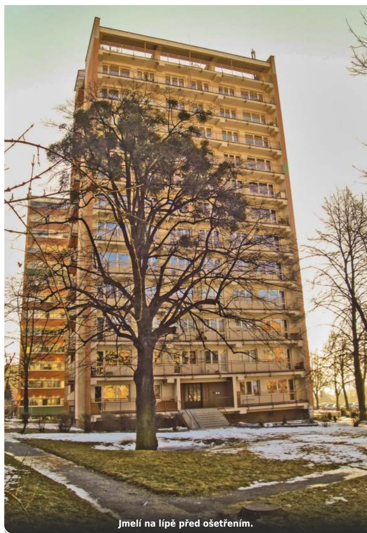
Jmelí na lípě před ošetřením.