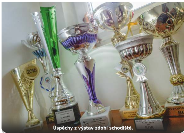
Úspěchy z výstav zdobí schodiště.