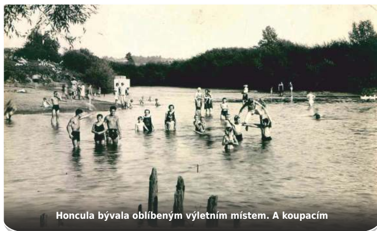
Honcula bývala oblíbeným výletním místem. A koupacím