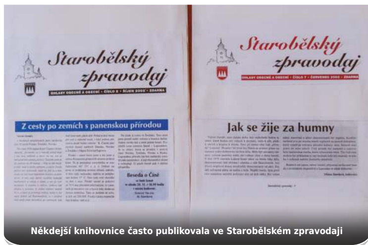
Někdejší knihovnice často publikovala ve Starobělském zpravodaji

Pukovcem, dobře jsem ho znala ze sboru moravských učitelů, jestli by měli učitelé zájem chodit s dětmi na literární besedy. A měli, tak začali.