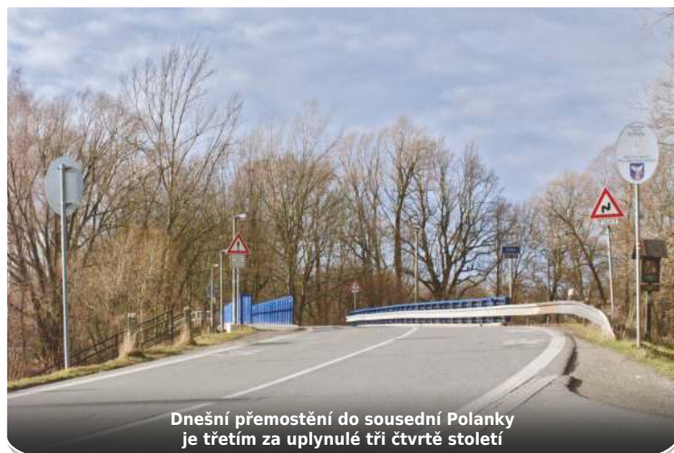
Dnešní přemostění do sousední Polanky je třetím za uplynulé tři čtvrtě století