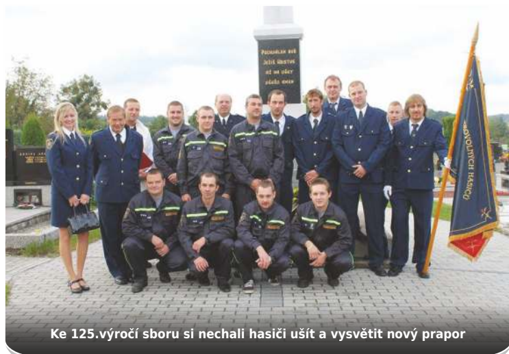
Ke 125.výročí sboru si nechali hasiči ušít a vysvětit nový prapor