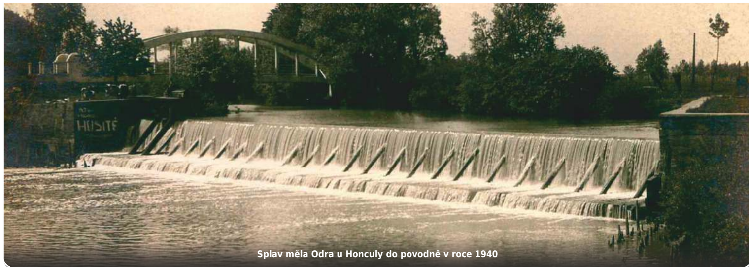
Splav měla Odra u Honculy do povodně v roce 1940