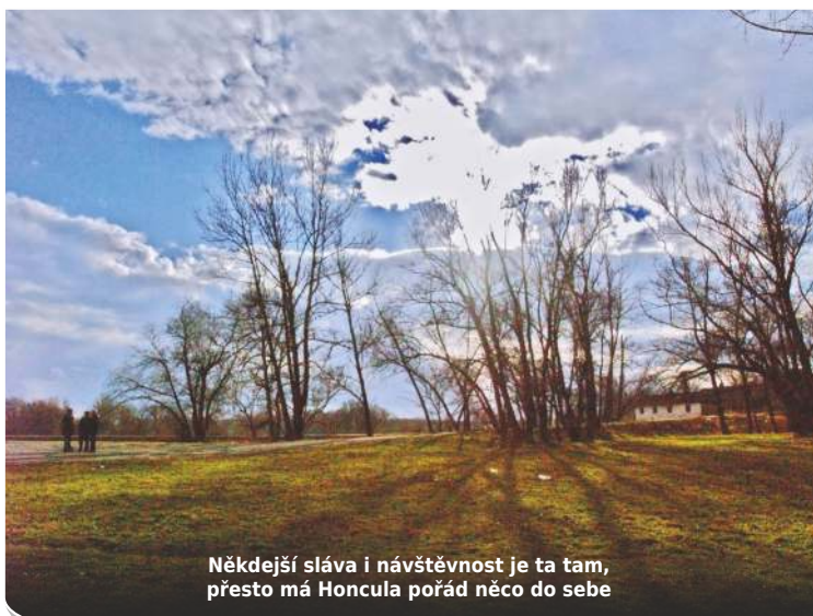
Někdejší sláva i návštěvnost je ta tam, přesto má Honcula pořád něco do sebe

Most neustál povodeň v roce 1940 a na jeho místě vyrostl provizorní dřevěný. „Byl tady hodně dlouho,“ komentují jeho roli pamětníci. Za války dělil prostor mezi Reichem a Protektorátem - Polanka patřila k Sudeům. A tak na začátku mostu stávala budka finanční stráže. „Financové byli něco jako celníci. Nosili zbraně, hlídali hranici,“ vysvětlují pamětníci.