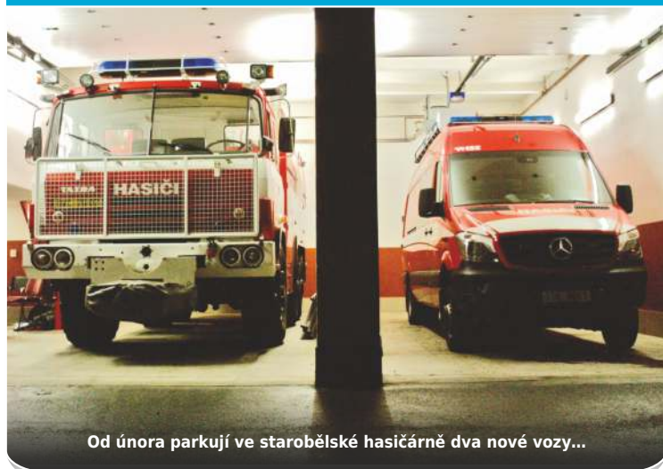
Od února parkují ve starobělské hasičárně dva nové vozy...

Tatra T815 CAS 32: zásoba vody 8200 litrů, posádka 3 hasiči + 1 řidič, donedávna číslo 1 v garáži. Díky velké kapacitě cisterny volá ostravské Integrované bezpečnostní centrum Starobělský statrovkou na zásahy