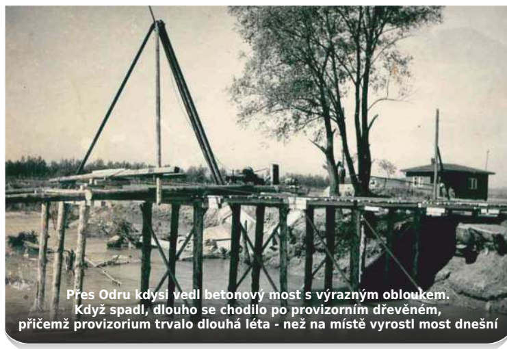
Přes Odru kdysi vedl betonový most s výrazným obloukem. Když spadl, dlouho se chodilo po provizorním dřevěném, přičemž provizorium trvalo dlouhá léta - než na místě vyrostl most dnešní