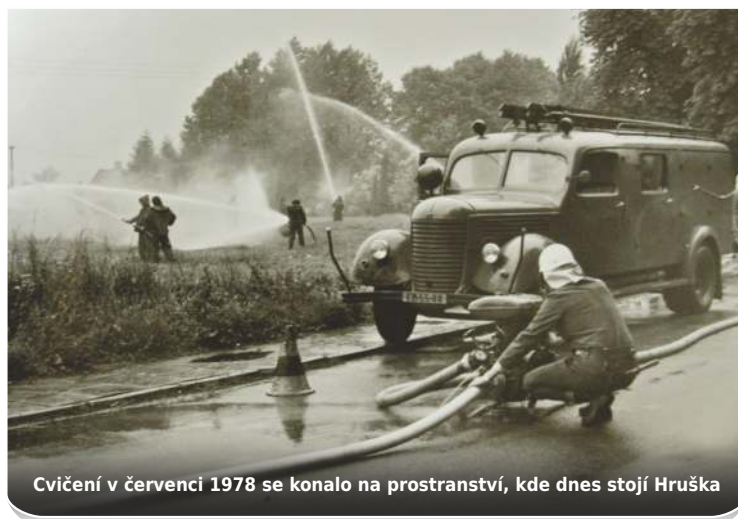
Cvičení v červenci 1978 se konalo na prostranství, kde dnes stojí Hruška

2001: začíná velká novodobá rekonstrukce hasičárny - úřad městského obvodu zabezpečil materiál a odborné práce, ale většinu prací hasiči zvládají svépomocí - při bouracích a pomocných pracích odpracovali 2300 brigádnických hodin. V garážích od listopadu parkuje nové cisternové vozidlo CAS 32 - Tatra 815 s kompletním vybavením včetně plovoucího čerpadla a motorové pily.