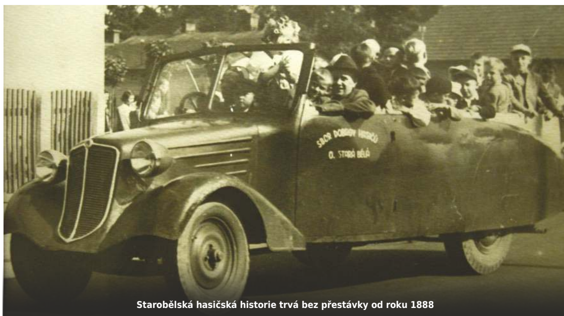
Starobělská hasičská historie trvá bez přestávky od roku 1888

nice včetně stavby nové (třetí) garáže. Rok plný požárů: hoří stoh v ulici Povětromní, seník ve Staré Vsi nad Ondřejnicí, tůje na starobělském hřbitově a další