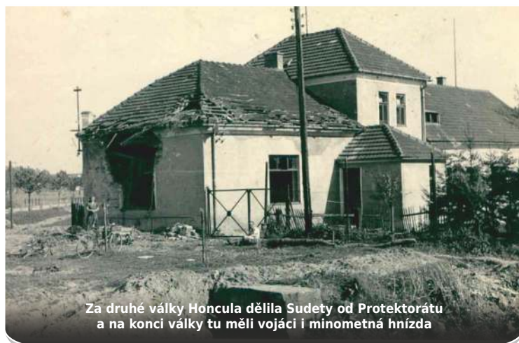
Za druhé války Honcula dělila Sudety od Protektorátu a na konci války tu měli vojáci i minometná hnízda