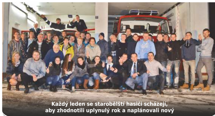
Každý leden se starobělská hasiči scházejí, aby zhodnotili uplynulý rok a naplánovali nový