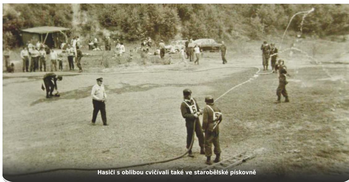
Hasiči s oblibou cvičivali také ve starobělské pískovně

Zpráva o činnosti SDH Stará Bělá 1888-2013