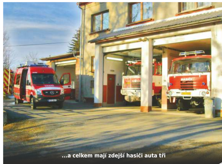
...a celkem mají zdejší hasiči auta tři

trála, požární motorová stříkačka FOX 1600, plovoucí čerpadlo, motorové čerpadlo, kalové čerpadlo, vysokotlaký proud, řetězová pila, žebříky a jiné. Vhodná pro rychlé zásahy například k autonehodám, povodním či v úzkých uličkách. Hasiči auto dostali letos v únoru, zatím se s ním seznámili, první ostrý výjezd teprve přijde