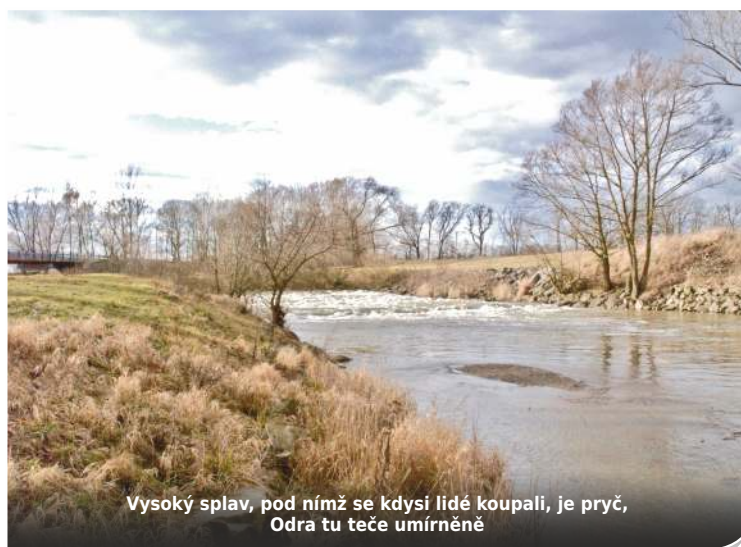
Vysoký splav, pod nímž se kdysi lidé koupali, je pryč, Odra tu teče umírněně