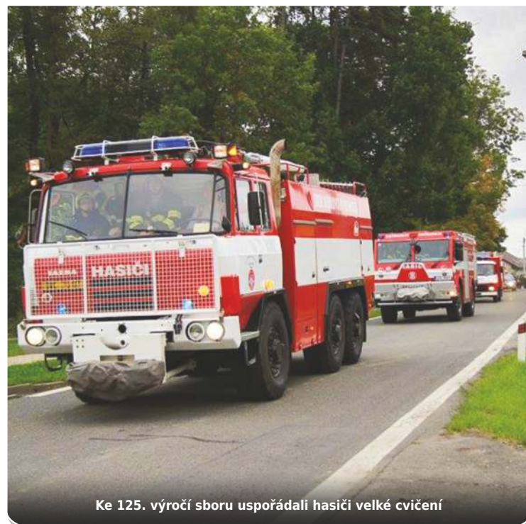
Ke 125. výročí sboru uspořádali hasiči velké cvičení

https://www.facebook.com/jsdhstarabela.hasici