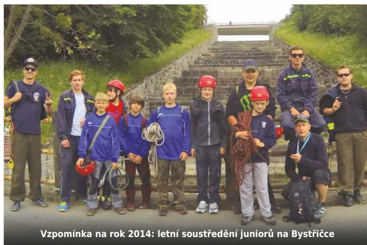
Vzpomínka na rok 2014: letní soustředění juniorů na Bystřičce

Požáry povodně, technická pomoc – nejčastější typy zásahů, k nimž jednotka vyjíždí. „V květnu 2010 jsme při povodních na dolním konci vytahovali lidi ze zaplavených domů u jízdní,“