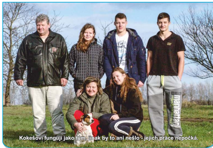
Kokešovi fungují jako tým, jinak by to ani nešlo - jejich práce nepočká.

Děd a z části i táta ještě hospodařili na svém, než se v roce 1958 stali součástí místního JZD. „Soupis, takzvaný vnos do družstva, tedy kolik půdy, kolik kusů dobytka, koní a strojů a zařízení tam odevzdali, máme stále doma. Dobrovolně nešel nikdo. Táta pak dělal celý život v JZD a já už v něm vyrůstal, nic jiného jsem neznal, takže jsem s tím neměl problém. Pravda je, že se tím změnil vztah lidí k půdě. Dnešní generace jsou už třetí i čtvrté, které na své tehdejší půdě nehospodaří. Jen málokdo by dnes své pole neprodal za žádnou cenu,“ vysvětluje zemědělec.