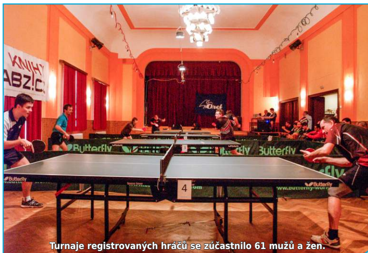
Turnaje registrovaných hráčů se zúčastnilo 61 mužů a žen.