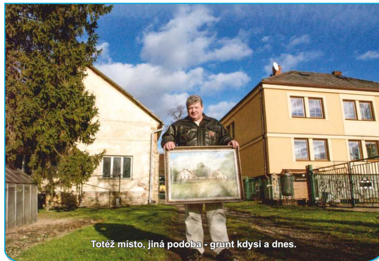
Totéž místo, jiná podoba - grunt kdysi a dnes.

Šestičlenná rodina dnes obstará všechnu práci sama. „Jsme soběstační. Včetně toho, že máme všechno