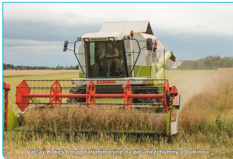
Václav Kokeš hospodaří mimo jiné na polí mezi humny a Dubinou.