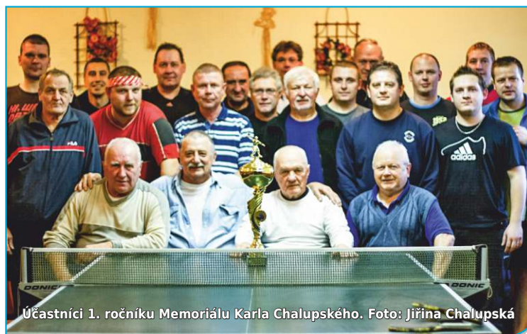
Účastníci 1. ročníku Memoriálu Karla Chalupského.