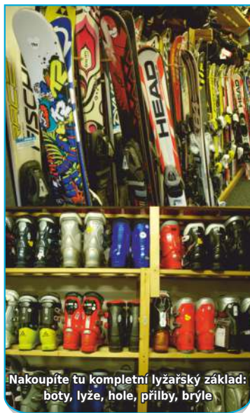
Nakoupíte tu kompletní lyžařský základ: boty, lyže, hole, přilby, bryle

Začalo to nenápadně, na půdě nad garáží domku, kde tehdy Mikytovi bydleli. Od té doby se jejich prodejna lyží a lyžařského vybavení stěhovala z půdy do sklepa, pak do pronájmu na Mitrovické a vloni zakotvila v přízemí domku vedle starobělského úřadu.