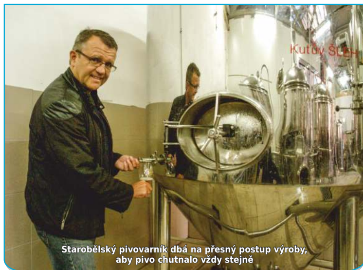
Starobělský pivovarník dbá na přesný postup výroby, aby pivo chutnalo vždy stejně

suroviny, které jsou k dostání. Mají vlastní sladovnu i výrobu kvasnic. A tak vše potřebné kupujeme z Humpolce.