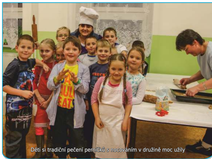
Děti si tradiční pečení perníčků s nocováním v družině moc užily