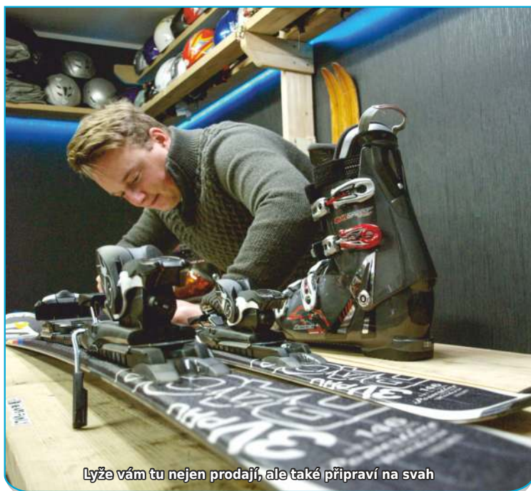
Lyže vám tu nejen prodají, ale také připraví na svah