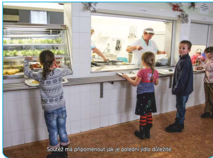
Soutěž má připomenout jak je polední jídlo důležité

Školní jídelna žije novým dobrodružstvím: děti soutěží, ve které třídě jsou nejméně strážníci. Každé kompletně snědené obědové menu znamená bod do společné třídní tabulky, na konci měsíce se skóre sčítá. Ale vítězství v daném měsíci je jen dílčím úspěchem a povzbuzením do dalšího kola - hra potrvá až do konce školního roku, kdy kuchařky vyhlásí celkového vítěze.