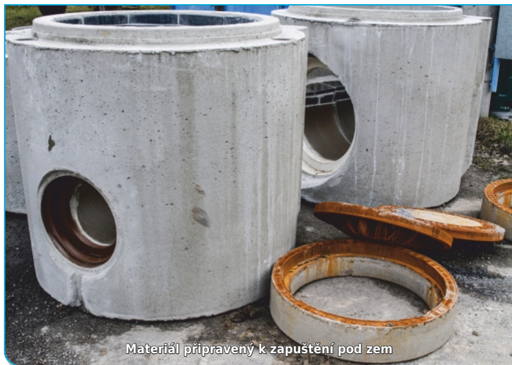
Materiál připravený k zapuštění pod zem

Právě jeho kancelář dostává od stavební firmy aktualizované informace. „Kdyby se někdo chtěl na něco dalšího zeptat, může se za námi v úředních hodinách zastavit,“ zve Blahut.