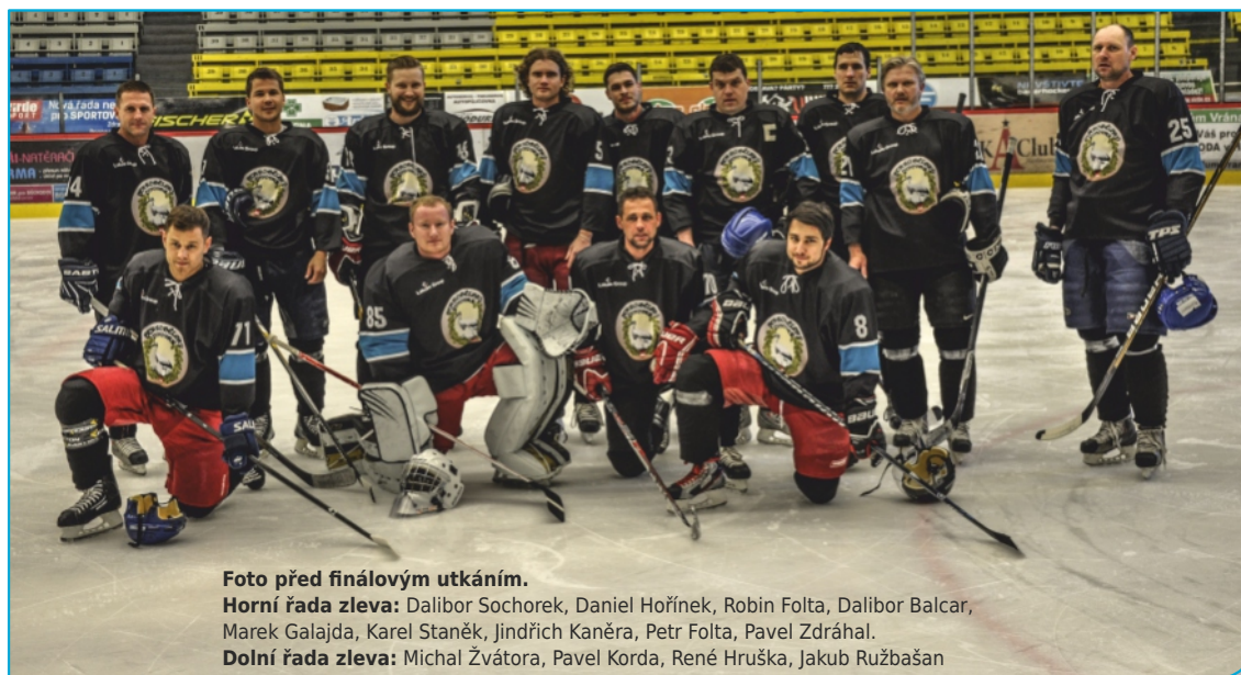
Foto před finálovým utkáním.