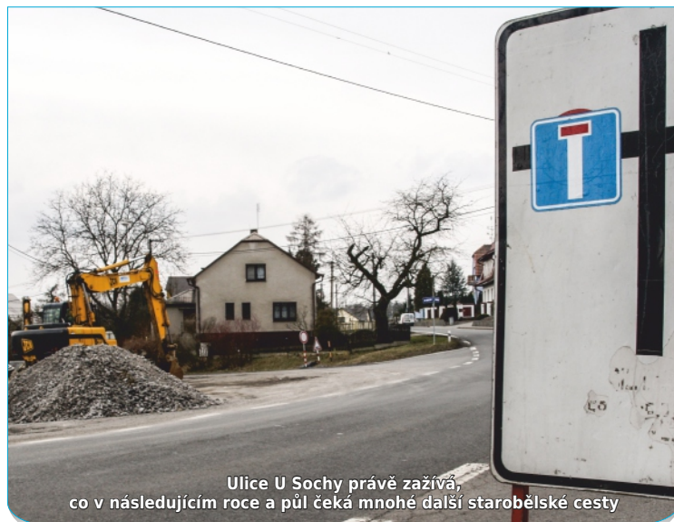
Ulice U Sochy právě začíná, co v následujícím roce a půl čeká mnohé další starobělské cesty