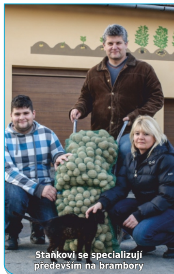
Staňkovi se specializují především na brambory

Urgentní telefonní číslo Městské policie Hrabůvka 596 712 293, také lze volat 156 (obě telefonní čísla fungují 24 hodin denně)