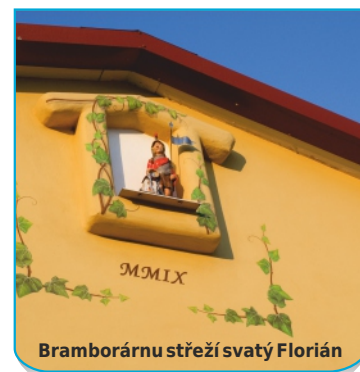
Bramborárnu střeží svatý Florián