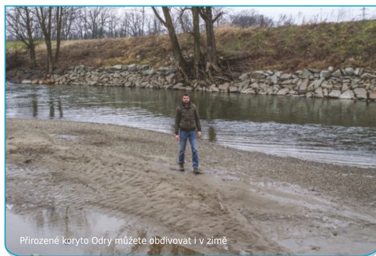
Přirozené koryto Odry můžete obdivovat i v zimě

Člověk by se měl k přírodě chovat s respektem a pokorou, neměl by vyrazit s pilou a sekerou nebo ulamovat větve. To platí v přísnější podobě i v jádrových územích CHKO, jako je národní přírodní rezervace Polanská niva, kde jsou rybníky. Na nich se vyskytují vodní ptáci, kteří zde hnízdí. A právě je intenzivnější pohyb může rušit. Ale to neznamená, že tamtudy