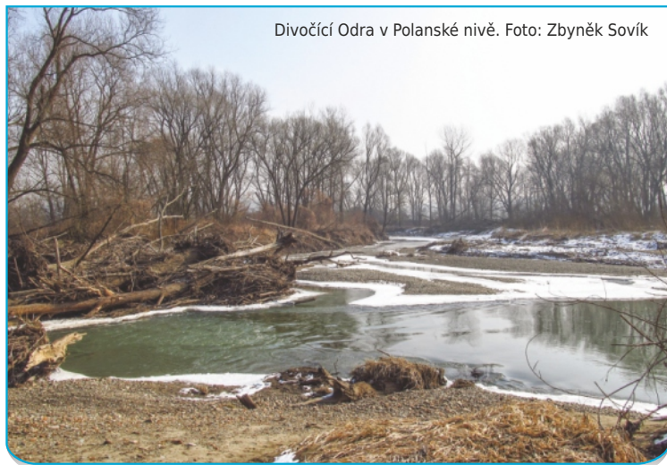
Divočící Odra v Polanské nivě.

A pak je v Poodří nádherný lužní les, jmenuje se Blücherův, je to starý dubový les, kterého si ceníme. Byť uměle vysázený. Příliš se v něm nezasahuje, minimálně se tam těží.