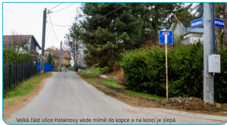
Velká část ulice Holainovy vede mírně do kopce a na konci je slepá

Urgentní telefonní číslo Městské policie Hrabůvka 596 712 293, také lze volat 156 (obě telefonní čísla fungují 24 hodin denně)