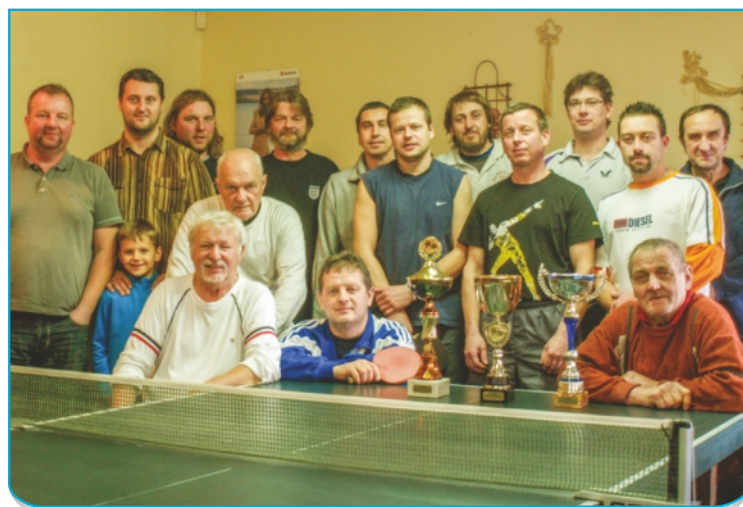
Než se z kamarádů stali soupeři, společně se vyfotili