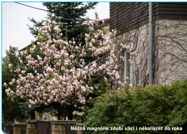
Něžná magnolie zdobí ulici i několikrát do roka