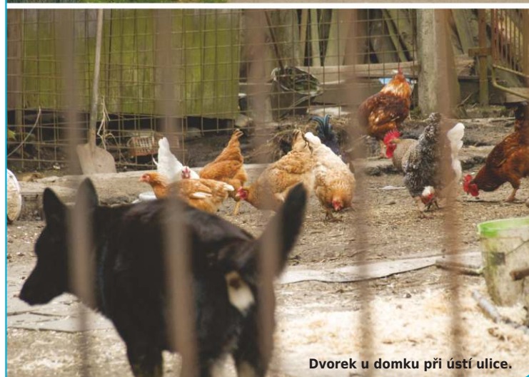
Dvorek u domku při ústí ulice.