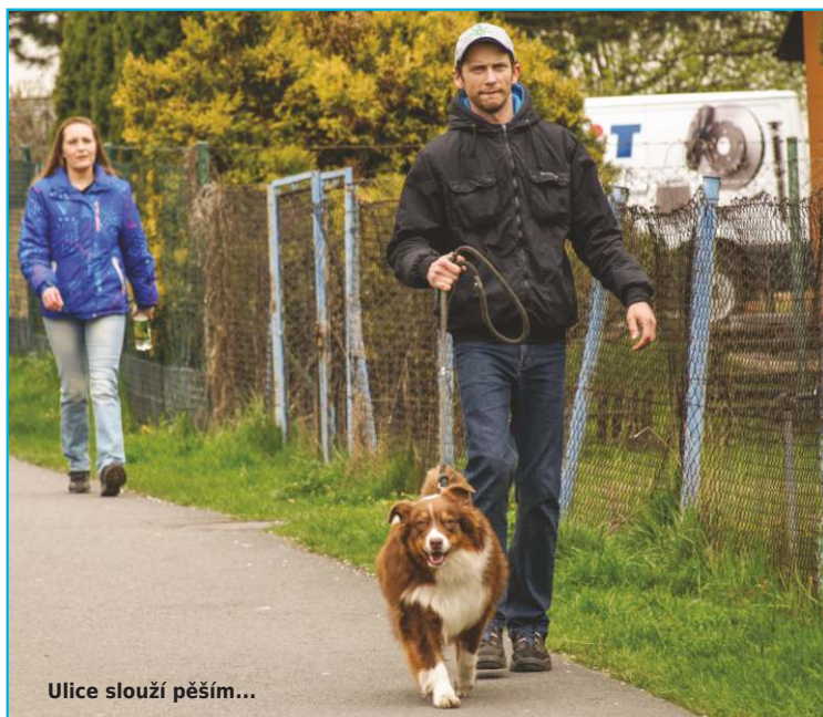
Ulice slouží pěším...