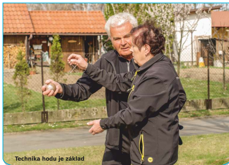
Technika hodů je základ

Khřišti pověsili pravidla, opřeli hrablo k udržování rovné hrací plochy a přidali stůl se dvěma lavicemi - aby si hráči měli kde odpočinout a počkat, než na ně přijde řada. Hrací plocha je veřejně přístupná, zahrát si může, kdokoli má chuť. „Hrací koule si můžete donést své, kdo nemá, může si půjčit u správce na vedlejším školním hřišti - oproti záloze, která bude symbolická a kterou pak hráči dostanou zpět, když