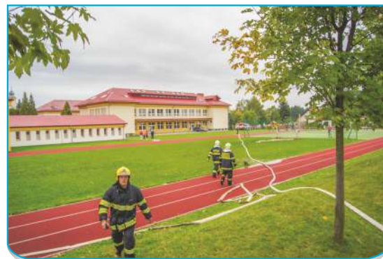
4. úsek vedení skrz hřiště do cisterny Tatra 815-7 CAS-30-S3R JSDH Zábřeh