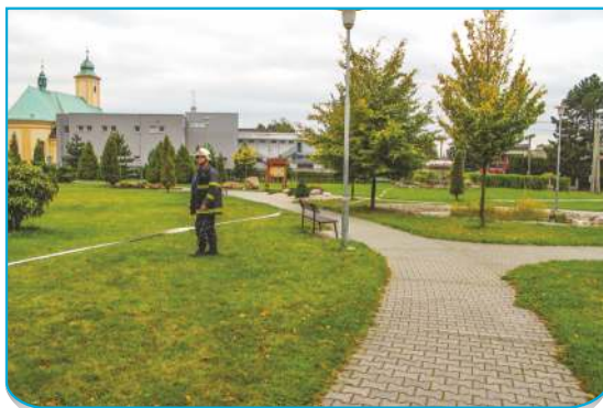
3. úsek vedení skrz park k PS12 JSDH Zábřeh