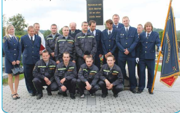
Členové SDH Stará Bělá položení věnce zesnulým hasičům

Urgentní telefonní číslo Městské policie Hrabůvka 596 712 293, také lze volat 156 (obě telefonní čísla fungují 24 hodin denně)