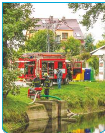
Zahájení čerpání vody na 1. úseku vedení