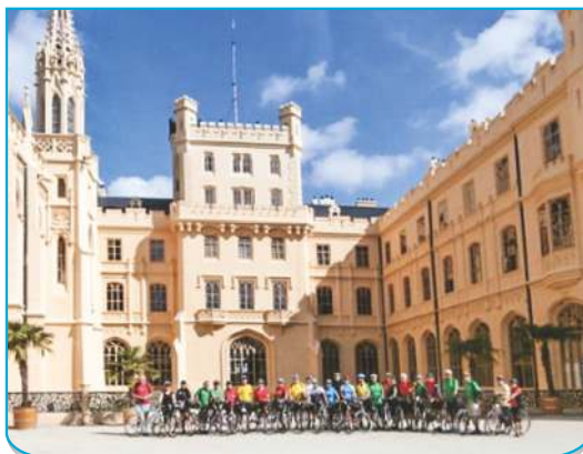
Všichni v Lednici