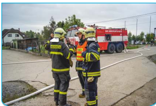
Vedení k Tatrě 815 CAS32 JSDH Stará Bělá a k 3. proudu