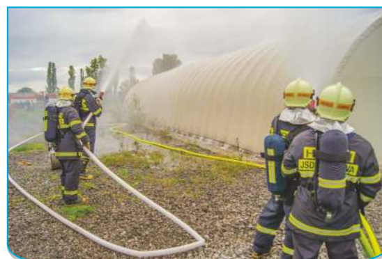
1. a 2. proud JSDH Stará Bělá