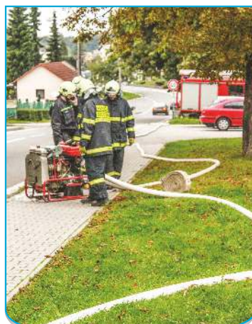
2. PS12 v pořadí - JSDH Hrabová