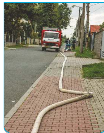
2. úsek vedení k PS12 JSDH Proskovice