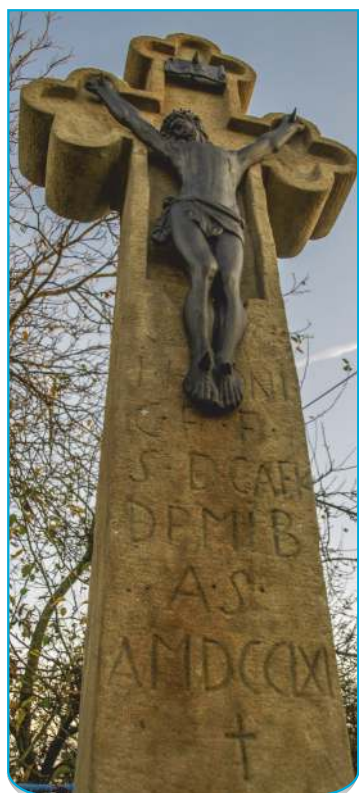
Kříž na křižovatce U Matěje má po velké opravě.

Odborník mu poskytl první pomoc, vrátil zesláblému kameni pevnost, stabilitu, svěží vzhled. A při restaurátorské péči přišel i na pár milých tajemství, která kámen skrýval.