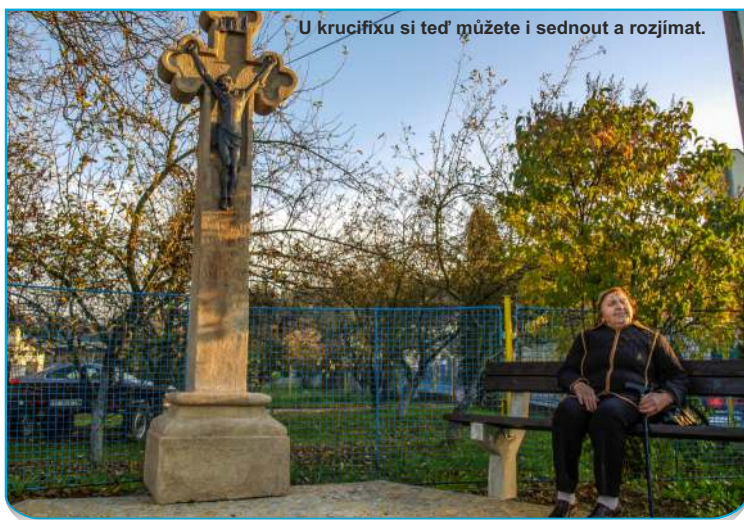
U krucifixu si teď můžete i sednout a rozjímat.