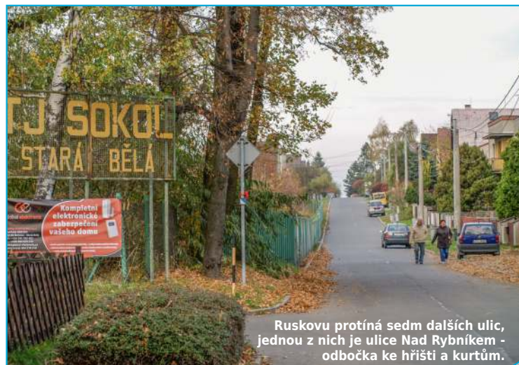
Ruskovu protíná sedm dalších ulic, jednou z nich je ulice Nad Rybníkem - odbočka ke hřišti a kurtům.