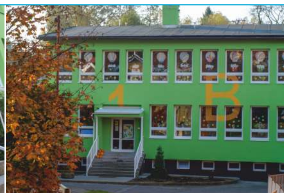
Školka je zateplená, má novou fasádu, okna i vstupní dveře.

Urgentní telefonní číslo Městské policie Hrabůvka 596 712 293, také lze volat 156 (obě telefonní čísla fungují 24 hodin denně)