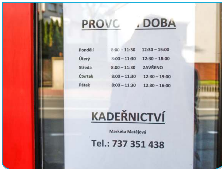
Je možno se objednat nebo přijít bez ohlášení.

Původem je z Vietnamu, v Česku žije už 19 let. „Přiletěl jsem tady v 19 letech za otcem, on pracoval v Karlových Varech v porcelánce. Chtěl jsem mu pomáhat. Lákalo mě dobrodružství, cestování. Po Varech jsem žil sedm let v Mikulově a teď už jsem deset roků v Ostravě. Bydlím