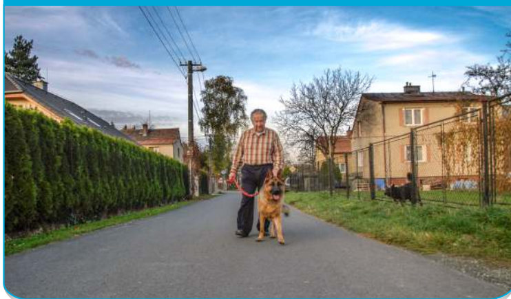
Ruskovu hojně využívají cyklisté i pěší - včetně pejskařů.

Dlouhá, rovná, hustě osídlená a oblíbená u pěších na procházce, u pejskařů i cyklistů, to je Ruskova ulice ve Staré Bělé. Vede zástavbou rodinných domků, souběžně s Junáčkou. Začíná za Hruškou a končí