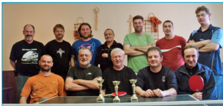
Zahrát si tentokrát přišli pouze pánové. Narozdíl od předešlých akcí.