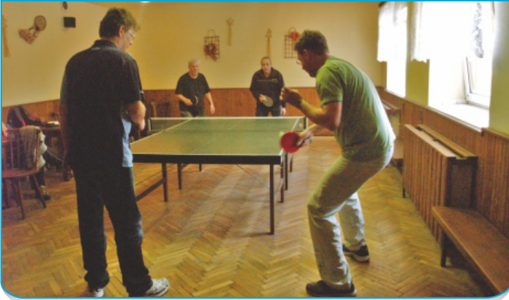
Hrálo se pro potěšení, ale tempo odpočinkové nebylo.