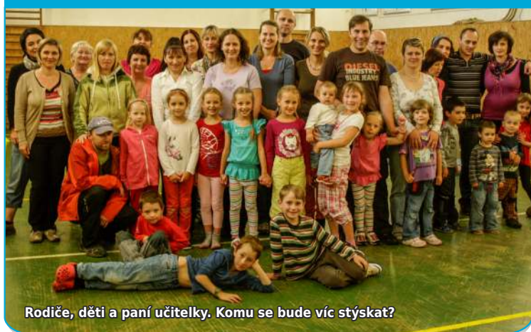
Rodiče, děti a paní učitelky. Komu se bude víc stýskat?

Milé paní učitelky ze školky, děkujeme vám, že jste se tak hezky a trpělivě několik let staraly o naše děti. Víme, že občas neposedí, že se rády