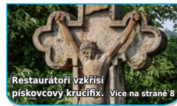
Restaurátoři vzkřísí pískovcový křucifix. Více na straně 8