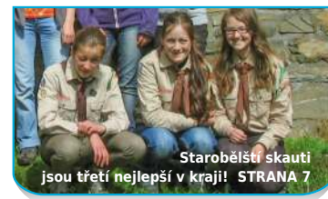
Starobělská skauti jsou třetí nejlepší v kraji! STRANA 7