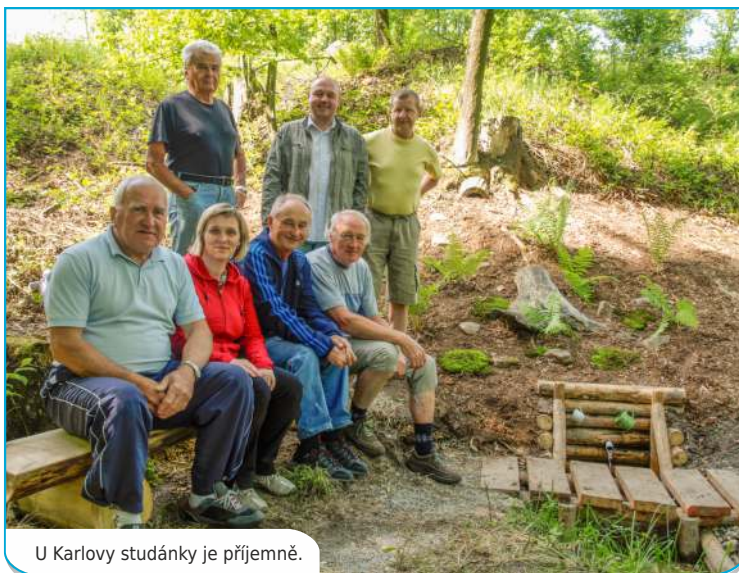
U Karlovy studánky je příjemně.