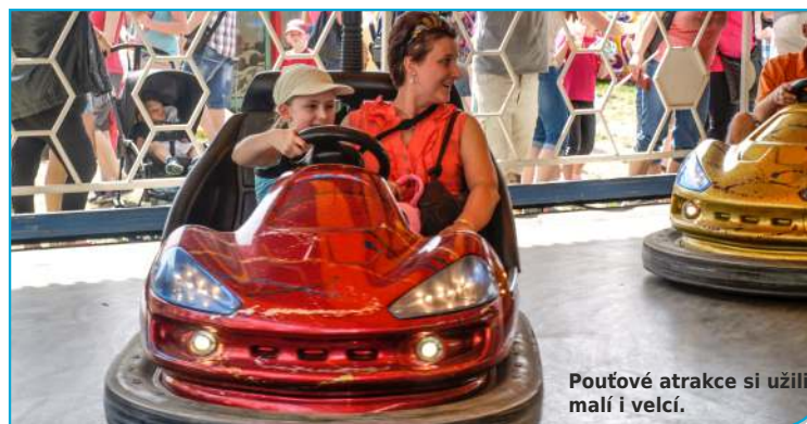
Pouťové atrakce si užili malí i velcí.