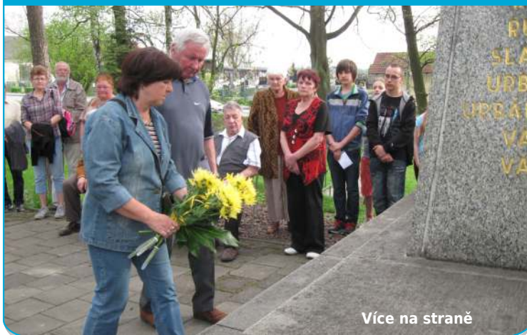
Více na straně