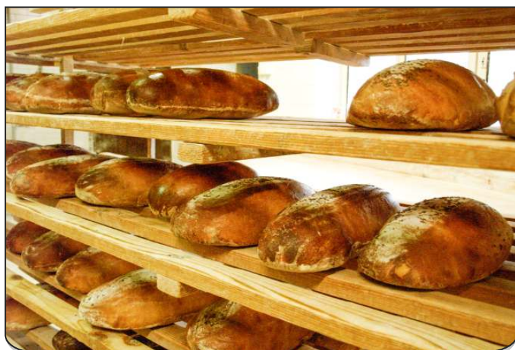
Ve Starobělské domácí pekárně dělají tři druhy kvasového chleba bez aditiv, všechny zpracované ručně a pečené ve zděné parní peci.

vodů vypadne. Pak šéfová uplete vánočku, naplní koláč, pomůže dělat chleba. Nedělá jí to žádnou potíž – když se s manželem před dvaadvaceti lety rozhodli, že si pořídí pekárnu, museli se řemeslo naučit od píky. „Začínali jsme jako nájemci v pekárně na Slezské, kterou jsme si pak chtěli koupit. Bohužel to nevyšlo. S nebožtíkem panem Poláškem jsme se znali už tehdy, dokonce jsme pekli totožný pšeničný chleba. Když zemřel, oslovila nás jeho rodina, zda