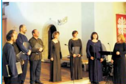
CANTICUM NOVUM komorní vokální sbor