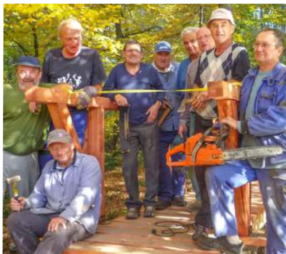
Tvůrčí tým a jeho dílo