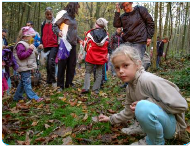
Děti po cestě sbíraly žaludy a kaštiny - zanesly je pak zvířatům do krmelce

U studánky děti pátraly po pokladu - a našly perníkové klíče, kterými za doprovodu říkanky zamkly les, to aby se mu letos v zimě dobře odpočívalo. (joh)