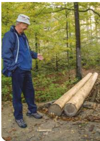
Základ nových můstků tvoří pevné smrkové klády