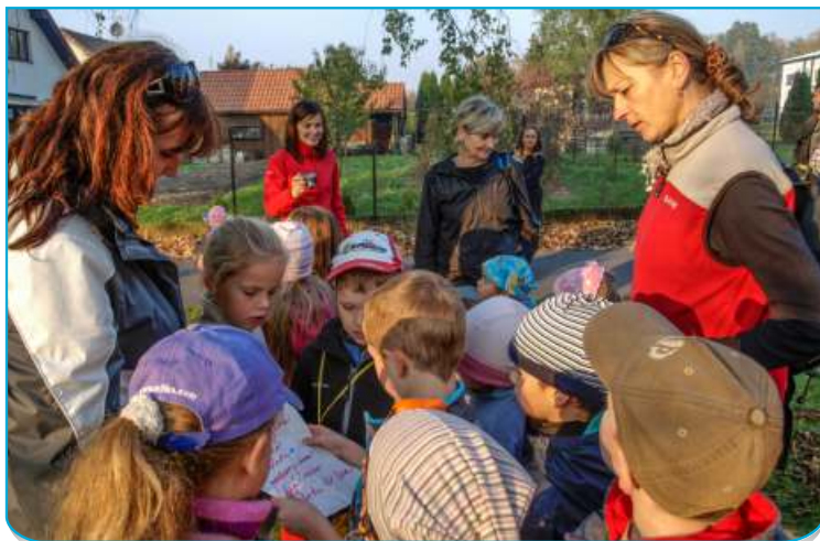
Děti plnily cestou k lesu přírodovědné úkoly