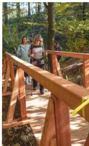
... a první chodci

Adamusův rybník v Palessku je znovu dobře dostupný. Parta starobělských penzistů u něj postavila dvě nové lávky, které pomohou pěším, aby se pohodlně dostali přes srázovitý terén až na hráz.