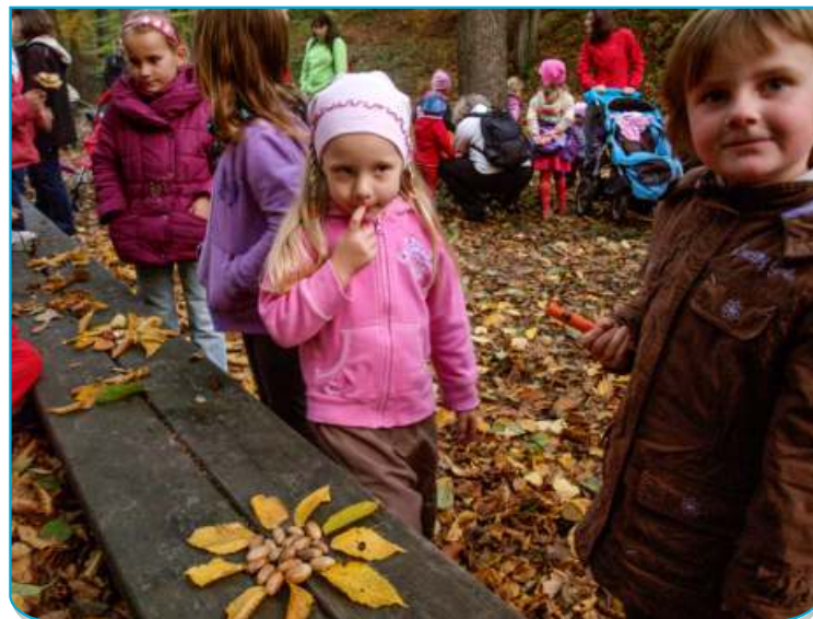
Lavičku u bělské studánky děti podzimně ozdobily