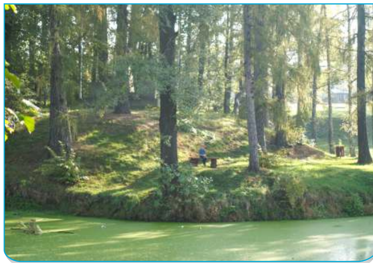
Nejnámější starobělská pověst se váže k Zámčiskám

Podrobnosti hledal v ostravském archivu, na faře, ale třeba také v Kunčicích pod Ondřejníkem, kam