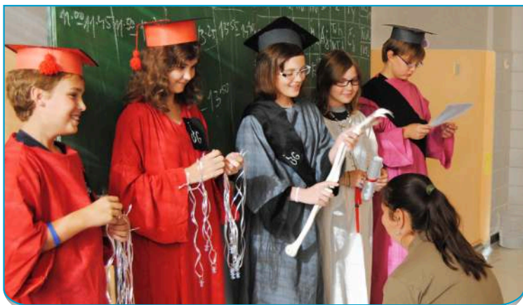
Pasování primánů na studenty Biskupského gymnázia

Jak již vyplývá z názvu naší školy, zřizovatelem je Ostravsko-opavské biskupství a na rozdíl od jiných gymnázií se naši studenti mimo standardních předmětů učí také žít duchovní hodnoty, studenty vedeme ke křesťanským hodnotám a zodpovědnému přístupu k životu, což vyplývá i ze samotného motto naší školy: „Po ovoci je poznáte...“. Tento nadstandard kromě jiného přispívá k tomu, že se děti na naší škole cítí bezpečně a mají mezi sebou i s pedagogy přátelské vztahy.