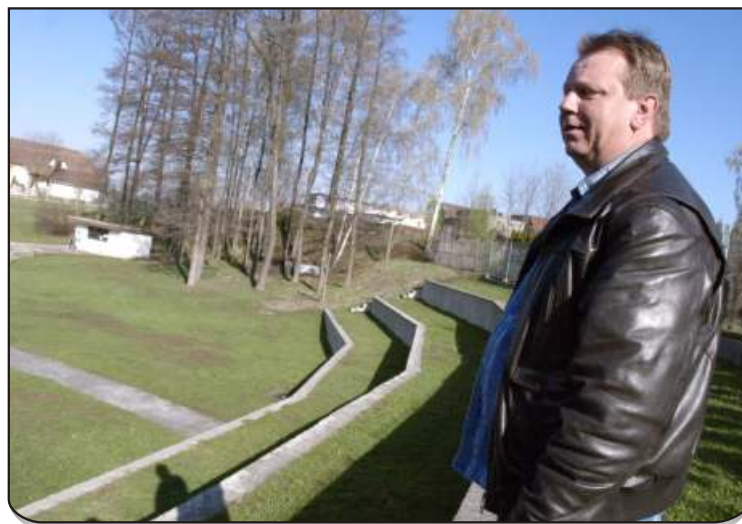
V plánu je hřiště na pétangue i plážový volejbal

Třeba tím, že oproti loňsku výrazně snížíme vstupné. Stávající ceny byly pro rodinu s dětmi neúnosné. Vloni stála celodenní dospělá vstupenka 75 korun. Já chci, aby letos nestála víc než 55. Od dvou odpoledne jen 35, od čtyř 20 korun a po šesté večer aby se tu dalo jít jen za desetikorunu. Děti do pěti let budou mít stále vstup zdarma a pro děti mezi pěti a patnácti lety se celodenní vstup zlevní. To musí zabrat.