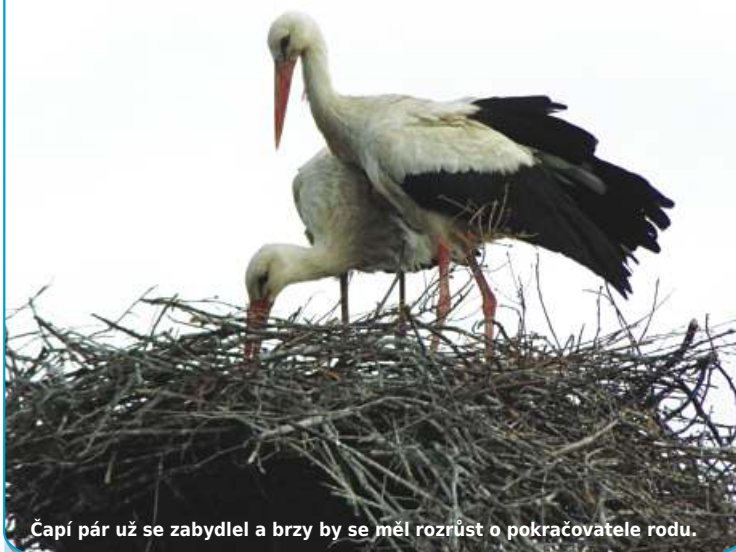
Čapí pár už se zabydlel a brzy by se měl rozrůst o pokračovatele rodu.

Vrátili se z jihu, nové základy pro hnízdo ohodnotili jako přijatelné a okamžitě se začali zabydlovat. Starobělští čápi neměli problém s novinkou, která je doma, na sloupu na křižovatce U Matěje, čekala - namísto hnízda, které na podzim opustili, se tam tyčila zbrusu nová železná konstrukce s výpletem. Pevnější, stabilnější, ale prázdná - čápi si ji museli dostlat a dovyplest tak, aby se cítili skutečně jako v hnízdě. Neměli s tím problém a lidem, kteří jim nový byt připravovali, se výrazně ulevilo.