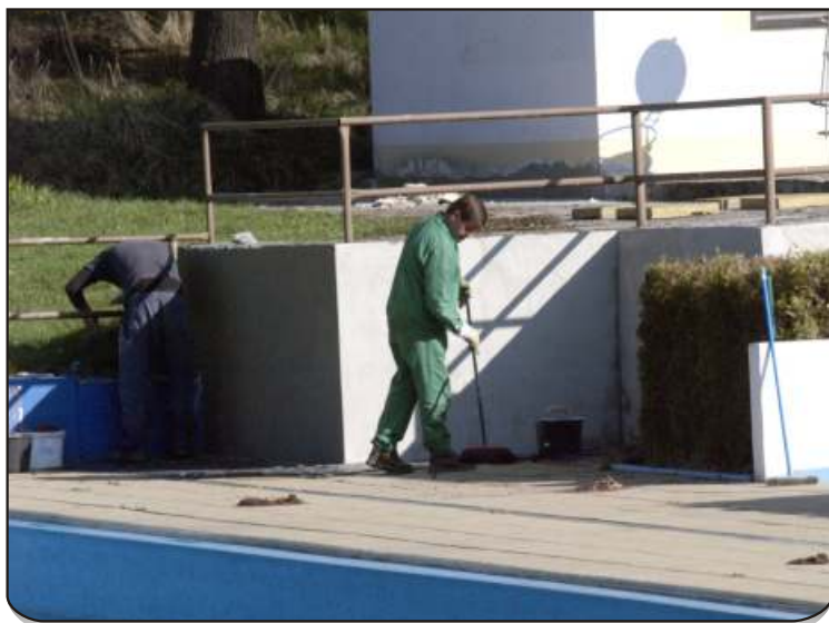
Areál potřebuje předsezónní opravy