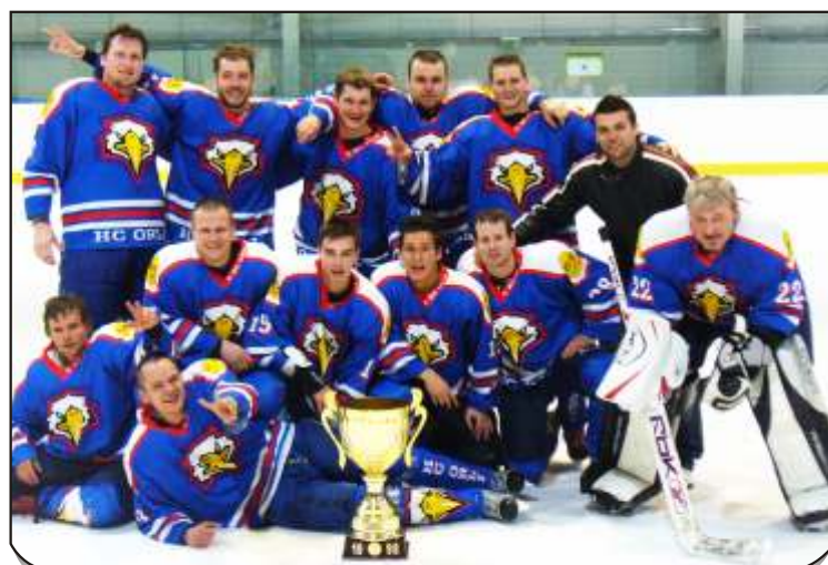
Hráči HC Orli Stará Bělá děkují všem sponzorům, přátelům a rodinným příslušníkům za podporu a věří v uchování přízně i v sezóně 2010/2011.